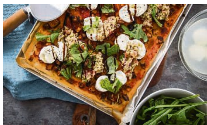
Wie ein Gemälde: Pizza vom Blech mit Süßkartoffel, Büffelmozzarella, Guacamole, Rucola, Balsamico.

dizinern, Anästhesisten sowie Neurologen immer zur Verfügung steht, um sich fachübergreifend auszutauschen. „Wir sind froh darüber, dass wir durch die neue Zertifizierung die Versorgung der Menschen vor Ort noch weiter verbessern können. Sie spornt uns an, unsere Standards stetig zu erhöhen und weiter an unseren Leistungen zu arbeiten“, sind sich die drei Ärzte einig.