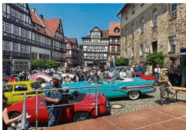
Liebhaber und Besitzer von Oldtimern sind eingeladen, sich an Pfingsten in Spangenberg zu treffen.

Creole“ und „The Silverballs“, die in einem einzigartigen Fachwerk-Ambiente für Stimmung sorgen werden.