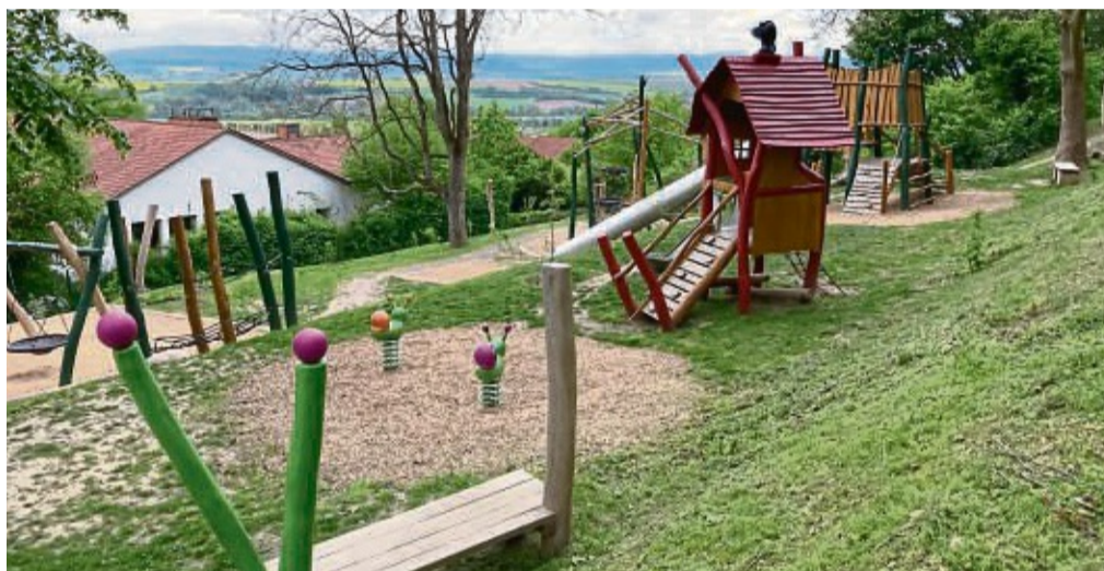
Eröffnet wurde der Waldspielplatz in Homberg bereits im Oktober 2023.

Der Fertigstellung waren Planungsarbeiten vorausgegangen, die sich coronabedingt länger hinzogen als geplant. Maßgeblich für die Ergebnisse der Planungen war unter anderem, dass bei der Gestaltung des Ensembles der Hanglage und dem Waldcharakter der Umgebung entsprochen wurde. Außerdem wurden Kinder aus Kindergärten und Grundschulen