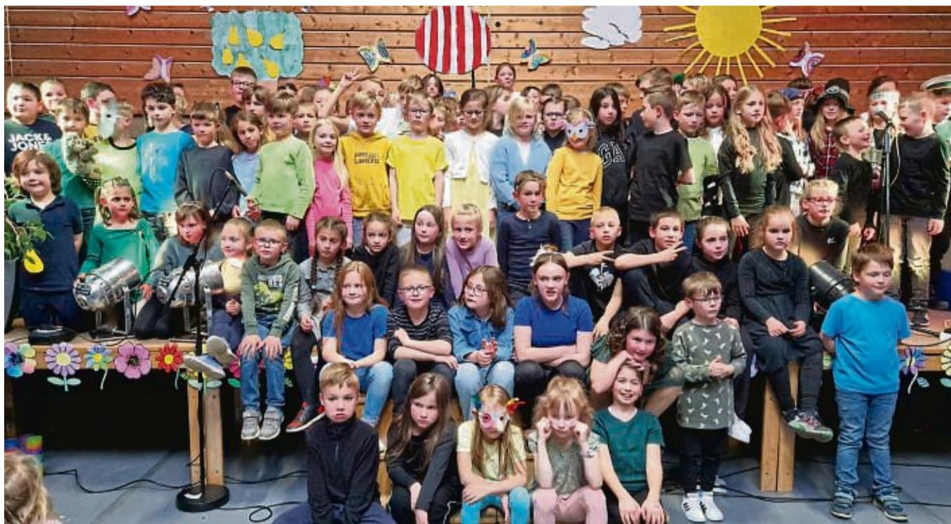
Ein musikalischer Gruß an den Frühling: Die Grundschule am Kirschberg hatte zum Musikabend nach Neuenbrunslar eingeladen.

Die Musikschule Schwalm-Eder-Nord hatte mit den teilnehmenden Kindern Beiträge vorbereitet. So verzauberten unter anderem die Klänge von „Harry Potter“ und die