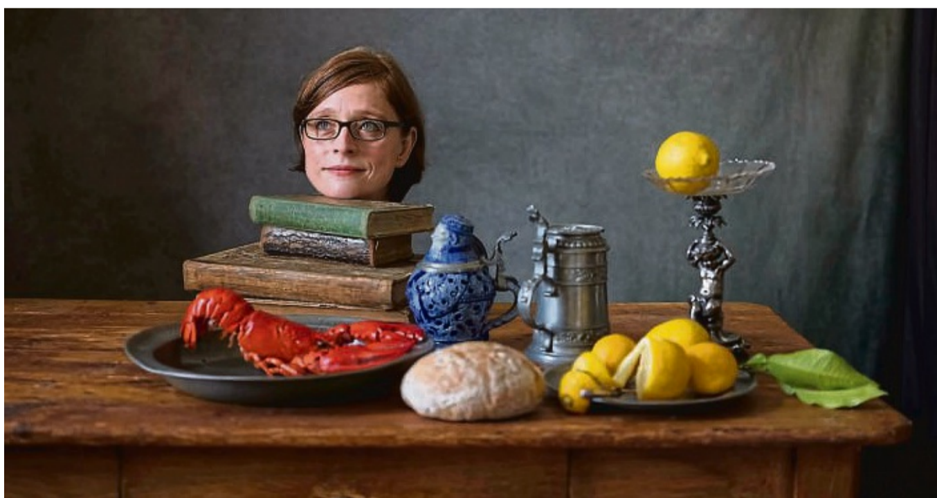
„Still(e)leben(dig)“: Eine Ausstellung mit Werken der Fotokünstlerin Elizabeth Joan Clarke (im Bild ein Selfie) wird am Freitag in Bad Wildungen eröffnet.

Am Ende steht die Fotografie: Sie ist für Clarke das ideale Medium, um die Botschaften ihrer symbolträchtigen Stilleben zu bündeln und mit anderen zu teilen. Beständigkeit trifft auf Vergänglichkeit, nichts ist dem Zufall überlassen oder wurde nachträglich ergänzt. Durch ein 110 Jahre altes Sprossenfenster fällt das Licht natürlich auf die im Studio geschaffenen Kompositionen. In ihnen spiegeln sich die Jahres- und Tageszeiten ebenso wie das Wetter, die Zeit ist ihre ständige Begleiterin, der Fantasie sind keine Grenzen gesetzt.