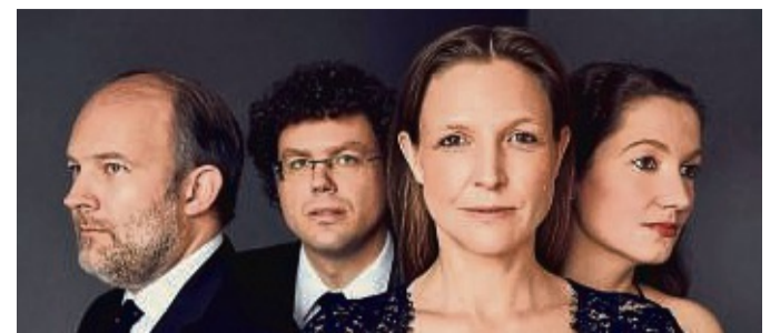
Das Amaryllis Quartett gestaltet am Sonntag, 19. Mai, um 19.30 Uhr das erste Schlosskonzert der Saison im Steinernen Saal des Residenzschlosses.