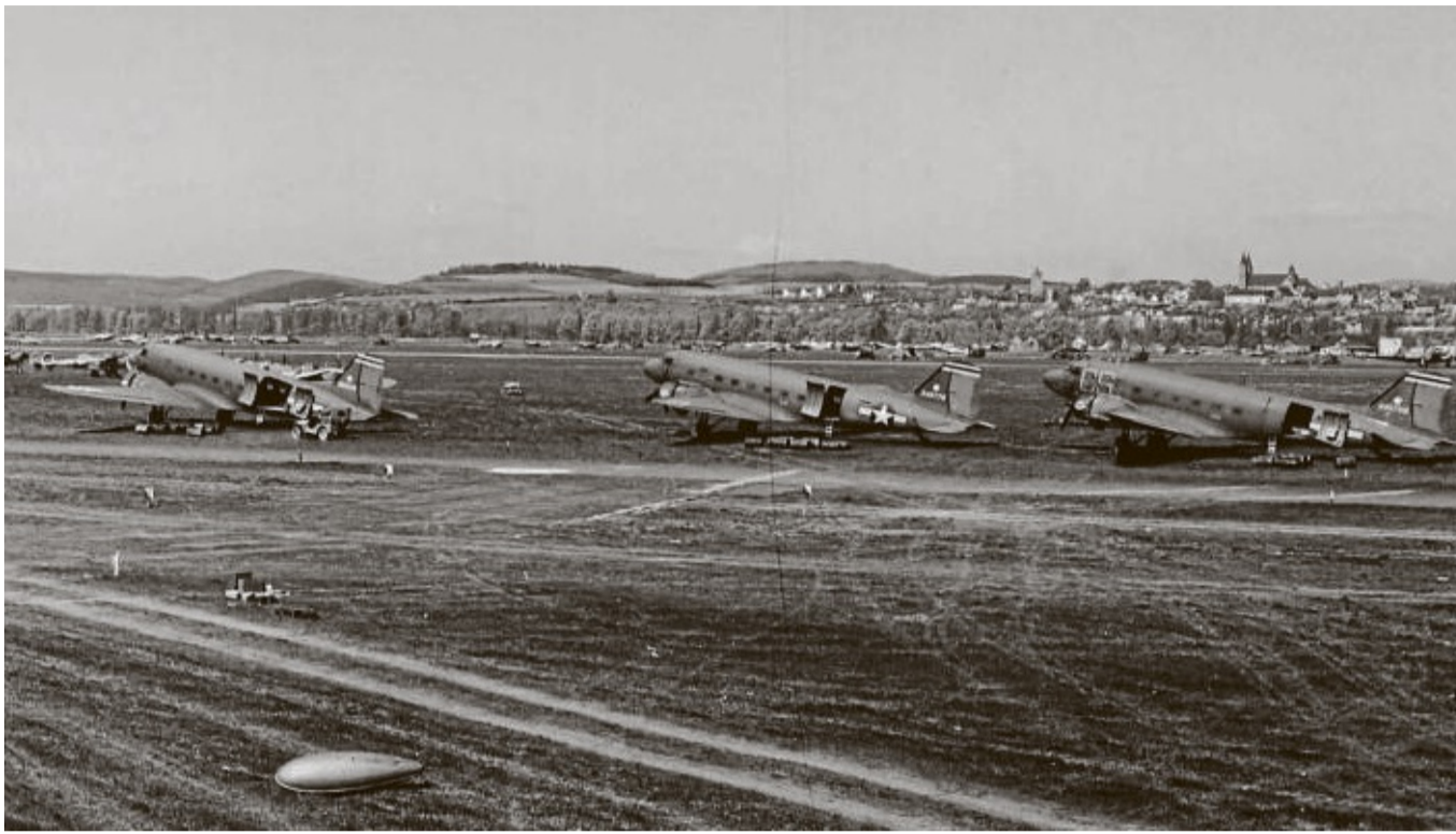
Militärtransportflugzeuge vom Typ Douglas C-47 der US-Armee am 20. April 1945: Drei Jahre später war dieser Flugzeugtyp in großer Stückzahl bei der Blockade von West-Berlin am nordhessischen Himmel im Einsatz.

Ein ungeheures Unterfangen unter den damaligen Umständen begann und wurde im Verlauf der Brücke derart verfeinert, dass im Frühjahr 1949 alle 90 Sekunden ein Transportflug auf einem der fünf West-Berliner Flughäfen landete. Rund 2,3 Millionen Tonnen Lebensmittel, Kohle und Treibstoff gelangten so während der Blockade in die eingeschlossene Stadt.