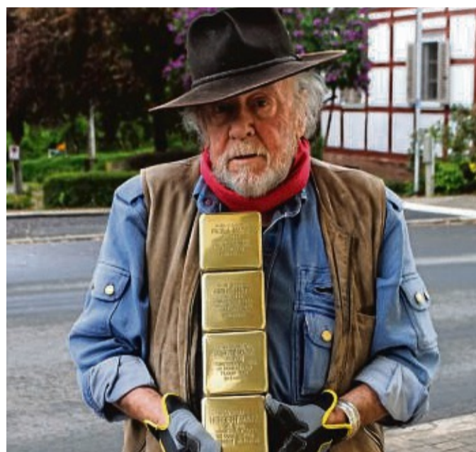
Der Künstler Gunter Demnig mit den vier Stolpersteinen für die Familie Katz in der Hauptstraße 1.

Bereits im Jahr 2012 hatte er im Ortsteil Bischhausen, 2017 im Ortsteil Gilsa und 2018 im Ortsteil Walters-