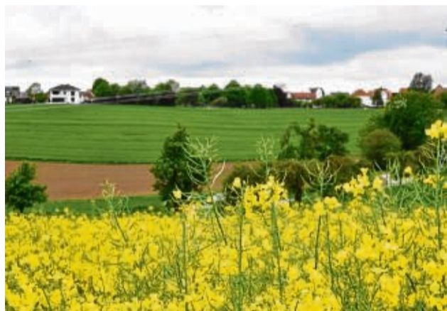
Der Ort ist umsäumt von Wäldern und Feldern in idyllischer Landschaft.

Am Samstag, 22. Juni, steigt ab 18 Uhr die Dorfjubiläumsparty mit der Band „Nightlife“. Der Sonntag, 23. Juni, startet um 10 Uhr mit einem Zeltgottesdienst, der vom Posaunenchor Wollrode begleitet wird. Anschließend sind die Albshäuser zu einem Familientag mit Livemusik und Kinderspielen eingeladen.