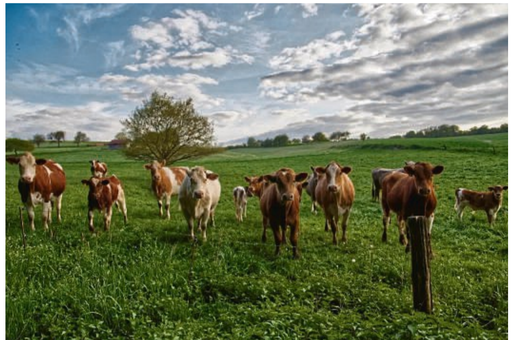
Die Stärkung der Weidehaltung im Knüll ist eines der Themen, denen sich der Verein zur Regionalentwicklung widmen möchte.