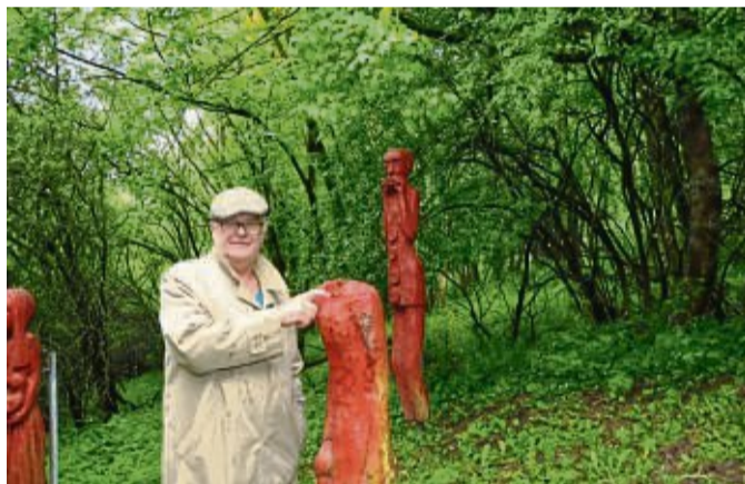
Der „alte Mann“ hat seinen Kopf verloren: Ein weiterer Verfall soll nun verhindert werden.