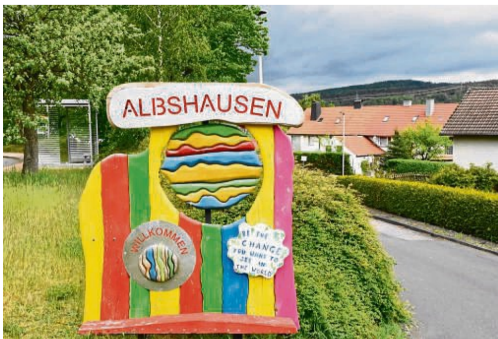
Albshausen liegt auf dem Südwesthang der Söhre, auf der sich Teile des Geo-Naturparks Frau-Holle-Land erstrecken.

Albshausen ist ein Kleinod unter den Ortsteilen Guxhagens und fast 300 Jahre älter als die Kerngemeinde: Von Freitag, 21. Juni bis Sonntag, 23. Juni, feiern Ober- und Unterdorf gemeinsam das 950-jährige Bestehen Albshausens. Den Auftakt bildet der Nachmittag der Generationen, der um 15.30 Uhr im Festzelt beginnt.