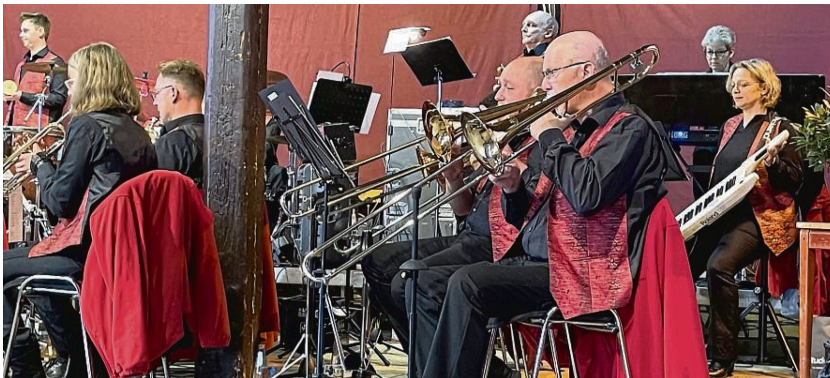
Mit Spielfreude präsentierten die Musiker des Musikexpress Hemeln die musikalische Bandbreite ihres Könnens.