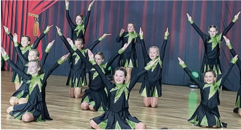
Die Sternchen Garde des Tuspo erntete nach einem gelungenen Auftritt großen Applaus.

„Bühne frei“ in Gimte mit 250 Teilnehmern aus Altkreis Münden und Nordhessen