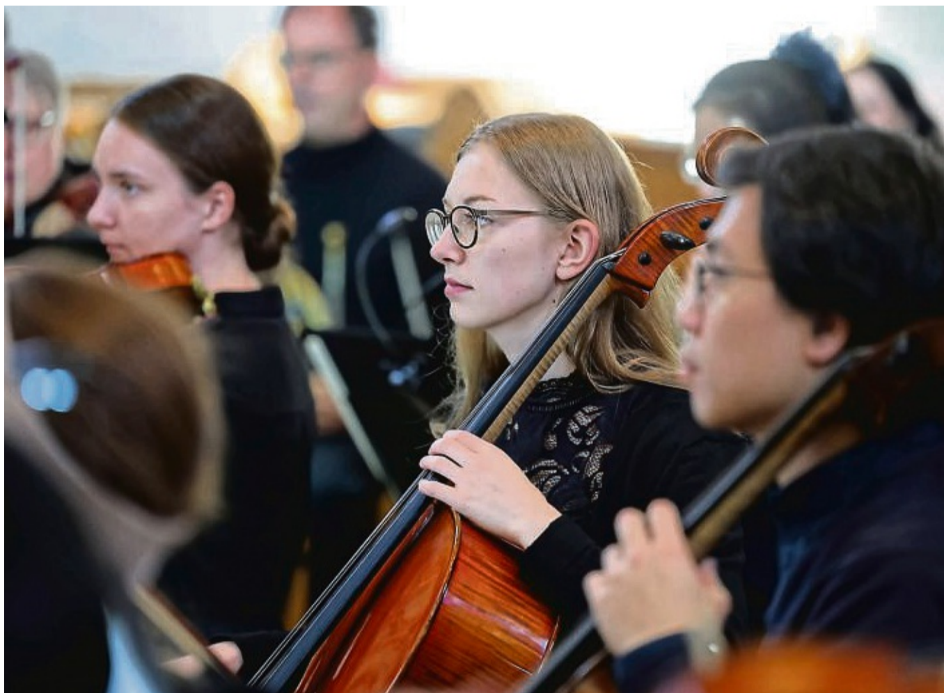
Die Musikerinnen und Musiker der Musikakademie der Stadt Kassel „Louis Spohr“ sind zu Gast in Hessisch Lichtenau.