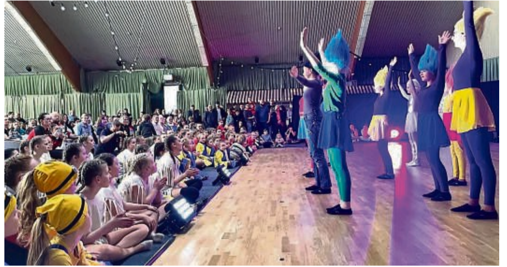
Als Trolle in grellen Farben trat die Gastgruppe aus Escherode auf.