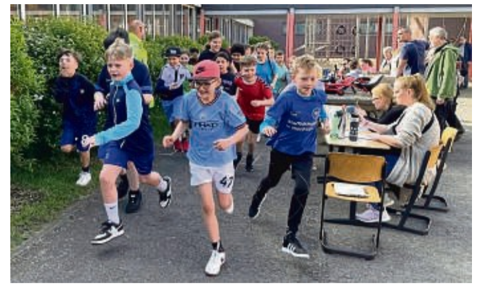
Mit Spaß und ausgelassener Stimmung starteten die Kinder der Grundschule Gimte den Sponsorenlauf.