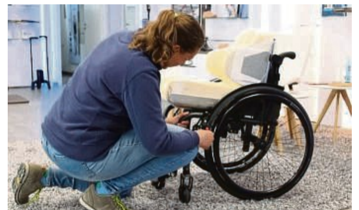
„Egal wie herausfordernd, wir kümmern uns um Ihre Anliegen“, so das Credo des Sanitätshauses Friedhoff.

ganz normal mit den gewohnten Hausbesuchen.“