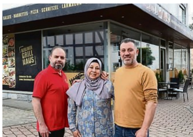
Das Team im neuen Berliner Grill Haus verwöhnt seine Gäste mit leckeren Spezialitäten und Speisen.

Der Familienbetrieb schafft mit dem neuen „Berliner Grill Haus“ mehr Restaurantambiente und gemütliche Plätze für rund 40 Gäste und bietet Parkmöglichkeiten direkt vor