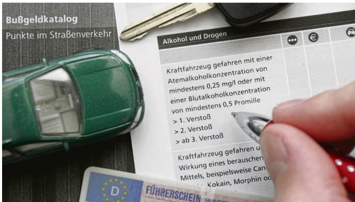
Die Zahl der Verkehrsanzeigen ist steigt deutlich angestiegen: Das Überschreiten der erlaubten Geschwindigkeit ist nach wie vor der weit überwiegende Tatbestand.

„Uns als Landesverwaltung kommt es nämlich nicht in erster Linie darauf an, Jahr für Jahr neue Einnahmere-