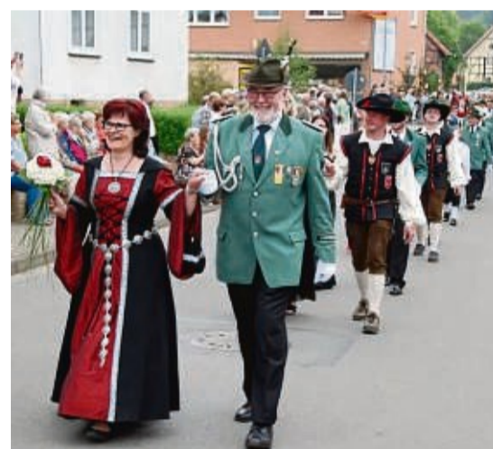
Der festliche Schützenball ist das Ziel der prächtigen Polonaise, zu der die Schützen ihre Damen führen.