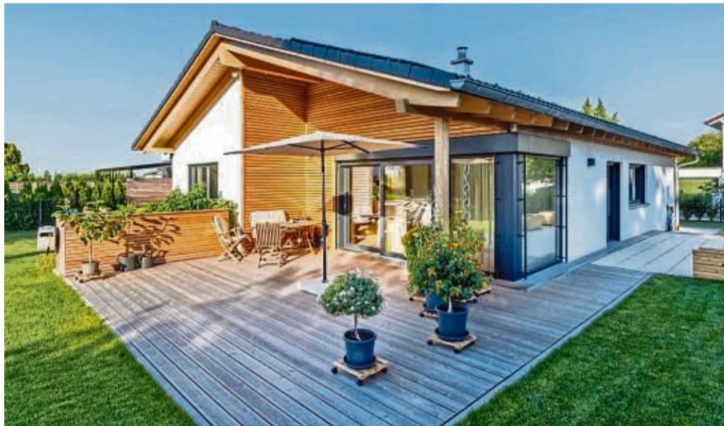
Ein kleines Haus mit Garten steht weiterhin bei Familien, Paaren und auch Singles auf der Wunschliste. Höhere Kosten werden nun öfter durch kleinere Wohnflächen kompensiert.

Die Hersteller von Fertighäusern reagieren darauf mit vorgeplanten Hausentwürfen mit kleinerer Wohnfläche, aber mit großem Wohnkomfort und mit einer Festpreisgarantie. „Die Material- und Baukosten für so ein kleineres und bereits vorgeplantes Haus fallen gerin-