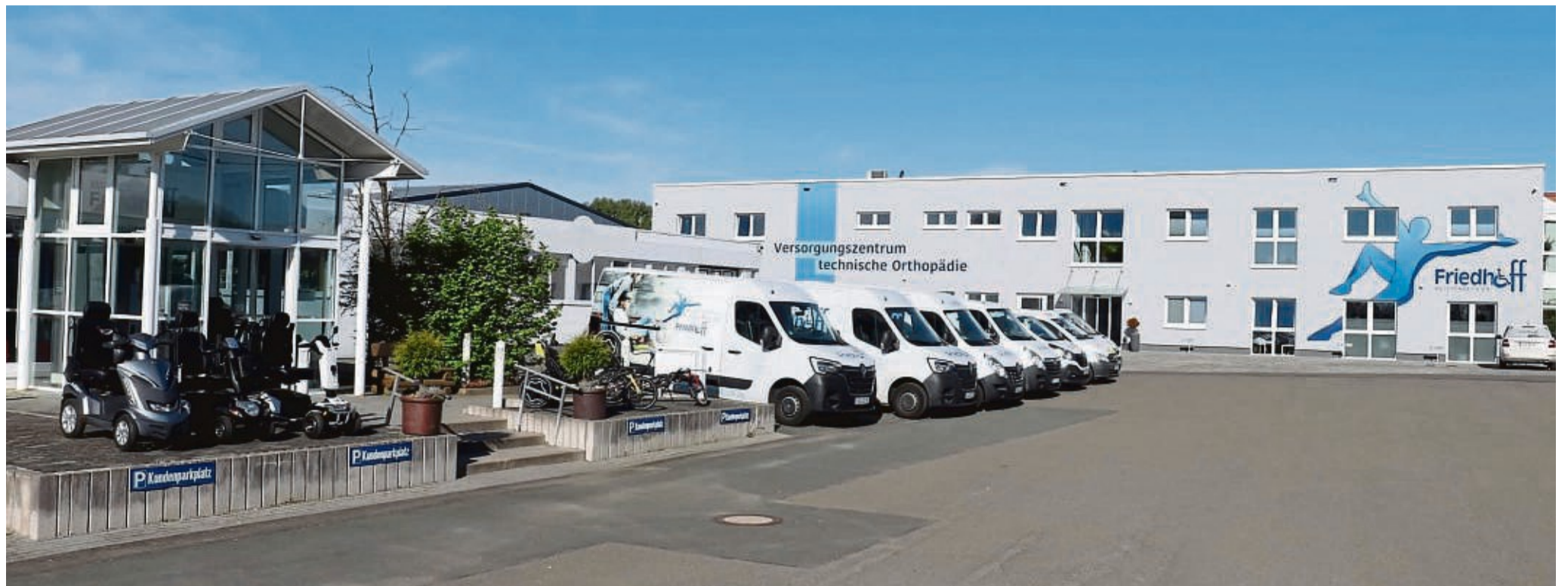
Das Sanitätshaus Friedhoff in der Briloner Landstraße 83 in Korbach.

FOTOS: SANITÄTSHAUS FRIEDHOFF, MARCUS ALTHAUS