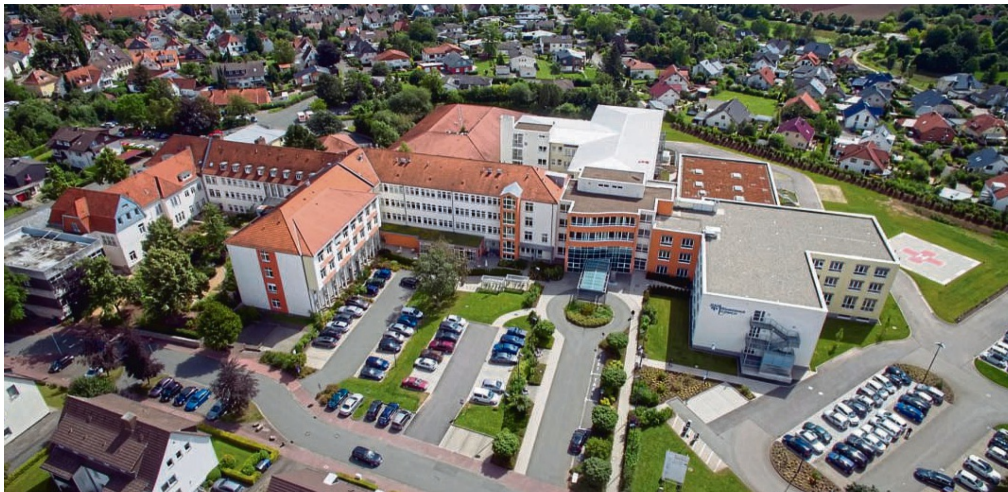
Das „stabil aufgestellte“ und personell gewichtigere Stadtkrankenhaus in Korbach soll mit der seit Jahren im finanziellen Minus befindlichen Kreisklinik in Frankenberg zu einem gemeinsamen Krankenhaus an zwei Standorten zusammengeschlossen werden, so die Pläne von Kreis und Stadt.