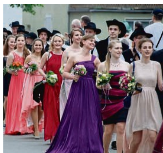
Elegant gekleidete Paare bei der Polonaise zum Twister Freischießen im Jahr 2016.