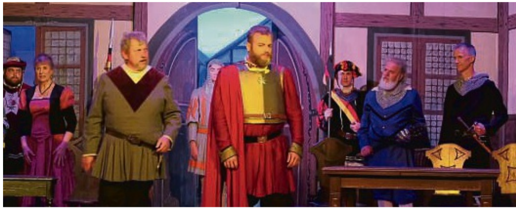
Szenenfoto aus der Probe für das Festspiel „Treue um Treue“ in der Stadthalle Mengeringhausen. Die beiden Premieren sind am 25. Mai und 1. Juni.