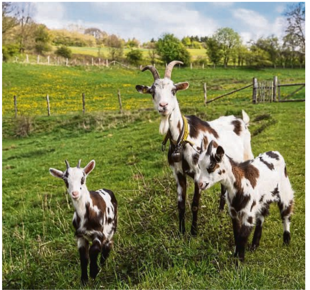
Die Arche-Region bei Frankenu soll mit bezahltem Personal künftig besser vermarktet werden. Auf dem Bild sind Tauernschekenziegen zu sehen, die alte Rasse stammt von den Hohen Tauern in Österreich.

Funktionsverbesserungen am Jugendraum in der Hochlandhalle Gilserberg.