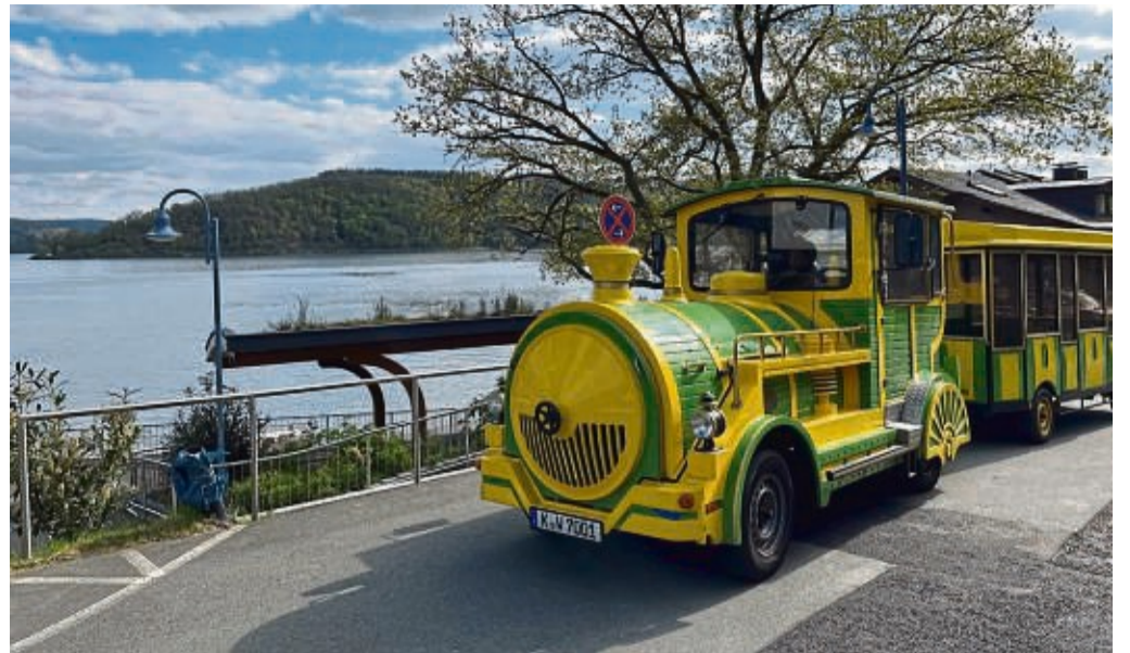
Stopp an drei Hotspots: Die „Schlossbahn“ bringt Fahrgäste vom Edersee nach Waldeck und zurück.

Waldeck - Nach der Betriebs-einstellung der Waldecker Bergbahn ist kurzfristig ein Ersatz für die Seilbahn gefunden worden, teilt die Stadt Waldeck mit. Eine Tourismusbahn mit dem Namen „Schlossbahn Waldeck“ fährt nun planmäßig zwischen dem Schiffsanleger in Waldeck-See, dem Ortskern Waldeck und dem Schloss. Alle drei Tourismus-Hotspots werden zunächst zwischen 10 Uhr und 17 Uhr im 45-Minuten-Takt angefahren. Die Tourismusbahn des Betreibers Oliver Wolters aus Köln fährt auf der Straße und kann damit einen optimierten Service anbieten, der zukünftig auch den Marktplatz Waldeck, das Strandbad am Edersee und das Schloss miteinander verbindet. höh