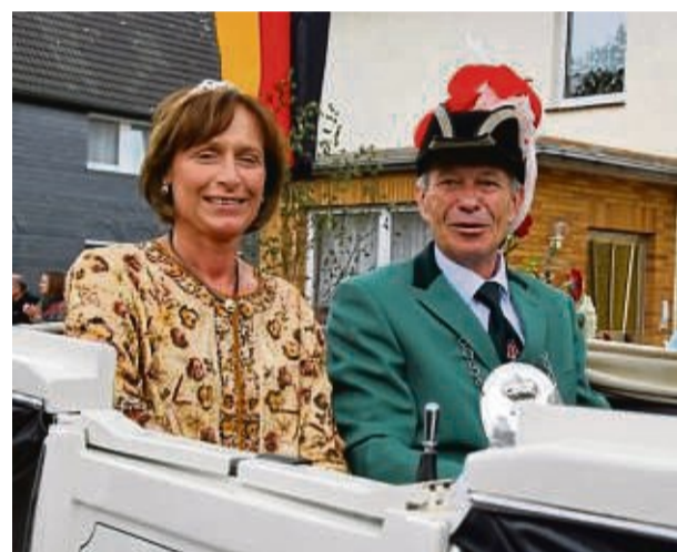
Das amtierende Königspaar: Heinrich und Elke Wilhelmi.