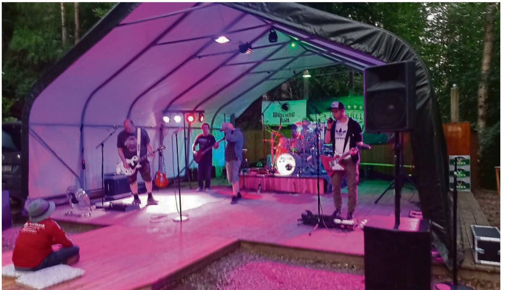
Das Team der Freilichtbühne Kattenbühl hat auch für die kommende Saison wieder ein abwechslungsreiches Konzertprogramm zusammengestellt.