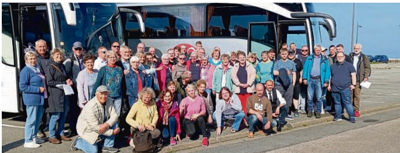
Mit zwei großen Bussen reiste der Großteil der Delegation aus Bad Sooden-Allendorf nach Landivisiau.