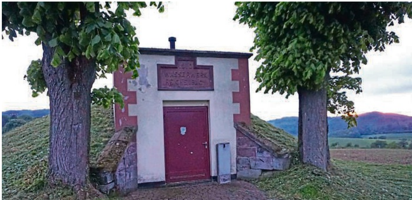
Um die Quelle in Reichenbach liegen landwirtschaftliche Flächen, auf die auch Gülle ausgebracht wird.

Die Diskussion geht zurück bis auf einen Antrag der Freien Wählergemeinschaft (FWG) aus dem Jahr 2021. Damals beantragte Fraktionsvorsitzende Birgit Osigus-Koch unter anderem, dass der Magistrat mit einer Novellierung der Trinkwasserverordnung für Reichenbach beauftragt wird und im Haushalt 2022 vorsorglich 20 000 Euro eingestellt werden für die Kosten der neuen Verordnung inklusive eines hydrologischen Gutachtens. Begründet wurde der Antrag damit, dass ein Landwirt in der Wasserschutzzone II um die Oberflächenquelle des Brunnens Reichenbach Gülle ausbringt und sich dabei auf die Wasserschutzverordnung aus dem Jahr 1981 stützt. Im Dezember 2022 wurde in der Stadtverordnetenversammlung