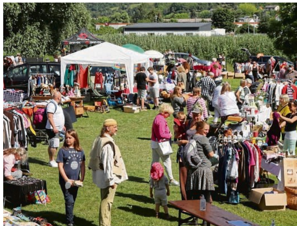
Beliebt: Das Werra-Ufer ist gefragter Veranstaltungsort, wie hier bei einem Flohmarkt.