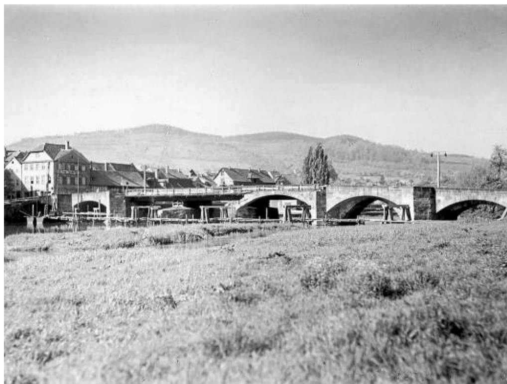
Bewegte Geschichte: Die Werra-Brücke, hier nach dem Zweiten Weltkrieg 1945 stark beschädigt, wird seit 96 Jahren neu beplant.