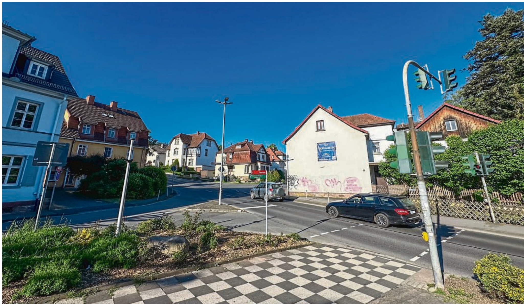
Wird das der Verkehrsknotenpunkt? An dieser Stelle soll die neue Werra-Brücke mit der Bundesstraße 451 und Ermschwerder Straße verbunden werden. In verschiedenen Varianten muss das Gebäude (Bildmitte) abgerissen werden.