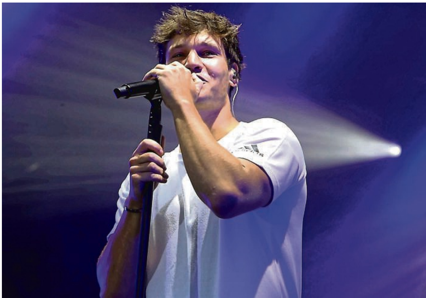
„Einfach zwei Stunden lang die Seele baumeln lassen“: So lädt Wincent Weiss zu seiner Sommertour ein, die ihn im Juli wieder nach Bad Sooden-Allendorf führt, wo er zum dritten Mal beim Soundgarten-Festival spielen wird.

Wincent Weiss (31) ist ein deutscher Popsänger und Songwriter. Mit Liedern wie „Musik sein“ und „Feuerwerk“ sang er sich in die Herzen seiner stetig wachsenden Fan-Gemeinde und ist aus dem deutschsprachigen Radio kaum noch wegzudenken. Auch im TV als Coach bei „The Voice Kids“ ist er einem breiten und vor allem jungen Publikum bekannt. Seine Freizeit verbringt er am liebsten im Norden, wo er am 21. Januar 1993 in Bad Oldesloe geboren wurde. ULK