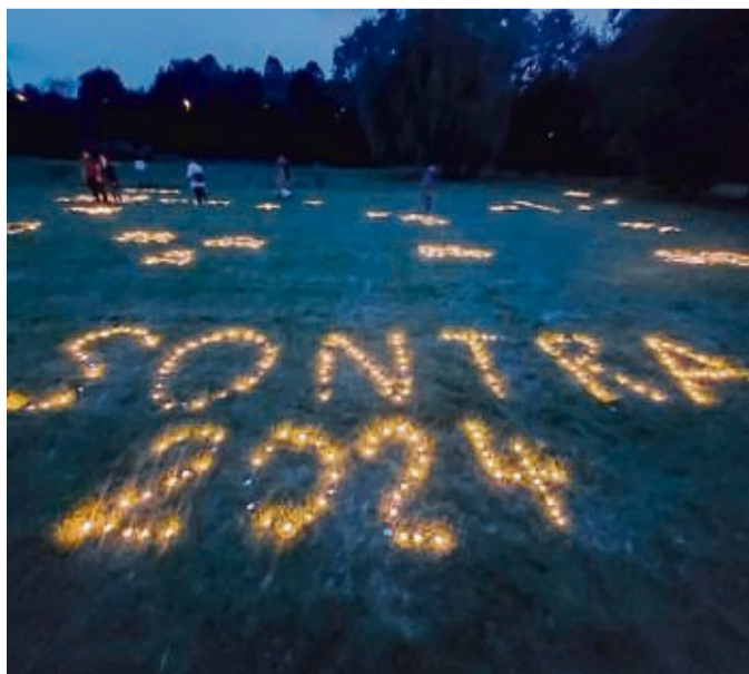
„Sontra“ im Kerzenschein: Das Meer aus 10 000 Lichtern war ein besonderes Highlight.