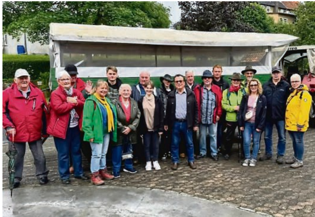
Wanderung vom Heimat- und Verkehrsverein Blankenbach mit dem Chorverein Blankenbach – Wölfterode zur Tannenburg.

Mittags gegen 13 Uhr waren wir auf der Tannenburg angekommen. Der Ausblick von der überdachten Terrasse der Tannenburg und der gastfreundliche Empfang ließen die Stimmung weiter steigen. Nachdem wir es uns auf der mittelalterlichen Burg bei einem frischen Met, und weiteren köstlichen Getränken und ritterliche Speisen, gemü-