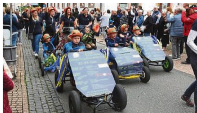
Auch beim BREITWIESN-Festumzug war die Vereinsgemeinschaft Hornel zahlreich vertreten und warb für das Kümmerlingsfest.

Auf euer Kommen freut sich die Vereinsgemeinschaft Hornel