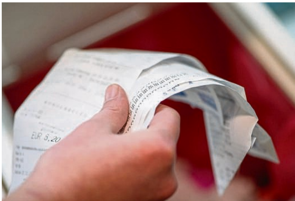
Weiße, glatte Kassenzettel aus Thermopapier gehören nicht ins Altpapier, sondern müssen im Restmüll entsorgt werden.

Wohin nur mit den alten Papiertaschentüchern? Sie gehören – anders, als es der Name vielleicht vermuten lässt – nicht ins Altpapier. Darauf weist die „Initiative Mülltrennung wirkt“ hin. Stattdessen werden Papiertaschentücher aus Zellulose – übrigens ebenso wie Küchenkrepp, Papierservietten und Wattepads – über den Restmüll entsorgt.