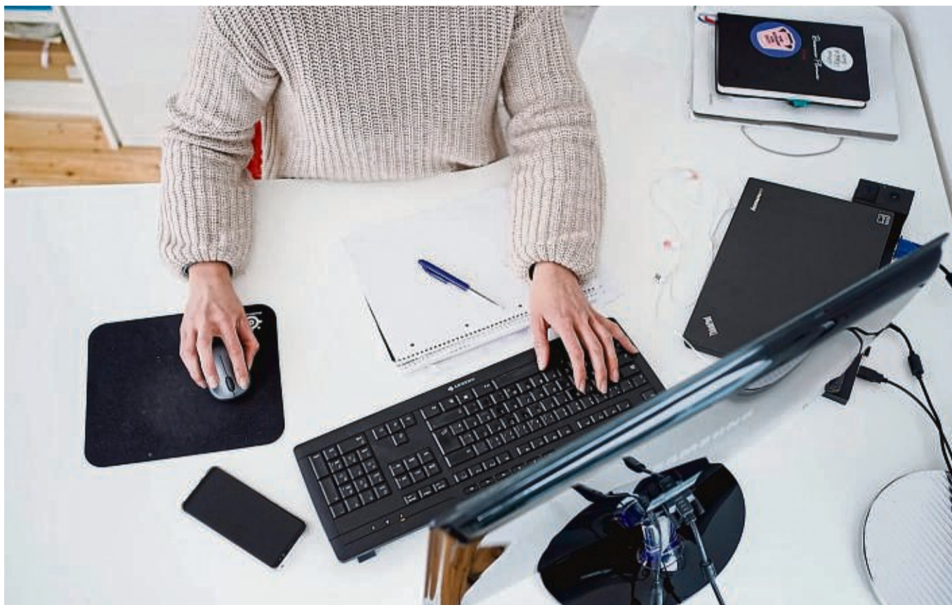
Alles an seinem Platz – und nicht zu viel: Ein ordentlicher Schreibtisch hilft dabei, konzentrierter zu arbeiten.

Im Büro kommt noch die Außenwirkung hinzu. Ein unaufgeräumter Arbeitsplatz kann zu Kritik von Vorgesetzten und Kollegen führen. Weil sich Unterlagen nicht finden lassen, wenn man