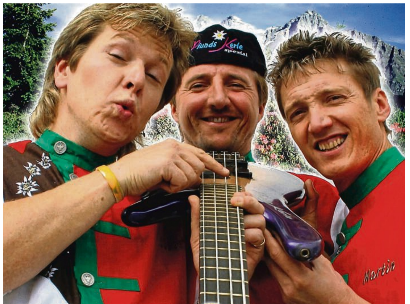
Schließen mit ihrer Show das Fest am Montag stimmungsvoll ab: Die Pfunds-Kerle spielen zum Finale zum wiederholten Male in Reichensachsen.

Der Wichtelfest-Sonntag startet früh: Um 7 Uhr beginnt das Wecken in den Straßen durch den Musikzug und die Akkordeongruppe