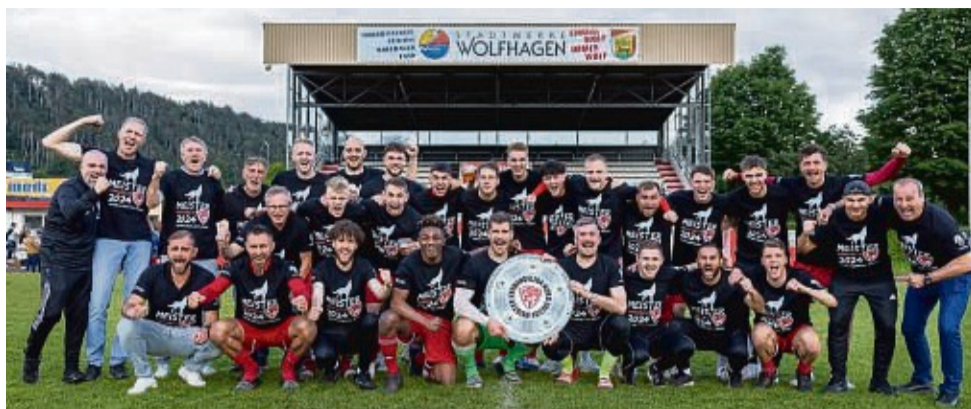
Aufstiegshelden: Der FSV Wolfhagen hat den Durchmarsch geschafft und feiert den Aufstieg in die Hessenliga.

Nach einer überragenden Spielzeit 2022/2023, in der man ungeschlagen Meister der Gruppenliga Kassel Gr. 1 werden konnte, in 30 Spielen unfassbare 88 Punkte holte und mit einem Torverhältnis von 125:8 aufwarten konnte, begann zu Beginn dieser Spielzeit das Abenteuer Verbandsliga. Dieses bedeutete für das Team von Trainer Valentin Plavcic Neuland, spielte doch nie zuvor eine Mannschaft der Wölfe auf Verbandsebene in diese Liga.