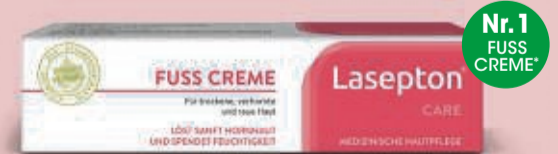
Kosmetikum, 75 ml

gibt es Dr. Böhm® Haut Haare Nägel im Vorteils-Set. Es enthält eine Gratis-Tube der Nr.-1-Fußcreme** von Lasepton® in Originalgröße. Erhältlich in Ihrer Apotheke – solange der Vorrat reicht.