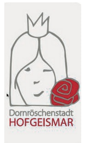
Das neue Logo der Gemeinschaft.