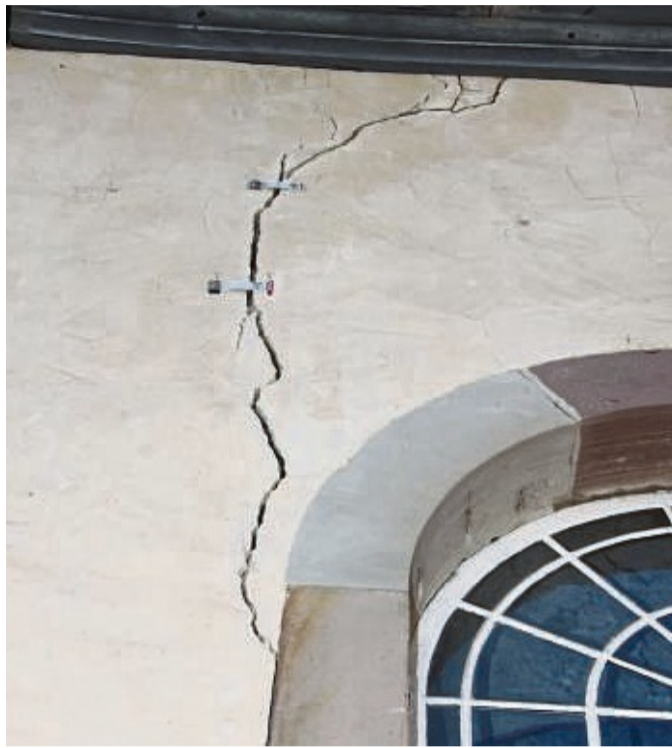
Zwei Rissmonitore an der nördlichen Außenwand der Kirche. Sie haben keine Hinweise auf weitere Bewegungen im Mauerwerk ergeben.

Schon vor einigen Jahren war die Kirchendecke geöffnet und untersucht worden.