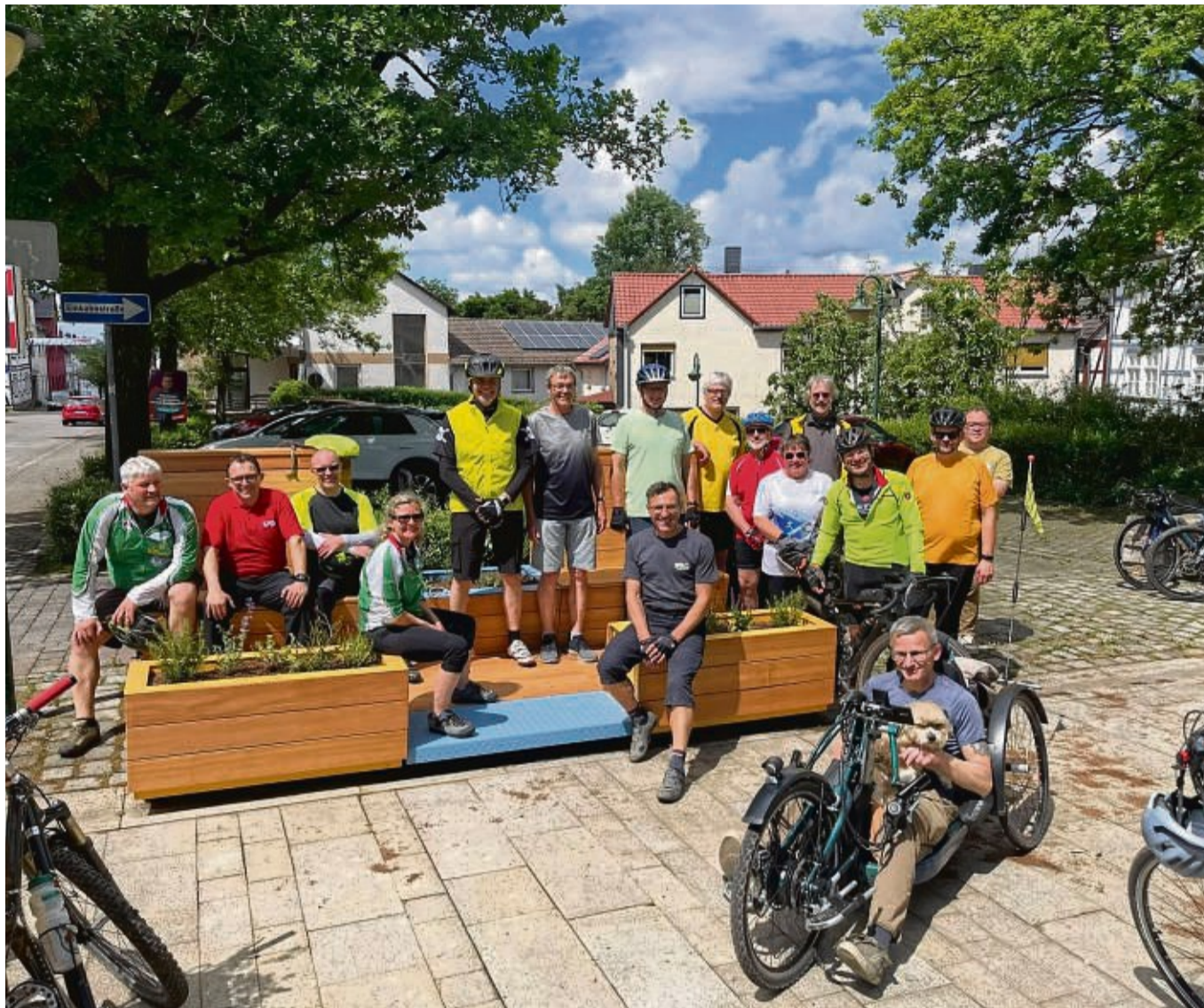
Abschluss des Stadtradel-Auftakts: Teilnehmer trafen sich zum Fachsimpeln auf den Stadtmöbeln, die am Kirchplatz aufgestellt wurden.

Der erste Stop war an der alten Radarstation – der höchste Punkt auf der Tour. Von dort ging es über Gut Winterbüren nach Rothwesten. Dort informierten Kuhlmeiy und Obermann über die Lückenschlüsse der Radwege zwischen Holzhausen und Rothwesten sowie Holzhausen und Knickhagen. Beide wurden 2023 eingeweiht.