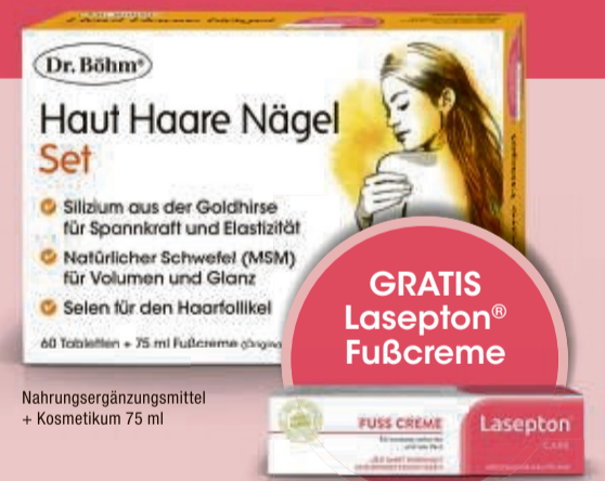
Nahrungsergänzungsmittel + Kosmetikum 75 ml