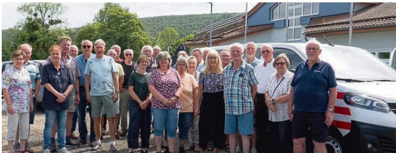
Die vielen Fahrer und Beifahrer der Nachbarschaftshilfe freuen sich über das neue Fahrzeug.

Das Fahrzeug wird den bisherigen Bus mit Dieselmotor ersetzen und an zwei Tagen pro Woche für die Bürgerinnen und Bürger in Vaake und Veckerhagen unterwegs sein. Die Menschen werden zuhau-