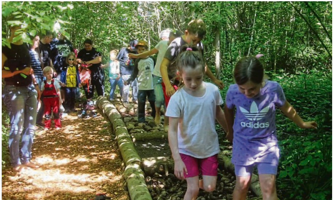
Eine Attraktion: Der neu angelegte Natur- und Sinnespfad auf dem Gelände der Altenhasunger Freizeitanlage Hirtenbruch.