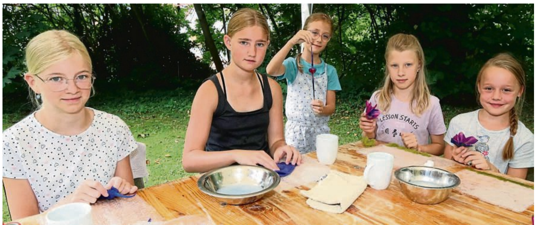
Auch in diesem Jahr wird beim Dransfelder Sommerferienprogramm wieder ein Workshop Filzen angeboten, bei dem aus bunter Wolle, warmem Wasser und Seife unterschiedlichste Gegenstände gezaubert werden können.

Mittwoch, 26. Juni: Kugelblasen in der Glasbläserei Clausthal-Zellerfeld (für Kinder ab 8 Jahren, die in der Lage sind, einen Luftballon auf-