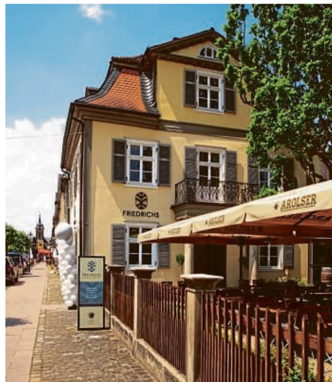
Das Friedrichs in der Schloßstraße in Bad Arolsen.