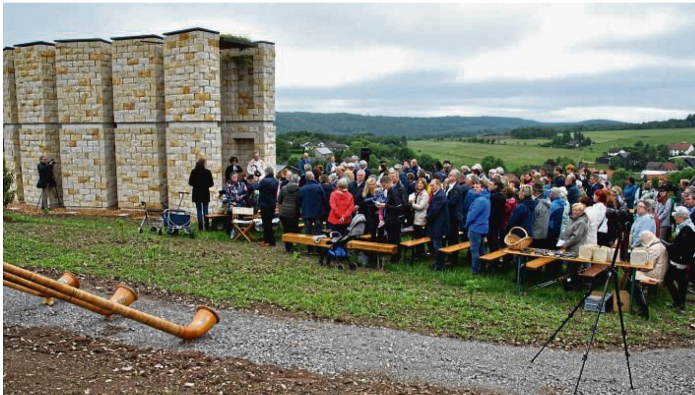
Hoch über Hillershausen steht die neue Bergkapelle.

„Diese Kapelle mit ihrer außergewöhnlichen Strahlungskraft ist ein Ort der Ruhe, Einkehr und Begegnung – ein Ort der inneren Einkehr.“