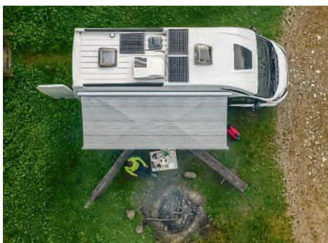
Unterwegs unabhängiger: Fest installierte Solaranlagen erzeugen beim Camping-Trip nachhaltigen Strom.

Verbraucher sollten bereits vor ihrem Urlaub überlegen, welche Geräte wie viele Stunden pro Tag mit Strom versorgt werden müssen. Daraus lässt sich dann errechnen, wie viele Amperestunden und Wattstunden pro Tag benötigt werden. Um den Strombedarf beim Camping im Sommer zu decken, benötigen Camper in der Regel eine Solaranlage mit einer Leistung zwischen 100 und 400 Watt.