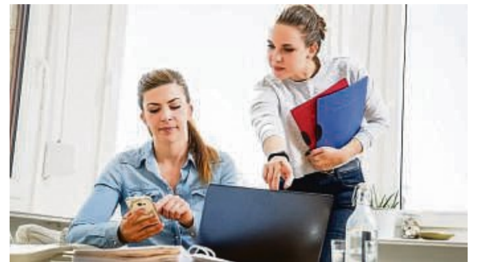
Sich durch eine Reihe an Fragen geklickt und schon steht fest: Sie sollten Anwältin werden? So eindeutig sind Interessentests im Internet meist nicht.

Wer auf sich aufmerksam machen möchte, sollte solche Netzwerke als Datenbanken denken und Schlüsselwörter klug wählen. tmn