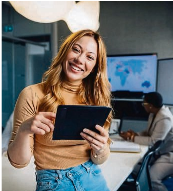
Werbung für sich selbst machen: Wer einen potenziellen Arbeitgeber überzeugen will, sollte im Anschreiben klarmachen, welchen Mehrwert er mitbringt.