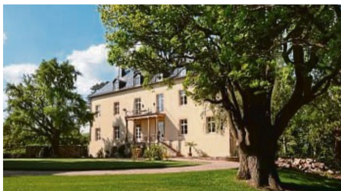
Das Hotel Brunnenhaus am Schloss in Landau bietet von der modernen Terrasse einen herrlichen Blick zum Schloss.

Die Küche bietet wechselnde kulinarische Angebote