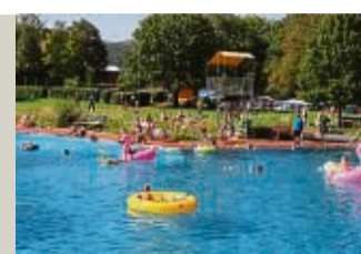
Sontra Die Freibadsaison geht endlich wieder los.