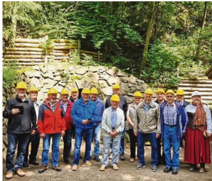
Hatten einen besonderen Tag: der Männertreff Ulfen zu Besuch in der Grube Gustav.

Der nächste Männertreff Ulfen ist am 2. Juli