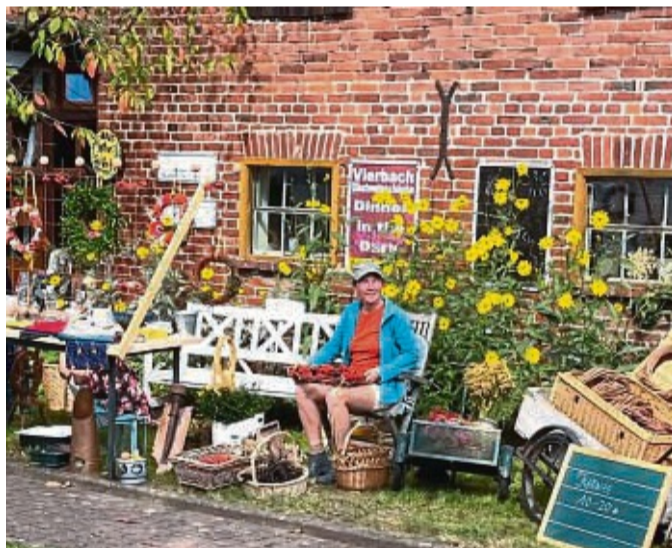
Nach dem riesigen Erfolg im vergangenen Jahr laden die Vierbacher nun ein zum zweiten offenen Scheunen- und Dorfflohmarkt.

Die Strohpuppen im ganzen Ort sind sicher dem ein oder anderen schon aufgefallen. Auf den Stempelkarten zur Teilnahme am Gewinnspiel sind dann auch jeweils die einzelnen Stationen wieder aufgezeigt, an denen es von Kleidung über Antiquität-