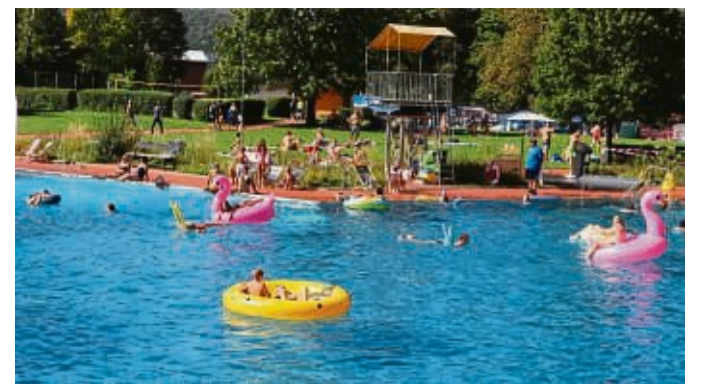
Im Sontraer Freizeit- und Erlebnisbad kommt die ganze Familie auf ihre Kosten.