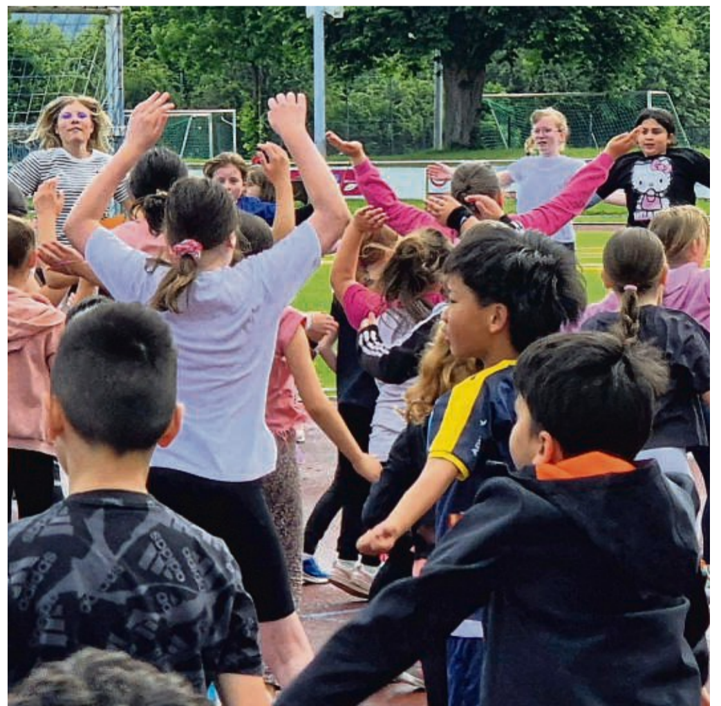
Sollen alle dieselben Chancen erhalten: Hier bereiten sich die Kinder der Struthschule gerade auf die Bundesjugendspiele vor.