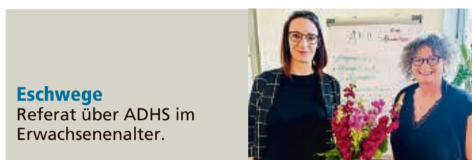
Eschwege Referat über ADHS im Erwachsenenalter.