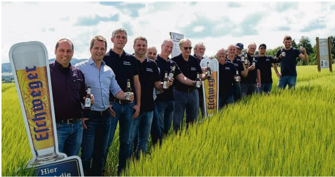
Haben Grund zu feiern: Die Landwirte der Braugersten-Anbaugemeinschaft Werra-Meißner-Land.