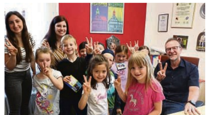
Viele Fragen hatten die Kinder an Bürgermeister Thomas Eckhardt.