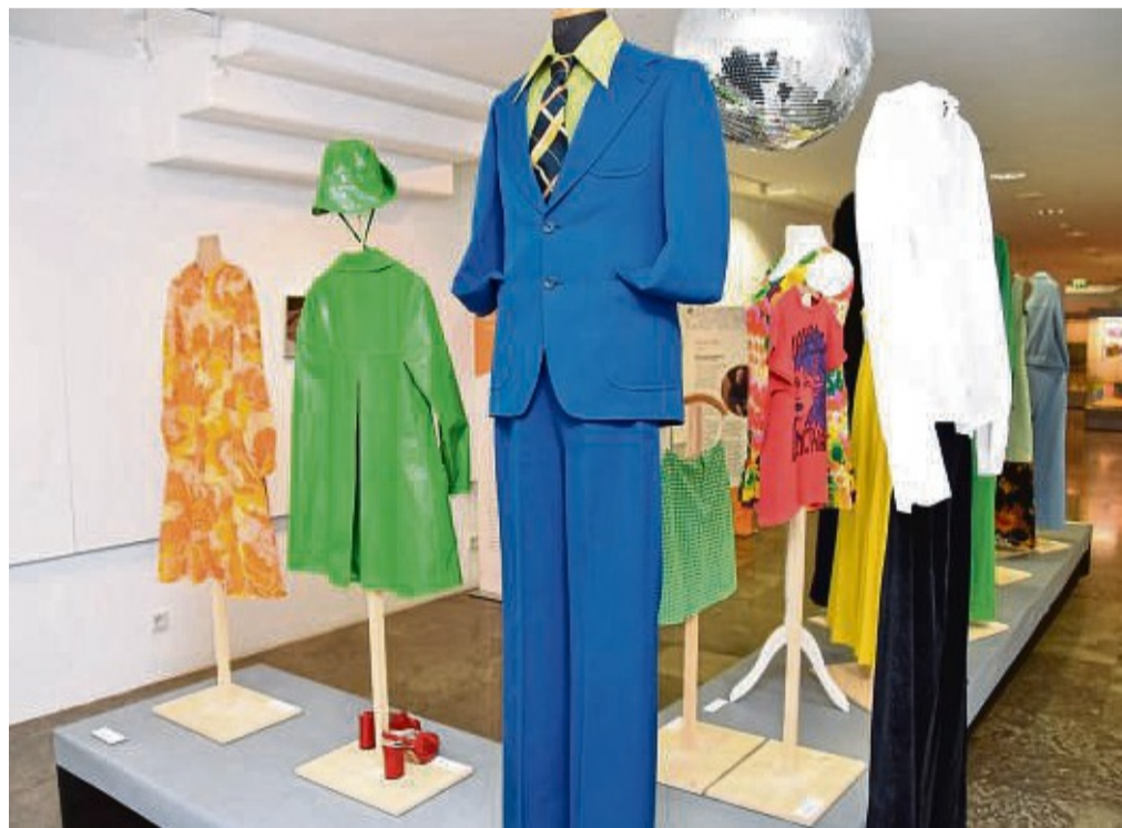
Mode der 70er: In der Landkreis-Ausstellung, die in den vergangenen Wochen schon im Bonhage-Museum in Korbach zu sehen war, geht es auch um die Anfangsjahre des Landkreises Waldeck-Frankenberg.

Nachdem die Ausstellung im Frühjahr in Korbach Station gemacht hat, ist sie vom 16. Juni bis 11. August in Frankenberg zu sehen: Sie wird aufgrund der Umbauarbeiten des Museums im Kloster im Haus am Geismarer Tor gezeigt (Geismarer Straße