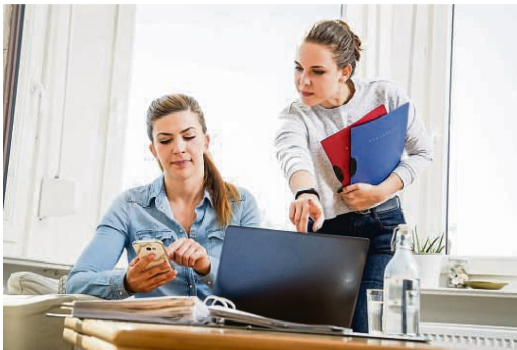
Sich durch eine Reihe an Fragen geklickt und schon steht fest: Sie sollten Anwältin werden? So eindeutig sind Interessentests im Internet meist nicht.

Sechs Hauptinteressen sind auszumachen, wobei es durchaus Überschneidungen geben kann: realistisches (wird mit Handwerk, Technik, Ingenieurwesen assoziiert), investigatives (Forschung), artistisch/künstlerisches, soziales, unternehmerisches sowie konventionelles (Umgang mit Daten, Verwaltung, Organisation) Interesse.