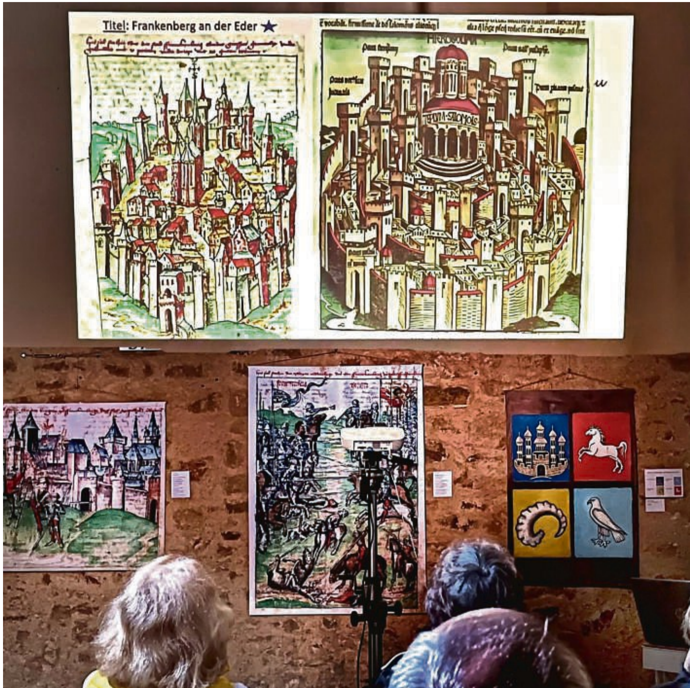
Bildpräsentationen als Besuchermagnet: Die Bildervorträge von Lothar Finger mit Gegenüberstellungen von Gerstenberg-Originalen, mittelalterlicher und moderner Kunst waren während der Ausstellung oft bis auf den letzten Platz ausgebucht.