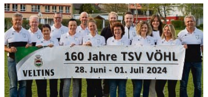
Jede Menge Sport und Unterhaltung: Der TSV Vöhl feiert vier Tage lang mit einem abwechslungsreichen Programm das 160-jährige Bestehen des Vereins.