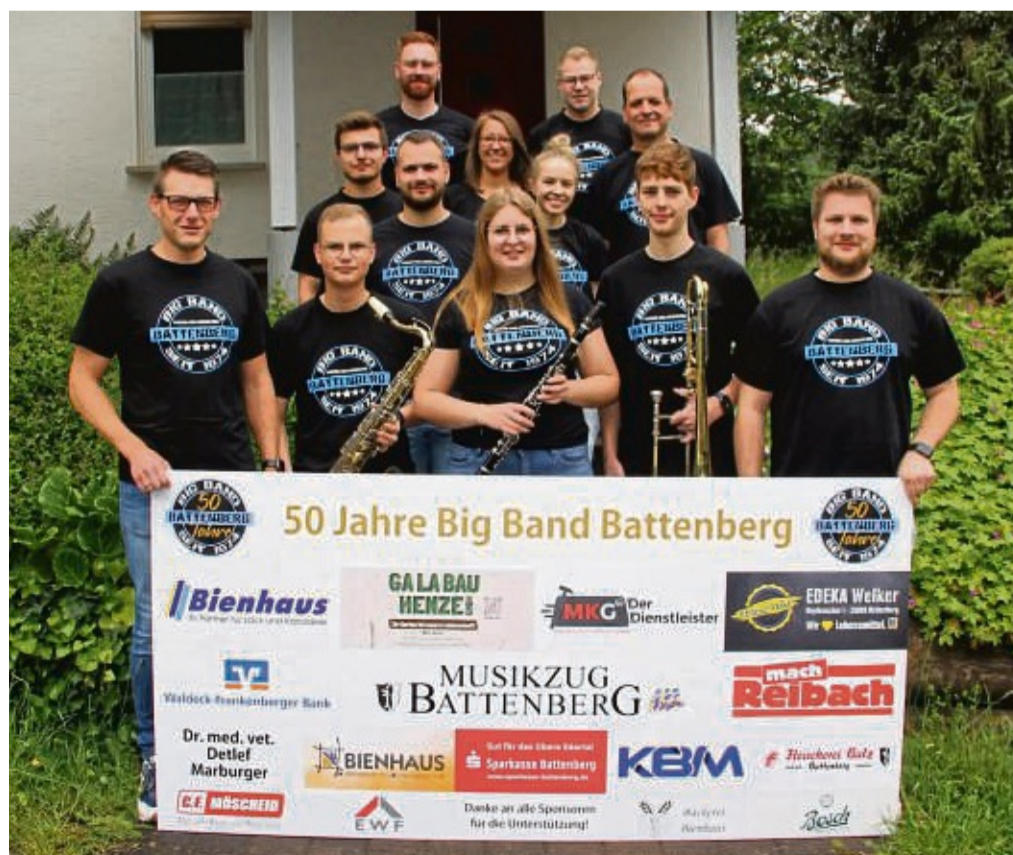
Die Battenberger Big Band wird 50 Jahre alt. Das Jubiläum wird beim Battenberger Heimatfest gefeiert. Für die Firmen und Personen, die die Veranstaltung finanziell unterstützen, wurde eine Sponsorentafel angefertigt.