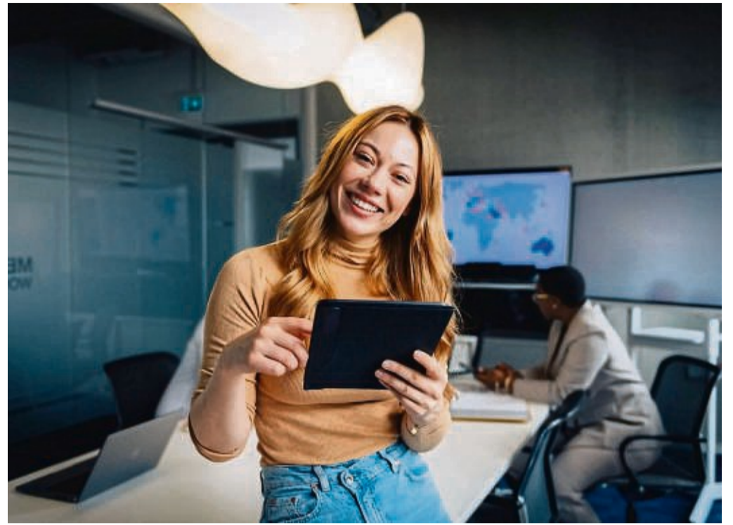
Werbung für sich selbst machen: Wer einen potenziellen Arbeitgeber überzeugen will, sollte im Anschreiben klarmachen, welchen Mehrwert er oder sie für das Unternehmen mitbringt.

„Bloß keine Standardformulierungen wählen und bloß nicht zu lang schreiben“, sagt Personalberater Se-