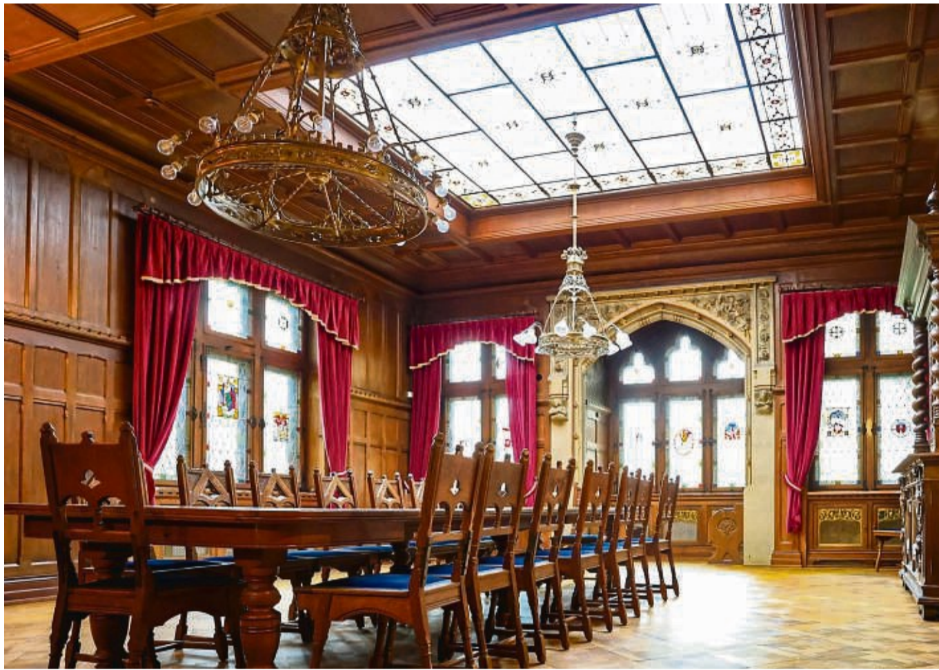
Erstrahlt in neuem Glanz: Der Speisesaal auf Schloss Rothstein konnte gerettet werden. Der Kampf gegen den Hausschwamm wurde mit handwerklichem Geschick und moderner Mikrowellen-Technik gewonnen.