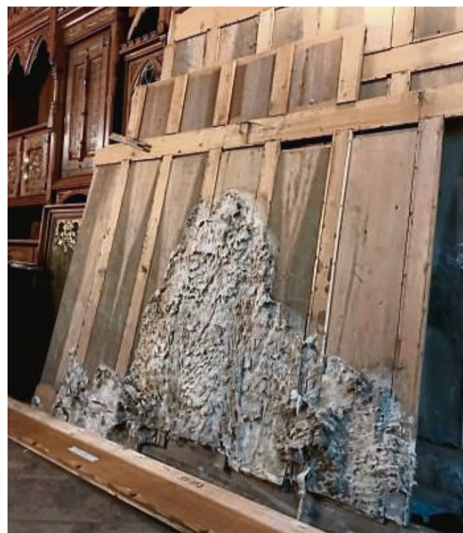
So sieht er aus: Der Hausschwamm hatte sich in weiten Teilen des Speisesaals breitgemacht.

Der Schwamm hatte sich stark ausgebreitet. Sowohl das Holz als auch die Wände waren betroffen. „Vielen Experten auf diesem Gebiet, die wir angefragt hatten, war das zu heiß“, sagt die Schlossbe-