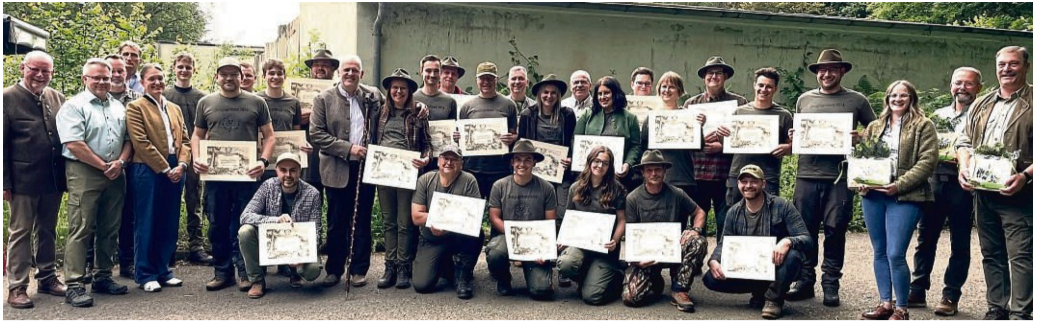
Freude bei den Jungjägern über das bestandene „Grüne Abitur“.