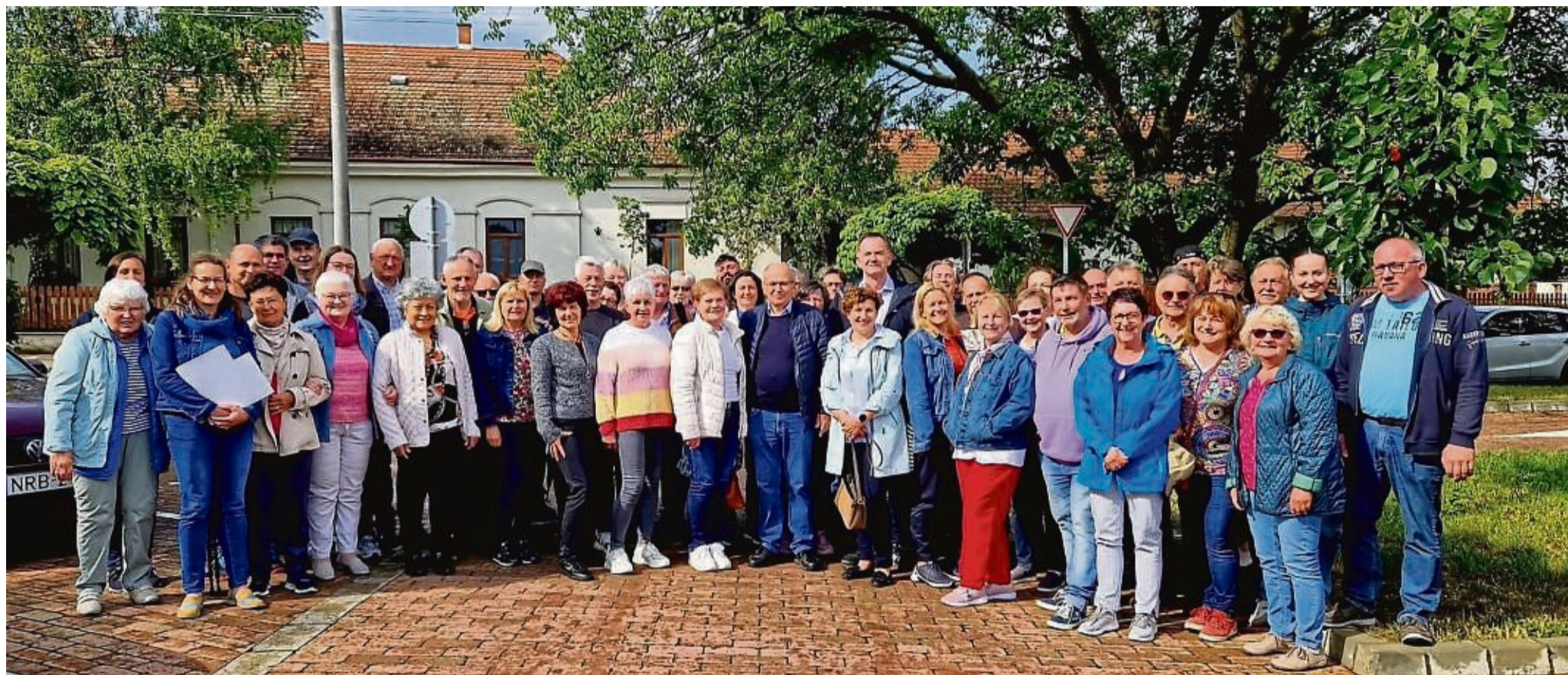
Zu Besuch in der ungarischen Gemeinde Rácalmás war eine Delegation aus der Samtgemeinde Dransfeld im Mai.