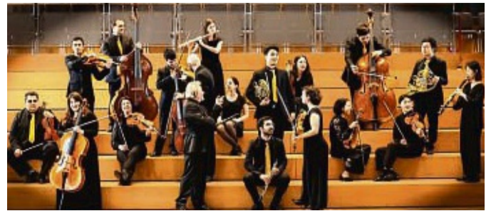
Konzert mit klassischen Werken: Das Detmolder Kammerorchester ist am Sonntag, 7. Juli, auf Gut Glindfeld bei Medebach zu Gast.

Mönche am Sonntag, 30. Juni, noch zu einer „Andacht zur Kloster-Trophy“ ein, die um 9.30 Uhr bei Kaspes auf dem Hof beginnt. Anschließend gibt es ein Frühstück sowie zünftigem Frühschoppen im Festzelt.