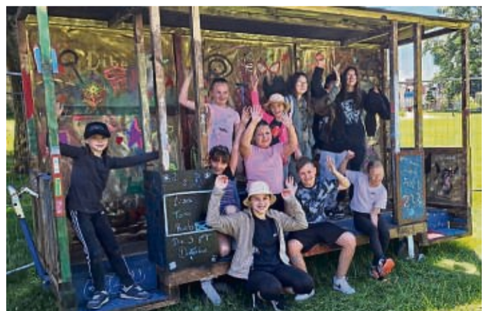
Die Kinder des Freilichtbühnenvereins haben die Kommando-Zentrale zum Krimi „Ein klarer Fall“ bemalt.