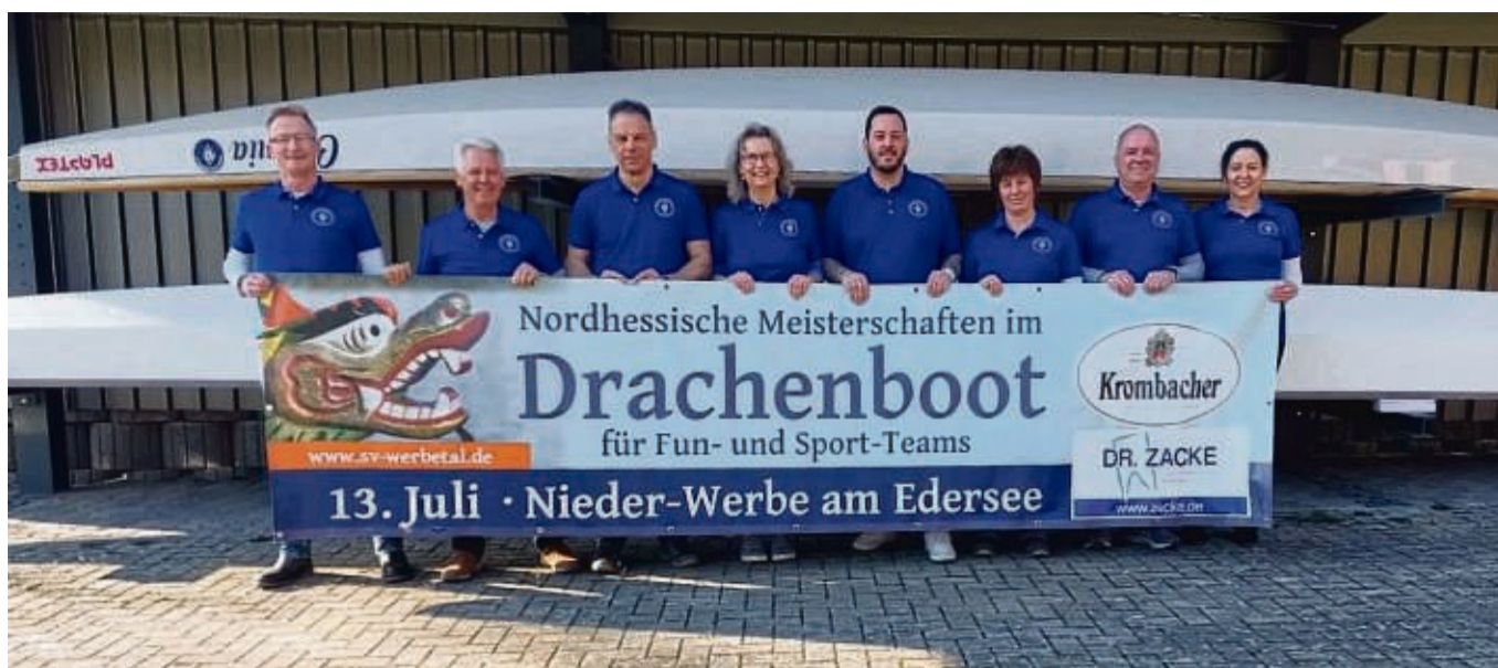
Der SV Werbetal freut sich auf das nächste Drachenbootrennen.

Für IHK-Mitgliedsunternehmen ist die Teilnahme kostenfrei, Nicht-Mitglieder zahlen 50 Euro. Eine Anmeldung ist bis Montag, 24. Juni, unter www.ihk.de/kassel-marburg/veranstaltungen erforderlich.