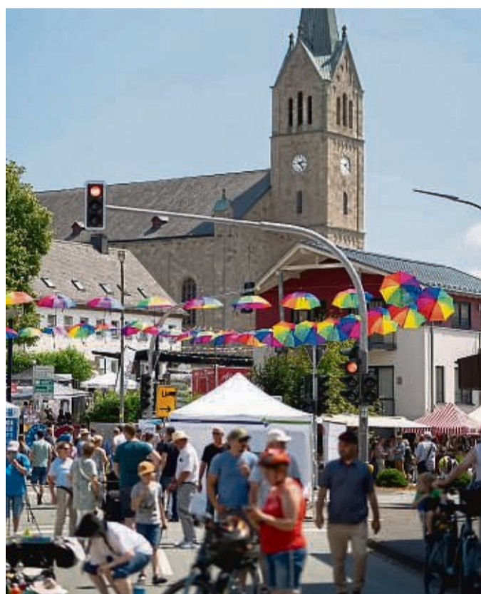
Am Samstag und Sonntag, 29./30. Juni wird die Innenstadt zum Festivalgelände.