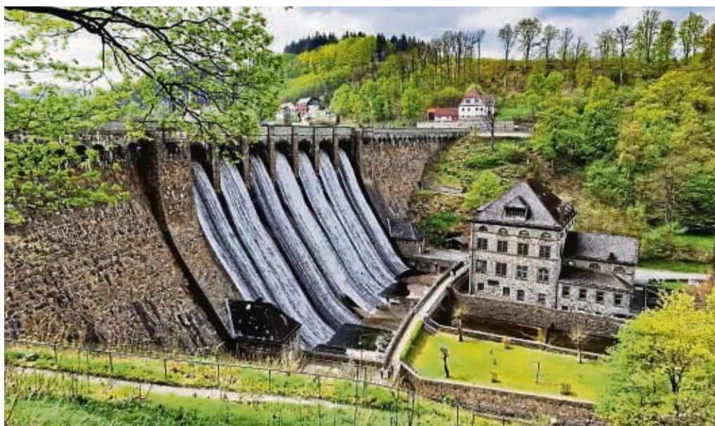
Der Ferienregion Diemelsee feiert ein stolzes Jubiläum: Die Diemeltalsperre wurde vor 100 Jahren fertiggestellt. Der offizielle Festakt ist am Samstag.