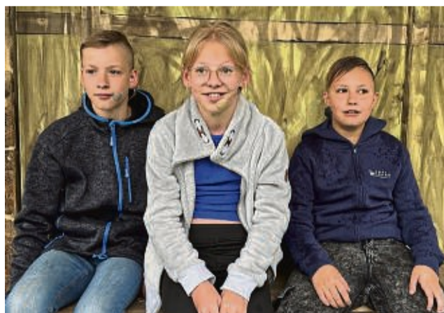
Die Kinder-Detektive warten in der Zentrale auf einen neuen Fall.