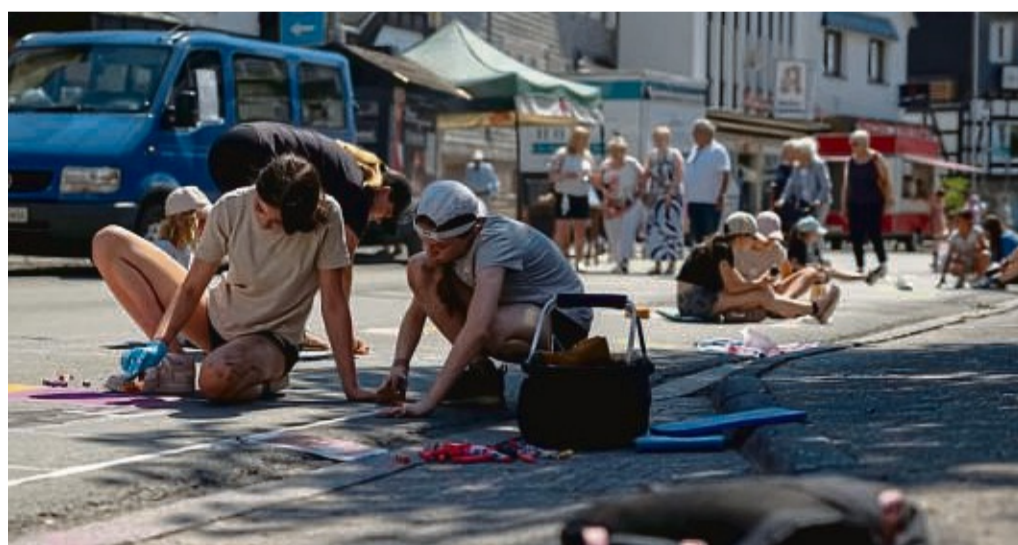
Vier ausgewiesene Malbereiche für verschiedene Altersgruppen bieten in Medebach Kreativen alle Möglichkeiten, sich auszudrücken.