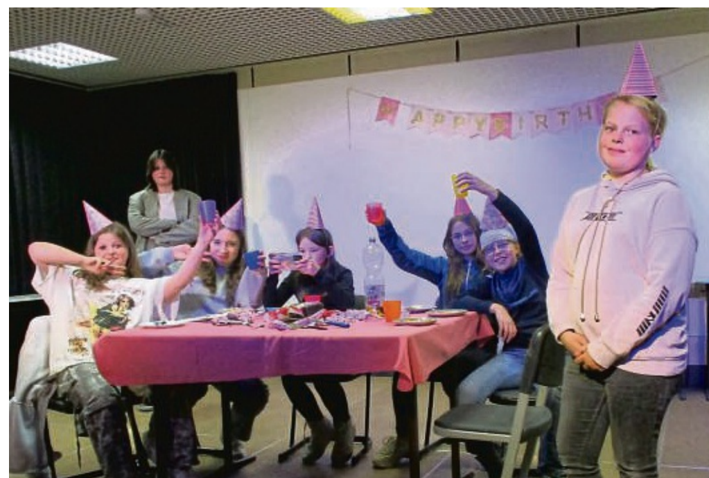
Die Auswirkungen des Handys auf den Alltag besingt die Musical-AG der Uplandschule beim Auftritt im Willinger Begegnungscafé.

Der Eintritt zur Aufführung, zu der Interessierte willkommen sind, ist frei. red