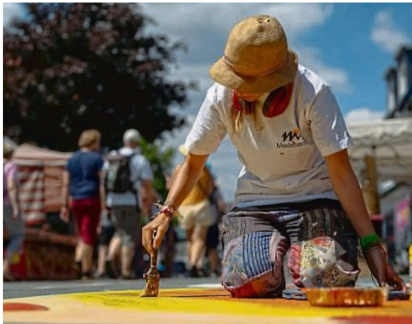
Zu einem abwechslungsreichen Event für die gesamte Familie lädt der Gewerbe- und Verkehrsverein Medebach ein.

Rund um das Festivalgelände finden sich viele kostenfreie Parkplätze. Insbesondere am Sonntag besteht die Möglichkeit, die Park-