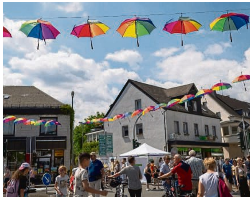
Rund um das Straßenmalerfestival bieten knapp 50 Aussteller ihre Produkte und Dienstleistungen an.

plätze an den großen Märkten zu nutzen sowie die Stellplätze in der Bahnhofstraße und Industriestraße. Außer-