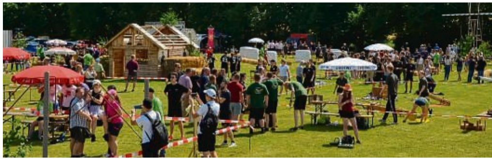
Zur Klostertrophy in Immighausen werden den teilnehmenden Teams und Zuschauern zwölf verschiedene Stationen geboten.

Lichtenfels-Immighausen – Die 27. Immighäuser Kloster-Trophy findet am Samstag, 29. Juni, ab 14 Uhr auf dem Sportplatz statt. Insgesamt sind zwölf verschiedene Spielstationen geplant. Bislang haben sich mehr als 40 Teams angemeldet, die aus dem gesamten Landkreis und darüber hinaus kommen. Weitere Anmeldungen von Männer- und Frauenmannschaften sowie gemischten Teams sind unter www.kloster-trophy.de noch möglich. „Um auch in diesem Jahr wieder einen reibungslosen Ablauf der Trophy garantieren zu können, ist die Anzahl der teilnehmenden Mannschaften jedoch auf 55 begrenzt“, so die Veranstalter auf ihrer