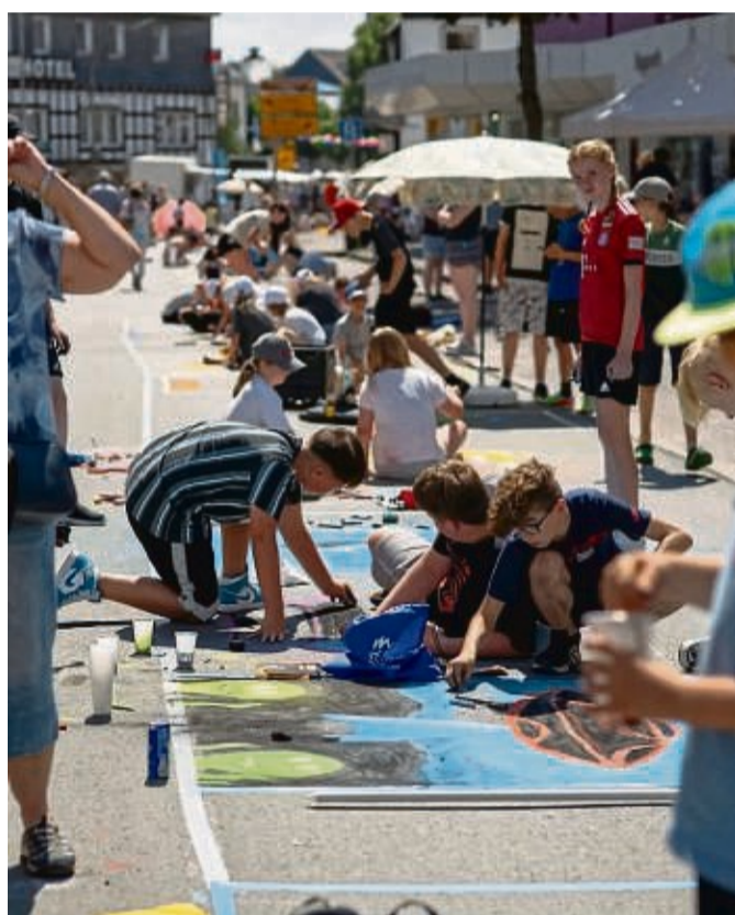
Das Publikum darf sich auf kunterbunte Tage voller Kreativität und Vielfalt freuen.