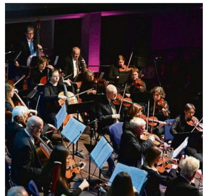
Das Sommerkonzert des Waldeckischen Kammerorchesters präsentiert das VHS-Kulturforum am Sonntag, 30. Juni, in der Nikolaikirche.

Eintrittskarten gibt es zum Preis von zwölf Euro bei der Korbach-Information, Prof-Bier-Straße 15, Tel. 05631/53232. An der Abendkasse kosten die Kartenn 15 Euro. Fünf Euro Ermäßigung gibt es für VHS-Mitglieder, Schüler, Studenten und Schwerbehinderte.