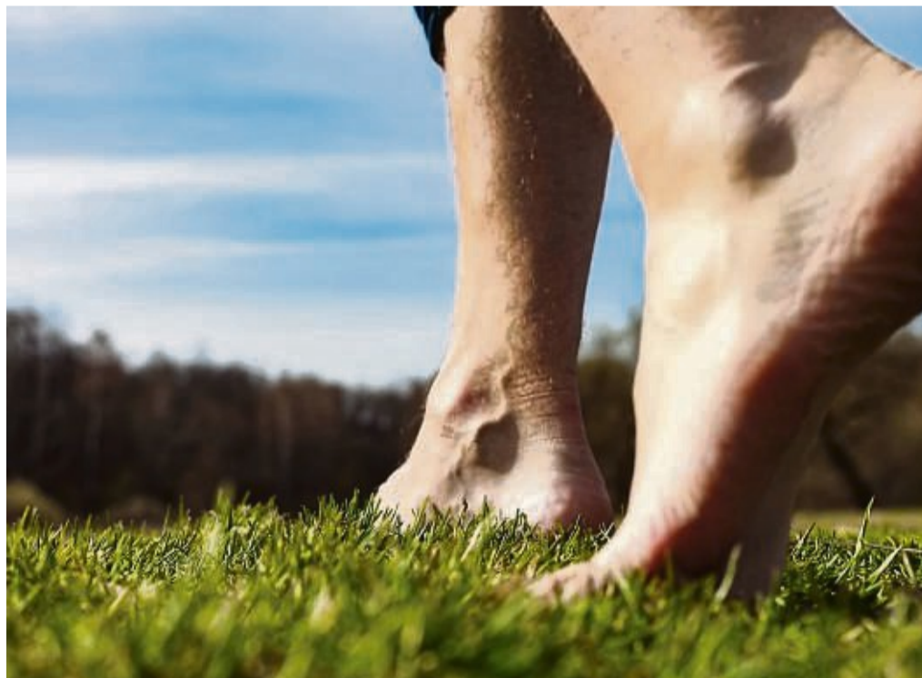
Gesundes Laufen klappt am besten barfuß. Wer jede Gelegenheit nutzt und die Schuhe beiseite stellt hilft damit seinen Sehnen, Muskeln und Bändern.

Gesundes Laufen klappt am besten Barfuß. Wer jede Gelegenheit nutzt und die