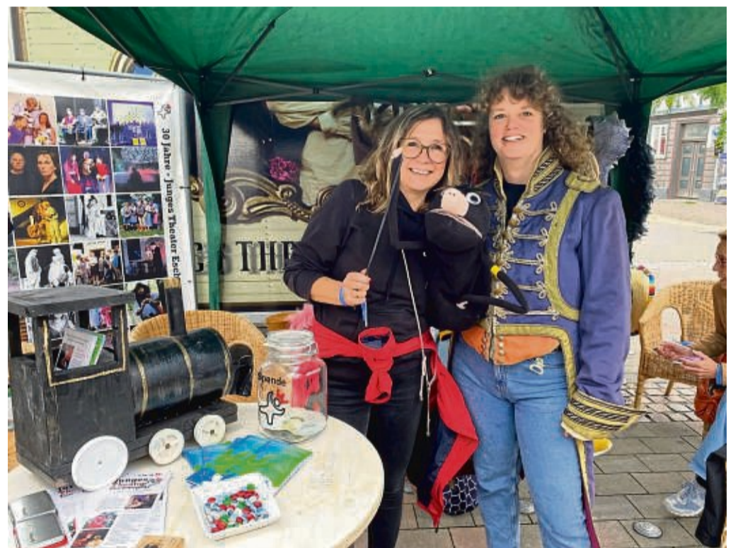
So eine große Bandbreite an Vereinen auf einmal, gab es noch nie: Hier präsentiert sich das Junge Theater.