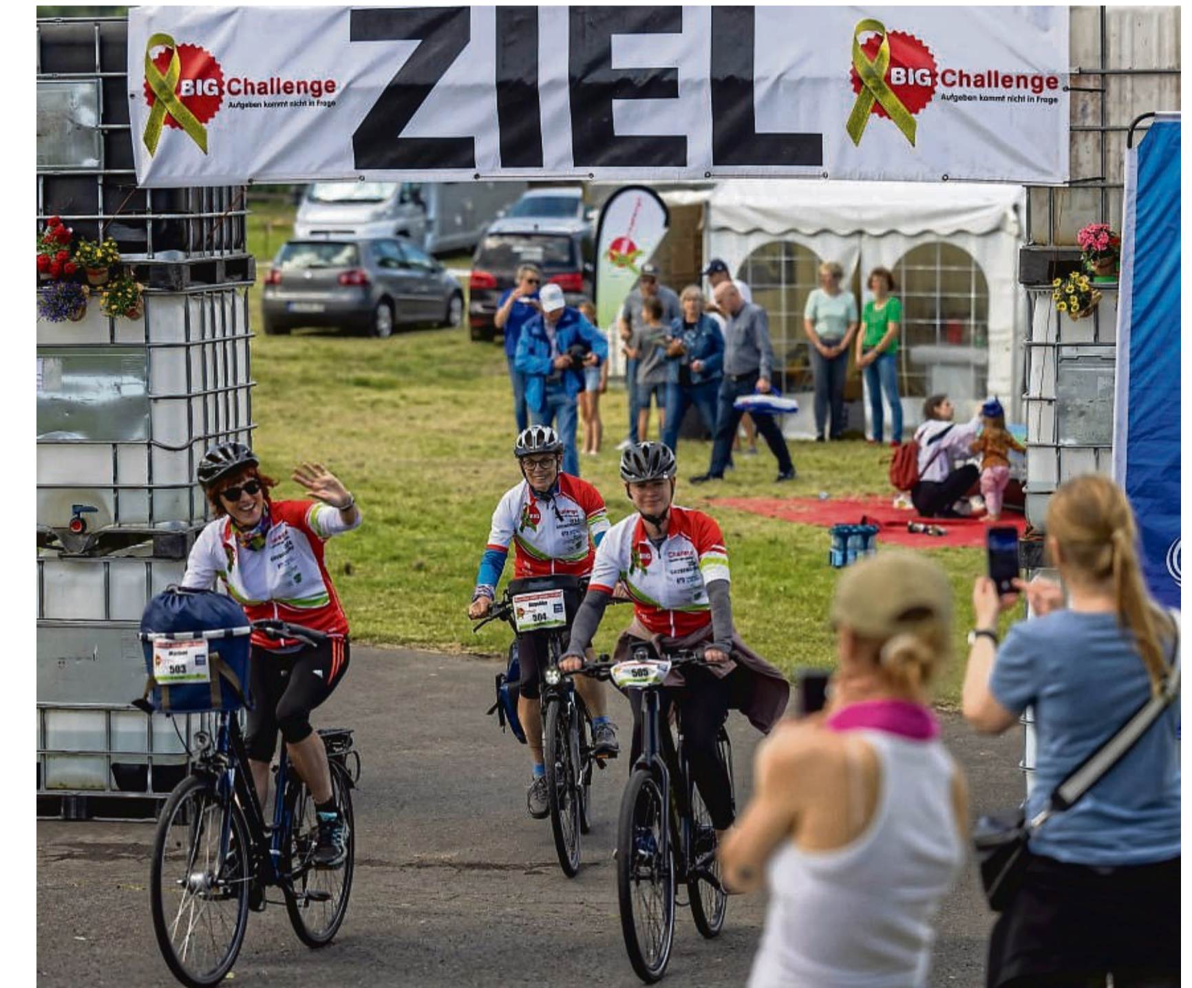
Zieleinfahrt: Diese drei Teilnehmerinnen haben rund 41 Kilometer Strecke auf ihren Fahrrädern hinter sich.

Trotz wechselhaften Wetters mit Regen am Morgen und Sonnenschein am Nachmittag war die Big Challenge mit Start und Ziel in Grebendorf ein voller Erfolg. Bereits um 5 Uhr morgens starteten die sportlichen Aktivitäten, die bis 17 Uhr andauerten. Die Radstrecke mit einer Länge von 41 Kilometern führt von Grebendorf über Frieda,