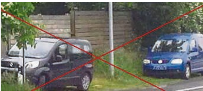
Parken verboten: Die Stadt Sontra bittet darum, nicht auf Grünstreifen zu parken.