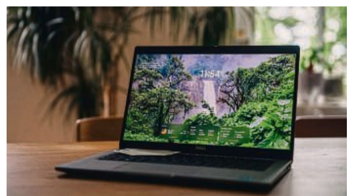
Microsoft hat den Sperrbildschirm in Windows 10 und 11 aktualisiert und bietet nun mit einem Update eine neue Widget-Ansicht auf dem Sperrbildschirm.