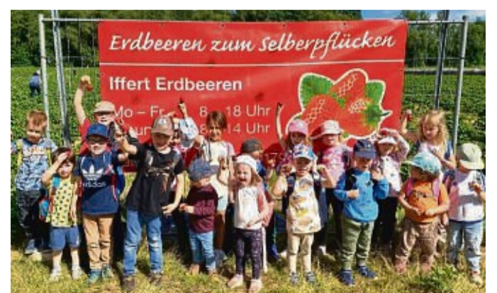
Viel Spaß hatten die Kinder der Kindertagesstätte „Bunte Welt“ beim Erdbeeren pflücken.

Die Kinder und Erzieherinnen sagen Herrn Iffert ganz herzlich Dankeschön. red