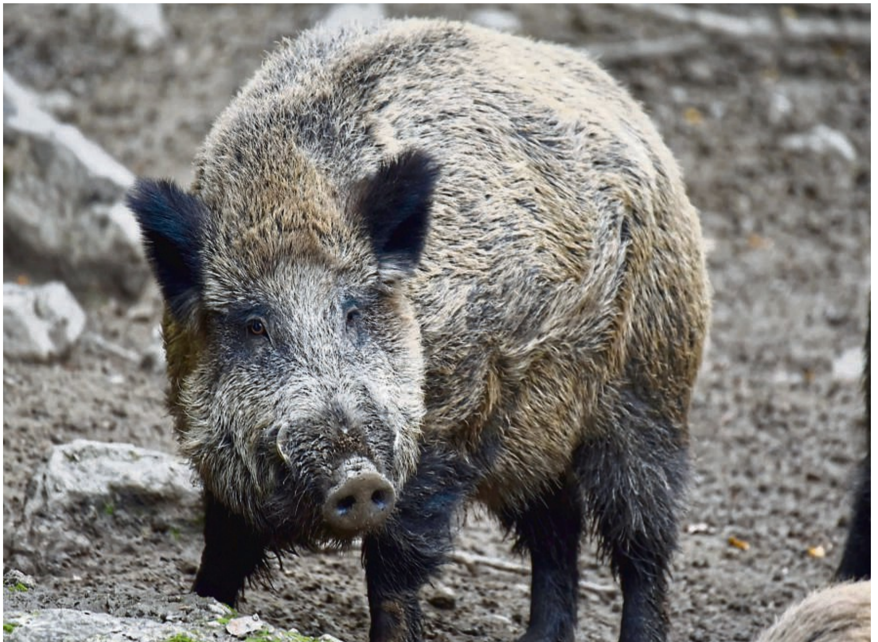
Die Afrikanische Schweinepest ist für Wild- und Hausschweine hochansteckend und endet für die Tiere fast immer tödlich. Jetzt ist in Hessen ein erster ASP-Fall bestätigt worden.

Beim Auftreten eines ASP-Falls in Kreis werde sofort der Krisenstab einberufen, heißt es vonseiten der Kreisverwal-