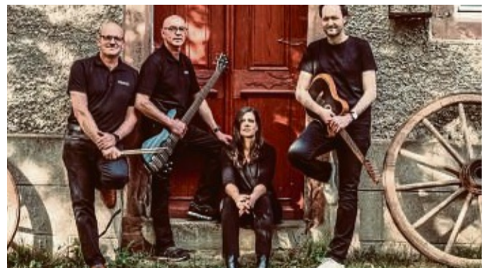
Treten auf: Am 29. Juni spielen Acoustication in Wichmannshausen.

Karten-Vorverkauf bei Friseursalon Haargenau by Steffi in Wichmannshausen, Landbäckerei Bechthold-Stange in Herleshausen, Juwelier Kuntze in Sontra, Reinhardt Land-, Forst- und Gartentechnik in Breitau. Vorverkauf 12 Euro oder direkt an der Abendkasse für 15 Euro.