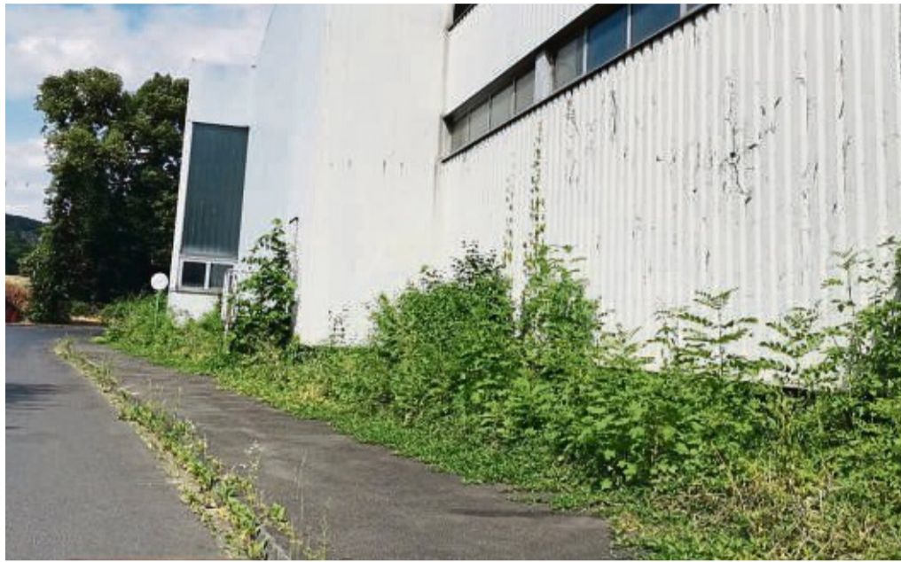
Stadt Sontra informiert: Straßenreinigung und der Durchführung von Pflegemaßnahmen.

Nach den Vorschriften der Satzung über die Straßenreinigung der Stadt Sontra in der zurzeit geltenden Fassung sind Sie verpflichtet, die öffentlichen Verkehrsflächen vor Ihrem Grundstück, insbesondere die Gehwege, Straßenrinnen und Einfluss-