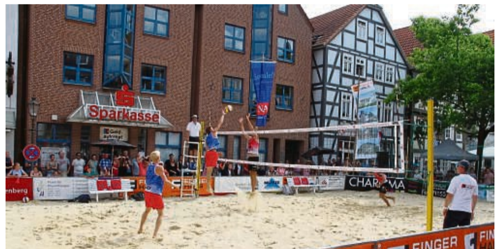
Sparkassen Beach-Cup: Vor historischer Kulisse auf dem Obermarkt wird es wieder hochklassigen Beachvolleyball-Sport geben.

Der Frankenger Beach-Cup ist das höchstrangige Turnier in Hessen und bietet den Teams die Möglichkeit, wertvolle Punkte für die DVV-Rangliste zu sammeln, die zur Qualifikation für die Deutschen Meisterschaften am Saisonende in Timmen-