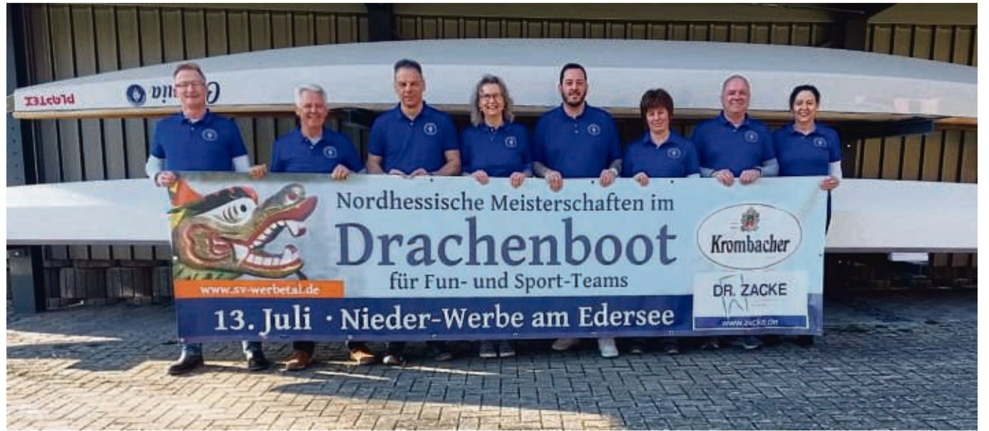
Der SV Werbetal freut sich auf das nächste Drachenbootrennen.

Für IHK-Mitgliedsunternehmen ist die Teilnahme kostenfrei, Nicht-Mitglieder zahlen 50 Euro. Eine Anmeldung ist bis Montag, 24. Juni, unter www.ihk.de/kassel-marburg/veranstaltungen erforderlich.