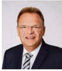
Landrat Winfried Becker.

Schwalm-Eder – Was bewegt die Kinder im Landkreis? Welche Themenschwerpunkte würden sie setzen, wenn sie selbst entscheiden könnten? Der Fachbereich Jugend und Familie des Schwalm-Eder-Kreises möchte das herausfinden und ruft deshalb Schüler, die eine zweite oder dritte Klasse besuchen, dazu auf, sich für ein Projekt zur politischen Partizipation im Landkreis zu bewerben.