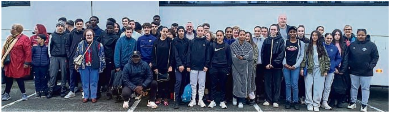
Die Partnergemeinde Dreux war in Melsungen zu Gast: Neben einem lockeren Programm trugen die Jugendlichen die Rückspiele aus dem vergangenen Jahr aus.