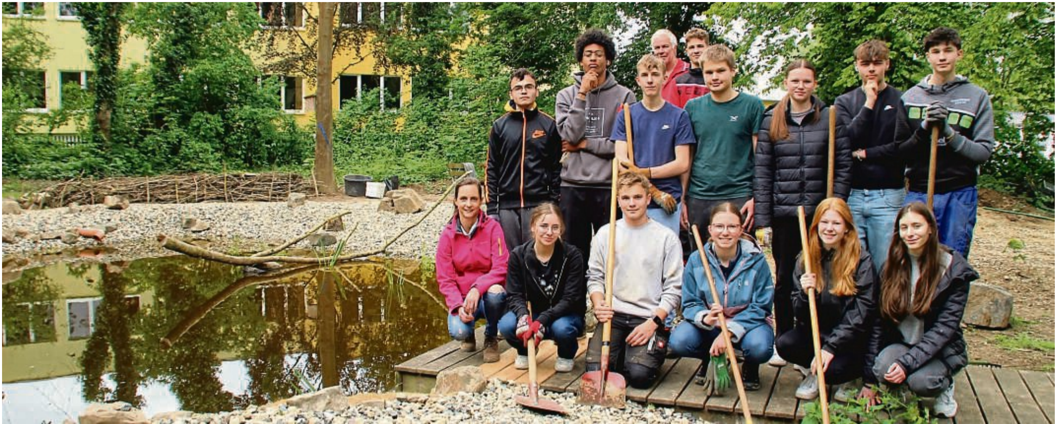
Gruppenbild am neu gestalteten Schulteich, aus dem ein Biotop entstanden ist: Unser Bild zeigt nur einen Teil der Unterstützer. Der Schulgarten ist nur während der Schulzeiten geöffnet.