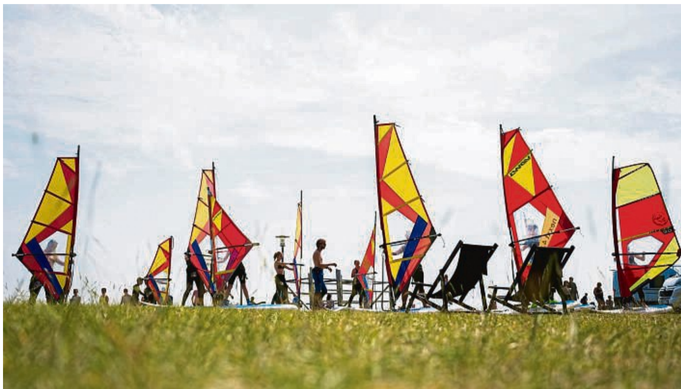
Im Winter eher nicht gefragt, im Sommer umso mehr: Surflehrer.

Ist die Beschäftigung auf maximal drei Monate oder 70 Arbeitstage im Kalenderjahr begrenzt und liegt der Lohn oberhalb der Minijob-Grenze von 538 Euro im Monat, kann