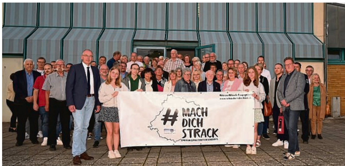
Auch die Gemeinde Wabern macht sich „strack“: Das Wort „strack“ aus der Mitmach-Kampagne stammt aus dem Landkreis. Es bedeutet „geradestehen“.