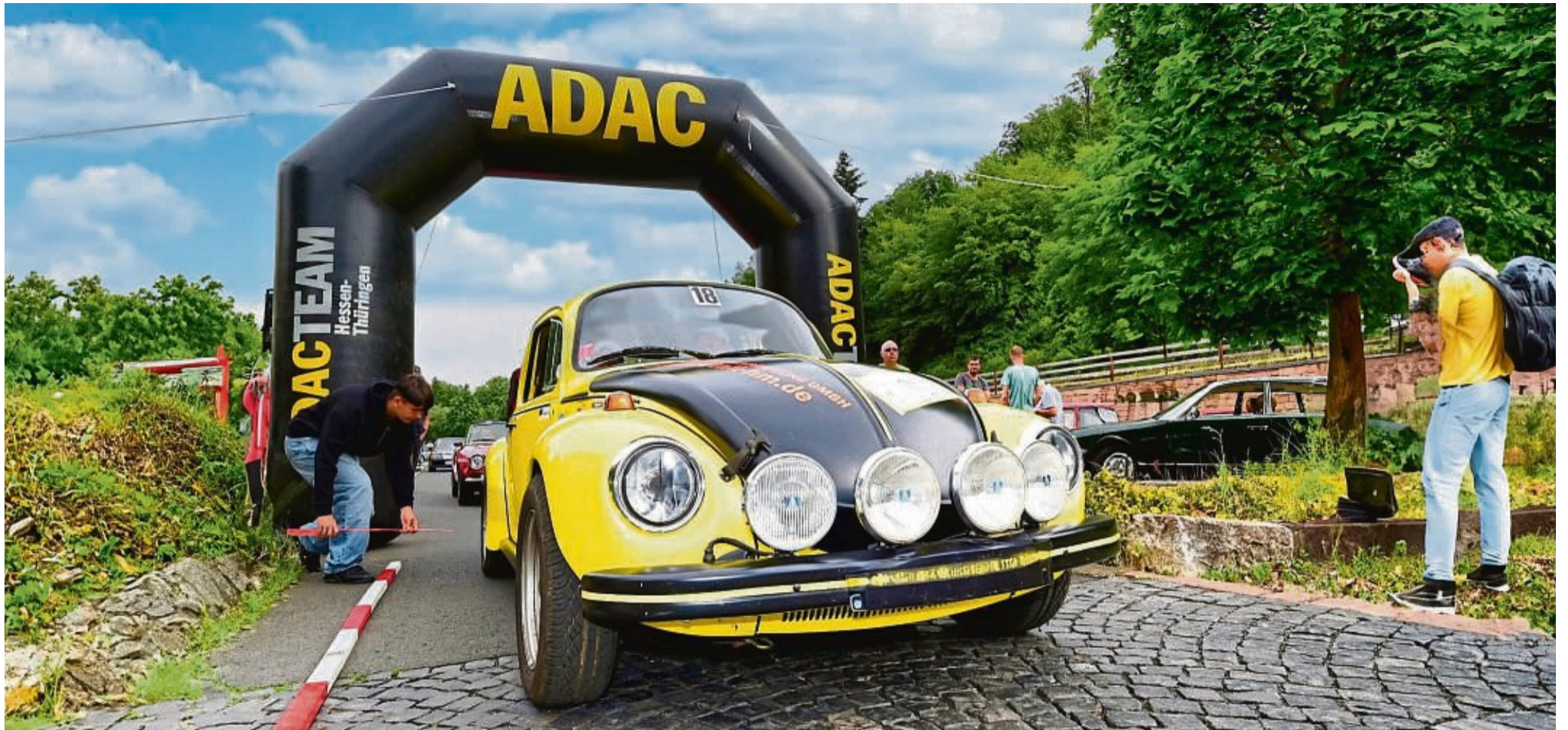
Ein Hingucker: Das Foto zeigt einen getunten Käfer 1303 RS am Start neben dem Merxhäuser Klostermuseum bei einer früheren Oldtimer-Ausfahrt. Der schwarz-gelbe VW, der auch bei Rallyes eingesetzt wird, nimmt auch an der kommenden Tour wieder teil.