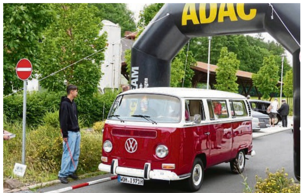
Läuft wie am ersten Tag: Der VW-Bus T2 von Dirk und Silke Wölk aus Wolfhagen ist 53 Jahre alt.

touristischen Aufgabenstellung und einer Wandergruppe wählen. Fahrer, die nur entspannt wandern wollen und somit nicht an der Pokalwertung teilnehmen, erhalten am Ziel ein Erinnerungs-