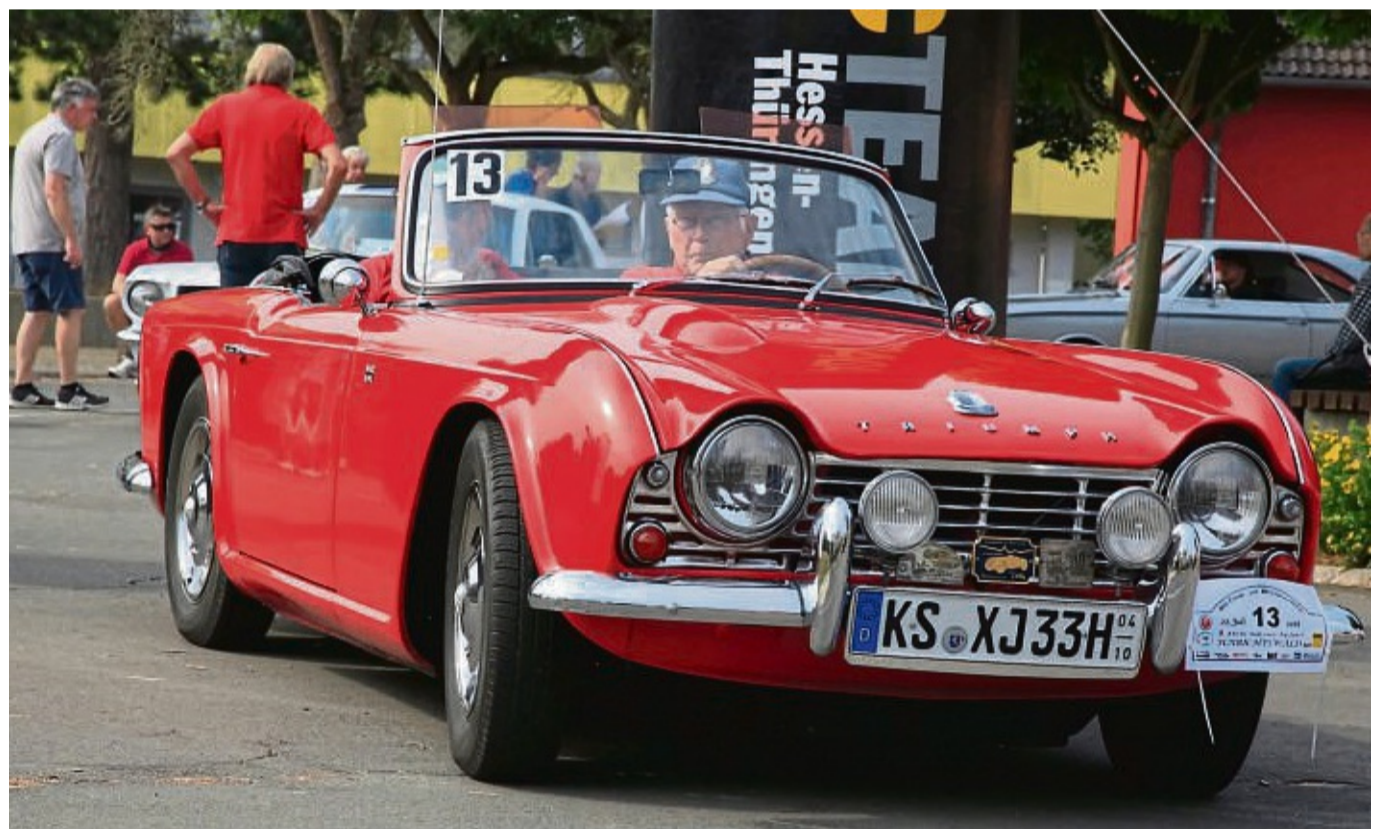
Knallroter Engländer: Heinz Küstner und Beifahrer Gerhard Tonn aus Naumburg mit einem Triumph TR 4 aus dem Jahr 1964 freuen sich auf die Ausfahrt des MSC Emstal.

Auf der etwa 120 Kilometer langen Gesamtstrecke haben die Fans besonderer Autos die Möglichkeit, die Oldies aus der Nähe zu bewundern, wenn sie sie durch Orte wie