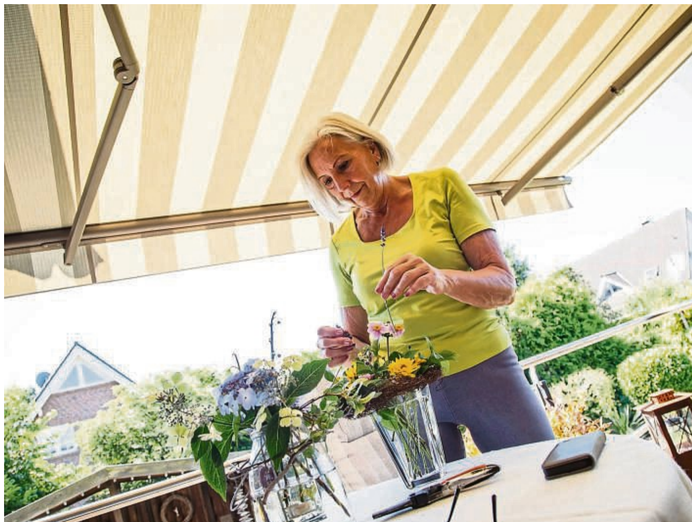
Markisen sind vor allem für Balkone oder Terrassen gedacht.

Und es gibt Alternativen: Sogenannte Raffstores etwa, also bewegliche Sonnenschutzsysteme mit Lamellen, die in der Regel aus Aluminium bestehen. Mit ihnen lässt sich der Lichteinfall gezielt steuern, weshalb Raffstores vor allem für Räume mit Südausrichtung geeignet sind: Bei entsprechender Einstellung gelangt dann dennoch Tageslicht in die Räume.