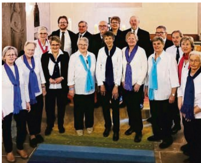
Projektchor: Frauen und Männer des Chores aus Udenhausen und des Gesangsvereins Burguffeln haben sich für die kulturelle Woche zusammen getan.