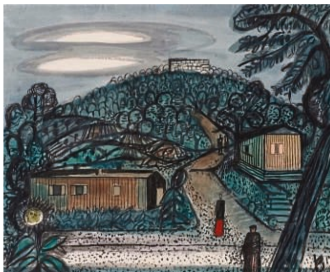
Den Burgberg in Grebenstein malte documenta-Gründer Arnold Bode, als er in Grebenstein lebte.

BILD: ARNOLD BODE