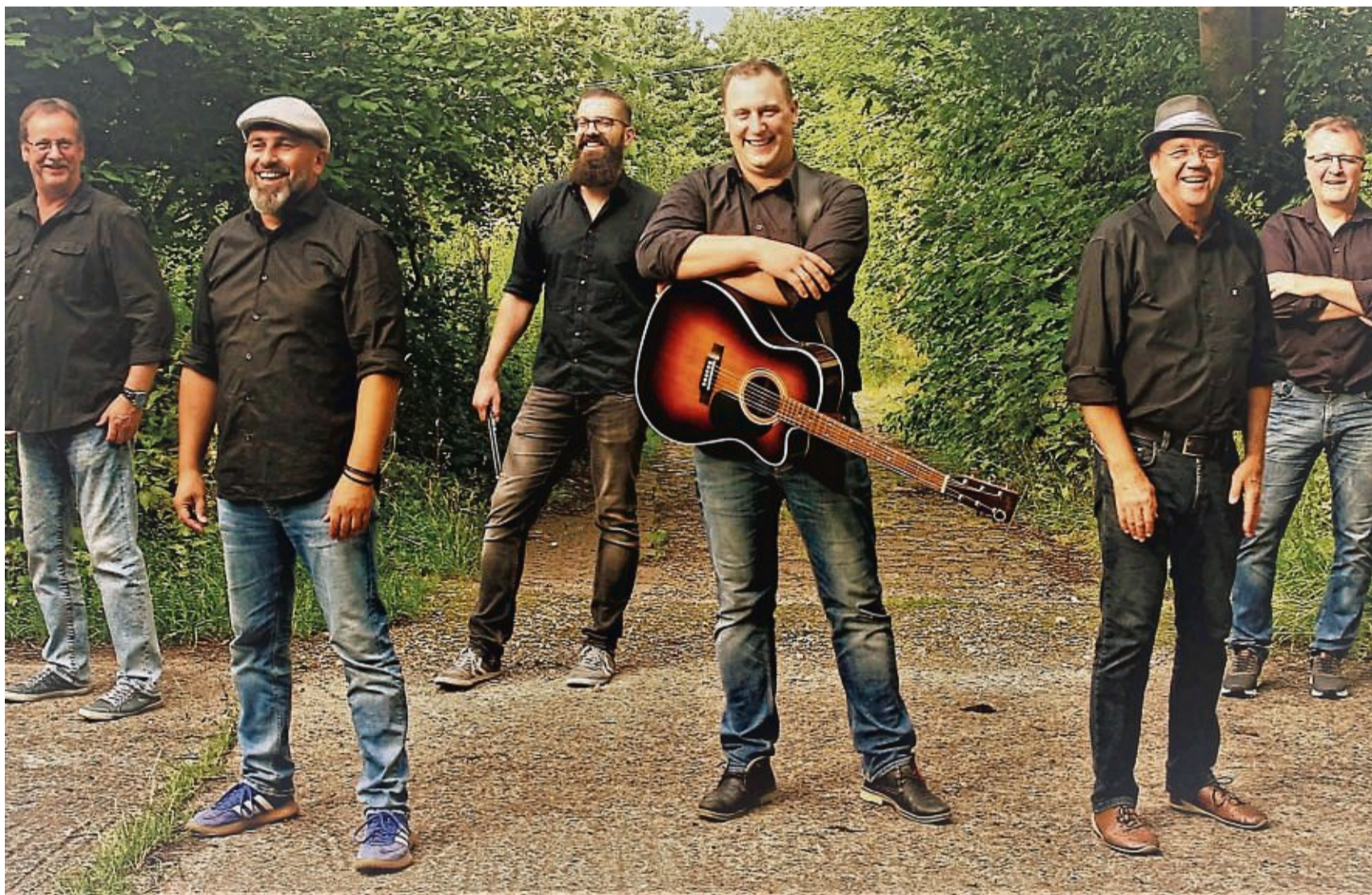
Feiern 20-jähriges Bandjubiläum: Die Grebensteiner Band „Pasch 4“ tritt bei der kulturellen Woche auf dem Marktplatz auf.