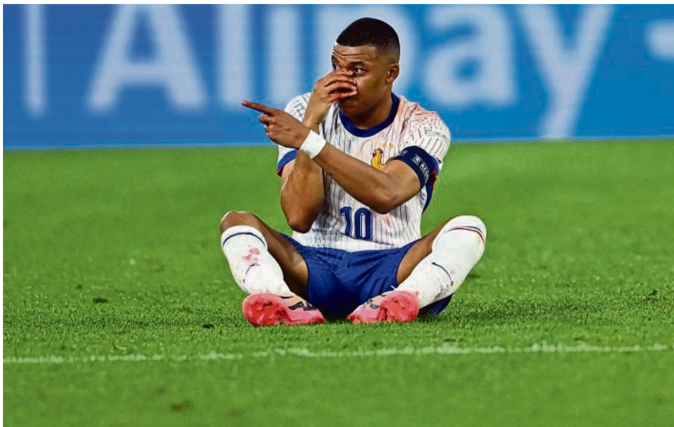
Diagnose Nasenbeinbruch: Frankreichs Kylian Mbappé sitzt beim Spiel gegen Österreich auf dem Rasen und hält seine verletzte Nase.