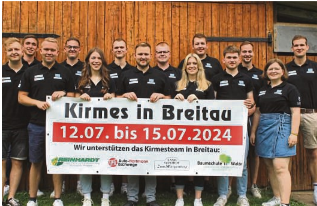
Sind groß aufgestellt: das Kirmesteam aus Breitau.

Das Kirmeswochenende startet am Freitag, 12. Juli. Der Abend startet ab 19 Uhr mit einem Heimatabend, der in den vergangenen Jahren bereits sehr gut ankam. Nicht nur Dorfeinwohner, sondern auch Gäste aus der Umgebung sind hierzu eingeladen, die sich auf unterschiedlichste Programmpunkte freuen können. Verschiedene Vereine präsentieren bei dem Heimatabend ihre Auftritte, die sie schon Wochen vorher ein-