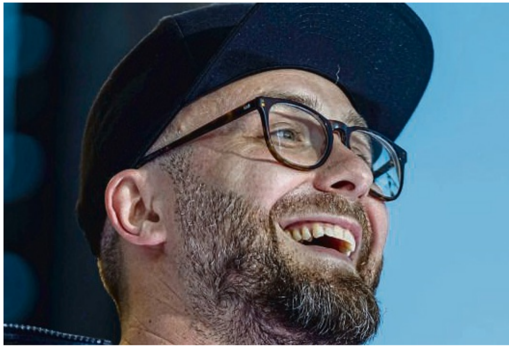
Haarfarbe: Kappe – so steht es in der Biografie auf ProSieben: Seit 2015 ist der Mark Forster bei dem Sender als Coach von „The Voice Kids“ und „The Voice of Germany“. Nun tritt er im Juli in Bad Sooden-Allendorf auf.

(lacht) Singen im Stadion, das hat ja schon Helene Fischer beim Pokalfinale probiert und auch David Guetta... Ich glaube (lacht), selbst wenn ich gefragt werden würde, würde ich da zweimal drüber nachdenken. Zum Glück wurde ich nicht gefragt (lacht). Ich habe Tickets für ein paar Spiele, darf da hin und habe einfach diesen tollen Mo-