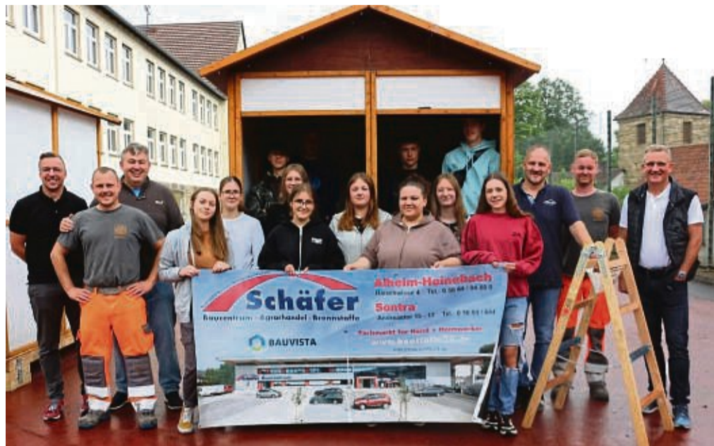
„Gemeinsam stark“: Sorgen gemeinsame für die Renovierung der Weihnachtsbuden.