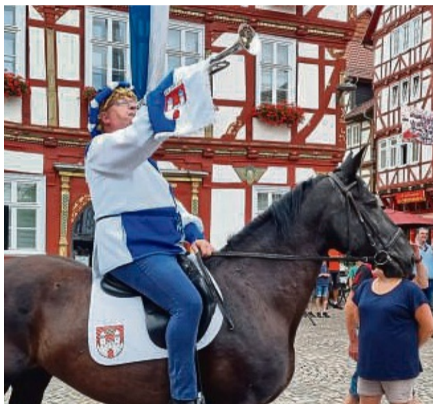
Einer der Höhepunkte des Festes, hier aus dem Jahr 2023: der Johannisfest-Reiter.

spielen Musikgruppen für jedermanns Geschmack – und für Essen und Trinken ist na-