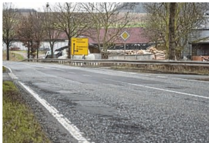
B 400: Hessen Mobil saniert beschädigte Fahrbahn bei Breitau.

Zum Schutz der Beschäftigten der Baustelle sowie der Verkehrsteilnehmenden werden die Arbeiten unter Vollsperrung ausgeführt, die zunächst auf der B 400 ab dem Abzweig der Kreisstraße 28 in Richtung Sontra bis nach