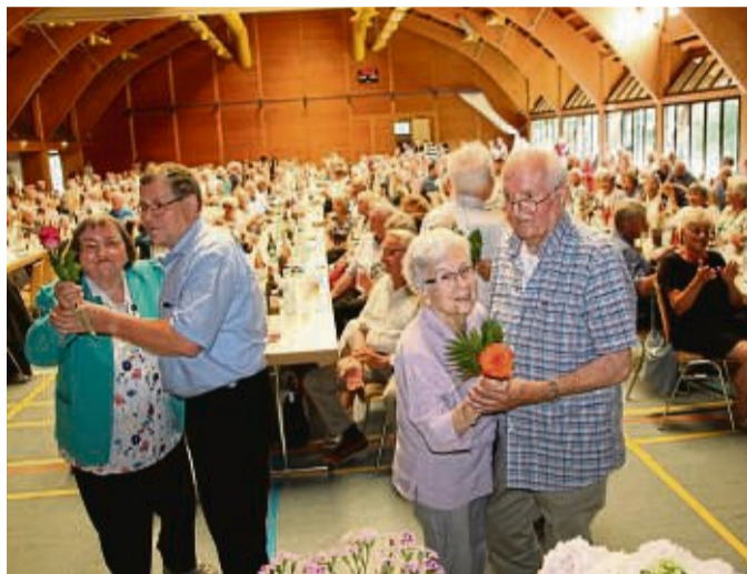
Jubilare tanzen Walzer: Die Eheleute, die im seit dem vorherigen Kreissenientag Goldene und Diamantene Hochzeit hatten, waren zum Paartanz in der Vierbuchenhalle aufgerufen worden.