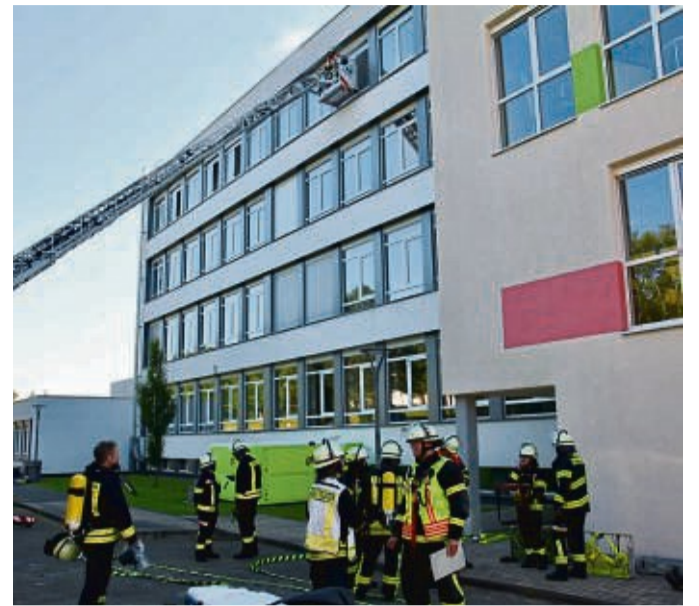
Die Feuerwehren üben an der Radko-Stöckl-Schule: Immer mehr Einsatzkräfte rückten an. Mehr als 50 Einsatzkräfte von Feuerwehr und DRK Ortsverein Melsungen waren dabei.