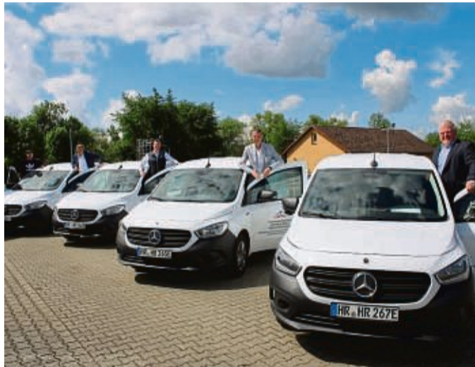
Übergabe: Die Kläranlagen in Homburg, Frielendorf, Knüllwald und Schwarzenborn haben nun E-Fahrzeuge.