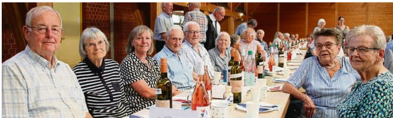
Es wurde viel geschmuddelt an den Tischen: Auch an dem Tisch dieser Gruppe aus Körle herrschte gute Stimmung.