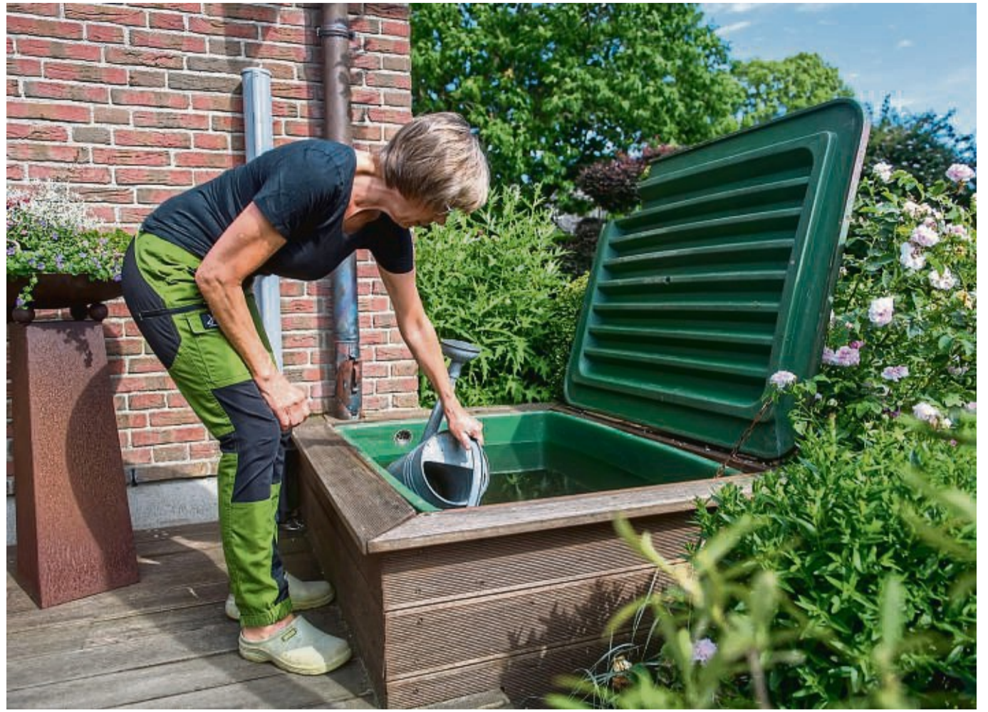
Morgen- oder Abendstunden sind die besten Zeiten, um Garten- und Balkonpflanzen zu gießen.

5. Regenwassernutzung im Haus: Die Installation einer Regenwasser-Sammelanlage oder Zisterne kann den