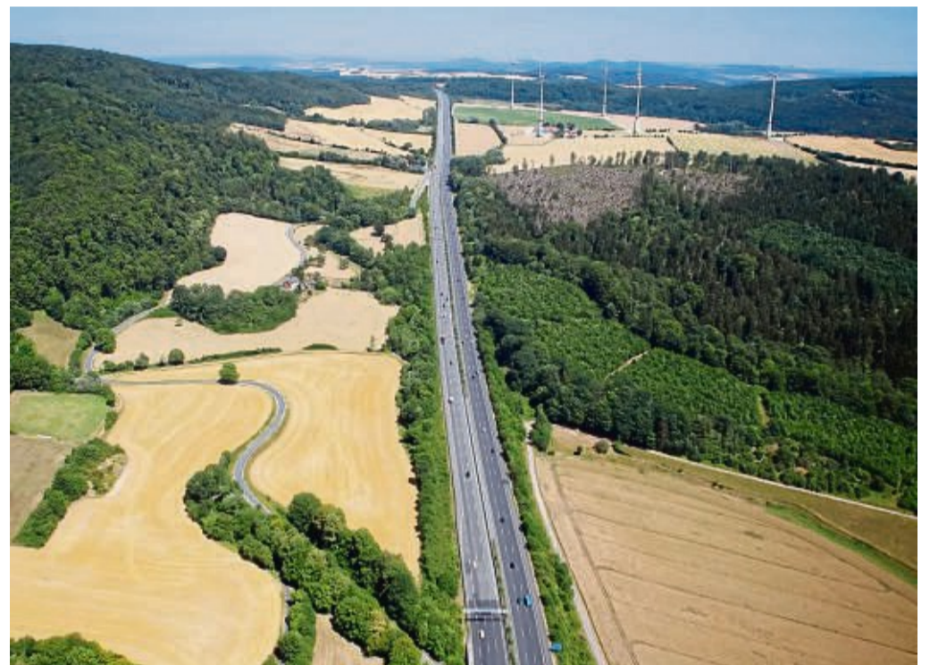
A7: Zehn Kilometer zieht sich eine Baustelle von Hedemünden bis zum Dreieck Drammetal.

Baustelle auf A7: Höchstgeschwindigkeit von 60 km/h