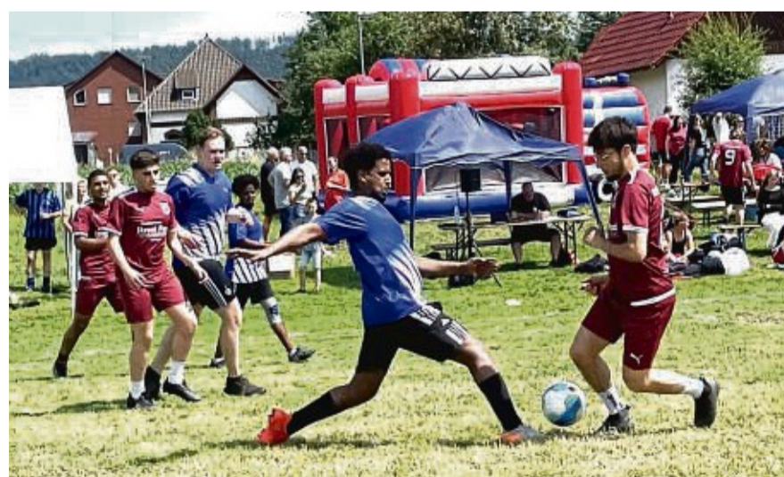
Das Spiel der Firmenmannschaft WMU und des Bonaforthers Sportvereins.