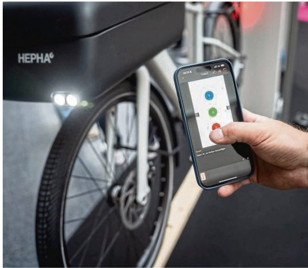
Im Vorderrad eines Prototyps des Münchner Herstellers Hepha ist ein Doppelschloss von 2Lock verbaut. Es kann per Bluetooth programmiert werden und im Falle eines versuchten Diebstahls buchstäblich um Hilfe rufen.

Ab diesem Sommer hat der deutsche Gesetzgeber den Weg freigemacht für Blinker am Fahrrad, sofern sie von einem Akku elektrisch gespeist werden. Systeme wie Turntec (199 Euro) vom Lichtspezialisten Busch & Müller stehen grundsätzlich auch für den nachträglichen Einbau bereit, der allerdings recht aufwendig und damit teuer ausfallen dürfte. „Das ist ein Thema, dass erst zur nächsten Eurobike richtig Fahrt aufnehmen wird, wenn viele Hersteller das in ihren neuen Rädern für die Saison 2026 anbieten“, sagt Fahrrad-Experte Gunnar Fehlau. Bis dahin könnte der Helm „Hyp-E“ (299 Euro) von Abus weiter-