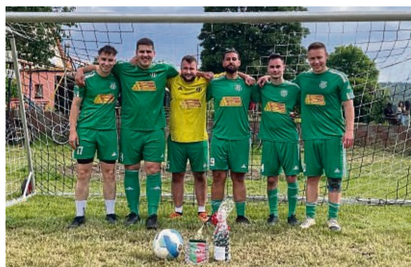
Die strahlenden Sieger: Die listigen Lurche vom TSV Jahn Hemeln gewannen beim Dorfturnier in Gimte.

Insgesamt standen 34 Spiele von jeweils acht Minuten an. Neben den Mannschaften waren viele Gimter und auswärtige Gäste als Zuschauer gekommen, die die einzelnen Teams bei Speisen und Ge-