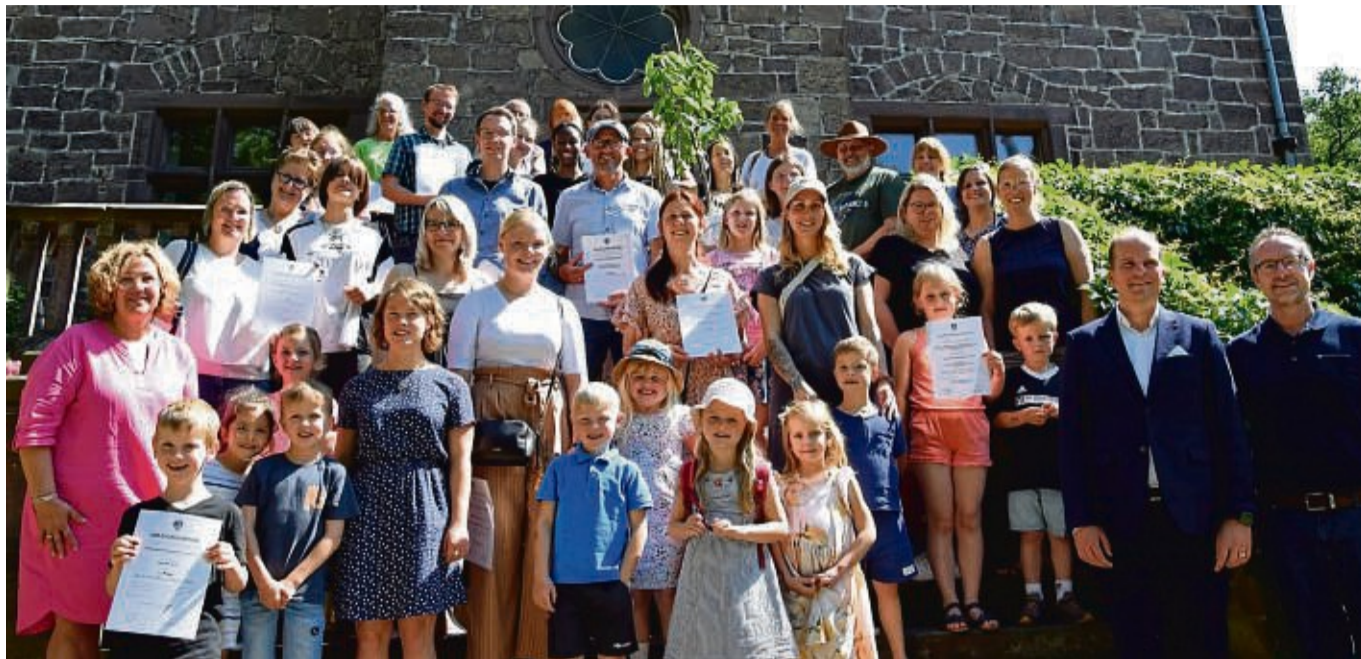
Alle 13 Bewerbergruppen nach der Preisverleihung des 30. Umweltpreises.

13 Gruppen, darunter Schulklassen, Vereine, private Initiativen und das erste Mal sogar ein Dorf bewarben sich mit ihren nachhaltigen Konzepten für den 30. Umweltpreis. In der Kategorie Kinder bis elf Jahre gewann der Awo-Waldkindergarten Hollefüchse aus Hessisch Lichtenau. Mit Bratpfannen und Töpfen wird im Sandkasten der Kindertagesstätte (Kita) gespielt. Nur Schippen wurden als Spielzeug für den Sandkasten neu angeschafft. Die Kita versorgt sich bewusst mit gebrauchten Spielmaterialien und ausrangierten Gegenständen, die zu Sandkastenspielzeug umfunktioniert werden. Auf dem Weg zum öffentlichen Spielplatz in Hessisch Lichte-