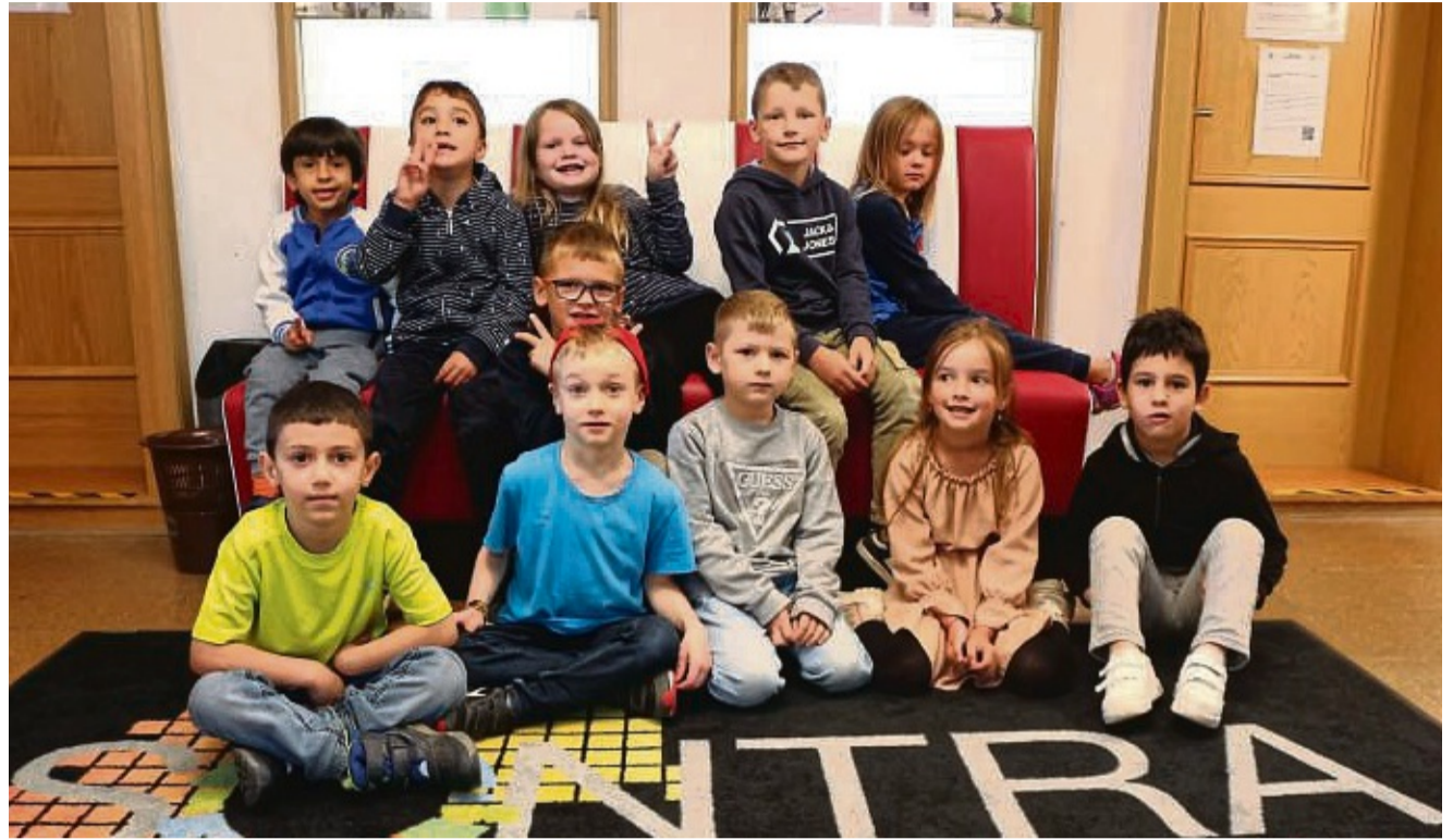
Erlebten zusammen einen spannenden Tag: die Vorschulkinder der katholischen Kindertagesstätte vor dem Bürgerbüro im Rathaus.