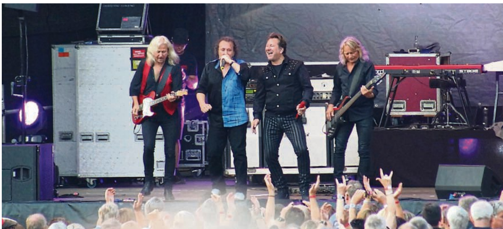
Sie kommen zurück: Bereits im Jahr 2019 (siehe Foto) spielte die DDR-Kultband Karat am Wanfrieder Hafen. Am 27. Juli geben sie dort ihr nächstes Konzert.

Dort kann unter Aufsicht von Einweisern geparkt werden. Mit wenigen Schritten kommt man über die für den Autoverkehr gesperrte Werrabrücke zur Konzertlocation. Dort könnten gut die Hälfte der Besucher ihre Autos ab-