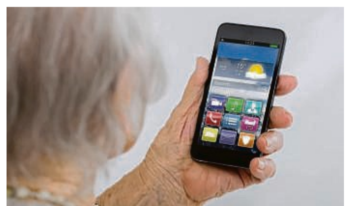
Awo-Ortsverein Eschwege bietet Kurs zur Smartphone-Nutzung an.

Anmeldungen werden erbeten unter Telefon 0170/5 62 29 56.