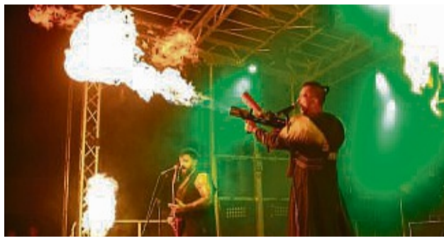
Feuer und Flamme für das Silobrand-Festival: Im Vorjahr sorgte die Band Mantra für einen feurigen Abschluss.