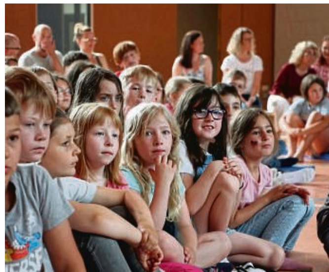
Verfolgten gespannt die Veranstaltung: Die Kinder der Astrid-Lindgren-Schule in Malsfeld.