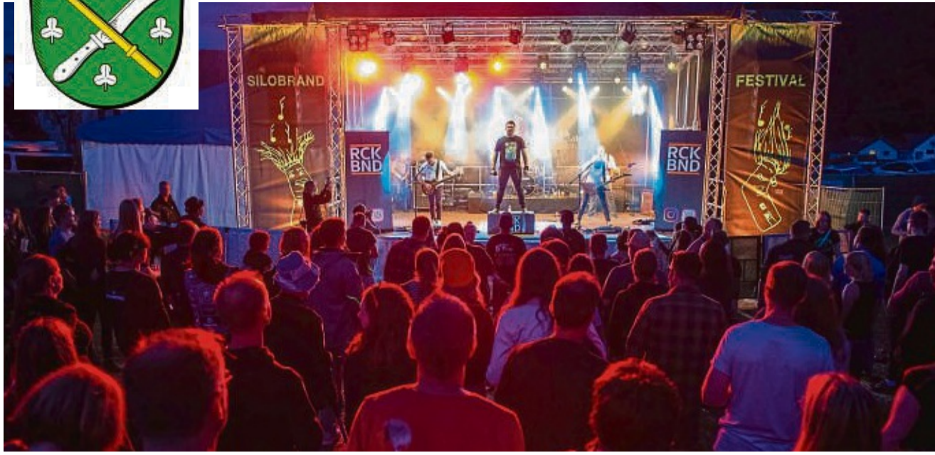
Besuchermagnet: In den vergangenen Jahren lockte das Silobrand-Festival stets viele Menschen nach Wichte.