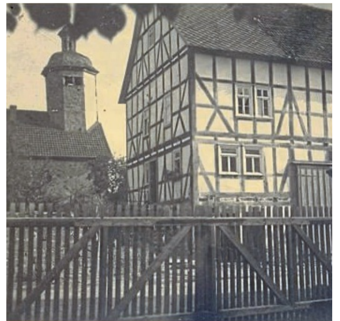
Marc Seibert schreibt ein Buch über Singliser Häuser: Das Foto zeigt sein Elternhaus im Oberdorffing, es handelt sich um die ehemalige Zehntscheune. Es entstand um das Jahr 1955.

Auch die Fotos, die bereits im Buch „Singlis – 100 Jahre Ortsgeschichte“ veröffentlicht wurden, werden benö-