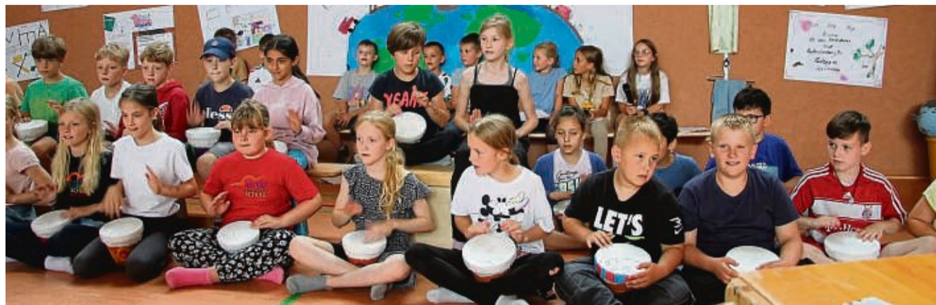
Die Trommelgruppe der Klassen 3 a und 3 b der Astrid-Lindgren-Schule in Malsfeld sorgt für Stimmung.

Schüler der Astrid-Lindgren-Schule stellen Projekte zum Umweltschutz vor