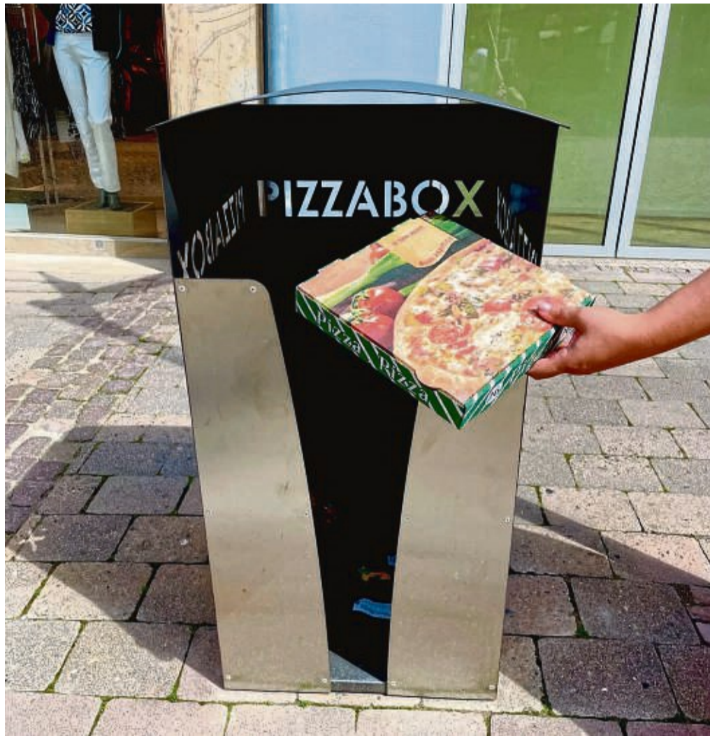
Am Stad in Eschwege hat der Bauhof zwei sogenannte Pizzaboxen installiert.

Die Kosten pro Pizzabox liegen laut Schäffer inklusive Montage bei rund 850 Euro