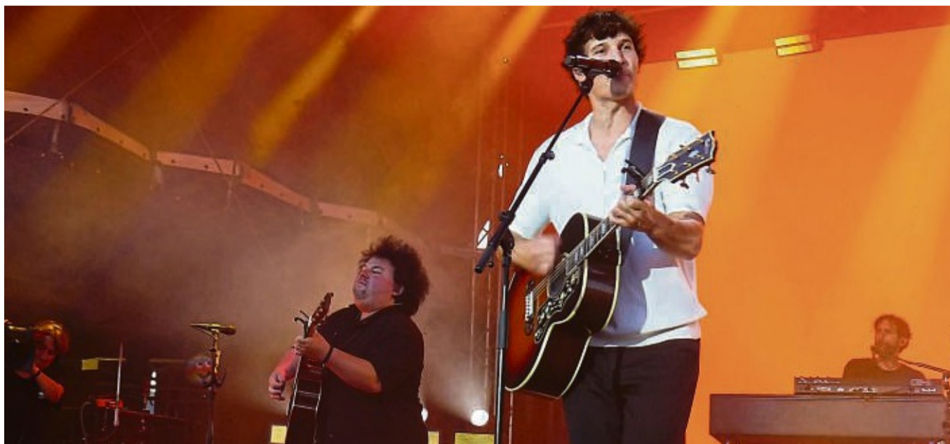
Frenetisch von seinen Fans gefeiert wurde der Sänger Wincent Weiss mit seiner Band beim Auftritt im Soundgarten in Bad Sooden-Allendorf.