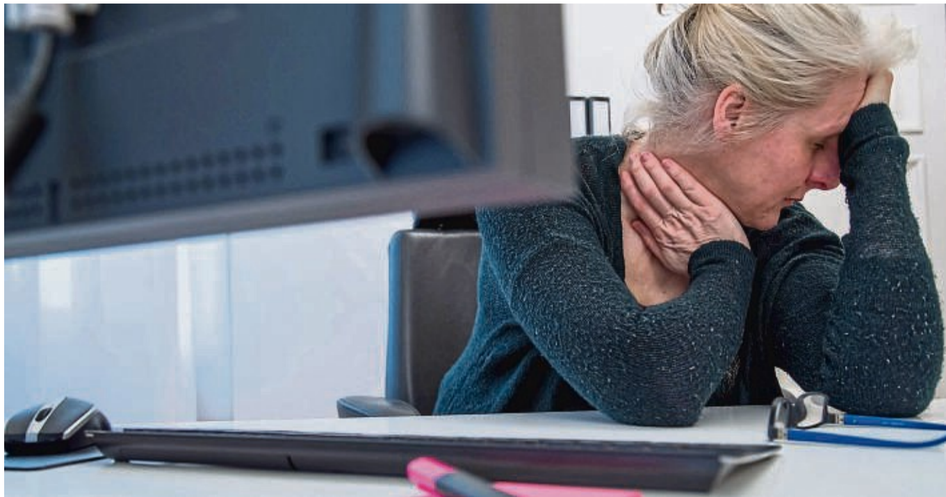
Jobfrust und keine Veränderung in Sicht: Viele Menschen trauen sich nicht, den Arbeitsplatz zu wechseln.

Andere Ursachen können auch in der Familiengeschichte liegen. Dort gibt es womöglich Gründe, warum man an gegebenen Dingen festhält, obwohl sie einem nicht guttun. Solche Verhal-