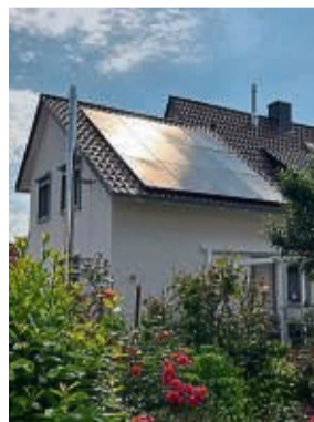
Bringt die Sonne auf Ihr Dach: Adler Solar.

ADLER Solar Meißner bietet den Kundinnen und Kunden, auf deren Dach