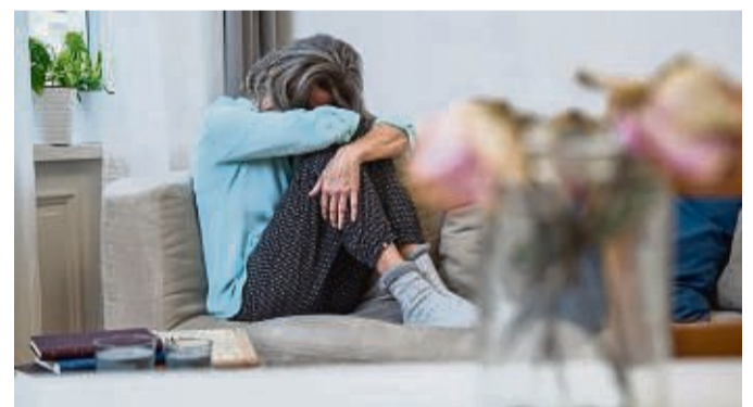
Frauen, die im Netz auf Heiratsschwindler hereingefallen sind, fühlen sich bei der Entdeckung der Wahrheit meist nicht nur belogen und um Geld betrogen, sondern zweifeln an ihrer Menschenkenntnis.