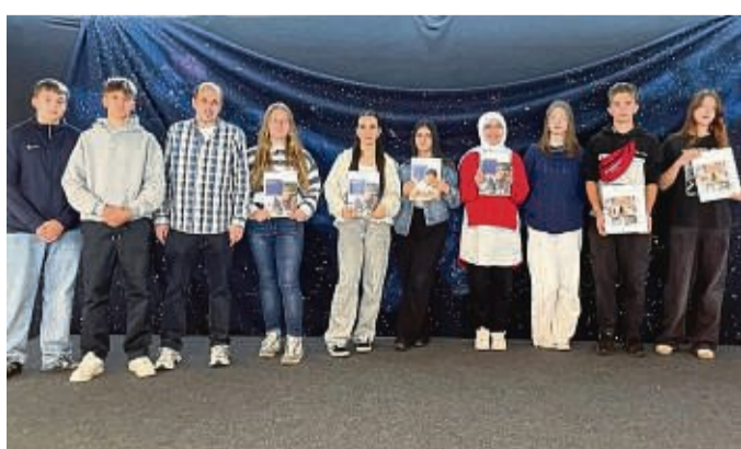
Schnuppern ins Bankgeschäft rein: Neuntklässler erkunden die VR BANK in Bad Hersfeld.

Eine Gemeinschaftsaktion der Sontraer Schulen, der untenstehenden Unternehmen und des