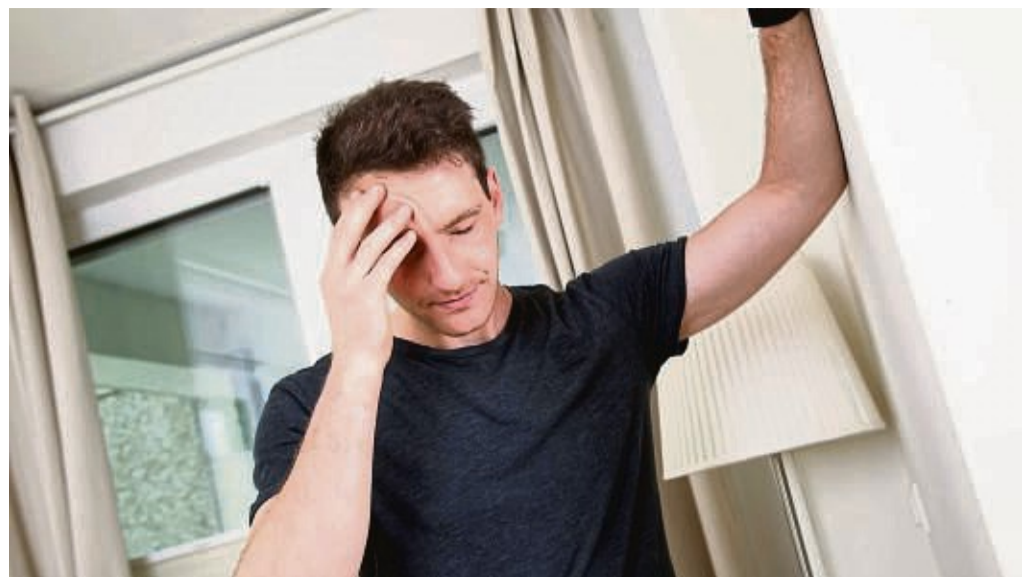
Schwindel, Unwohlsein oder Migräneattacken: Ändern sich Luftdruck, Luftfeuchtigkeit und Temperatur, kann sich das negativ auf unseren Körper auswirken.

Und dort liegt auch schon der Schlüssel, um Wetterfühligkeit abzumildern. Martin Scherer rät zu Bewegung an der frischen Luft, genauer ge-