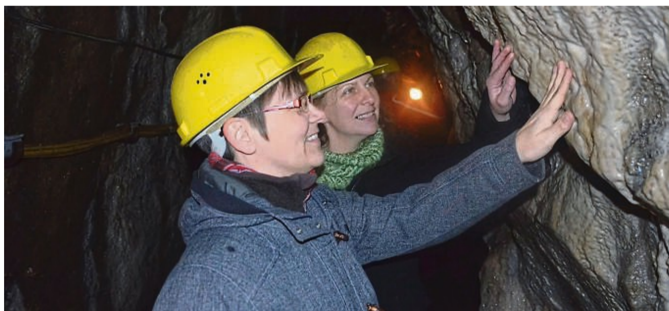
Geologie zum Anfassen: Seit dem 16. Jahrhundert wurde in der Grube Gustav bei Abterode Kupferschiefer abgebaut. In Grubenführungen kann man die ehemalige Abbaustätte besichtigen.

Am Samstag und Sonntag, 24. und 25. August, startet jeweils um 15 Uhr eine einhalbstündige Sonderführung zu Salz und Sole. Die Teilnahme (für maximal 20 Personen, für Kinder ab acht Jahren) ist