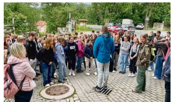
Mittelaltertage der 7. Jahrgangsstufe von der Adam-von-Trott-Schule.

Von Mittwoch bis Freitag konnten die Siebtklässlerinnen und Siebtklässler dann an verschiedenen Stationen auf dem Schulgelände weitere Merkmale des mittelalterlichen Lebens vertiefen: Es wurde geschmiedet, gefilzt und gekocht, aber auch die Bedeutung von Kleidung im Mittelalter, von Bienen und deren Honig sowie die Bedeutung verschiedener Kräuter wurden praxisnah und handlungsorientiert entdeckt.