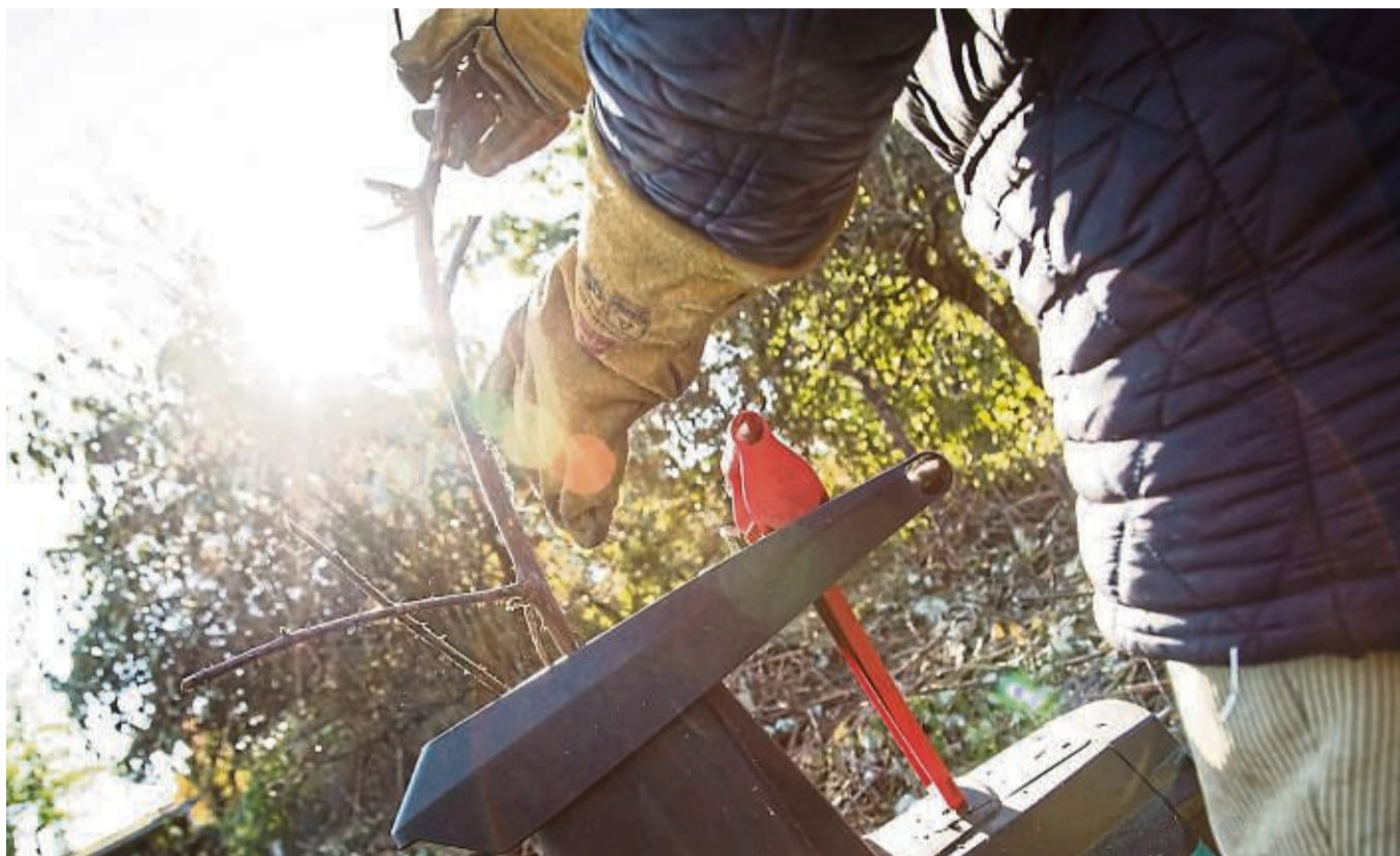
Wer Äste, Strauchschnitt und andere Pflanzenreste aus dem Garten zerkleinern will, kann dazu auf einen Häcksler zurückgreifen. Stiftung Warentest hat 18 Geräte getestet.

18 Häcksler, darunter acht Messerhäcksler, neun Walzenhäcksler und ein Modell mit Turbine, das Walzen- und Messertechnik in sich vereint, haben die Tester auf Häckeln, Handhabung, Haltbarkeit und Sicherheit untersucht („test“, Ausgabe 08/2024) – und insgesamt mehr als acht Tonnen Pflanzen zerkleinern lassen. Von den Messerhäcklern kam dabei keines der Modelle über ein „Befriedigend“ hinaus. Fünf von ihnen erreichten diese Note – darunter das einzige Gerät mit Akku im Test, das sich auch für Gärten ohne Stromanschluss eignet. Drei der getesteten Messerhäcksler sind