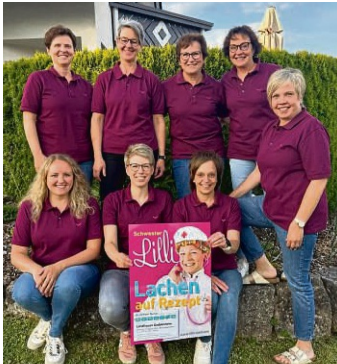
Der Teamvorstand der Goddelsheimer Landfrauen mit dem Plakat für den Comedy-Abend mit „Schwester Lilli“ am 31. August.

Karten können an allen Vorverkaufsstellen für 22 Euro und an der Abendkasse für 25 Euro pro Person erworben werden. Der Vorverkauf läuft im Edeka-Markt in Goddelsheim, bei der Waldeck-Frankenberger Bank in Goddelsheim und unter der E-Mail-Adresse landfrauen.goddelsheim@gmx.de .