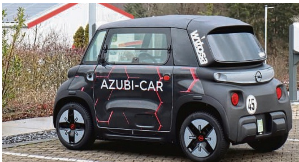
Mit dem Azubi-Car der Firma Witosa darf man schon ab 15 Jahren fahren.