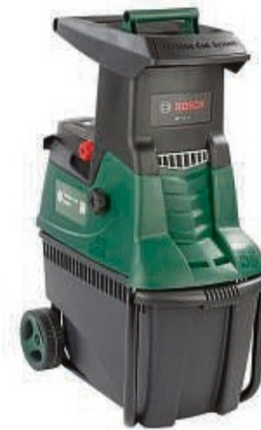
Der Testsieger Bosch AXT 25 TC häckselte als einziger „sehr gut“ (Note 1,9).

Testsieger ist der ebenfalls insgesamt „gute“ Häcksler mit Schneideturbine von Bosch (AXT 25 TC). Das 480 Euro teure Gerät, das Messer- und Walzentechnik vereint, hat einen entscheidenden Vorteil: Es kam im Test mit allen Arten von Pflanzen klar