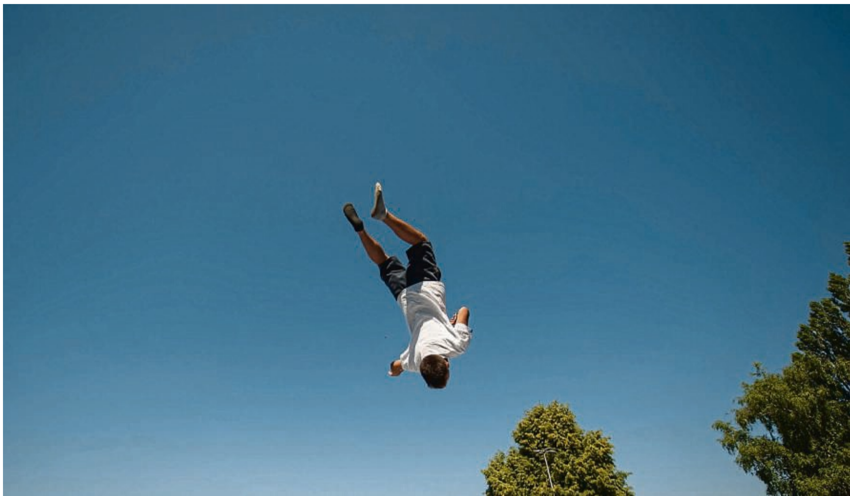
Hoch hinaus! Trampoline bei den Olympischen Spielen machen Höhen von über acht Metern möglich.

Zeit, sich selbst etwas herauszufordern. Wer nun an