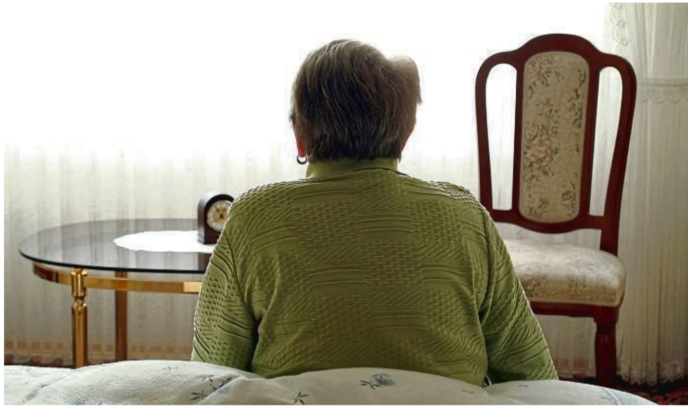
Kleine Maßnahmen und einfache Hilfsmittel können das Unfallrisiko für Demenzkranke in den eigenen vier Wänden erheblich reduzieren.

Müssen etwa Warm- und Kaltwasser separat aufgedreht werden, drohen Verbrühungen, wenn die demenzkranke Person den falschen Hahn erwischt. Daher ist es sinnvoll, am Wasserhahn gut sichtbare Markie-