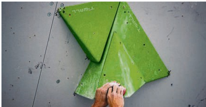
Fingerkraft ist gefragt! Beim Bouldern müssen aber auch Beine und Rumpf ordentlich arbeiten.