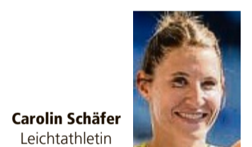
Carolin Schäfer Leichtathletin

Bad Wildungen - Der letzte Höhepunkt in der Laufbahn von Carolin Schäfer sollen die Olympischen Spiele in Paris werden. Die Leichtathletin aus Bad Wildungen wird ihre Laufbahn nach dem Siebenkampf beenden, der am 8. und 9. August im Olympiastadion ausgetragen wird.