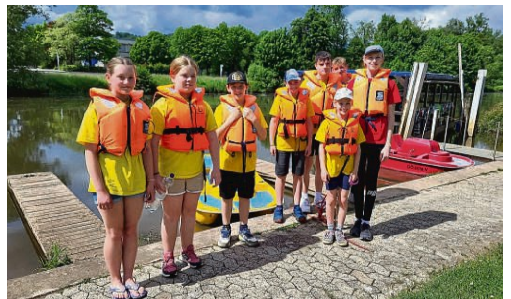
Beim Jugend Einsatz Team (JET) Übungscamp der DLRG Bebra.

Am Samstagvormittag stand die Wiederholung der Knoten an, danach Tretboot fahren auf der Fulda. Geplant wurde gleich ein Abschleppmanöver eines manövrierunfähigen Tretbootes vollbracht, da eines der Tretboote sich nicht mehr treiben ließ. Mit guter Disziplin, Zusammenarbeit und bereits in der Theorie erlernten Kenntnissen wurde dies er-