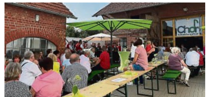
Tolles Sommerfest der Chöre auf dem Generationenhof.

Sie bringen Menschen zusammen, fördern Gemeinschaft und bereichern das kulturelle Leben. Man war sich einig: gemeinsames Singen macht Spaß und ist gesund. Den abendlichen Abschluss bildete ein Public Viewing in der Feierscheune, bei dem die Gäste ein Einzugs der deutschen Fußballnationalmannschaft ins EM-Viertelfinale bejubeln durften. red/dag