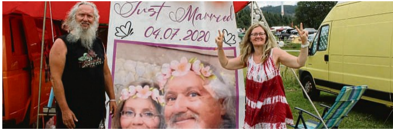
10 000 Hippies feiern beim Herzberg-Festival in Breitenbach

Im Zeichen von „Love and Peace“, von Liebe und Frieden, feiern seit Donnerstag rund 10 000 Hippies beim Herzberg-Festival in Breitenbach. Noch bis Sonntagabend bietet das Festival Auftritte von Rock-, Fol-k, Blues- und Reg-