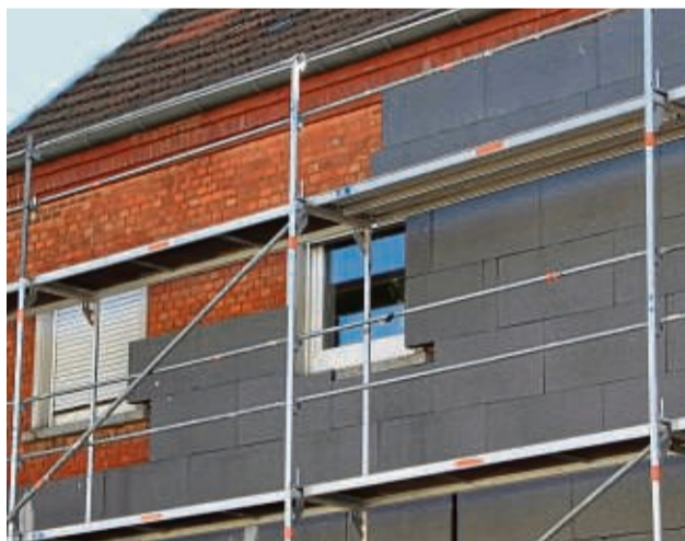
Eine gut gedämmte Fassade trägt dazu bei die Energieeffizienz zu verbessern.

Der effektivste Weg, Energie zu sparen, besteht darin, sie gar nicht erst zu verbrauchen. Eine gut durchgeführte Fassaden-