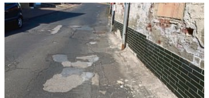
Die Kreisstraße K 40 in Heenes.