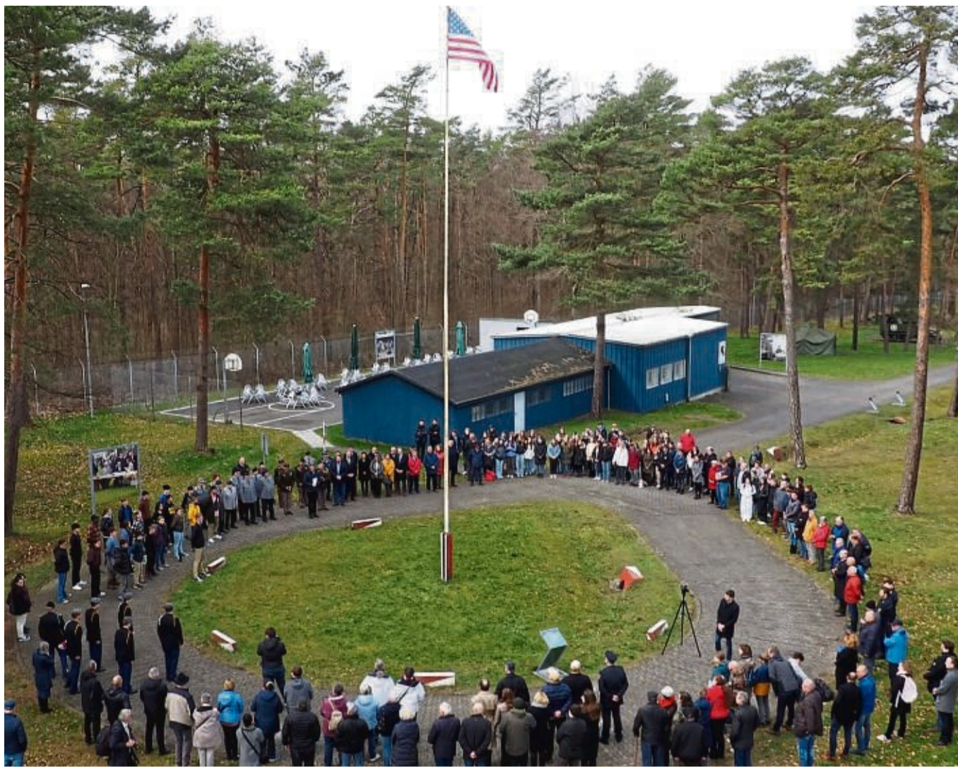
Über 300 Zuschauer waren dabei: Feier zur Last Border Patrol, der letzten amerikanischen Grenz-Patrouille mit Flaggenzeremonie im US Camp Pint Alpha.

Auf die Zusammenarbeit mit Bildungseinrichtungen, Bundeswehr und Bundespolizei wird besonderer Wert gelegt. „Die Synergieeffekte zwischen den Einrichtungen und dem außerschulischen Lernort Point Alpha sind beeindruckend. Vor allem die Schülerschaft möchten wir durch die Vermittlung von