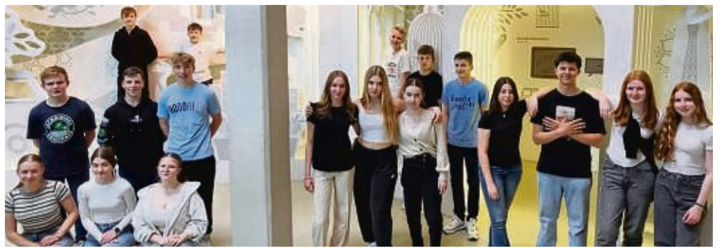
Die Gesamtschule Niederaula wurde beim hr2-Projekt Junges Literaturland Hessen 2024 als eine von insgesamt 3 Schulen in Hessen ausgewählt.