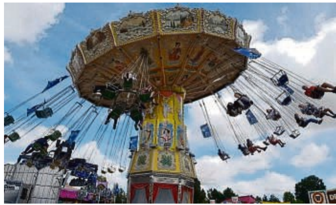
Bewegende Momente sind garantiert.