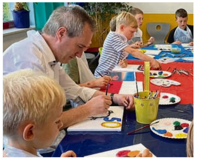
Malen mit Zahlen: Zu der bunten 50 gesell sich noch ein Ottifant.