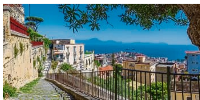
Die Amalfiküste in Italien ist ein Paradies für Romantiker.

Im Vergleich zum üblichen Urlaub sollen diese meist besonders romantisch und traumhaft sein sowie einzigartige Erinnerungen schaffen. Das Online-Reiseportal weg.de kennt Traumziele für Paare, die für eine unvergessliche Reise zu zweit sorgen und nicht nur frisch Vermählte auf Wolke sieben schweben lassen. Die Amalfi-