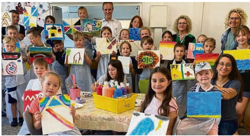
Kreativabteilung: Landrat Jürgen van der Horst stattete der Grundschule Villa R einen Besuch während der Ferienbetreuung ab.

Bundesweit werden täglich rund 15 000 Blutspenden benötigt.