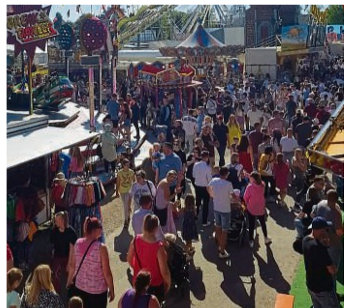
Ein reges Marktgeschehen wird auch in diesem Jahr erwartet.

und mit ihrem Wissen rund um das Kalb punkten, geht es beim Jungrindervorführungswettbewerb der Jungzüchter um das perfekte Vorführen des Rindes. Während des Wettbewerbes wird beispielsweise auf den Gang der Tiere und den Blickkontakt der Vorführer zu den Preisrichtern geachtet.