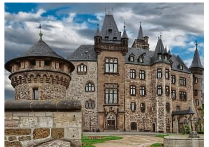
Schloss Wernigerode war auch schon Filmkulisse für den Kinderbuchklassiker „Das kleine Gespenst“.