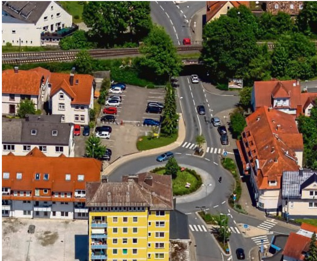
Bahnunterführung: Frühestens ab 2026 soll die Brücke über der Arolser Landstraße abgerissen und neu gebaut werden.

Eintrittskarten zum Preis von 10 Euro gibt es in der Hofapotheke, im städtischen Gästezentrum im Bürgerhaus, im Schulsekretariat und in der Buchhandlung Kirstein. Der Erlös des Konzertes ist für die Förderung der schulmusikalischen Arbeit bestimmt.