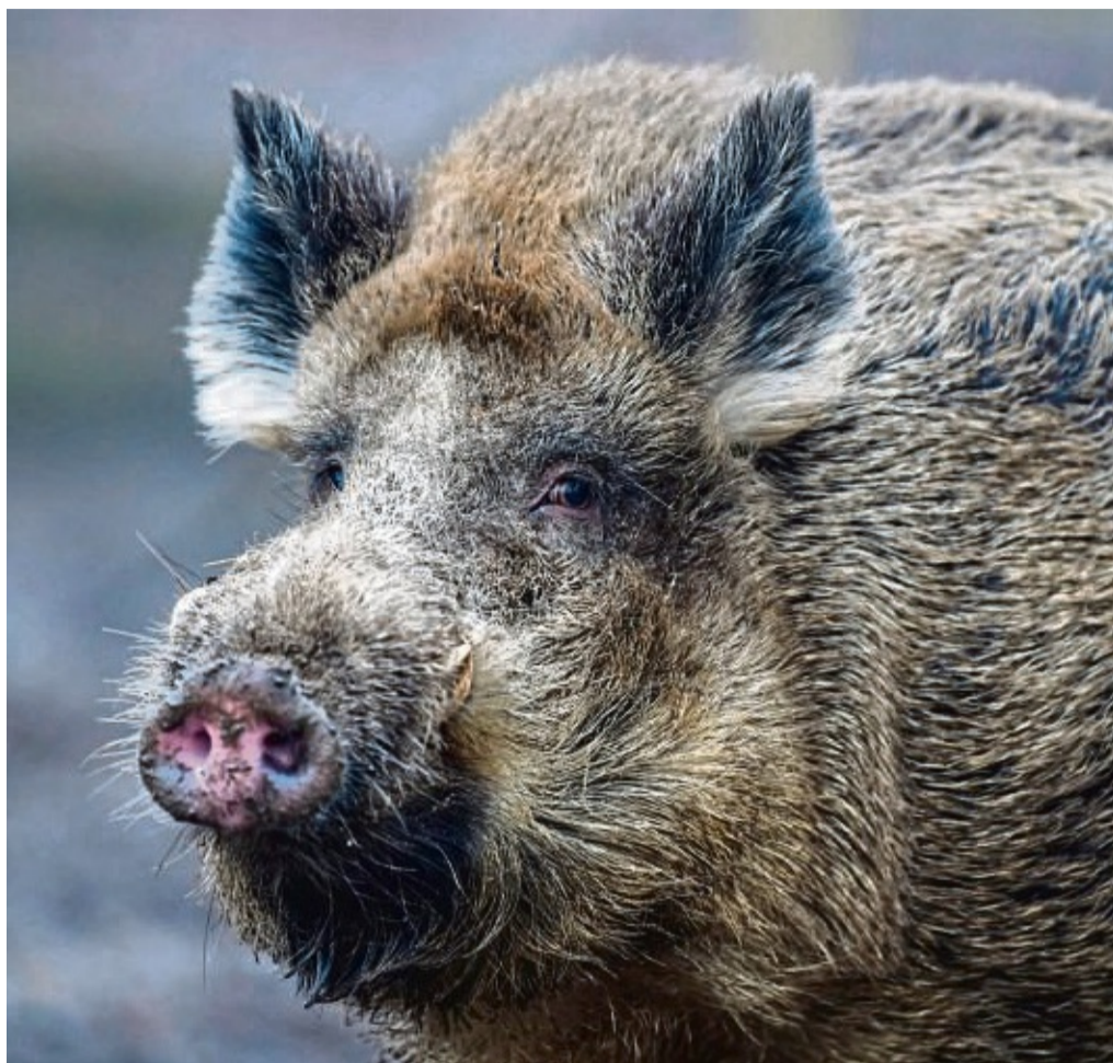
Die Afrikanische Schweinepest (ASP) ist eine hoch ansteckende Viruserkrankung. Derzeit gibt es keine spezifische Behandlung oder zugelassene Impfung dagegen.