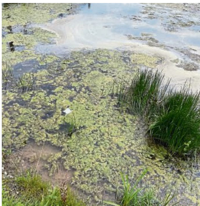
Ganze Teppiche bildet das Tausendblatt.

Bad Arolsen-Wetterburg – Am Twistesee konnte man in den vergangenen Jahren beobachten, wie sich immer früher im Jahr ein immer dickerer Teppich aus Wasserpflanzen auf dem See bildete. Bislang war die Stadt Bad Arolsen auf einen festen Miettermin eines Mähbootes angewiesen, doch nun kann sie nach der Anschaffung eines eigenen Mähbootes flexibel reagieren. Das Mähboot hat knapp 97 000 Euro gekostet. Die Hälfte des Betrages stammt aus einer Förderung über den „Europäischen Landwirtschaftsfonds für die Entwicklung des ländlichen Raumes (ELER)“, der auch vom Land Hessen mitfinanziert ist. Zur Ausstattung gehören auch ein Trailer und Zubehör. Das Mähen der Wasserpflanzen übernimmt das Team vom Betriebshof. „Das ist etwas anderes, als mit dem Aufsitzmäher Gras