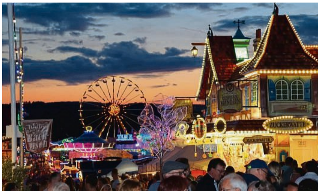
Abendstimmung auf dem Viehmarkt.

Des Weiteren werden Poutou-Esel gezeigt. Während die Kleinen beim Kälberaufzuchtswettbewerb ihr Tier durch den Parcours führen