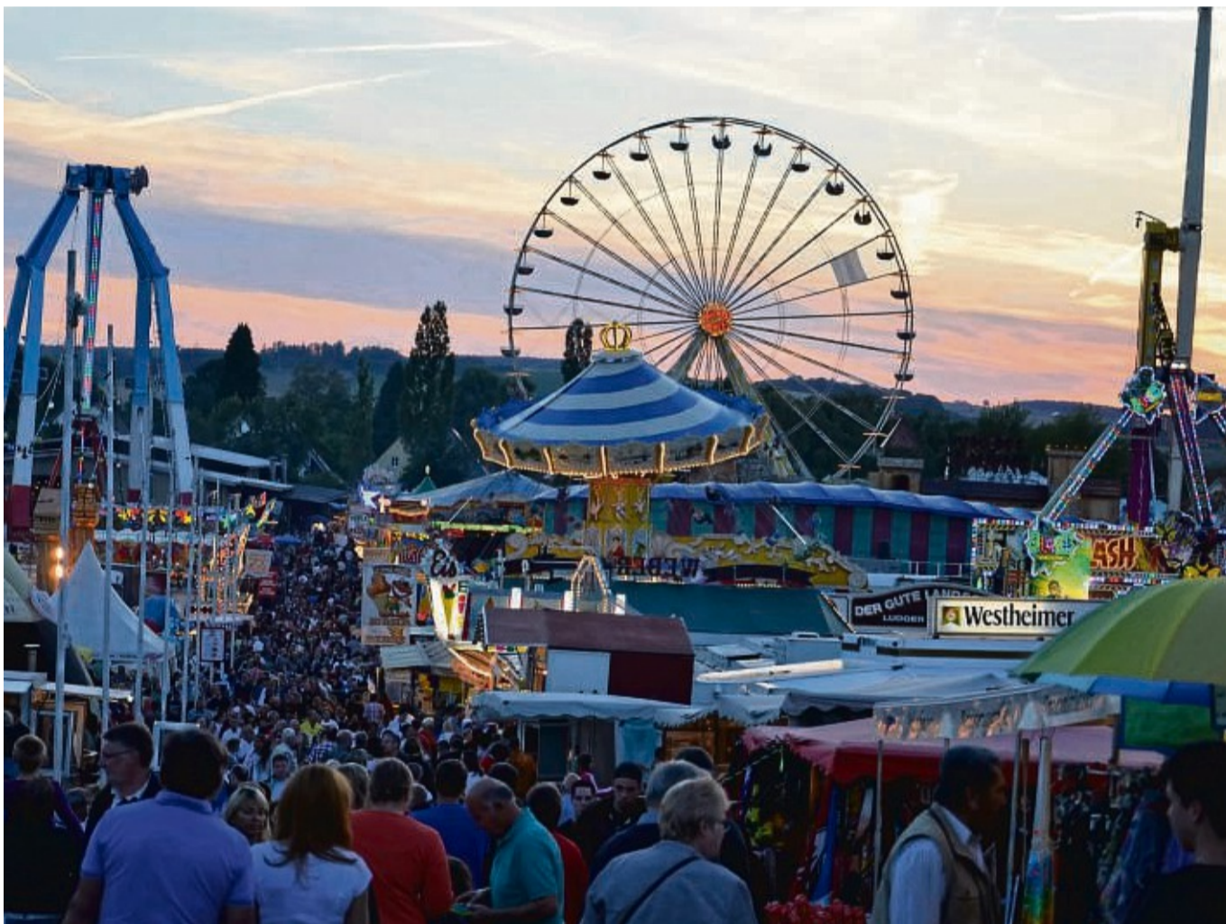
Für Spaß, Nervenkitzel und Abwechslung sorgt am Königsberg vom 8. bis 11. August in Bad Arolsen der Kram- und Viermarkt mit seinen zahlreichen Angeboten.

Als Fahrgeschäfte sind unter anderem angekündigt: Riesenschaukel „Best XXL“, Wasserbahn „Big Splash“, Hochfahrgeschäft „Black Out“, Rundfahrgeschäft „Take Off“, Achterbahn „Twister“, Wellenrutsche „Happy Slide“, Bungee-Trampolin „Dschungeljump“, Riesenrad „Europa Rad“ sowie ein „Geisterdorf“, „Wellenflieger“, „Break Dancer“, „Kra-ke“, „Musik-Express“ und zwei Autoskooter. Den Besuchern des Kram- und Viehmarktes wird in diesem Jahr