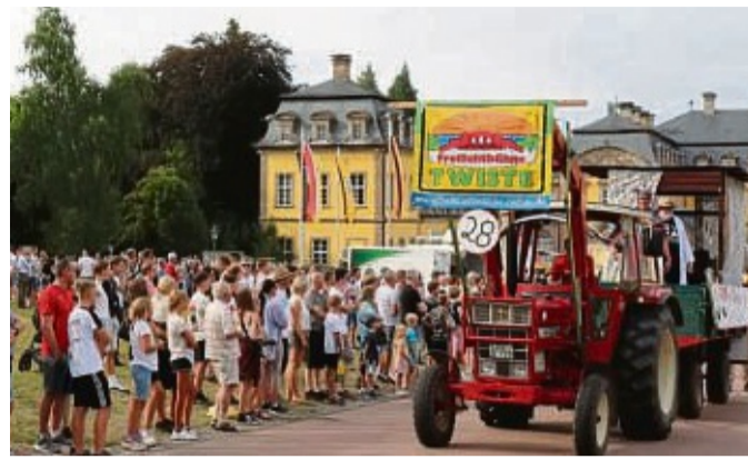
Der Festzug durch die Straßen ist ein Eröffnungshighlight.