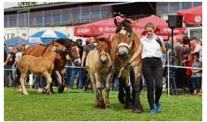
Erstklassige Tiere werden bei der Bezirkstierschau vorgestellt.