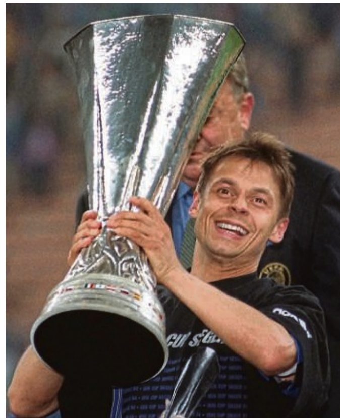
Olaf Thon hat 1997 mit dem FC Schalke den Uefa-Pokal gewonnen. Heute ist der 58-Jährige der Leiter der Schalcker-Traditionsmannschaft.

Eintrittskarten gibt es im Vorverkauf für 8 Euro (Tageskasse 10 Euro) beim Getränkemarkt Hirth und an der Tankstelle in Ernsthausen sowie im Waldgasthaus Christenberg und in der Kneipe Daggis in Münchhausen. Kinder bis 13 Jahre haben freien Eintritt. jpa