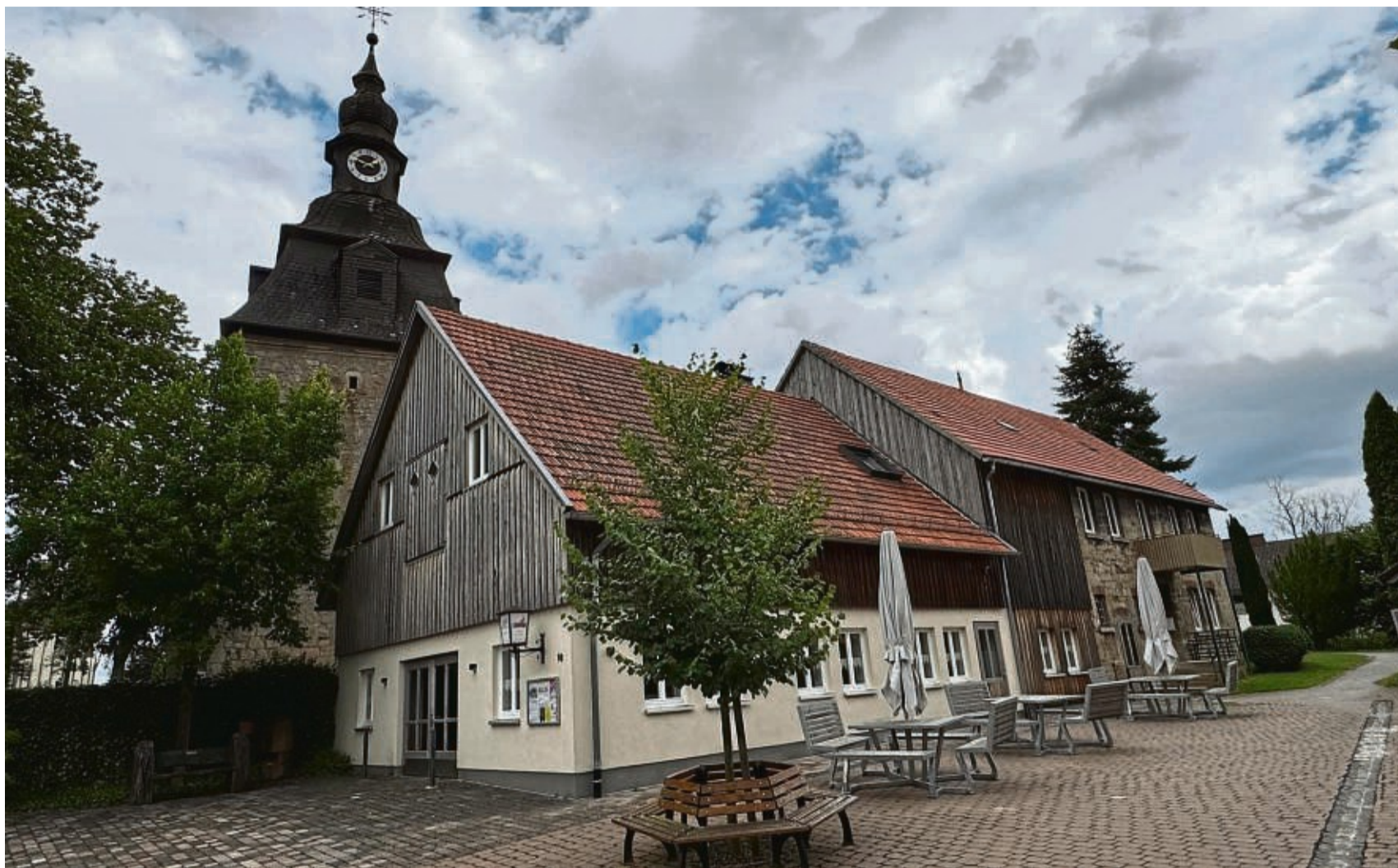
Das Gemeindezentrum in Goddelsheim, in unmittelbarer Nachbarschaft zur Kirche, befindet sich im Besitz der Stadt. Dort haben verschiedene Gruppen ein neues Zuhause gefunden, auch die Kirchengemeinde.

Die Dekanin ergänzt: „Die Landeskirche hat ja zudem in der Herbstsynode ein Klimaschutzkonzept beschlossen. Darin steht, dass wir bis 2045 unsere Gebäude, die wir dann noch haben, klimaneu-