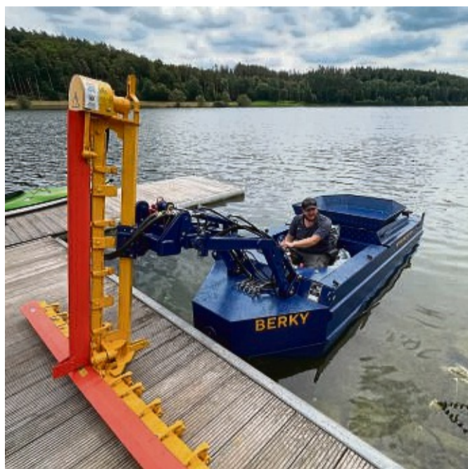
Das Mähboot rückt der Wasserpflanze Tausendblatt künftig zu Leibe.