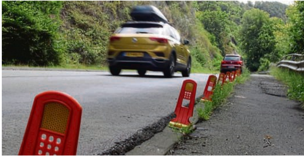
Marode Edersee-Randstraße: Zwischen dem Bikertreff „Zündstoff“ in Hemfurth und der Staumauer stehen ab Mitte 2025 Sanierungsarbeiten an.

Was bei der Konzepterstellung über allem schwebte, war die nahende Vollsperrung der Edersee-Randstraße zwischen Hemfurth nahe des Zündstoffs und der Sperrmauer. „Die Straßeninstandsetzungs- und Hangsicherungsarbeiten sollen im Sommer 2025 beginnen. Das geht nicht anders, denn hangseitig liegt der Nationalpark. Witterungsbedingt und wegen Schutzzeiten müssen die Arbeiten im Sommer verrich-