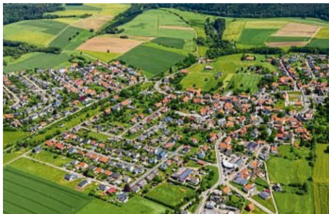
Höringhausen erhält Impulse aus der Dorfwerkstatt.

Die Lebens-, Arbeits- und Freizeitbedingungen haben sich auch in Höringhausen sehr verändert und damit wandelten sich zugleich die Interessen und Bedürfnisse der Bewohner. Dies zeigte