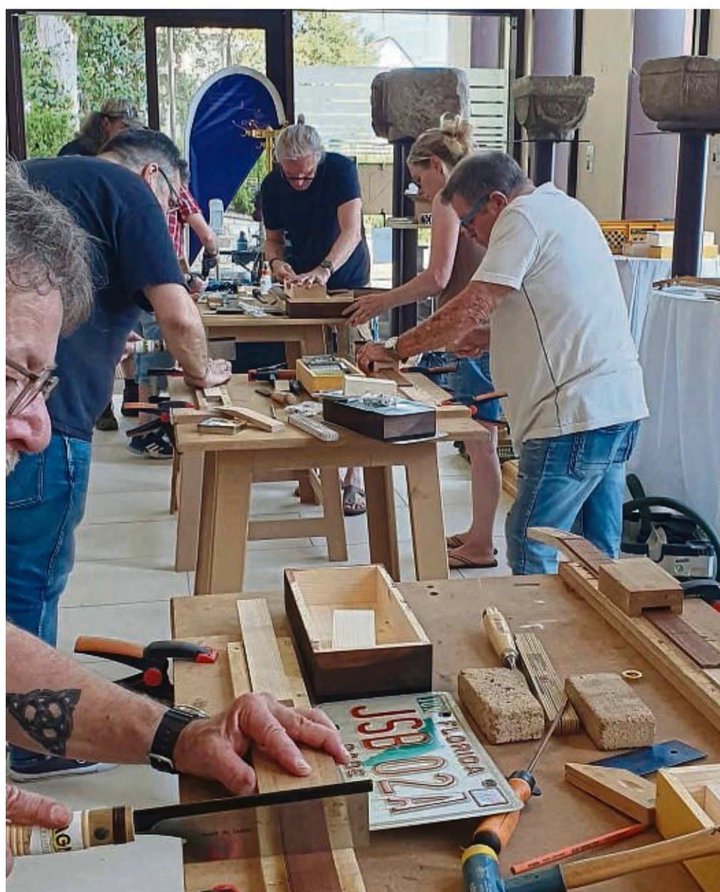
Volle Konzentration: Die Teilnehmer in Aktion, sie sägten und schraubten beim Workshop an ihren License Plate Guitars.