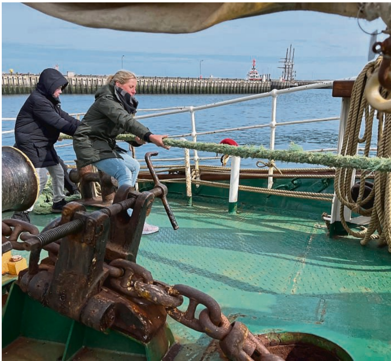
Einen Traditionssegler wie die „Großherzogin Elisabeth“ zu vertäuen ist schwere Handarbeit.