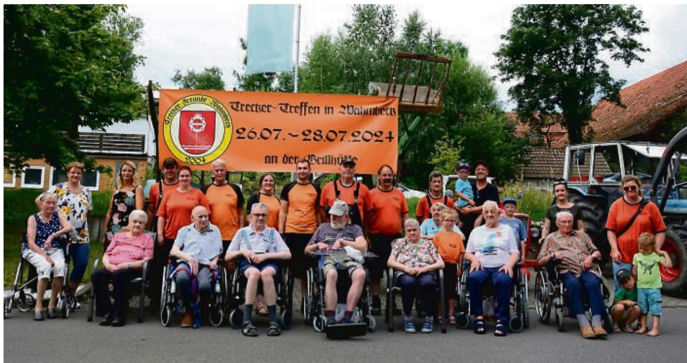
Überraschung: die Treckerfreunde Wahmbeck besuchten das Altenhilfezentrum in Lippoldsberg

Beide haben sich gut in das Heim integriert. „Ich fühle mich sehr wohl hier, und meinem Jungen geht es gut“, freute sich die rüstige alte Dame. Beide haben ein eigenes Zimmer, verbringen viel gemeinsame Zeit miteinander, und nehmen am Alltagsbetrieb gerne teil. plu