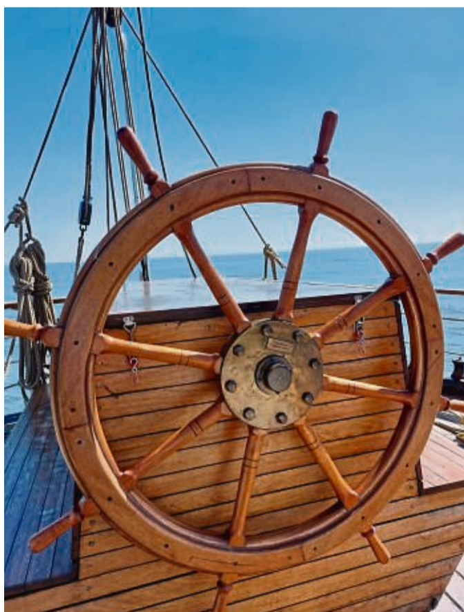
Krafttraining am Steuerrad: Den Kurs zu halten kann ganz schön anstrengend werden.

die Ruderanlage. Dann übernehme ich das Steuerruder. Der wachhabende Offizier sagt einen neuen Kurs an: „21-0“. Gemeint sind 210 Grad.