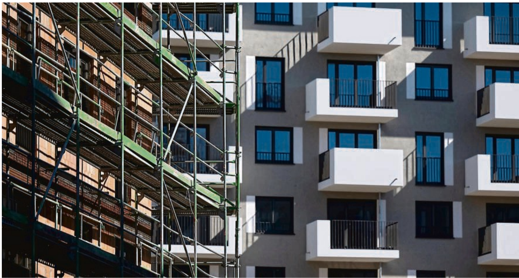
Fertig vs. unfertig: Je weiter ein Bauprojekt fortgeschritten ist, desto geringer sind die Risiken für Käuferinnen und Käufer. Existiert eine Immobilie zunächst nur auf dem Papier, kann bis zur Fertigstellung des Neubaus noch vieles schiefgehen.