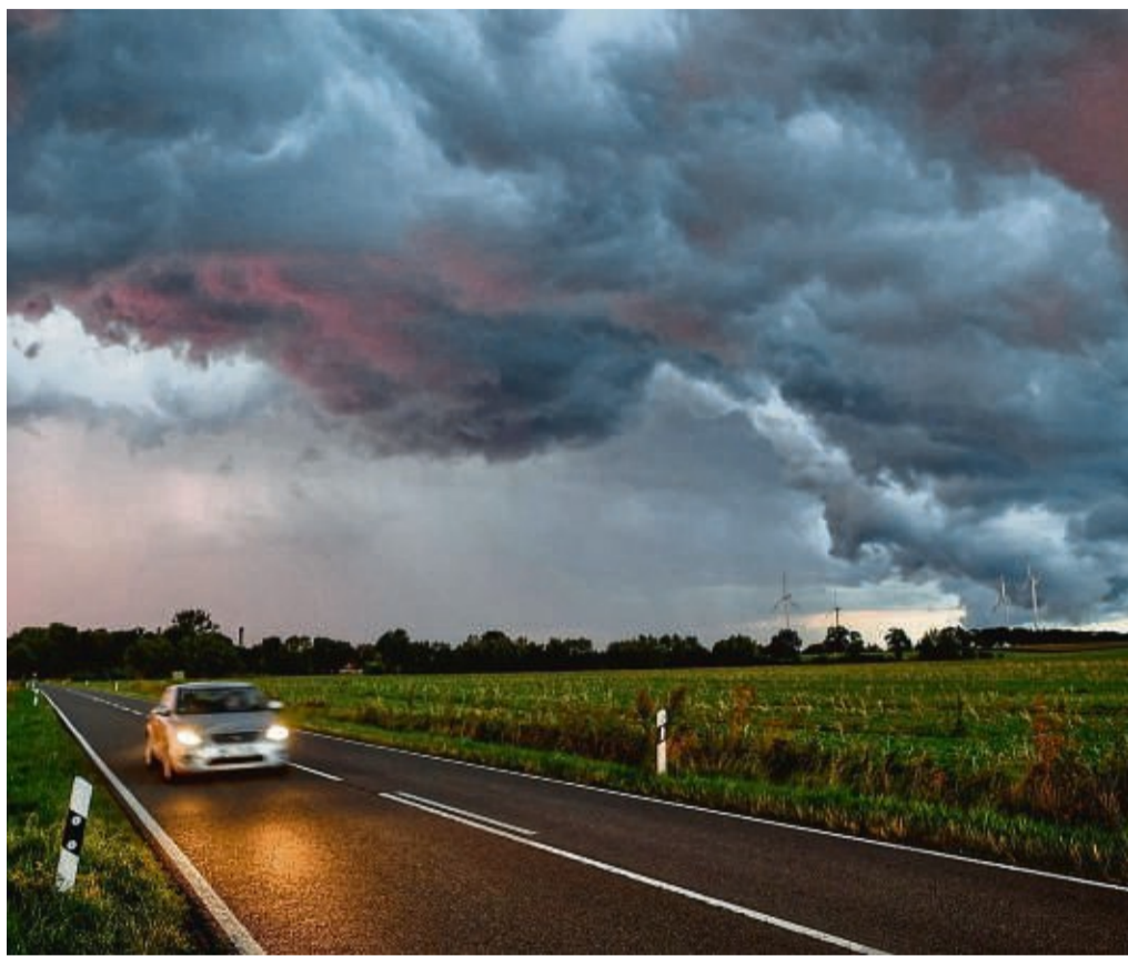
Sicher durchs Gewitter: Blitze können Autos und ihren Passagieren kaum etwas anhaben.

Das Wichtigste zuerst: Im normalen Auto sind die Insassen laut ADAC gut gegen Blitzschlag geschützt. Denn dessen Karosserie bildet einen sogenannten Faradayschen Käfig. So wird die elektrische Entladung beim Einschlag um die Insassen herumgelenkt. Fenster und etwaige Schiebedächer schließt man bei Gewitter aber besser und zieht soweit möglich alle Antennen ein.