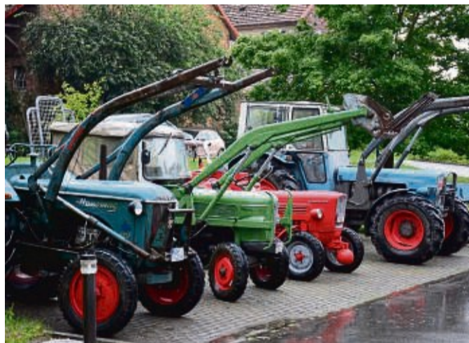
Mit einigen alten Schätzchen kamen die Liebhaber alter Traktoren aus dem Nachbarkreis nach Lippoldsberg.