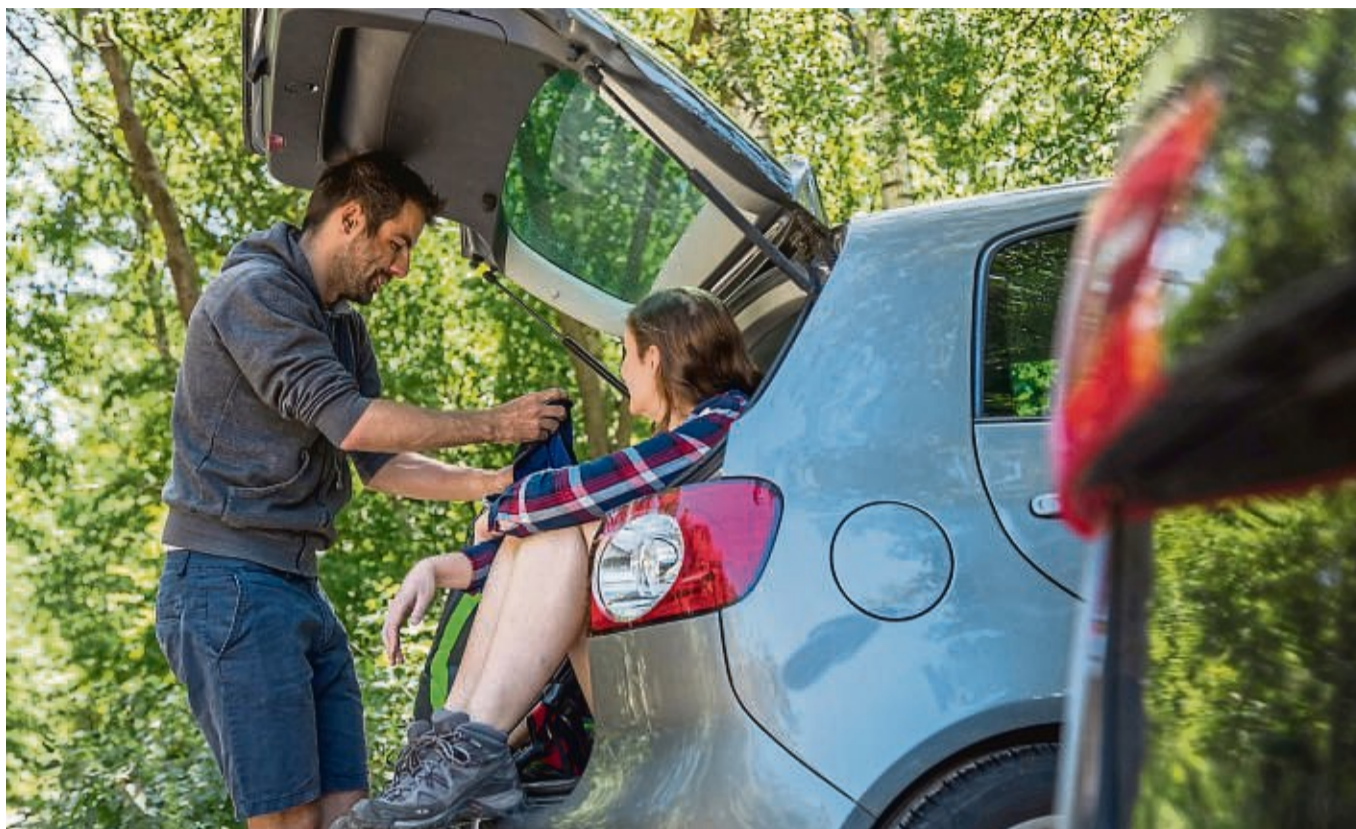
Mit dem Mietwagen im Urlaub: Es lohnt sich immer, schon beim Buchen auf einen umfassenden Versicherungsschutz zu achten.

Bei anderen Ländern wie der Türkei kann es auf die individuellen Vertragsbedingungen ankommen. Ist das Länderkürzel auf der Grünen Karte durchgestrichen oder