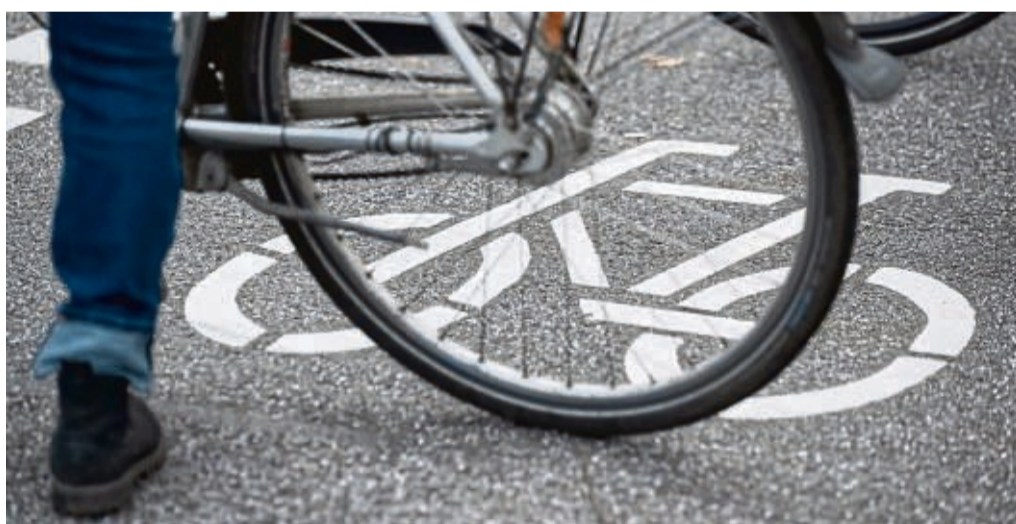
Voller Erfolg: Insgesamt 10 562 Kilometer legten die Teilnehmer mit dem Fahrrad zurück.

Auch die lokale Politik unterstützte die Aktion tatkräftig. Sieben Mitglieder der Gemeindevertretung und des Gemeindevorstands traten kräftig in die Pedale und trugen zum erfolgreichen Ab-