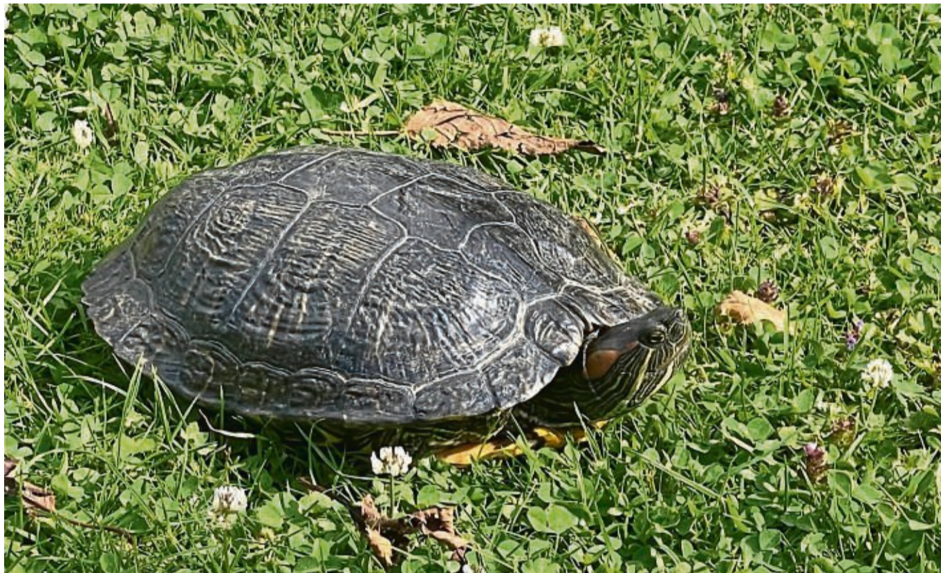
Wurde an der Bundesstraße gefunden: Diese Wasserschildkröte lebt nun übergangsweise in Lutterberg.