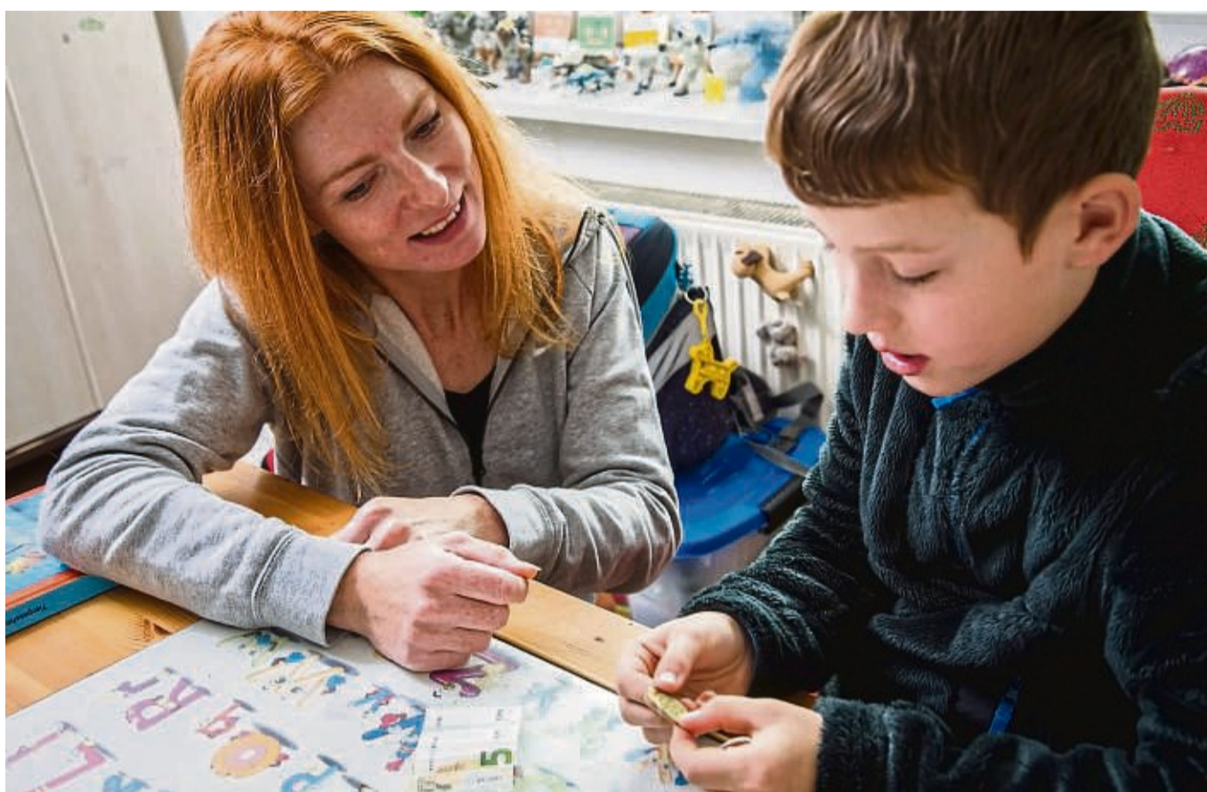
Regelmäßig und bedingungslos: Ein guter Zeitpunkt zum Start des Taschengeldes ist zum Ende der Kindergartenzeit.

Kinder entwickeln sich eben sehr unterschiedlich. Manche sind schon im Kindergarten sehr mit Themen wie Einkaufen oder Geld vertraut und möchten sich vielleicht gerne ab und zu selbst mal eine Kaugummipackung oder ein Heftchen kaufen,