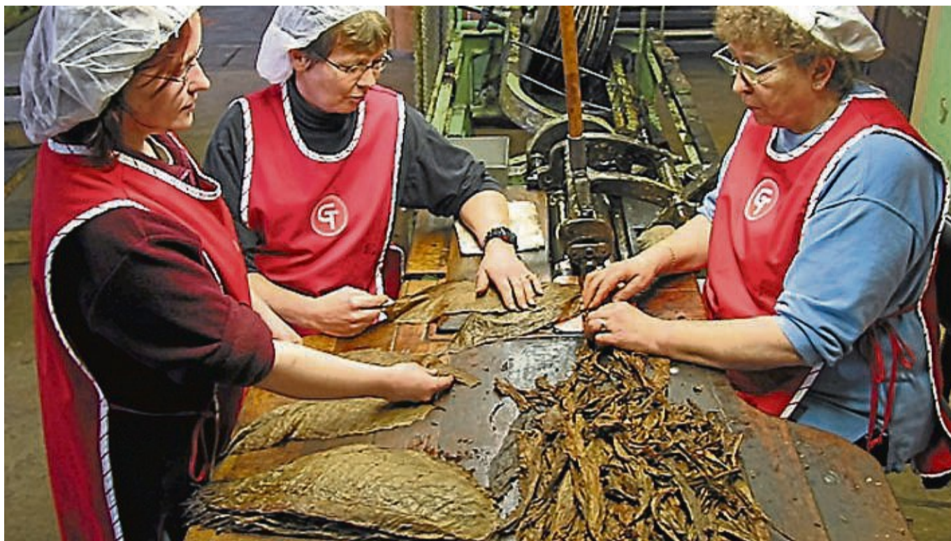
Altes Handwerk: Im Kautabakmuseum in Witzenhausen wird vorgeführt, wie der Tabak verarbeitet wurde.

Die Salzproduktion in Bad Sooden-Allendorf besteht mindestens seit Ende des 8. Jahrhunderts, bis zum Ende des 19. Jahrhunderts wurde in Siedehäusern aus Sole Salz gewonnen. Die 2000-jährige Vergangenheit des Salzwerks in Form von Urkunden, Originalgeräten und Modellen ist im Salzmuseum Söder Tor zu sehen. Dazu gehören auch Außenanlagen wie Solebohrurm, Gradierwerk und Solebadehaus.