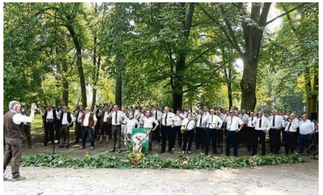
Zu Beginn bliesen die Jagdhornbläser gemeinsam einige Stücke.

Das Bläsercorps der Jägerschaft wurde 60 Jahre alt