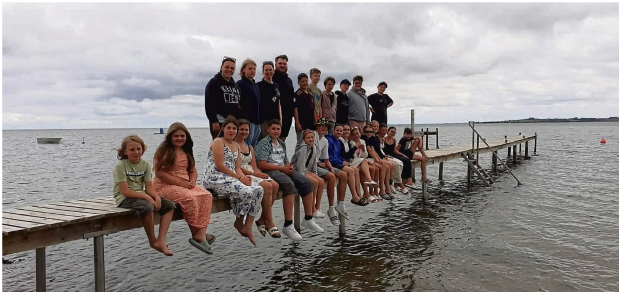
Freizeit an der Ostsee: Jugendliche erlebten die Ferien am Strand.

Zahlreiche Jugendliche waren bei Ferienfreizeit mit dabei