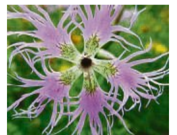
Eine Prachtnelke auf der Hausener Hute.