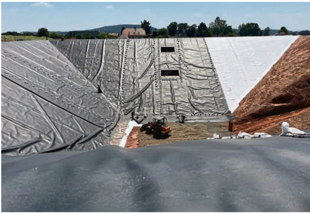
Dieser 27 000 Kubikmeter fassende Erdbeckenspeicher wird das Dorf Bracht künftig mit Warmwasser versorgen.

Der Weg dorthin war lang und steinig. „Wir haben 13 Angebotsanfragen rausgeschickt und nur Absagen bekommen. Wir hatten manchmal das Gefühl, wir schreiben Raketentechnik aus“, sagt Schütze und beschreibt das Problem, Firmen zu finden, die sich der bürokratisch aufwendigen und technisch anspruchsvollen Stahlarbei-