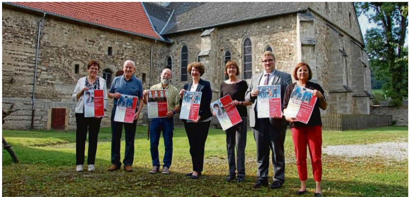
Vier hochkarätige Konzerte und Kabarett bietet die Reihe „Hör mal im Denkmal“ im September. Vertreter der beteiligten Vereine, der Sparkassen-Kulturstiftung und der Sparkasse stellten die Angebote im Flechtendorfer Kloster vor.

Am Samstag, 7. September, präsentieren die „Grenzgänger“ um 19 Uhr in der Vöhler