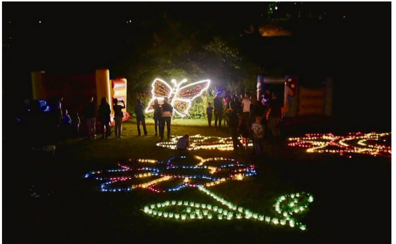
Motive aus 15 000 Kerzenbechern: Lichtilluminationen verzauberten den Kurpark bereits 2023. Die Motive für die Lichtinstallationen wurden bereits von Mitarbeitern des Bauhofs vorbereitet.

15 000 Teelichter und 3D-Lichtmotive lassen Kurpark erstrahlen