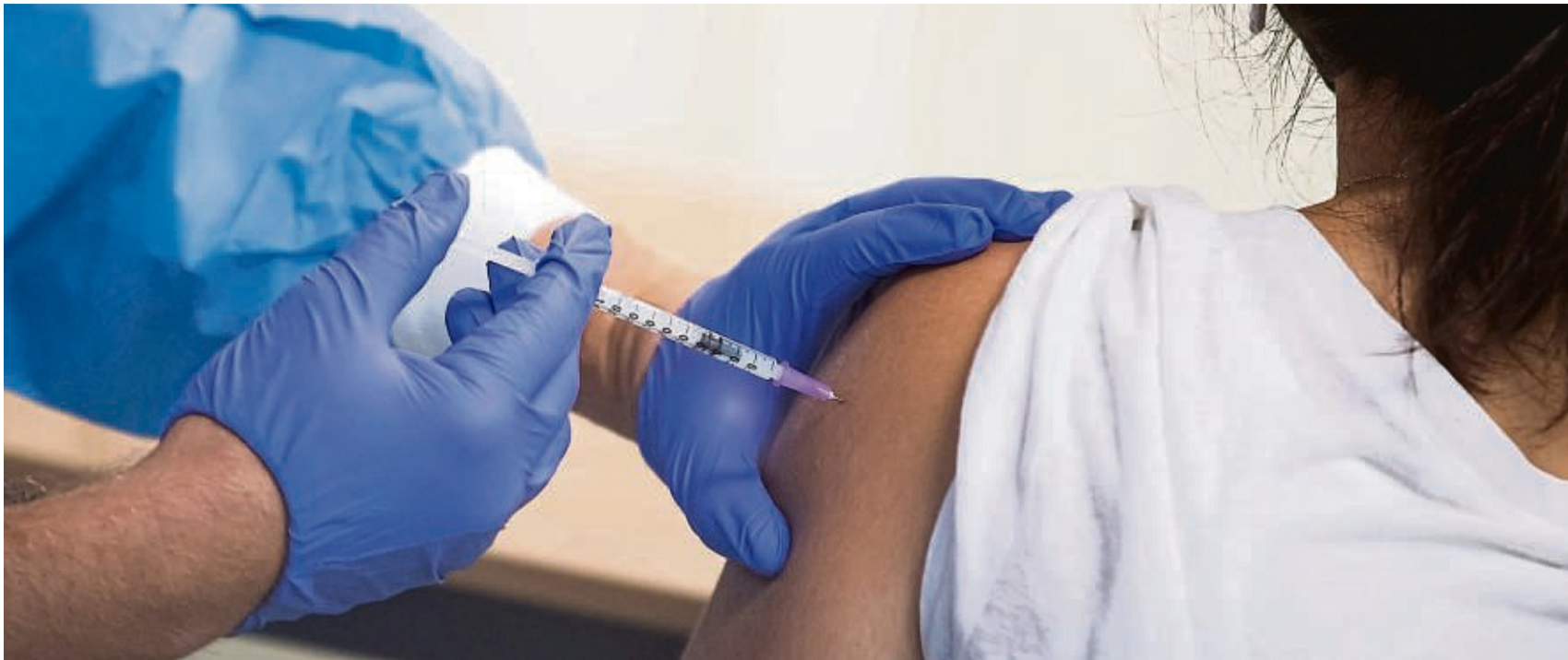
Zu regelmäßigen Auffrischungsimpfungen gegen Covid rät unter anderem der Fachdienst Gesundheit des Landkreises Waldeck-Frankenberg.