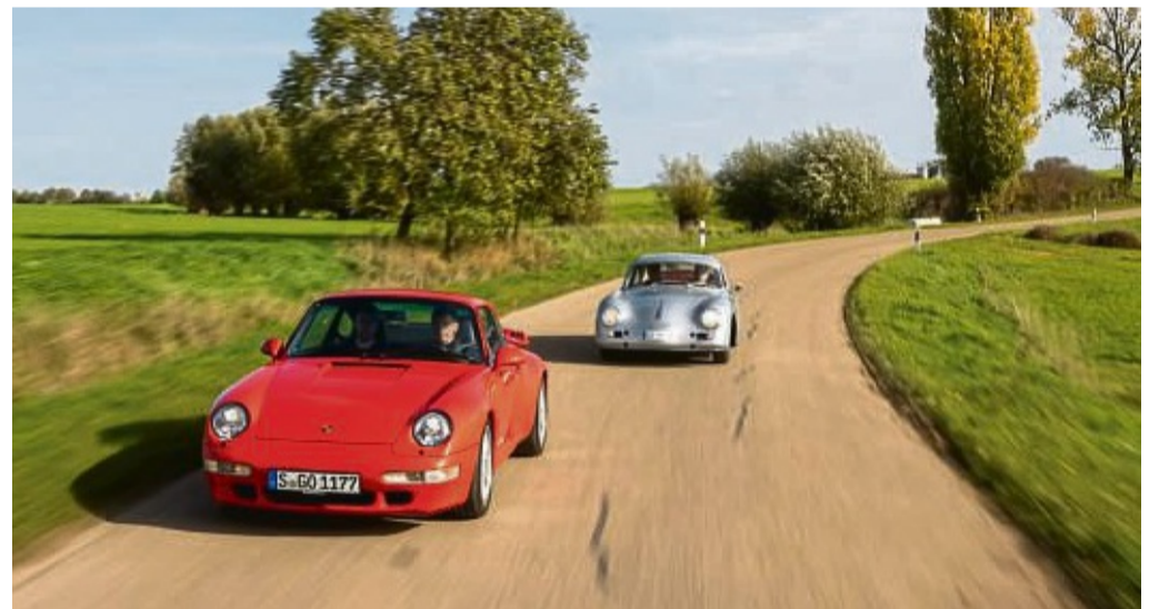
150 Sportwagen mit dem Stuttgarter Rössle im Markenzeichen machen bei der 3. Röhr-Klassik mit: Von Bayern und Baden-Württemberg im Jahr 2023 (Foto) wechselt die Orientierungsfahrt nun nach Nordrhein-Westfalen und Hessen. Im Bild ein Porsche 993 Turbo, dahinter ein Porsche 356 A.

Veranstalter des Wettbewerbes ist die Delius Klasing Verlag GmbH in Bielefeld. In diesem Jahr führt die Röhr-Klassik durch Nordrhein-Westfalen, Hessen und für wenige Kilometer auch durch Niedersachsen. Während der sechs Etappen legen die historischen Sportwagen an drei Tagen eine Strecke von rund 730 Kilometern zurück. Los geht es in Winterberg, dann fahren die Fahrer am Edersee vorbei und passieren auf ihrer Reise ins Weserbergland Waldeck und Wolfhagen, um schließlich über Höxter, Bad