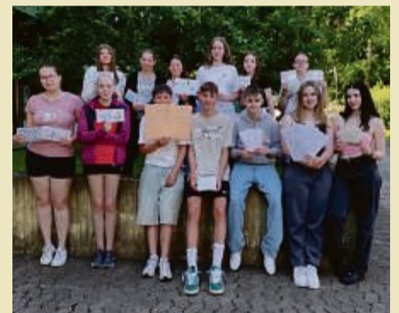
Das Foto zeigt die Klasse 8aG der AvT Sontra mit den Antwortbriefen an die neuseeländischen Schülerinnen am Wellington Girls' College – Foto von Jana Bogott.

So wurde in den folgenden Englischstunden an Antwortbriefen an die Neuseeländerinnen gearbeitet, die in Kürze abgesendet werden. Um die langen Wartezeiten zu umgehen, wird das Projekt danach digital weitergeführt und der Kontakt ausgebaut. Die Lernenden der Klasse 8aG haben so die Möglichkeit, ihre erworbenen Kenntnisse in der Fremdsprache Englisch praktisch