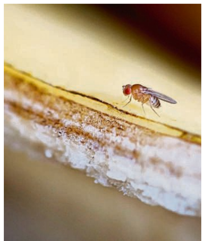
Unerwünschte Mitesser: Fruchtfliegen umschwirren im Sommer gerne den Obstkorb.

ie sind zwar nicht gefährlich, sind aber ein bisschen ekelig aber schon: Fruchtfliegen in der Küche fängt man sich fix ein. So werden Sie die nervigen Küchegäste wieder los. trale Nordrhein-Westfalen. Das Obst lockt die Fruchtfliegen nun an. Haben sich etliche von ihnen am Köder im Glas versammelt, schraubt man schnell den Deckel drauf. Jetzt können Sie die Insekten samt Glas aus der Wohnung tragen und sie draußen fliegen lassen. ■ Nervig aber ungefährlich Das ist nervig, aber nicht gefährlich. Und wer sie tier- und umweltfreundlich loswerden will, braucht dafür nicht viel, nämlich nur eine ausgepresste Zitrone und ein Apfelgehäuse oder andere Obstabfälle. Beides gibt man in ein offenes Schraubglas, so der Tipp der Verbraucherzen- ■ Bananen kommen in den Kühlschrank Wer einer Fruchtfliegenplage in der Wohnung lieber gleich vorbeugen will, dem rät die Verbraucherzentrale NRW übrigens, Obst mit einem Tuch abzudecken und Obstsorten, die nicht kälteempfindlich sind, im Kühlschrank zu verstauen, Bananen etwa. Den Biomüll sollten Sie außerdem besser nicht offen in der Küche stehen lassen.