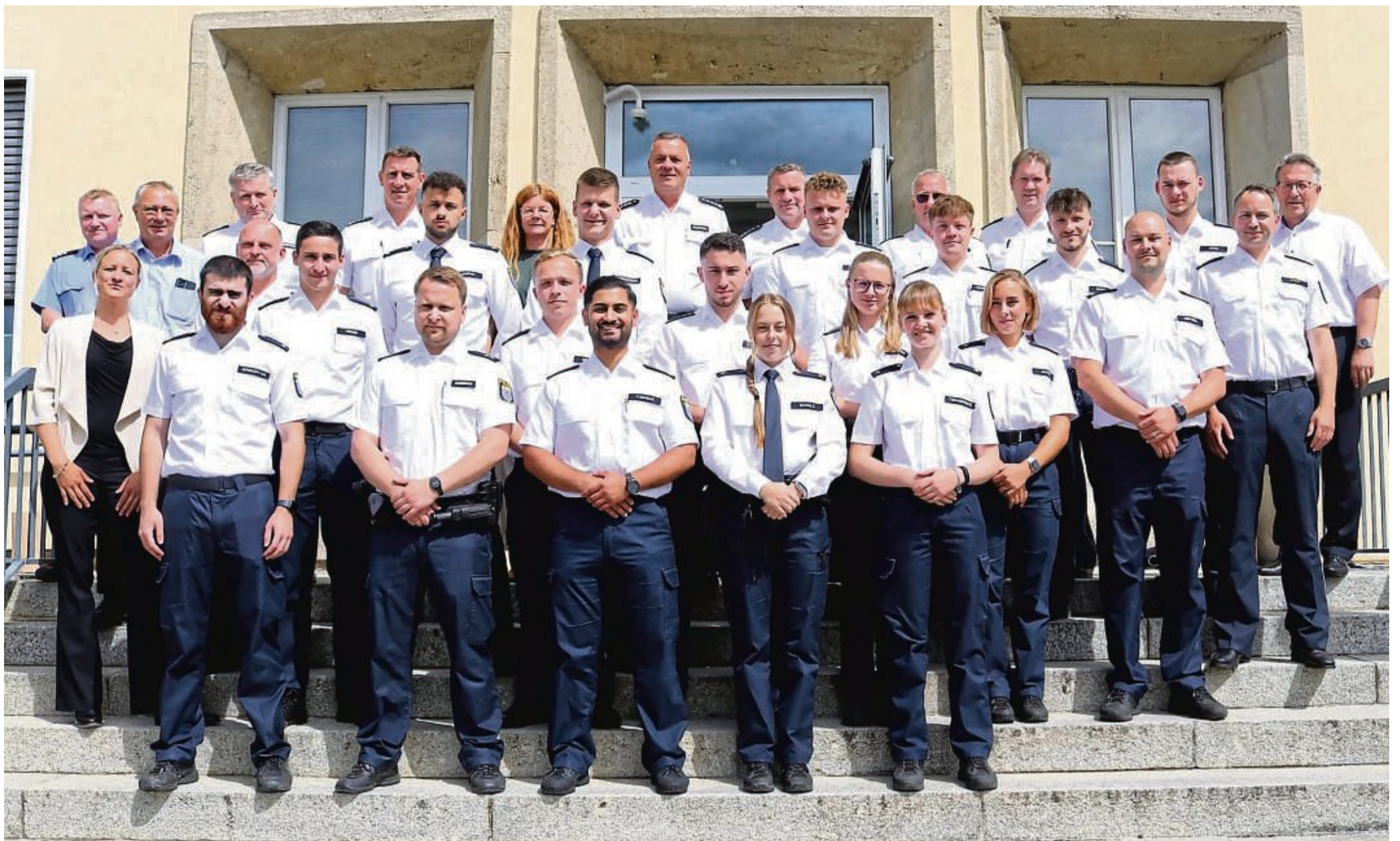
Wurden am Montag in Eschwege begrüßt: die neuen Polizisten und Polizistinnen, die zukünftig bei der Polizeidirektion Werra-Meißner und der Polizeistation in Eschwege ihren Dienst tun werden.