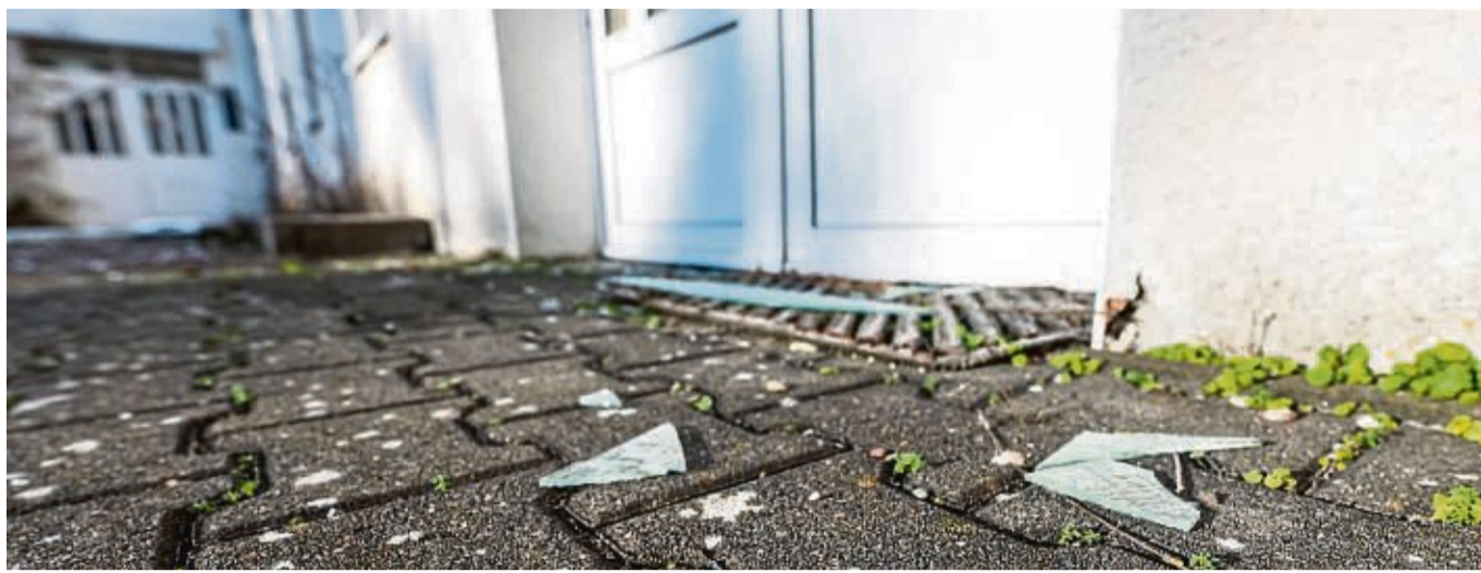
Fußball gespielt, Fenster zu Bruch gegangen? Vor dem siebten Geburtstag eines Kindes kann dieses dafür nicht zur Verantwortung gezogen werden.

Ab ihrem siebten Geburtstag können Kinder laut der Verbraucherzentrale Brandenburg sehr wohl für ihr Handeln zur Rechenschaft gezogen werden. Allerdings nur dann, wenn davon ausgegangen wird, dass das Kind zum Zeitpunkt des Schadens reif genug war, die Gefahren-