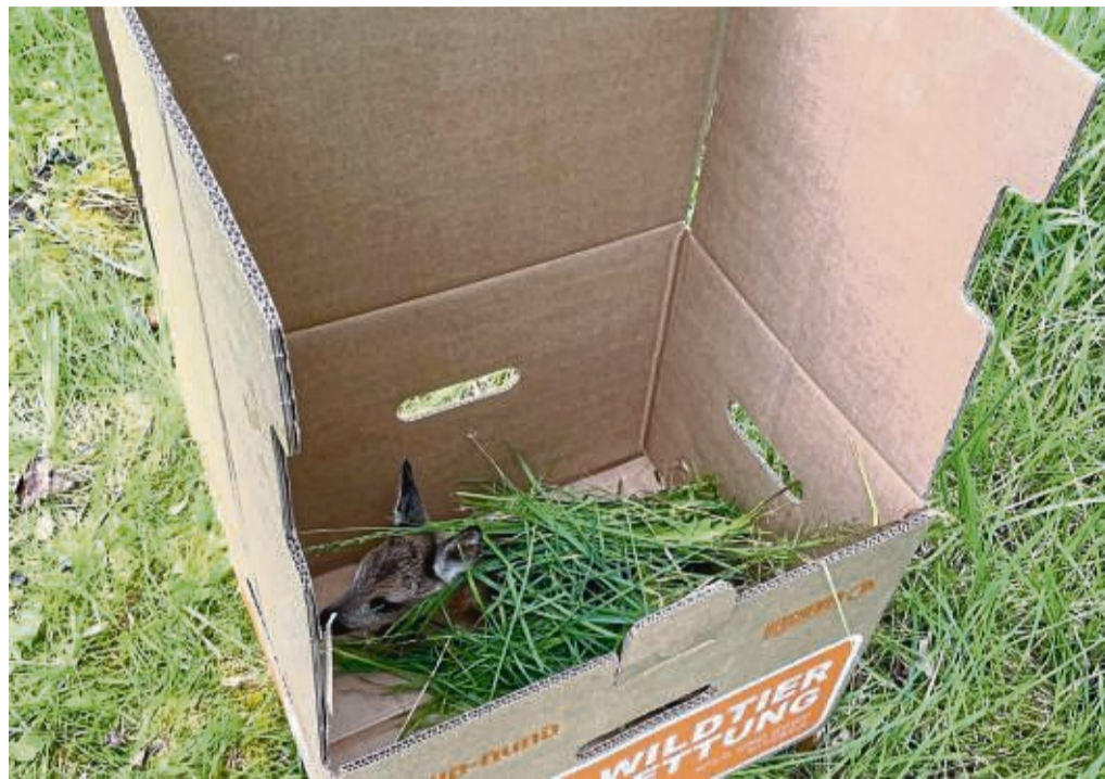
Sicher während der Mäharbeiten: Dieses Rehkitz wartet in einem speziell bedruckten Pappkarton darauf, nach den Arbeiten wieder auf die Wiese gesetzt zu werden.

Besonders in den frühen Morgenstunden lassen sich die Rehkitze allerdings mithilfe einer Wärmebildkamera ausfindig machen. Dafür hat die Jagdgenossenschaft im vergangenen Jahr eine Drohne angeschafft und diese auch versichert. An den Kosten von rund 6000 Euro hatte sich der Lions Club Eschwege-Werratal mit einer Spende von 500 Euro beteiligt. Eine Förderung des Bundesministeriums für Ernährung und Landwirtschaft konnte die Jagdgenossenschaft nicht in Anspruch nehmen. Sie richtet sich nur an Vereine. Eine Jagdgenossenschaft ist eine Körperschaft des öffentlichen Rechts. „Das ist natürlich eine große Investition“, sagt Stein. Doch als er die Idee zur Drohne bei der Jagdgenossenschaft vorstellte, seien alle dafür gewesen. Wichtig sei es ihnen, so Stein, zu verhindern, dass Rehkitze einen qualvollen Tod sterben oder schwer ver-