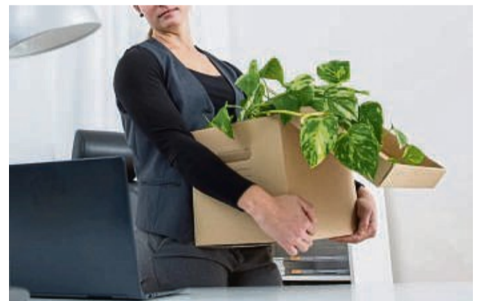
Eine Kündigung führt nicht zum Verfall des Resturlaubs: Arbeitnehmer können den Resturlaub innerhalb der Kündigungsfrist nehmen oder ihn sich auszahlen lassen.