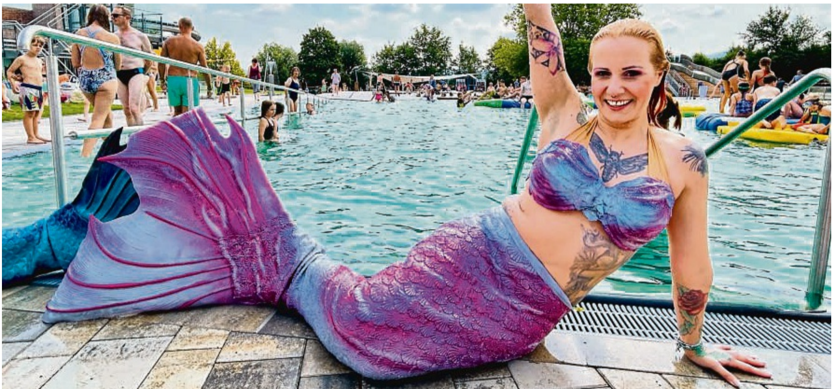
Wasserspaß für alle: Zur großen Eröffnungsfeier kamen hunderte Besucher.

Er wies auf die innovative Wasseraufbereitung durch biologisch-physikalische Bodenfilter und Schilfpflanzen hin, für die man auch mit der