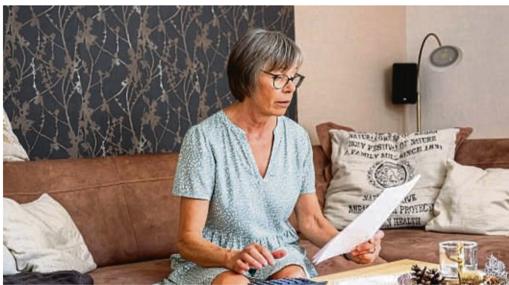
Seit 2023 müssen Vermieter anteilig die CO 2 -Kosten tragen , wenn das Gebäude energetisch ineffizient ist: Mieter sollten die Kostenaufteilung prüfen und bei Unstimmigkeiten eine Erstattung verlangen.

Einen davon stellt zum Beispiel das Bundeswirtschaftsministerium zur Verfügung. Hier erhalten Mieterinnen und Mieter unter Eingabe einiger persönlicher Daten, die sie in der Regel ihrer Nebenkostenabrechnung entnehmen können, für sämtliche fossilen Energiearten eine Einschätzung zur korrekten Kostenaufteilung. Etwas übersichtlicher sind die Rechner der Verbraucherzentrale NRW und des Ratgeberportals Finanztip. Allerdings sind diese Angebote bei der Auswahl der Brennstoffe deut-