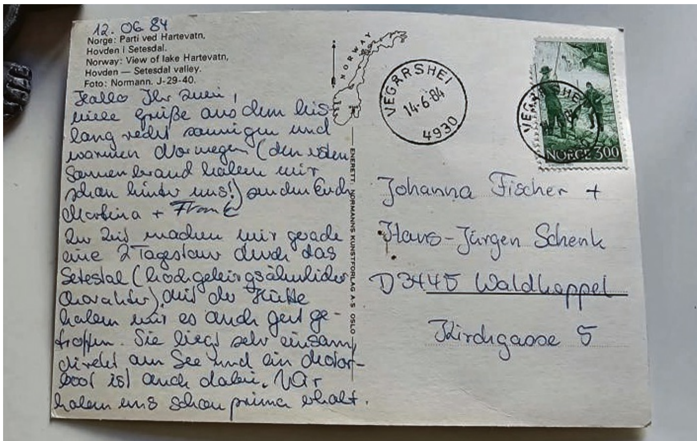
Es hat ein bisschen gedauert, aber jetzt ist sie angekommen: die 1984 von einem Pärchen an Freunde in Waldkappel geschickte Urlaubskarte aus Norwegen.