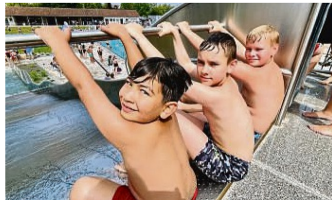
Auf die Rutsche, fertig los!

Innerhalb von eineinhalb Jahren wurde das neue Freibad „Espanatura“ auf dem Gelände des Schwimmzentrums errichtet: Ein Becken mit einer Fläche von mehr als 1000 Quadratmetern und drei 50-Meter-Bahnen, ein Sandstrand mit Lagune und daneben eine Breitwellenrutsche. Die überdachte Lounge lädt zum Relaxen ein. Auch der Spielplatz wurde noch einmal aufgewertet. Schon vorhanden waren die benachbarten Wasserspiele.