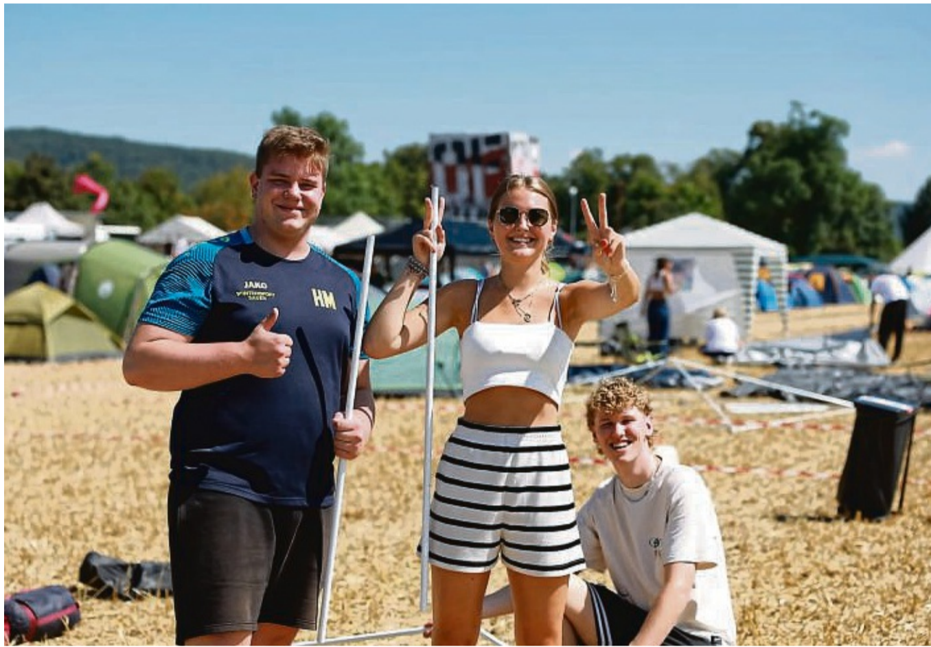
Zeltaufbau bei strahlendem Sonnenschein: Am Dienstagvormittag herrschte auf dem Campingplatz beste Laune.

Die Veranstalter weisen darauf hin, dass insbesondere