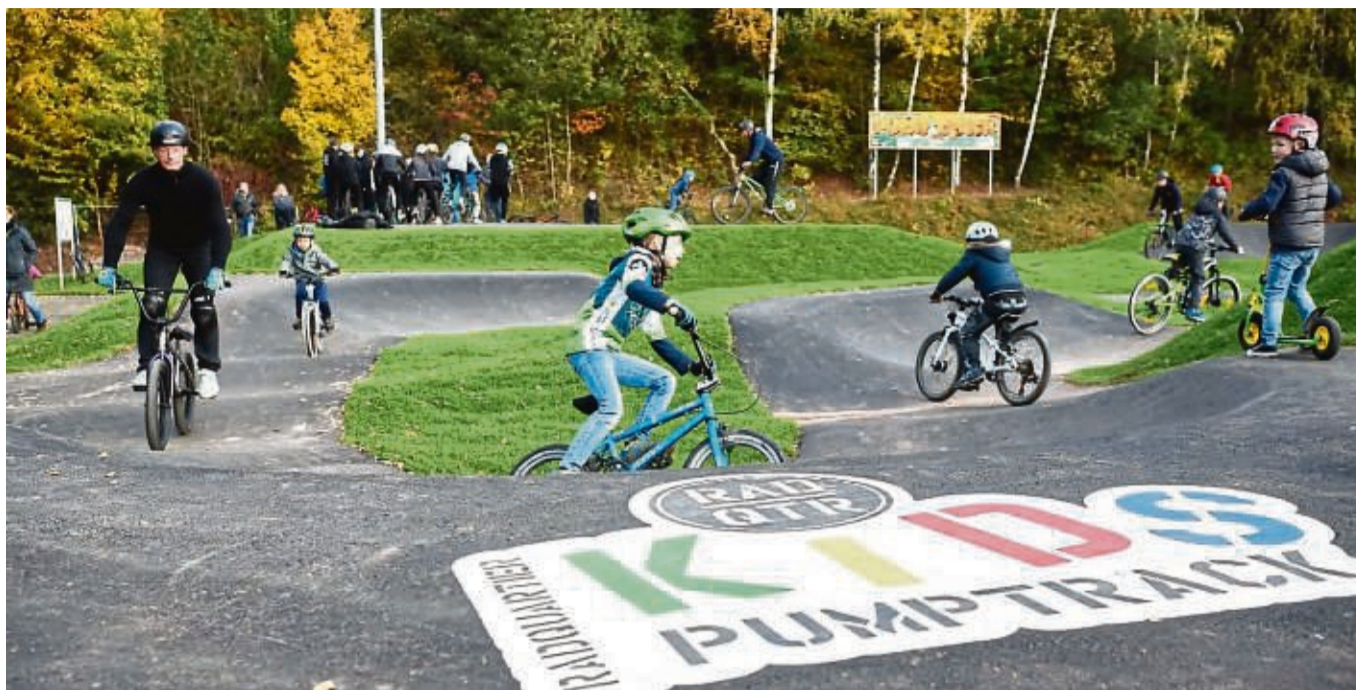
Bei der Einweihung 2020 war auf der Pumptrack-Anlage an Jahnstraße und Kneippweg in Sontra gleich viel los.

An dem Wochenende wird ebenfalls ein Enduro-Trailbau-Workshop des Trail-Revisers Sontra mit dem Unternehmen Radquartier Parks stattfinden. Der Workshop findet am Samstag und Sonntag, 30. und 31. August sowie 6. und 7. September, von 12 bis 15 Uhr statt. Das Unternehmen Radquartier Parks hat den Pumptrack in Sontra gebaut und mit ihm habe ein