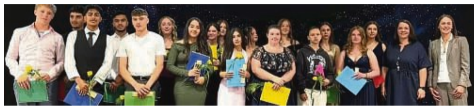
Die Klasse 9aH bei der Verabschiedung.