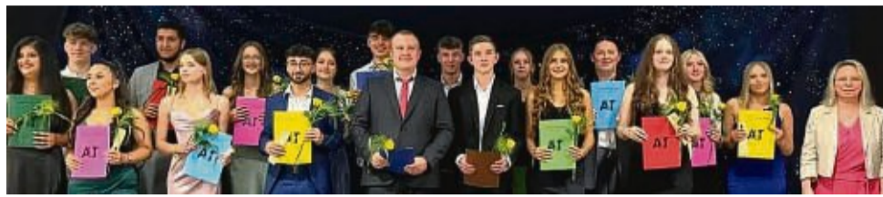
Die Klasse 10aR bei der Verabschiedung.

„Bildung ist das, was übrig bleibt, wenn man vergessen hat, was man gelernt hat.“ Dieses Zitat von Schriftsteller