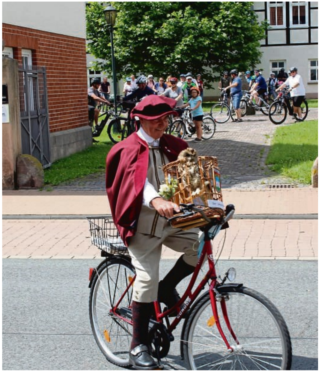
In Waldkappel hat die Stadtradeln-Aktion bereits stattgefunden, Eschwege und der Werra-Meißner-Kreis folgen im September. Anmeldungen sind noch möglich.

Eine Fahrt ist eine zurückgelegte Strecke, mit einem Start- und einem Zielort – unabhängig von eventuellen Zwischenstopps. Bei Rundtouren können Start und Ziel