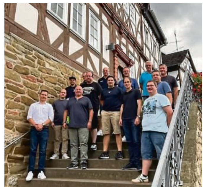
Unter dem Motto „Zukunft gemeinsam gestalten“ berieten Feuerwehrleute über den Bedarfs- und Entwicklungsplan der Feuerwehr der Stadt Sontra.

shops war, auf der einen Seite die Feuerwehr aktiv in den Prozess mit einzubinden und zum anderen gemeinsam im Dialog mit den Feuerwehrkameraden nach Lösungen zu suchen, wie man die Feuerwehr der Stadt Sontra mit allen Herausforderungen (Investitionen Gerätehäuser, Fahrzeuge, Schutzausrüstung, Personal) weiter aufstellen kann, um den Brandschutz unter dem Motto „Zukunft gemeinsam gestalten“ auch künftig in der Berg- und Hänselstadt Sontra sicherzustellen. red