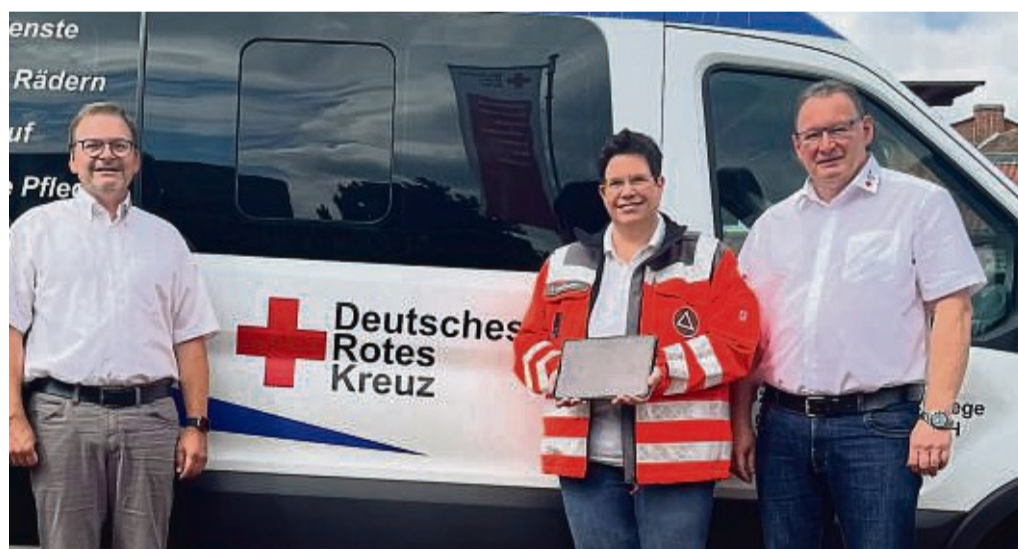
Der DRK Kreisverband Eschwege startet Mitgliederoffensive: „Füreinander da. Miteinander stark!“