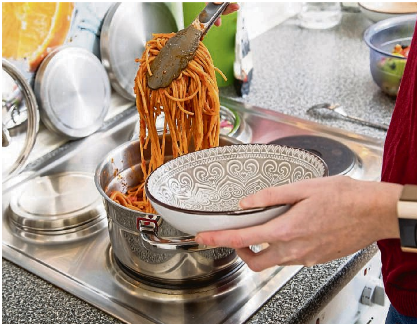
Nudeln von gestern enthalten aufgrund der resistenten Stärke etwas weniger Kalorien. Doch zu viel sollte man sich davon nicht erhoffen.

Die resistente Stärke ist allerdings eine spezielle Form der Stärke. Sie entsteht, wenn man gekochte Lebensmittel oder Speisen abkühlen lässt. Zum Beispiel Nudeln, Reis oder Kartoffeln für entsprechende Salate. „Beim Abkühlen und Wiedererwärmen ordnen sich die Stärke-Moleküle neu an, sodass sie von den Verdauungsenzy-