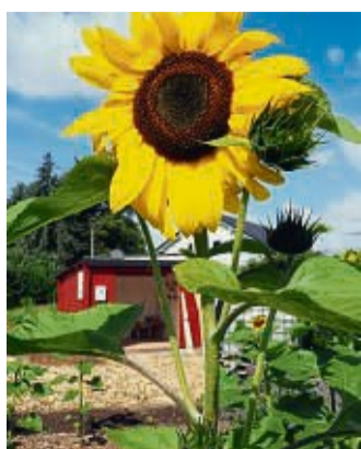
Einen sonnigen Gruß an alle Geburtstagskinder.

Jeden Mittwoch um 19 Uhr und jeden Samstag um 18 Uhr im Kirchengebäude der Gemeinde Sontra: Schlesienstraße 1, Eschwege. Die Gottesdienste finden sowohl als Präsenzveranstaltung und auch per Videokonferenz statt. Weitere Infos unter 0 56 53/6 33 98 28.