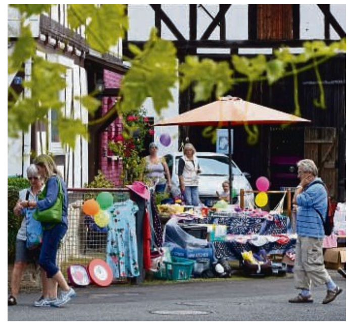
Das Besondere an dem Flohmarkt in Albugen ist sein dezentrales Konzept. Autos müssen draußen auf dem Parkplatz bleiben.