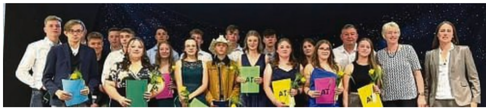
Die Klasse 10bR bei der Verabschiedung.