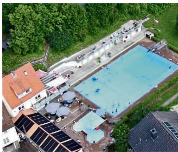
Aus der Vogelperspektive: Das Datteröder Freibad bietet Platz für Sport, Spiel und Erholung.