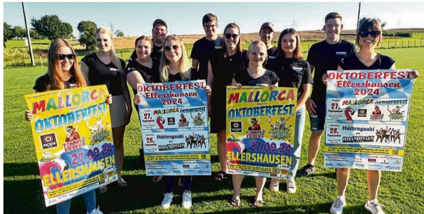
Der Jugendclub Ellershausen lädt zum Oktoberfest für 27. und 28. September. Auf dem Programm stehen Mallorca-Party und Hüttengaudi.

Teppich“ den bösen Zauberer besiegt und das Herz der Prinzessin erobert. Die nächste Aladin-Vorführung ist am Samstag, 10. August, um 15.30 Uhr. Weitere Informationen und Karten gibt es unter Telefon 0 29 84/ 92 91 90 oder per E-Mail: info@freilichtbuehne-hallenberg.de. nh/off