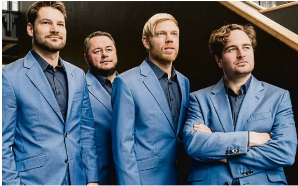
Vier markante Männerstimmen: Am Tag des offenen Denkmals am 8. September ist das Vokalensemble „Quartonal“ aus Norddeutschland in der Liebfrauenkirche Gast des Frankfurter Kulturrings bei „hör-mal im Denkmal“ der Sparkassenstiftung Hessen-Thüringen.