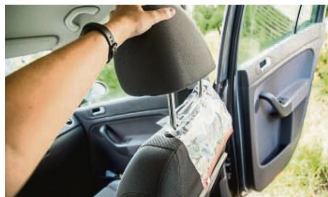
Der Verschluss des Gefrierbeutels befindet sich auf der Seite der Rückbank.

Und so geht's: Die Kopfstütze des Vordersitzes abneh-