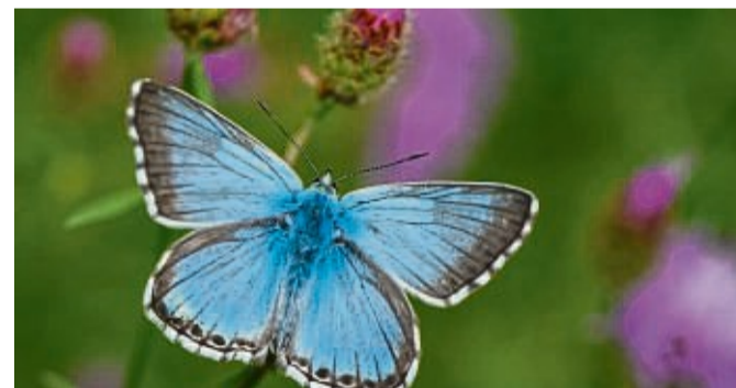
Was für ein schöner Schmetterling! Aber welche Art ist es? Die Antwort: sehr wahrscheinlich ein Faulbaum-Bläuling.

Eine Vergleichsfunktion ermöglicht es, ähnliche Arten nebeneinander zu betrachten und Unterschiede besser zu erkennen. Außerdem gibt