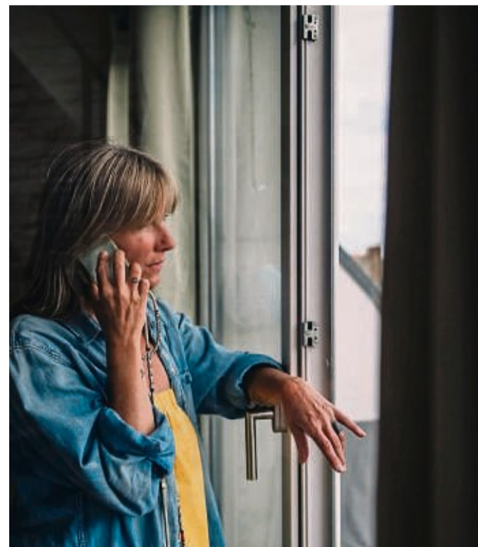
Ein Schockanruf am Telefon erzeugt Stress und Druck. Umso wichtiger ist es, tief durchzuatmen und die Situation in Ruhe zu analysieren.