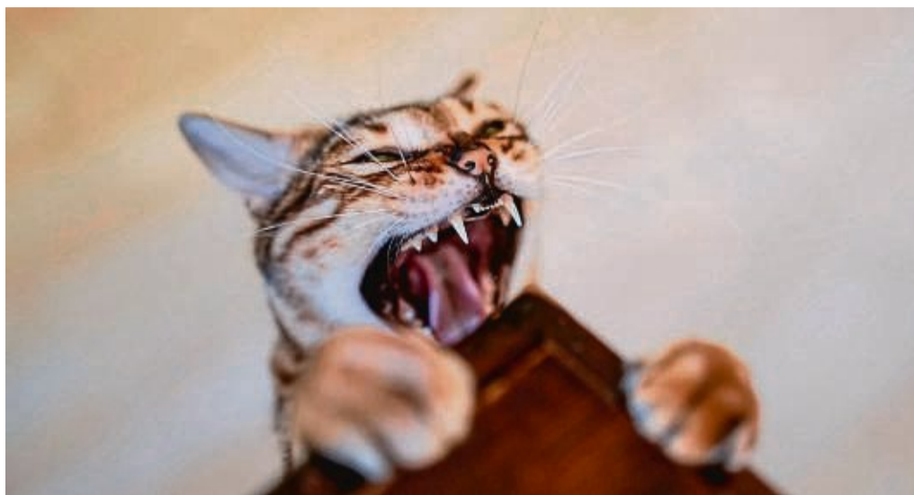
Die Zahnpflege von Katzen sollte, genau wie beim Menschen, prophylaktisch stattfinden.

Es gibt Fingerlinge, die man sich über den Zeigefinger ziehen und damit die Zähne putzen kann. So kann man dem Plaque entgegenwirken. Das ist bei Katzen immer etwas schwieriger, weil sie in der Regel nicht so kooperativ sind. Ich kenne aber einige Katzen, bei denen der