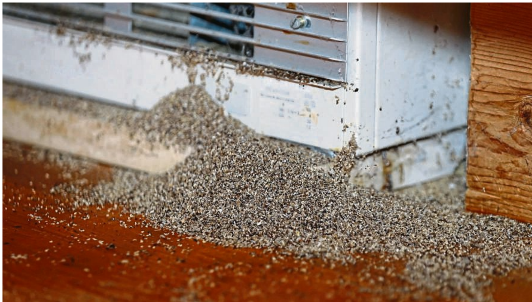
Geraten Ameisen erst einmal in die Elektrik, Kabelkanäle oder die Heizungen, sind in der Regel Profis gefragt.

«Ebenfalls gefährlich sind Hygieneschädlinge wie die Pharaoameise, die eiweißrei-