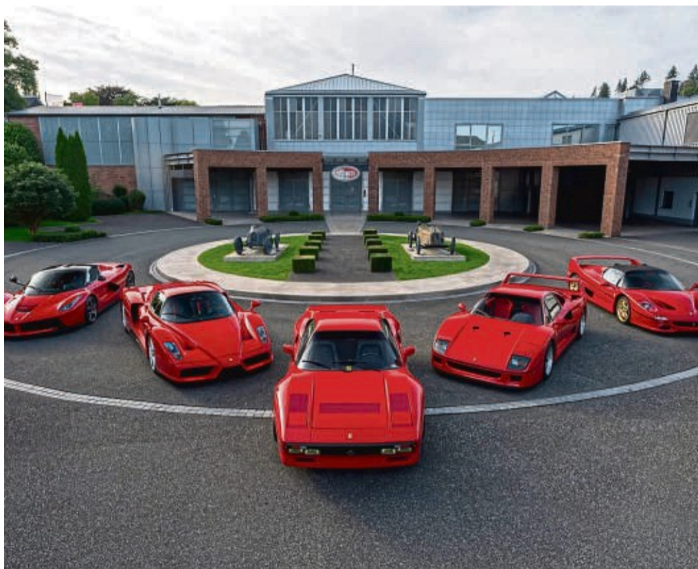
Wie ein Kind im Bonbonladen: Welchen von diesen legendären Top-Ferrari würden Sie fahren wollen - vielleicht den 288 GTO (Mitte) oder lieber den F40 (rechts davon)?

Dabei hat Ferrari in der Rückschau ganz unterschiedliche Register gezogen. Drei Autos aus dem Fuhrpark der Loh Collection machen das mehr als deutlich. Dem Wesen nach am nächsten am Kern der Marke ist aus die-