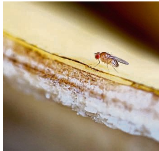
Unerwünschte Mitesser: Fruchtfliegen umschwirren im Sommer gerne den Obstkorb.