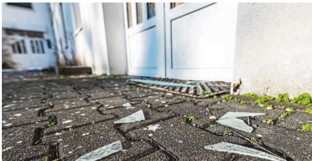
Fußball gespielt, Fenster zu Bruch gegangen? Vor dem siebten Geburtstag eines Kindes kann dieses dafür nicht zur Verantwortung gezogen werden.