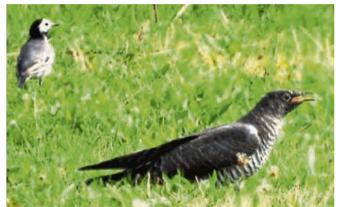
Ungleiches Paar: Vorne im Bild der junge Kuckuck bei Dodenau. Links oben eine Bachstelze, die den Kuckuck gefüttert und damit aufgezogen hat.

Den Wirtsvögeln, wie den Bachstelzen bei Dodenau, fällt es nicht auf, dass sie einen fremden Jungvogel aufziehen, der schließlich erheblich größer ist als der Wirtsvogel, die Bachstelze, selbst ist. Der Jung-Kuckuck fliegt schließlich bis nach Afrika, ohne zuvor den Elternvogel gesehen zu haben. zqa