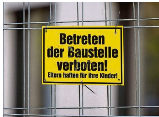
An Baustellen, Spielplätzen und Privatgrundstücken häufig zu lesen: «Eltern haften für ihre Kinder.» Rechtlich entfaltet das keine Wirkung.

Haut das Kind einem anderen in so einem Moment unvermittelt mit der Schippe auf den Kopf, werde das Gericht zu der Erkenntnis kommen, dass die Eltern im Rahmen ihrer Möglichkeiten alles getan haben. „Daraus kann man ihnen keinen Strick drehen, Eltern sind nicht verpflichtet, ihre Kin-