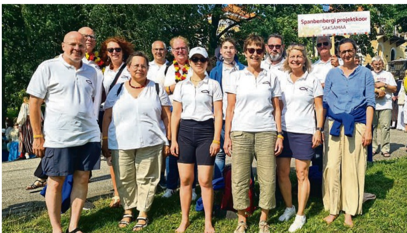
Eine Reisegruppe der evangelischen Kirchengemeinde Spangenberg war vor Kurzem beim Sängerfest und Kirchentag in Estland zu Gast.

Zudem besuchte die Reisegruppe das idyllische Kurstädtchen Haapsalu an der Ostsee und Tallinn, die