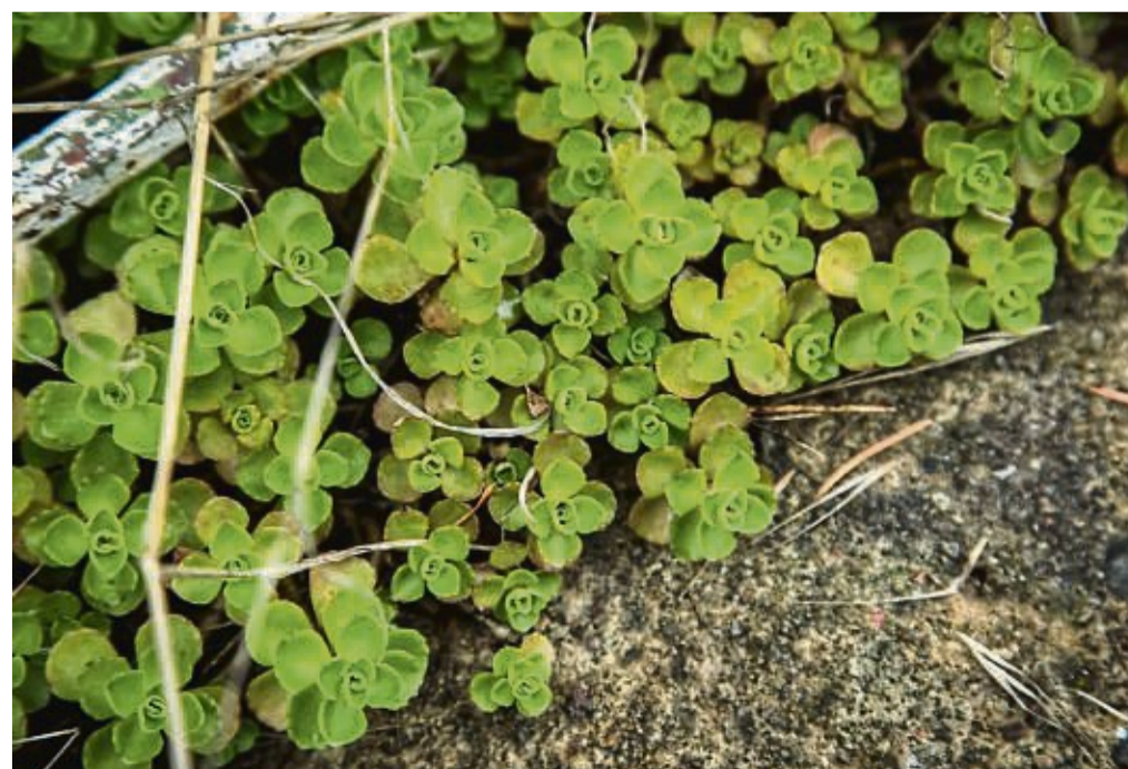
Die Kaukasus-Glanzfetthenne ( Phedimus spurius ) wird wegen der „belegten negativen Wirkungen auf verschiedene einheimische Pflanzenarten“ als invasive gebietsfremde Art für Deutschland bewertet.

Und was, wenn man die Kaukasus-Glanzfetthenne schon auf dem Dach oder im Garten hat? Entfernen müssen Sie sie nicht zwingend. Wer etwas für Biodiversität tun und verhindern will, dass sich die invasive Art weiter in der Natur ausbreitet, kann es