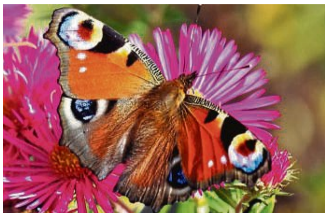
Bestand der Tagpfauenaugen sollen gesichert werden.