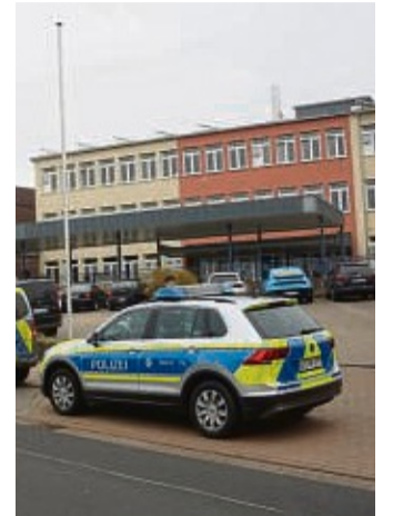
Am 26. August füllen wieder Schüler die Freiherr-vom-Stein-Schule Hessisch Lichtenau.

Hessisch-Lichtenau – Die Freiherr-vom-Stein-Schule hat ihre Termine für den Schuljahresanfang 2024/2025 bekannt gegeben. Das neue Schuljahr beginnt in Hessen am Montag, 26. August. Die Jahrgangsstufe 6 hat von der zweiten bis zur sechsten Stunde Klassenlehrerunterricht.