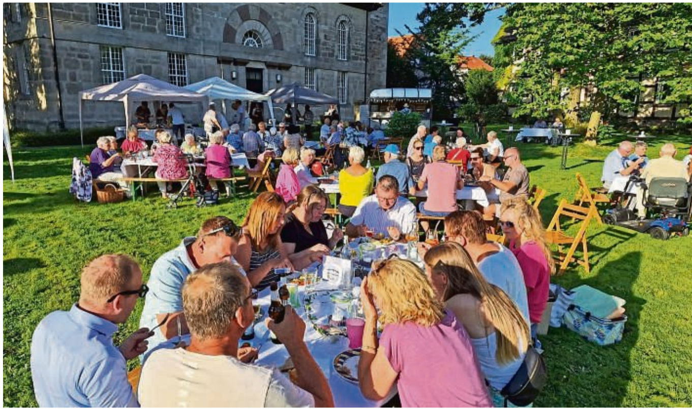
Ein tolles Erlebnis war für die Landwehrhäger das Sommer-Dinner auf dem Rasen vor der Kirche.

In Anlehnung an das vielkopierte und beliebte „Diner en blanc“ aus Paris hatten die Vereinigungsgemeinschaft die Vorbereitungen und Organisation des Festes übernommen. „Wir wollten einmal in Ruhe ohne Kinder feiern“, sagte Tischer. Sonst würden viele Veranstaltungen für Kinder im Ort angeboten. So konnten die Besucher in festlicher