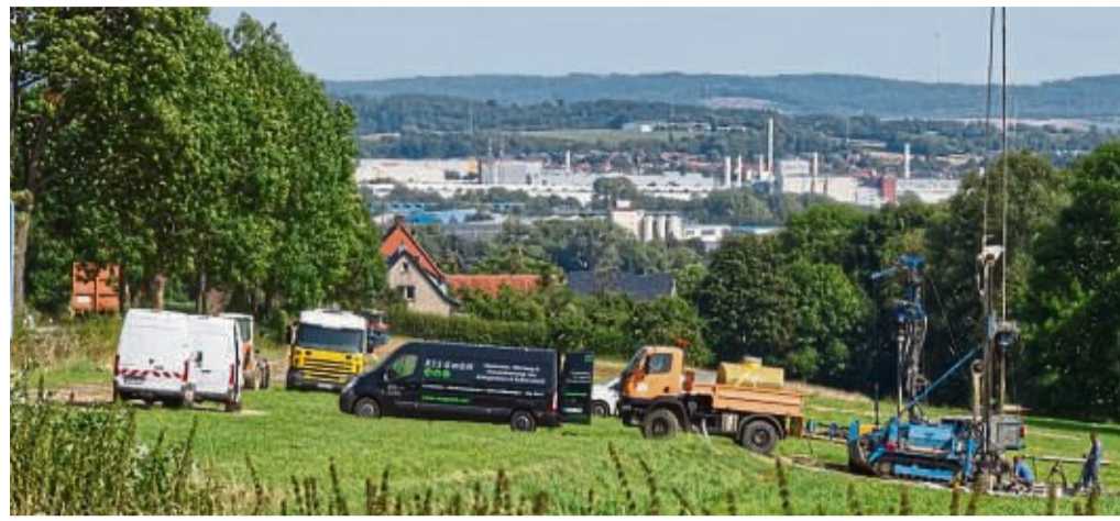
Baugrunduntersuchungen bei Leibach für den geplanten Rhein-Main-Link.

Über Bohrungen und Sondierungen werden auf der Leibacher Wiese Bodenproben entnommen, anschlie-