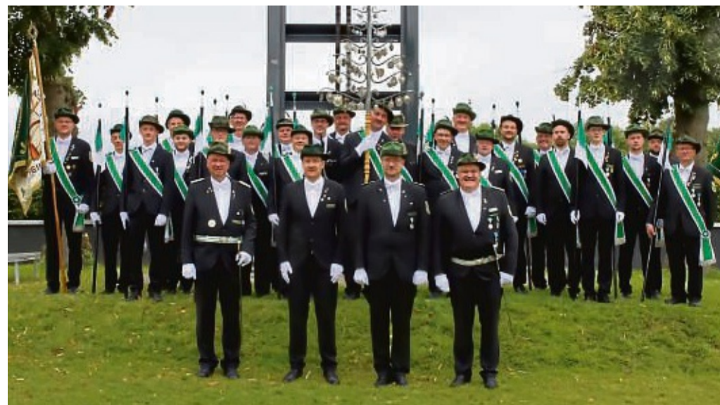
Die St. Sebastianus Schützenbruderschaft richtet in diesem Jahr das Stadtschützenfest in Medebach aus.

lich aus. Zum Stadtschützenfest sind alle Bürger der Kernstadt und Ortsteile, aber auch die Besucher und Gäste herzlich eingeladen. Die vereinte Gemeinschaft der Medebacher Schützenvereine freut sich auf ein großartiges Festwochenende bei bester Stimmung.