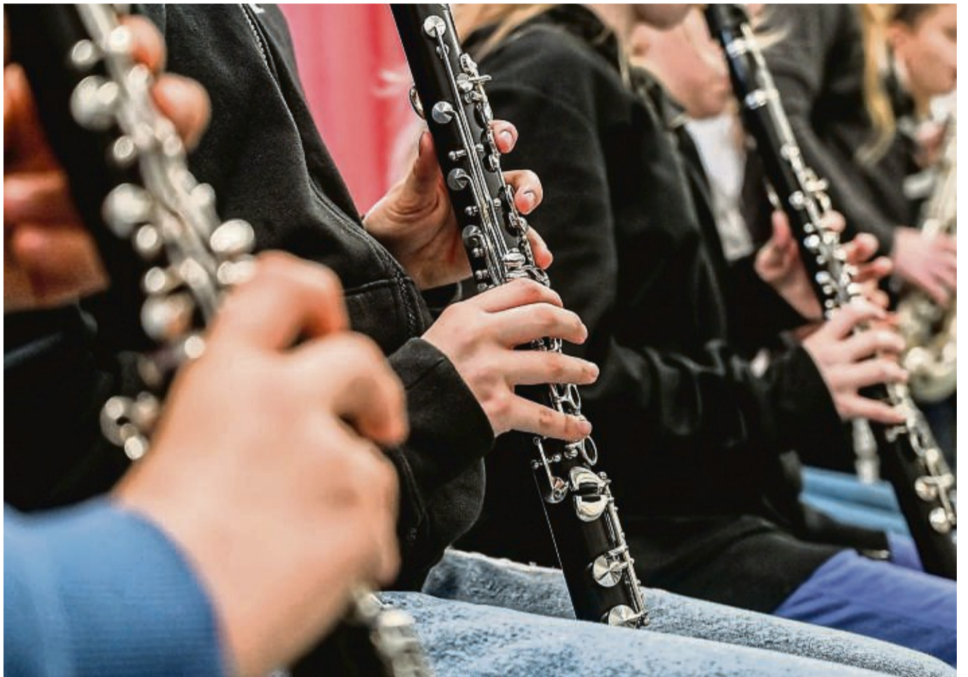
Orchesterinstrumente werden unter anderem in einem mehrmonatigen Kurs vorgestellt.

Musikschule Korbach mit vielfältigem Angebot