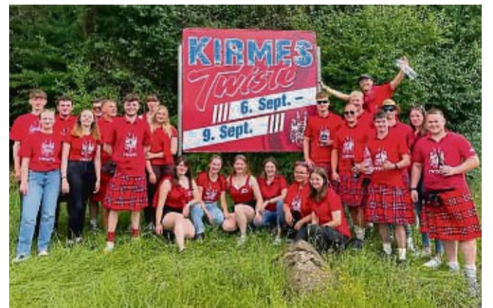
Die Kirmesburschen und Sektbargirls Twiste 2024 laden zu ihrer Kirmes ein.

Der Montag wird in traditioneller Weise mit dem Ver-