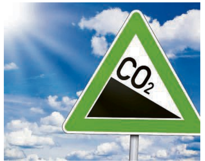
Runter mit dem Treibhausgas-Ausstoß: Das ist das Ziel auch des geplanten „integrierten Klimaschutzkonzeptes“.

Bad Wildungen weise eine Jahrzehnte lange Tradition im Klimaschutz auf. Im Jahr 1993 trat die Stadt dem „Klima-Bündnis“ der Kommunen bei. Die Vorgaben des Pariser Abkommens und des Klimaschutzgesetzes des Bundes gäben darüber hinaus einen rechtsverbindlichen Rahmen vor: Bis spätestens zum Jahr 2045 soll Deutschland Treibhausgasneutralität erreicht haben, also den Treibhauseffekt durch seine Emissionen nicht länger im Wortsinn anheizen.