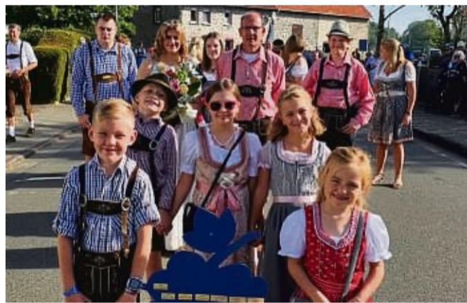
Ein sehenswerter Festzug durch Nieder-Ense ist am Sonntag geplant.