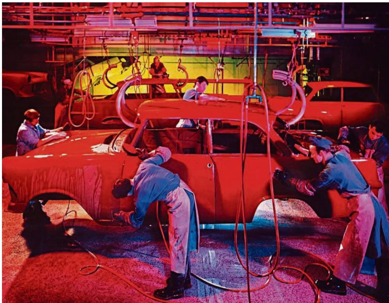
Ausstellung im Schloss Bad Arolsen: Rechts: 1961, Werbung für General Motors, links 1955, Portrait Clownness.