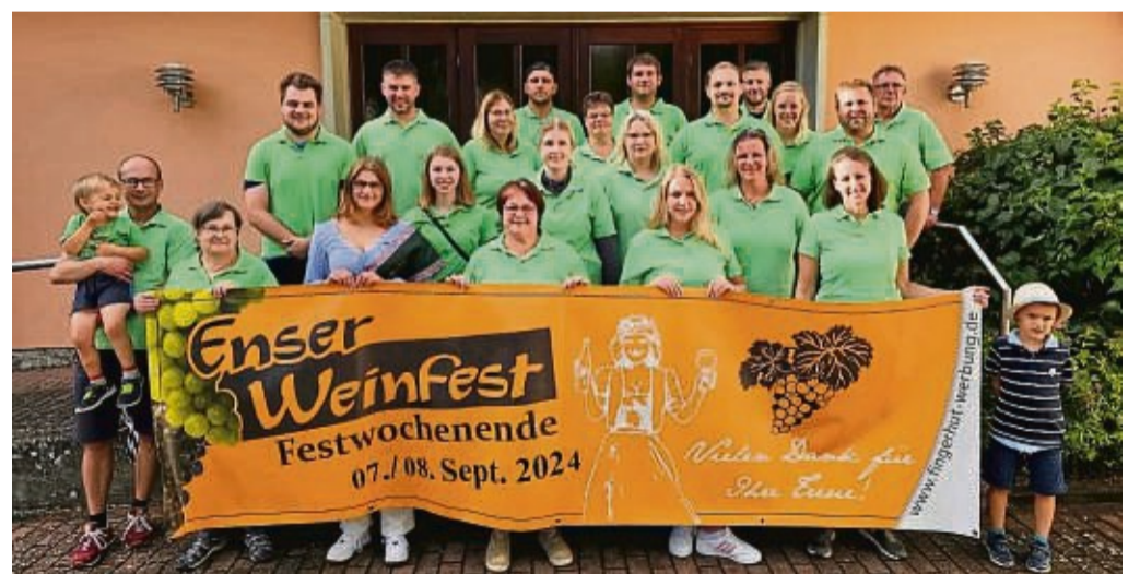
„Die Brandhölzer“ planen wieder ein zweitägiges, stimmungsvolles Weinfest, bei dem ordentlich gefeiert werden kann.

Bei der festlichen Fortsetzung am Sonntag wird es zünftig. Mit einem bayrischen Frühschoppen und den dazugehörigen Spezialitäten wird gefeiert. Die Epper Aartalmusikanten begleiten klangvoll den zweiten Festtag. Um 10 Uhr setzt sich außerdem der sehenswerte