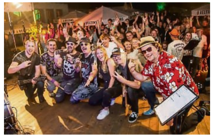
„Mission2Party“ waren bereits im Vorjahr ein Stimmungsgarant.