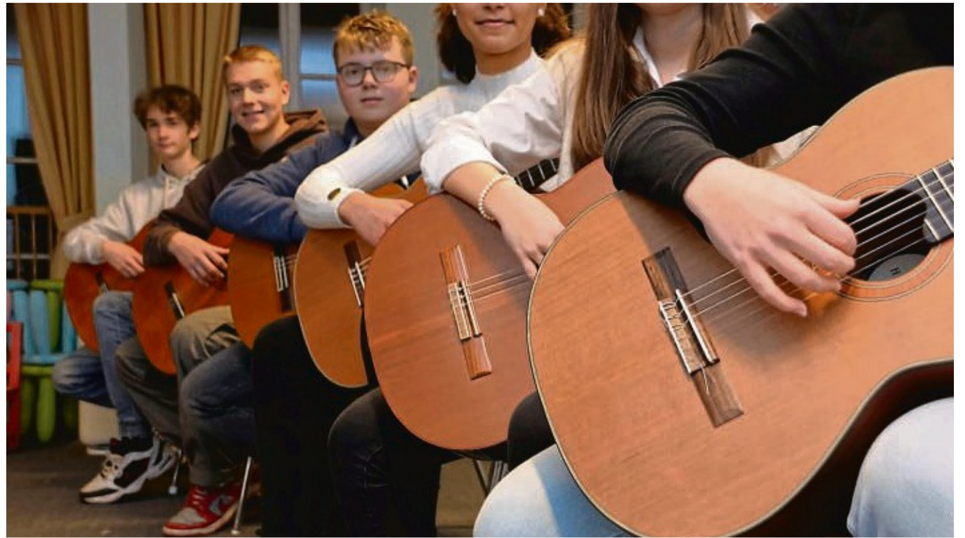
Gitarrenspieler der Musikschule bekommen im Laufe des Jahres viel Auftrittsmöglichkeiten.