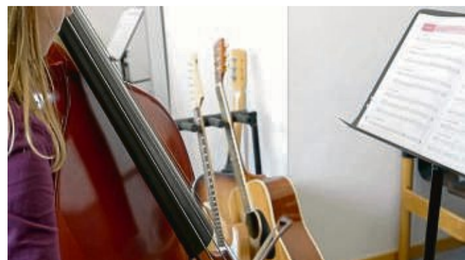
Mit Musik ins neue Schuljahr: Die Orchesterklasse ist eines von vielen bewährten und neuen Angeboten.