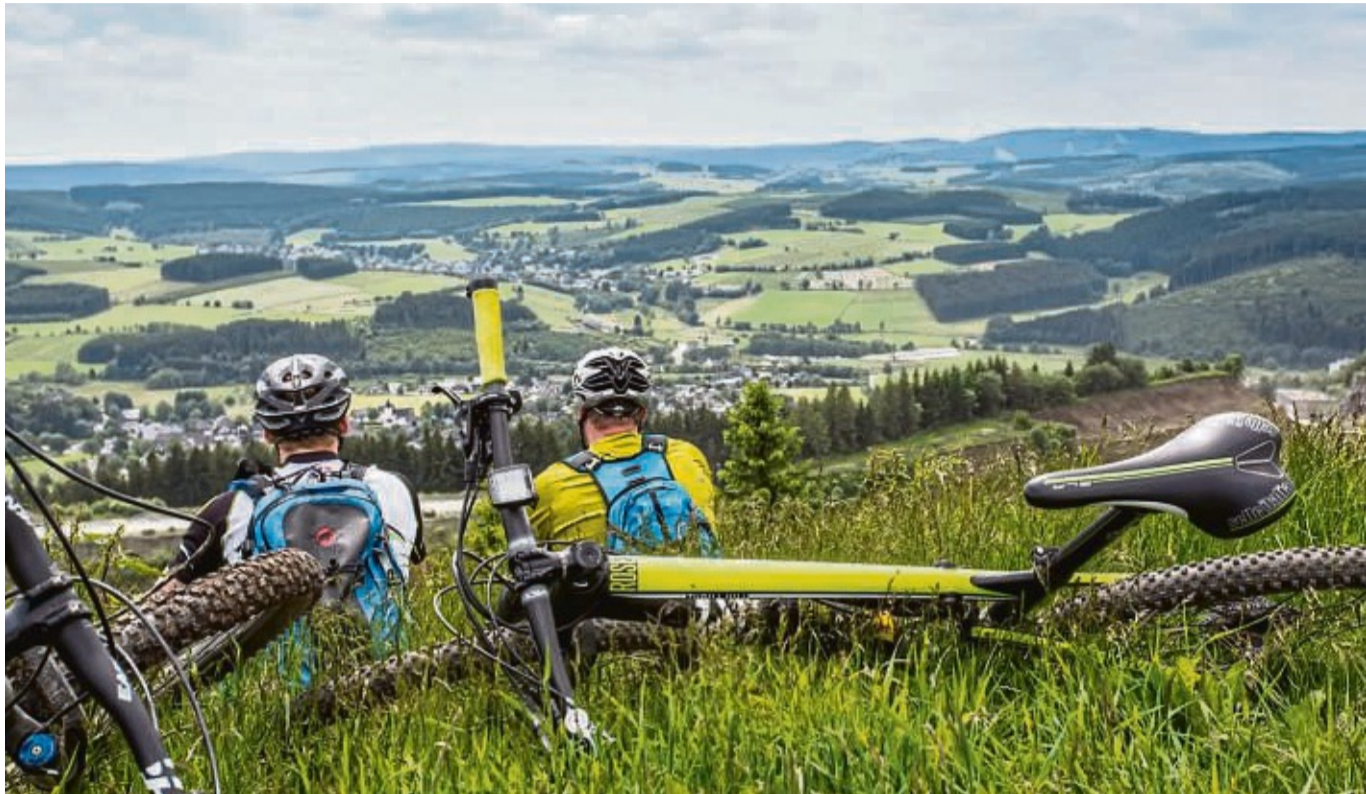
Gäste-Rekord im Mai: Unter anderem lockte das Bike-Festival viele Besucher nach Willingen.

In den Wintermonaten Januar und Februar war ein Übernachtungs-Minus von 8,3 Prozent aufgelaufen. Die frühen Osterferien spielten dem März in die Karten (minus ein Prozent). Diese Gäste fehlten dann allerdings im April (minus 8,2 Prozent). Der Mai profitierte vom guten Wetter und den vielen Feiertagen.