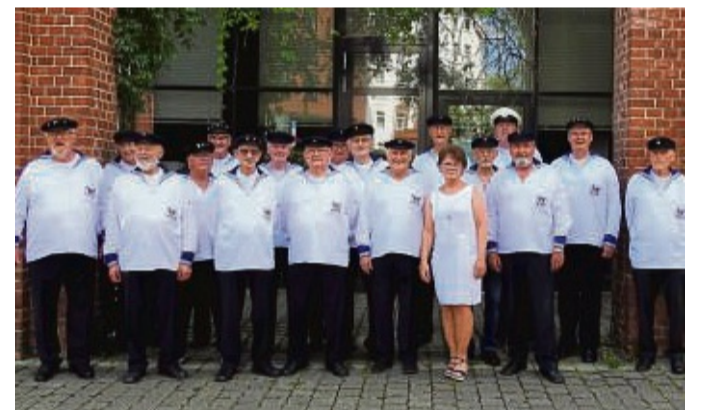
Sangen die CD in Kassel ein: die Sänger und die Sängerin des Shantychores Homberg-Borken.

Zum Chorjubiläum im September soll die CD, die in 500-facher Auflage gepresst wird, verkauft werden. Etwa zehn Euro soll das Werk kosten. „Wir singen anderen und uns zur Freude. Wir haben keine Gewinnabsichten“, sagt Paul-