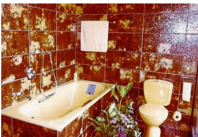
Große Muster waren das Thema, das Designer der 1970er Jahre auf Fliesen transferierten.