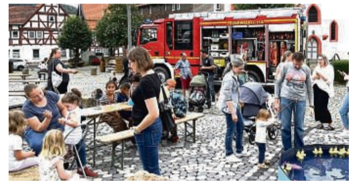
Bei der Feuerwehr konnte das Einsatzfahrzeug besichtigt werden.

Bei der Jugendfeuerwehr wurden die Kinder auf die „Balanceprobe“ gestellt und mussten über einen mit Wasser befüllten Schlauch balancieren. Die zweite Station war das „Kistenstapeln“. Außerdem konnte das Feuerwehrauto besichtigt werden. Die Feuerwehrleute standen für Fragen bereit. Der TSV 1908 Schwarzenborn hatte an seiner Station eine Hüpfburg, eine Button-Station, sowie ein Sportspiel vorbereitet. An allen Stationen bekamen die Kinder einen Stempel, für zehn gab es eine Tüte mit Süßigkeiten. Im kommenden Jahr solle es diesen Tag wieder geben, so die Veranstalter abschließend. red