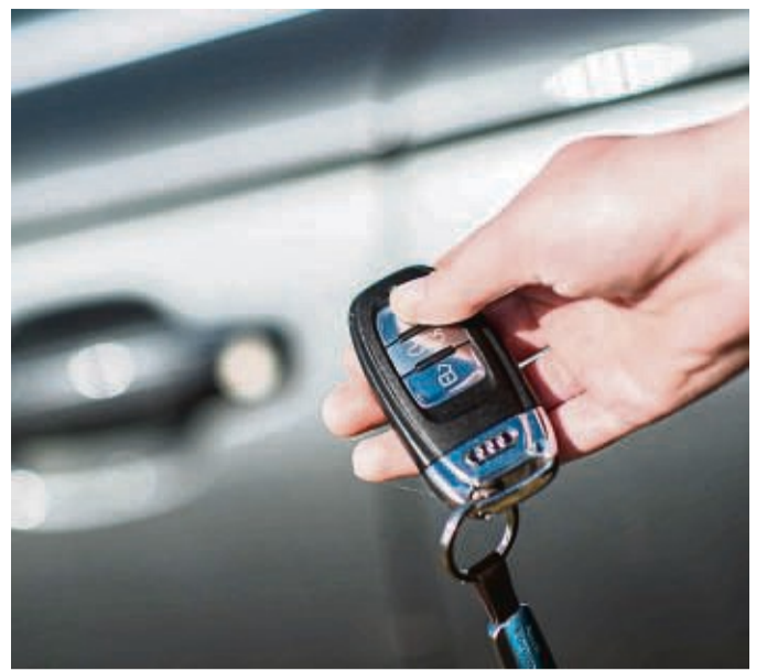
Im Kreisteil Fritzlar-Homberg sind derzeit Autodiebe aktiv, die es auf Fahrzeuge mit KeylessGo-Systemen abgesehen haben.

In den vergangenen Wochen wurden fünf Autos, alle samt der Marke Audi gestohlen. Die Diebstähle betrafen dabei die Fahrzeugtypen Q 5/7, S6 Avant und SQ 5. Die Tatorte haben sich in Wabern,