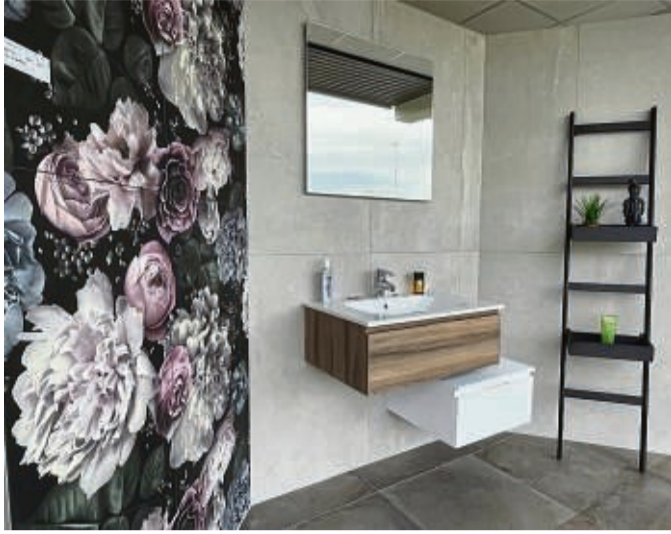
Seit 60 Jahren in Körle-Lobnhausen: Als Meisterbetrieb mit Fachhandel bietet Fliesen Schmoll auf 1200 qm Ausstellungsflächen an beiden Standorten an. Über 2000 Fliesenmodelle sind auf Lager.