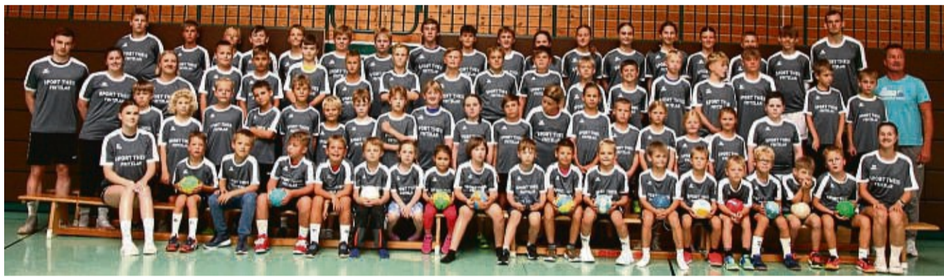
Die Teilnehmer des Felsberger Handball-Camps der JSG Dreiburgenstadt Felsberg.