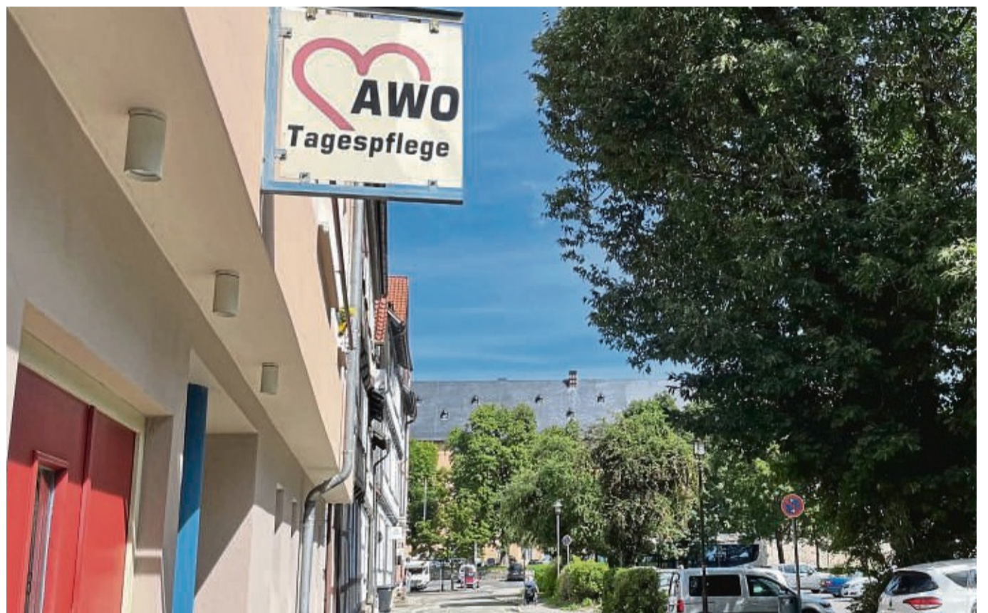
Für die Räume der Awo-Tagespflege am Plan wird derzeit über eine Nachnutzung nachgedacht.

Die Besucher haben in der Tagespflege wieder aktiv am Leben außerhalb ihrer vier Wände am Leben teilgenom-