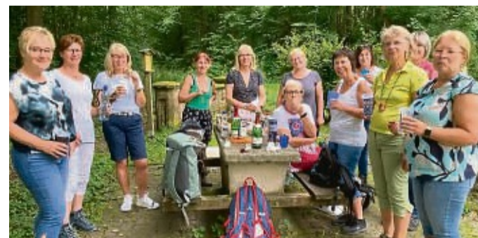
Die Frauen der MSV-Bodygymnastikgruppe stärkten sich bei einem Picknick für den weiteren Weg.

Zuschüsse habe der DSC für den neuen Vereinsbus letztlich nur einen Eigenanteil von 7400 Euro tragen müssen.