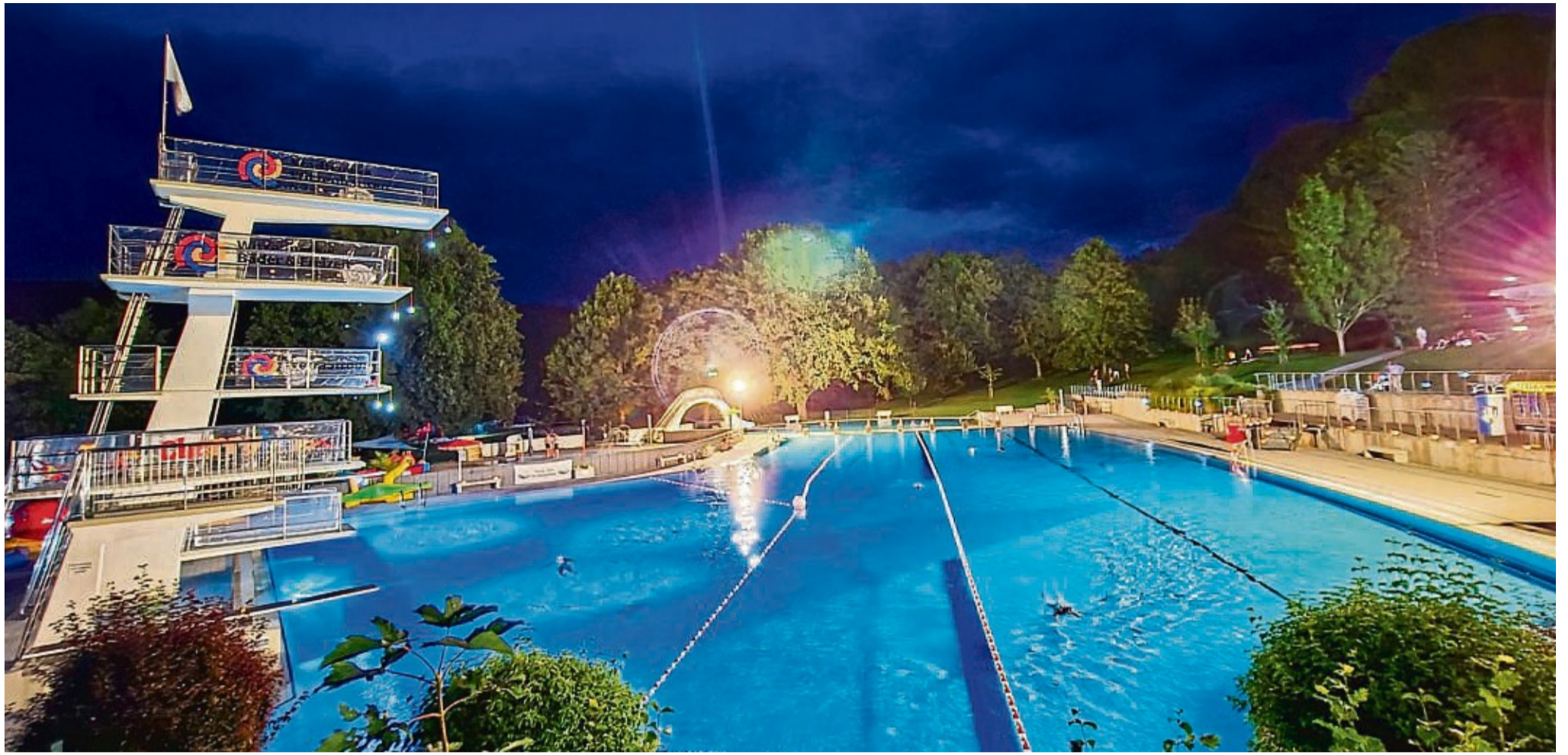
Ein ungewöhnliches Bild: Lichterketten, Unterwasserscheinwerfer, Kerzen und Flutlicht haben das Freibad Witzzenhausen zu einem besonderen Ort werden lassen.