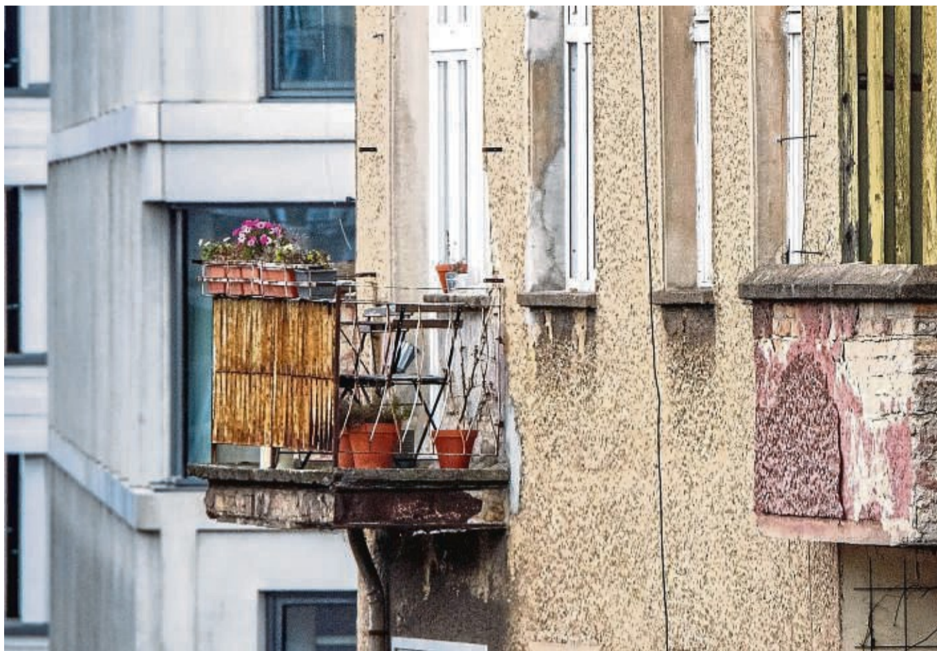
Einige Alarmsignale sollten Mieter und Eigentümer ernst nehmen: Risse im Beton, schiefe Holzteile oder Algenbildung können auf Schäden am Balkon hinweisen.