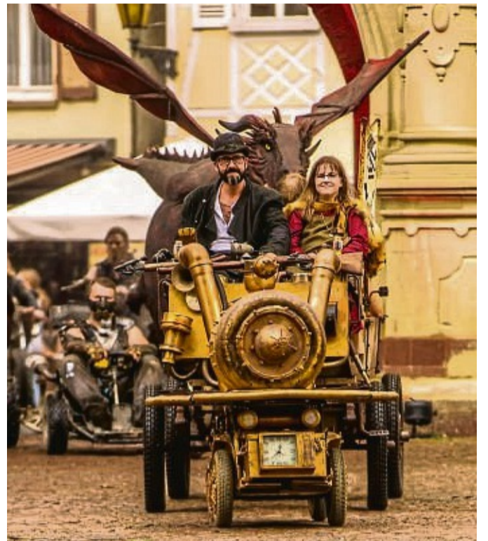
Steampunk: Beim Festival Annotopia gibt es fantasievolle Kostüme und Gefährte zu sehen.