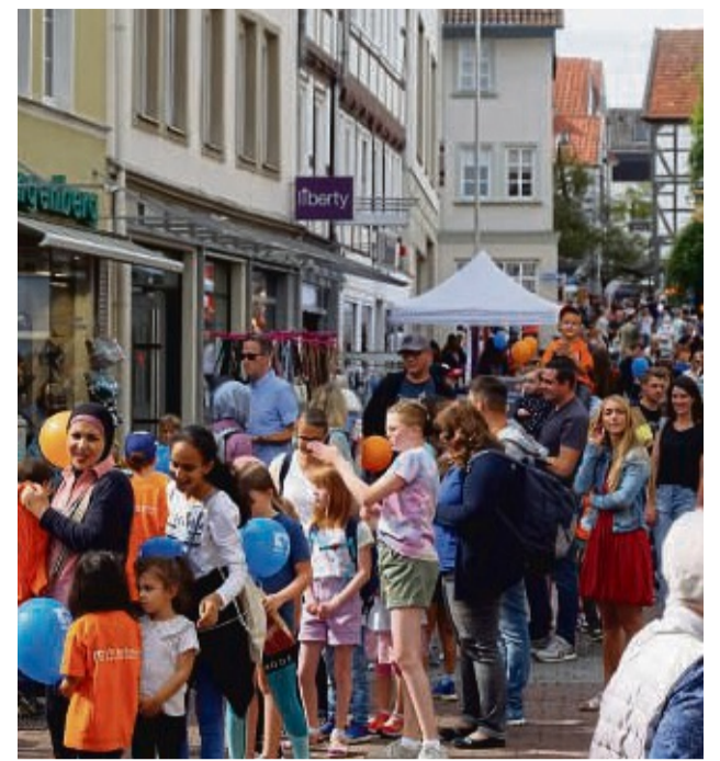
So viel Trubel wird auch zum 23. VR-Kindertag erwartet.