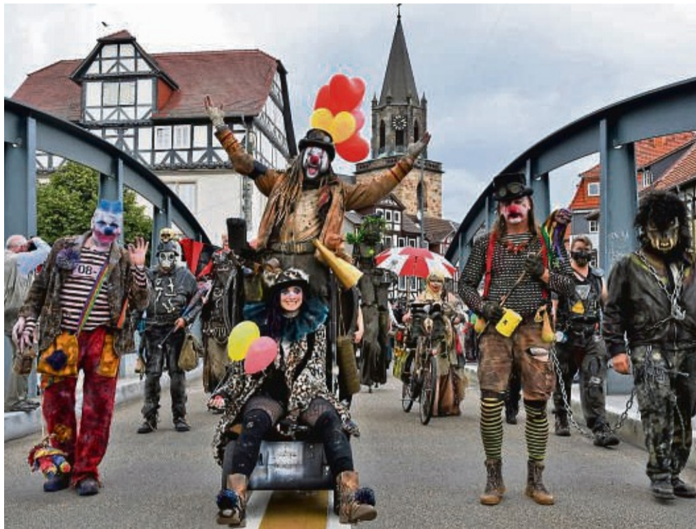
Gäste aus der Endzeit und viele andere Fantasy-Gestalten ziehen bei Annotopia durch Rotenburg.

Los geht es am Freitagabend ab 18 Uhr mit dem Annotopia-WarmUp im Schloss-