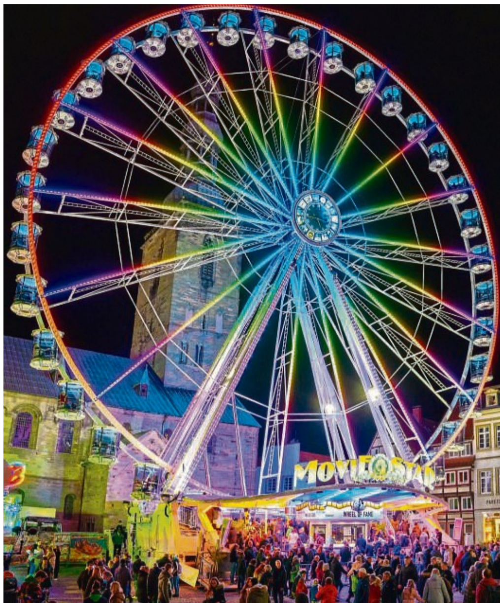
Hoch hinaus: 48 Meter hoch und mit Glasgondeln ausgestattet ist das Riesenrad „Movie Star“, das beim Lullusfest 2024 aufgebaut wird.

Die Obere Frauenstraße wird beidseitig befahrbar sein, sodass eine Zufahrt über die City Galerie, Vorderer Steingraben und Untere Frauenstraße möglich ist. Die Zufahrt zum Marktplatz ist gesperrt. Die Zufahrtsberechtigungskarten können auf der Homepage des Lullusfestes