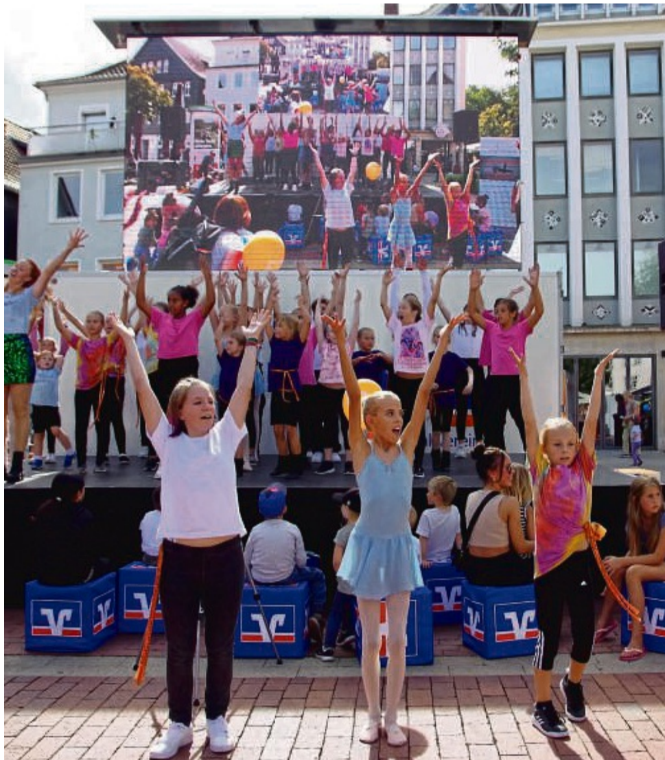
Überall in der Innenstadt gibt es Programm für Kinder. An der Bühne des Linggplatzes u.a. viele Tanzaufführungen.

In der City Galerie wird von 10 bis 18 Uhr Enten-Angeln auf der Aktionsfläche im Erdgeschoss angeboten. Außerdem gibt es im ersten Stockwerk einen Malwettbewerb für kreative Köpfe.