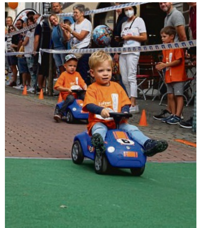
Das Bobbycar-Rennen ist wieder einer der Höhepunkte des Tages.