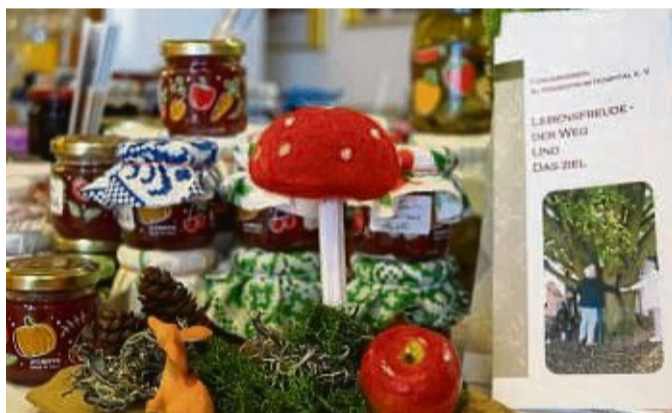
Es ist Markt im Altenzentrum Hospital.

Das Fest wird am Samstagmorgen um 10 Uhr mit einem Festgottesdienst in der Hospitalkapelle eröffnet. Um 12.30 Uhr lädt das Team von „Feelings of Oils“ zu Duftauszeiten in den Friseursalon „Ihr Stadtfriseur“, welcher