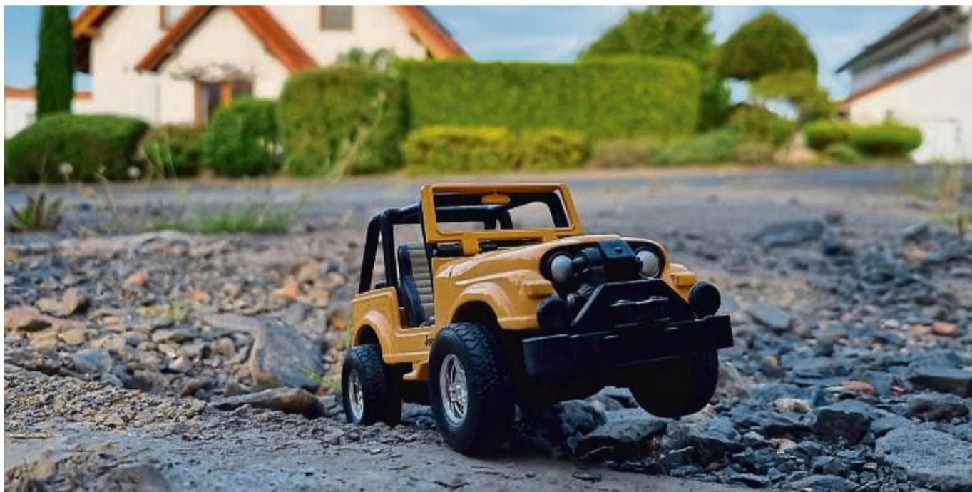
Teilweise kommt man nur noch mit dem Geländewagen durch: Zugegeben, unser Symbolbild mit Spielzeugauto ist natürlich zugespitzt, aber der Straßenzustand in vielen Gemeinden lässt arg zu wünschen übrig.