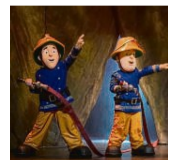
Feuerwehmann Sam und seine Freunde kommen nach Korbach.

Der Inhalt: Auf der Insel Pontypandy wurden vor kurzem uralte Dinosaurierknochen gefunden. Der spitzbüchische Norman ist begeistert, denn es bedeutet, dass echte Dinosaurier auf der Insel gelebt haben. Zusammen mit seiner besten Freundin Mandy macht er sich auf den Weg, um noch mehr Beweise dafür zu finden und riskiert dabei sein Leben. Nun müssen Feuerwehmann Sam und seine Freunde Elvis, Jenny und Kommandant Staal aktiv werden, damit es für die jungen Abenteurer gut ausgeht. Es wird eine Show mit Gesang, Tanz und spannenden