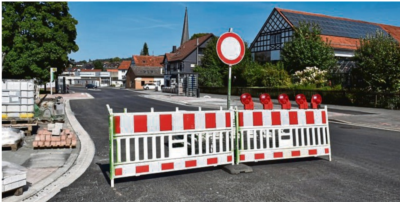
Noch ist die B-252-Ortsdurchfahrt am DGH in Bottendorf gesperrt. Im Laufe des Freitags kann die Bundesstraße wieder durchgehend befahren werden.

Bottendorf – Die Sperrung der Bundesstraße 252 in Bottendorf ist aufgehoben. Seit Juli 2023 war die Bundesstraße wegen der grundhaften Erneuerung der Fahrbahn komplett gesperrt. Ein Teil der Strecke – vom Ortseingang aus Richtung Frankenberg bis zum Neuen Weg/Abzweig in Richtung Rosenthal (Kreisstraße 98) ist schon seit Mittwoch, 28. August, offiziell befahrbar. Denn ein Abschnitt der K 98 von der Bundesstraße bis zur Landesstraße Frankenberg-Rosenthal (L 3076) wird wegen Ausbesserungsarbeiten noch bis Freitag gesperrt. Die Umleitung erfolgt über die L 3076 in Richtung Frankenberg, dort auf die B 252 nach Bottendorf – und umgekehrt. Der weitere Abschnitt der Bundesstraße bis zum Dorfgemeinschaftshaus in der Dorfmitte wird dann