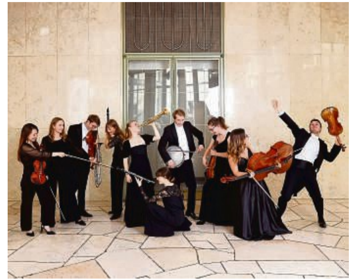
Die Orchesterakademie des HR-Sinfonieorchesters gestaltet das letzte Schlosskonzert der Saison im Schloss.