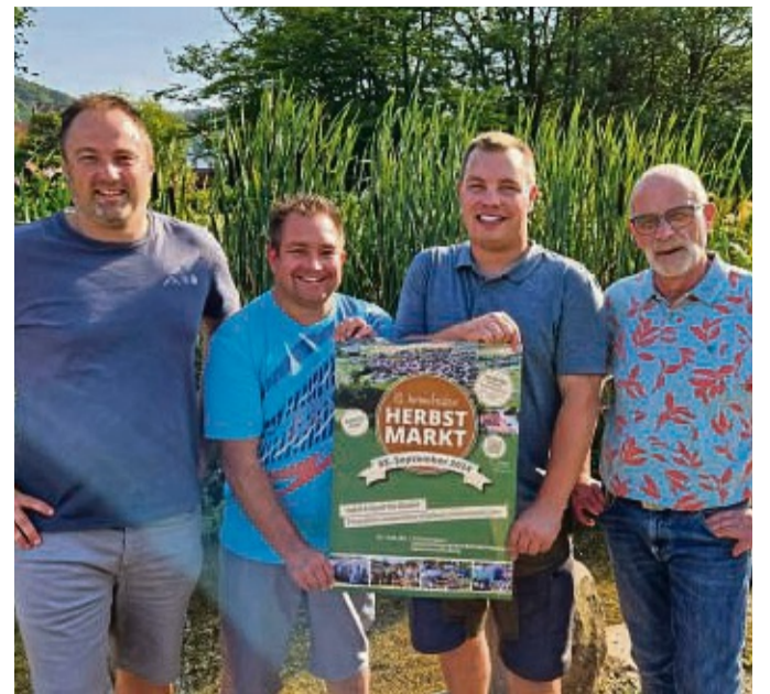
Der Arbeitskreis Herbstmarkt lädt ein.

2004 feierte Armsfeld sein 750-jähriges Bestehen an der neuen Teichanlage. Die Veranstaltung legte den Grundstein für den in zweijährigem Rhythmus ausgerichteten Herbstmarkt. red