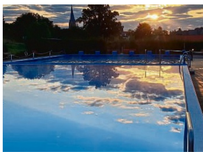
Im Vordergrund ist das neue Nichtschwimmerbecken des Walmebades zu sehen.

stellt wird. Aber auch für nicht Technikinteressierte wird Einiges geboten. So wird um 14.30 Uhr eine Yoga-Stunde angeboten. Die Kinder können sich auf einer Hüpfburg austoben. Für das leibliche Wohl wird mit selbstgebackenem Kuchen gesorgt. Dazu gibt es Leckeres vom Grill, Pommes und kalte Getränke. Das Bad wird bis 8. September für unsere Badegäste geöffnet sein. Der Förderverein lädt alle Interessierten zum Saisonabschluss und der Informationsveranstaltung ein.