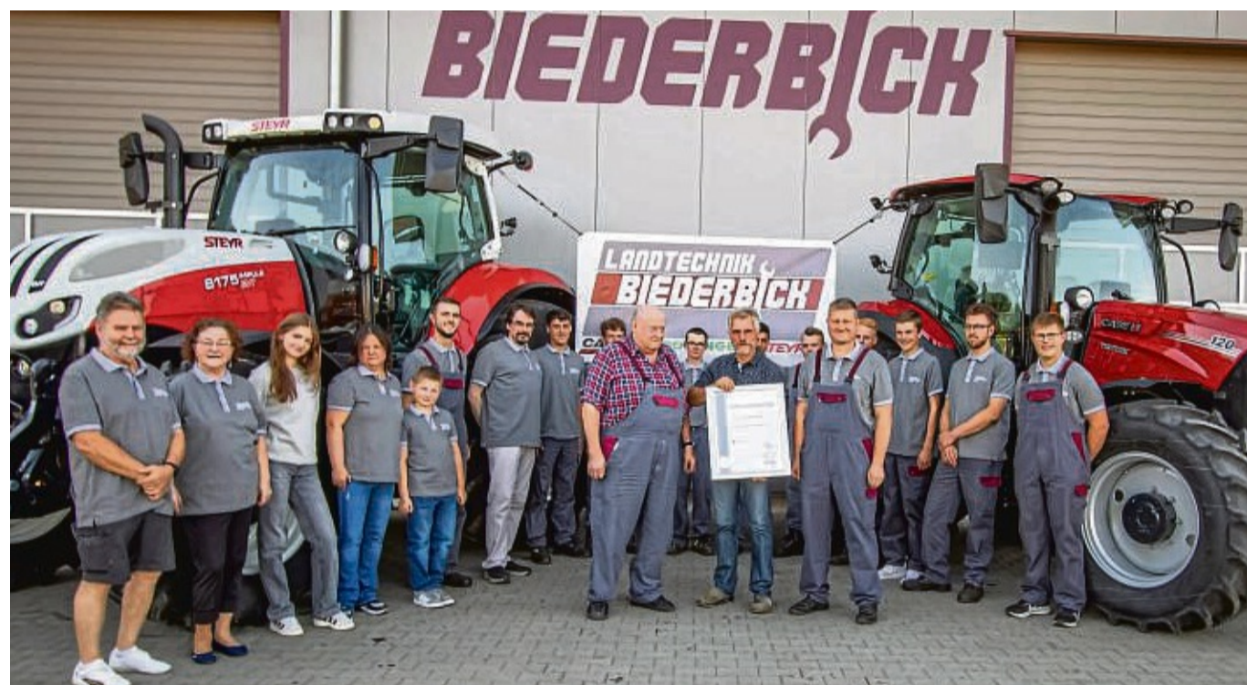
Das Team von Landtechnik Biederbick lädt ein, am 15. September gemeinsam Jubiläum zu feiern.