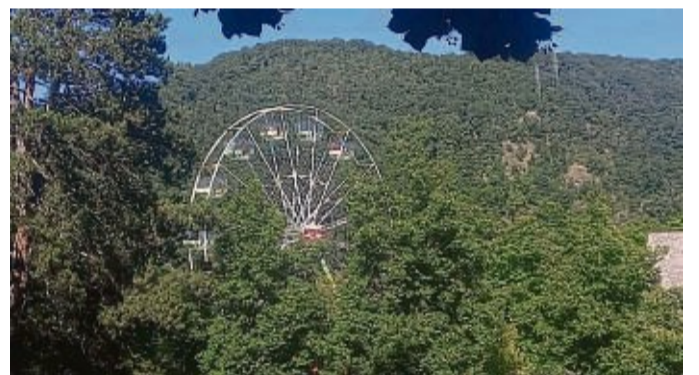
Das Riesenrad soll 2025 wieder Platz finden am Besucherzentrum Edersee.

soll 2025 ein wesentlich längeres Gastspiel hervorgehen. Der Antrag bezieht sich auf die Zeit vom 19. Juni bis zum 31. August 2025. Die hessischen Sommerferien im nächsten Jahr beginnen am 7. Juli und enden am 15. August. Die Familie Hans hat auch beantragt, zusätzlich zum Riesenrad einige Buden betreiben zu können. Deren Angebot solle laut Gemeinde der bestehenden Gastronomie an der Sperrmauer keine Konkurrenz machen. su