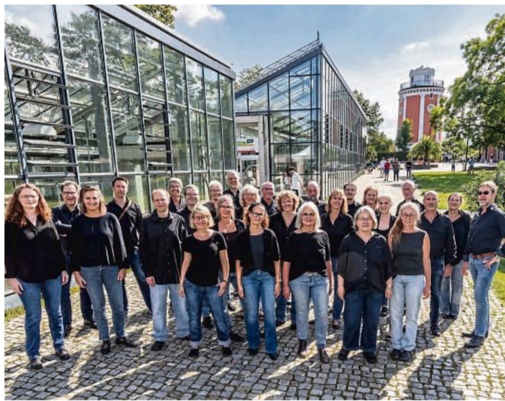
Der Kammerchor „amici del canto“ aus Wuppertal gibt am Samstag, 14. September, ein Konzert in der Vöhler Synagoge.