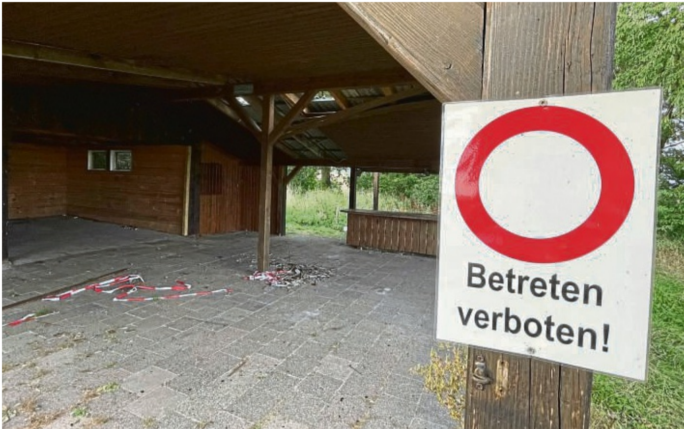
Betreten verboten: Nicht alle Besucher halten sich an das Schild auf dem Gelände „Kuckuck“ oberhalb von Helsen. Immer wieder kommt es zu Vandalismus.