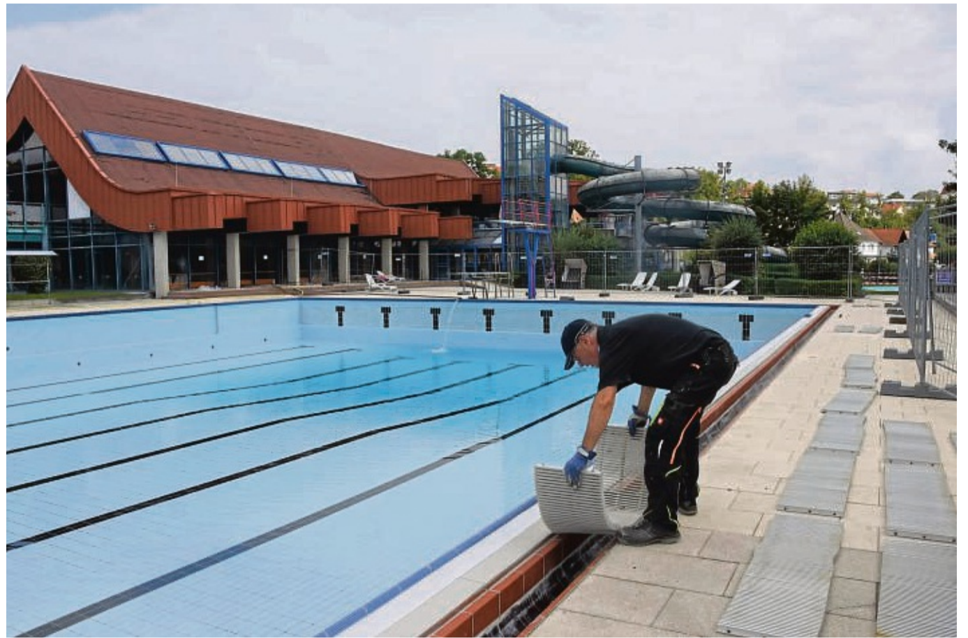
So groß soll ein neues Freibad nicht werden: Im Bild Reinigungs- und Pflegearbeiten im Heloponte nach dem Einbau eines neuen Beckenkopfs im Sommer 2021. Zwei Jahre später wurde die gesamte Anlage geschlossen.

Die Vorgaben sollten knapp gehalten werden. Wenn klar sei, „was wir im Groben erwarten, dann muss die Verwaltung ans Werk gehen und versuchen, das