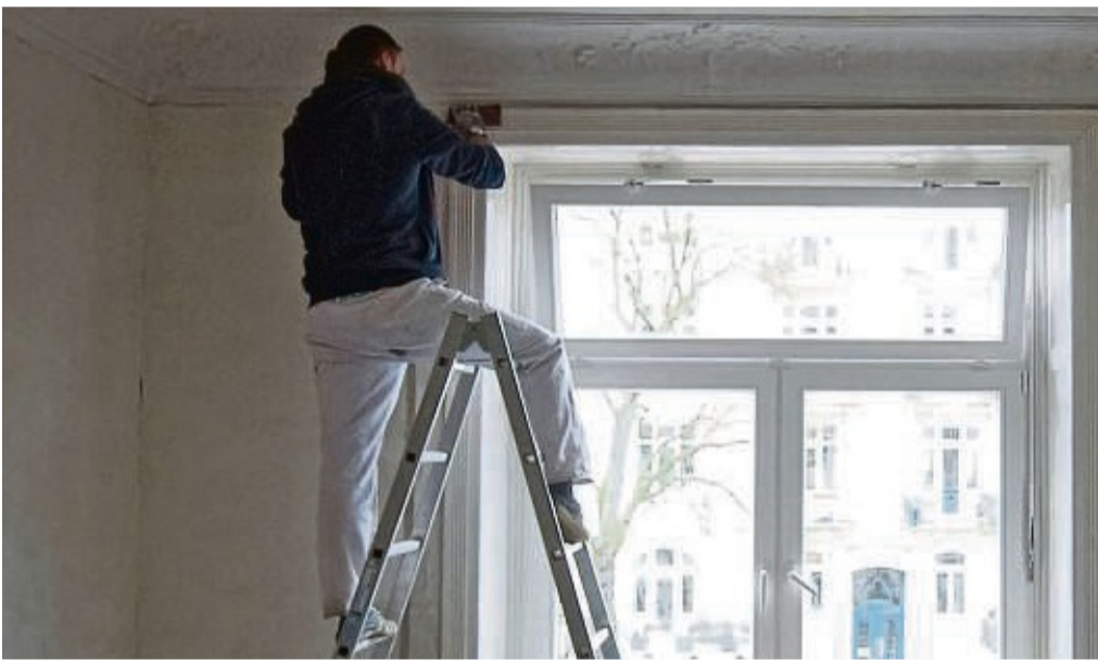
Wer eine Wohnung renovieren lassen will, hat zurzeit wieder bessere Chancen, einen Handwerker für diese Arbeiten zu finden.

„Stattdessen lassen die Anfragen nach, so dass Betriebe länger liegen gebliebene Aufträge endlich abarbeiten können“, sagt Kai Bremmer, Geschäftsführer der Kreishandwerkerschaft. Was für die Kunden positiv ist, hat auch eine andere Seite: „Die Anfragen lassen nach, denn es herrscht eine Zurückhaltung vor allem bei Privatleuten“, weiß Kai Bremmer. „Das Geld wird knapper, die Lebenshaltungskosten und die Baukosten steigen. Zudem ist das