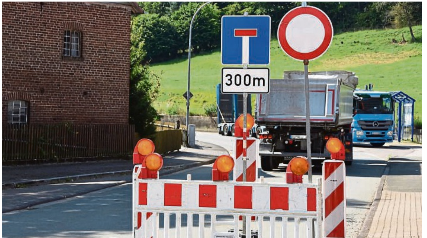
Die Arbeiten laufen bereits: Die Kreisstraße zwischen Ober-Ense und Immighausen wird ausgebaut. Es entsteht hierbei auch ein Geh- und Radweg. Voraussichtlich bis Juli 2025 ist die Straße voll gesperrt.

„Abschließend werden die Höhenlagen der einmündenden Wirtschaftswege angeglichen und die Schutzeinrichtungen, Markierungen und Beschilderungen angebracht.