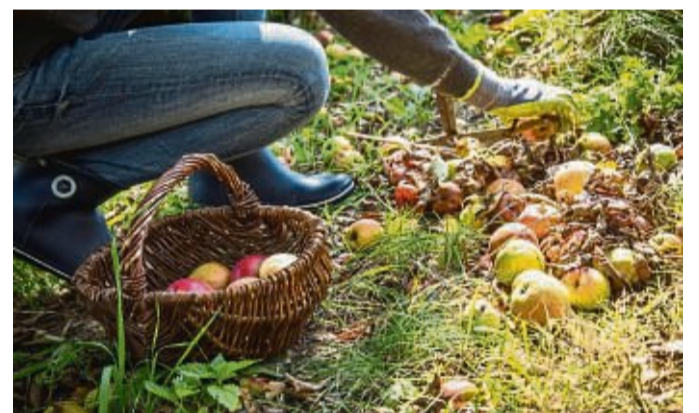
Besser nicht liegen lassen: Fallobst im Garten sollte man aufheben, um Schädlinge und Krankheitsbefall zu vermeiden.