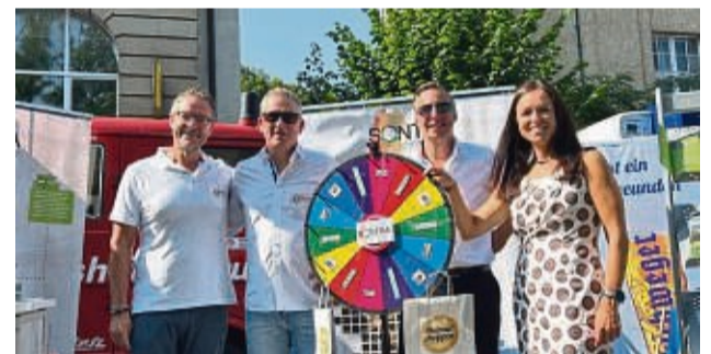
ASH und Stadt präsentierten gemeinsam die Berg- und Hängelstadt Sontra

Neben zahlreichen Informationen über die Stadt, einem Glücksrad, bei dem man Einladungen für die bevorstehenden Veranstaltungen in Sontra und weitere Dinge erdrehen konnte sowie kostenlosen Bierkostproben der AKE, hatte der Messestand viel zu bieten, weshalb über den gesamten Tag hinweg mächtig was los war und man daher resümieren kann, dass es für alle Beteiligten ein wahrlich klasse Tag mit vielen Gesprächen und tollen Begegnungen war.