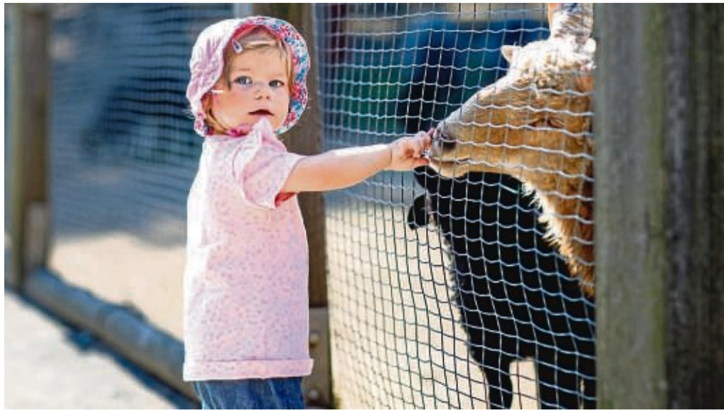
Spiel, Spaß und Tierliebe: Die BKK Werra-Meißner vereint beim großen Kinderfest im Bergwildpark in Germerode gleich drei Magneten.