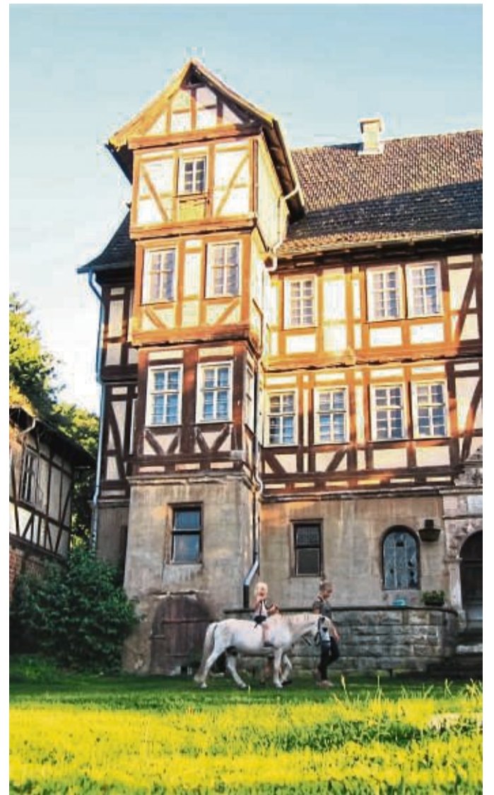
Das 1576 erbaute Herrenhaus auf dem Rittergut in Aue.

Aue macht mit beim Tag des offenen Denkmals