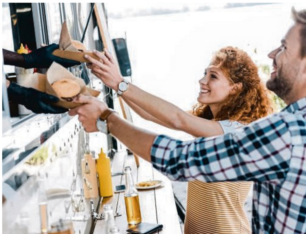
Am kommenden Wochenende lädt Wolfhagen zu einer kulinarischen Entdeckungsreise im Rahmen der 3. Auflage des Streetfood Spektakels ein.

► ihk.de/kassel-marburg/brancheninformationen/handel/aktionstage-heimat-shoppen