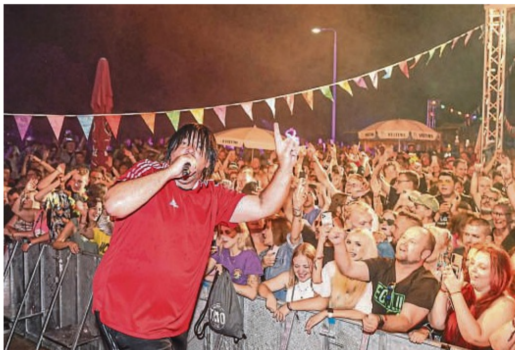
Er bringt die Feiermeute zum Toben: der Partyschlagersänger Ikke Hüftgold. Hier eskaliert zu seinen Gesangskünsten das Publikum im westfälischen Hamm, wo er im vergan- genen Jahr zu Gast war.

Tickets kosten im Vorverkauf 26 Euro und sind erhältlich über Reservix.de, im Concept Store und bei der Buchhandlung Mander. An der Abendkasse kostet der Eintritt 28 Euro.