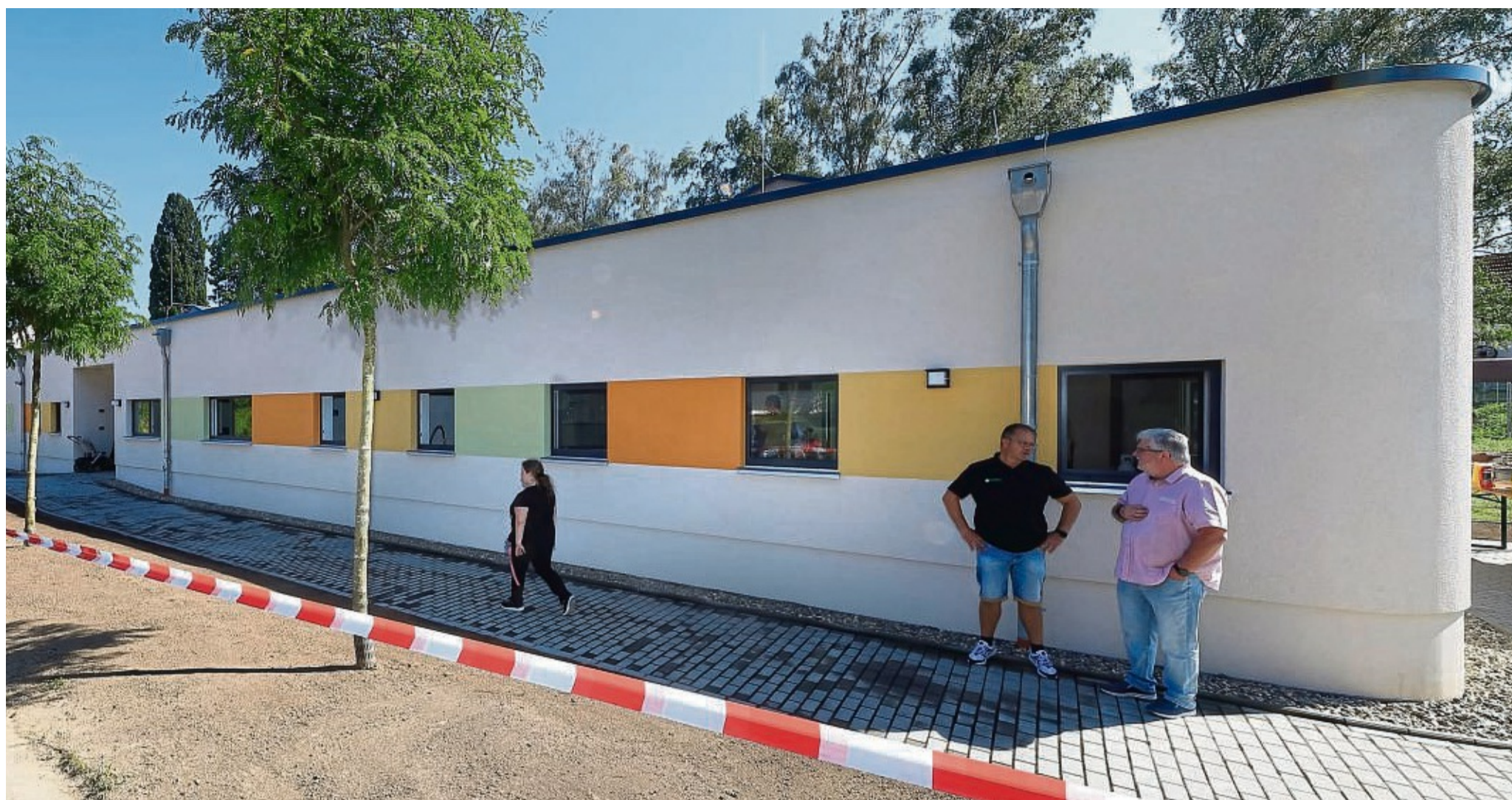
Prägnante Architektur: Auf dem ehemaligen Viehauftriebplatz am Reithagen steht jetzt der gleichnamige neue Kindergarten, dessen Gebäudeecken rund ausgeformt sind. Die Außenanlagen vorne wurden erst in der Nacht vor der Einweihung fertig, hinten wird noch gearbeitet.