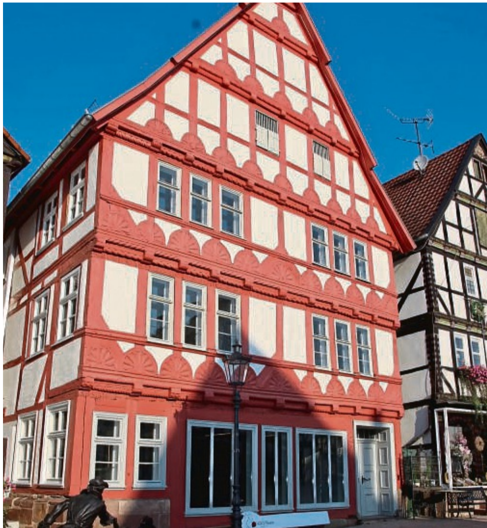
Bürgerhaus der Renaissance: Das Haus Markt 5 erstrahlt außen wie innen von neuem Glanz.

Erhalten blieb das „Guckloch“ in den Keller des Gebäudes. Das wo früher die Würfelzene nachgestellt war, soll es auch künftig etwas zu sehen geben. „Lassen Sie sich überraschen“, gibt sich Bauamtsleiter Dirk Lindemann rätselhaft.