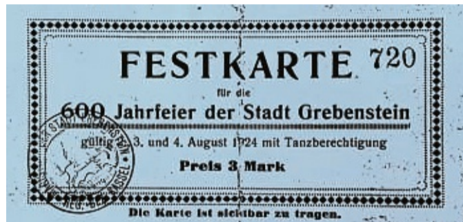
Historisch: Diese Marke gab es vor hundert Jahren und dieses Mal wieder.

Ab 11 Uhr stehen Vereine und örtliche Institutionen im Fokus: Rund um das Rathaus wollen sie Einblicke in ihre Arbeit geben und auch unterhalten. Besonders wird dabei die Lasertagarena sein – ein Angebot des Jugendzentrums. Mittels Infrarotstrahlen können Besucher