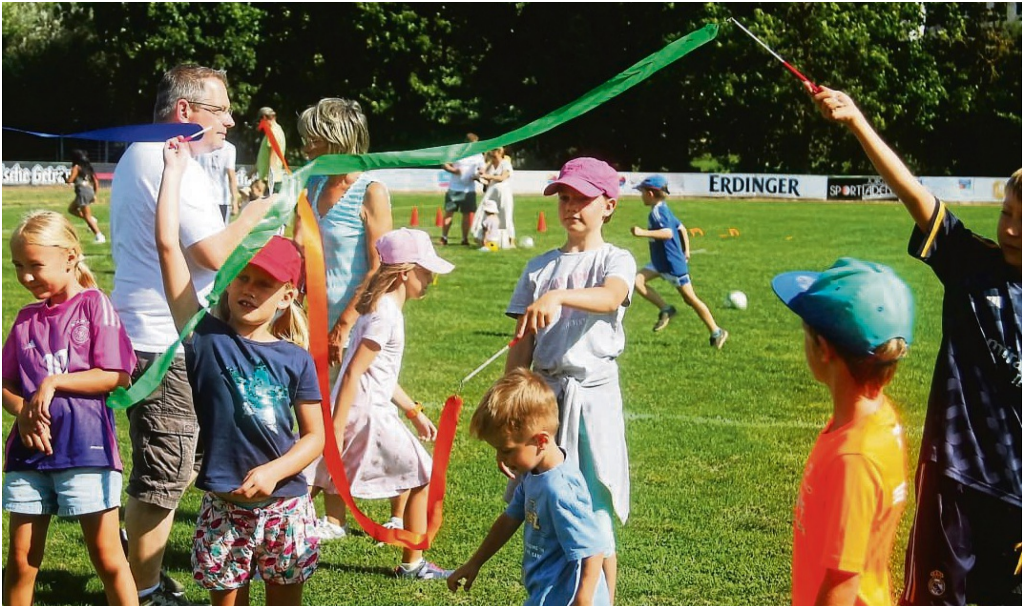
Es flattert bunt: beim Kindertanz mit Bändern auf dem Spielfest in Zierenberg.