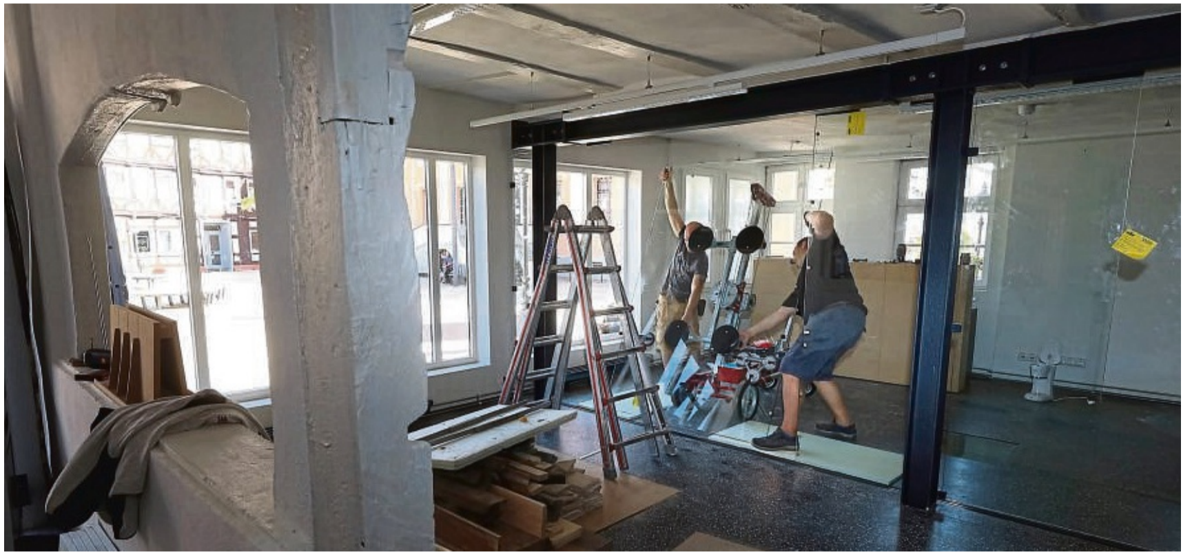
Kraftakt: Die Monteure schleppten am Dienstag die jeweils 100 Kilogramm schweren Glastrennwände aus dem Lieferwagen ins Gebäude. Die millimetergenaue Montage erfolgte dann unterstützt von einem Lifter.