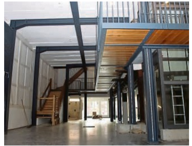
Blick ins Innere: Eine große Halle, die historische Treppe sowie der neue Fahrstuhl präsentieren sich harmonisch in dem historischen Gebäude.

Das fast 500 Jahre alte Haus den Hofgeismars. Nun erstrahlt es in neuem Glanz und wird auch bald wieder komplett genutzt werden. zgi