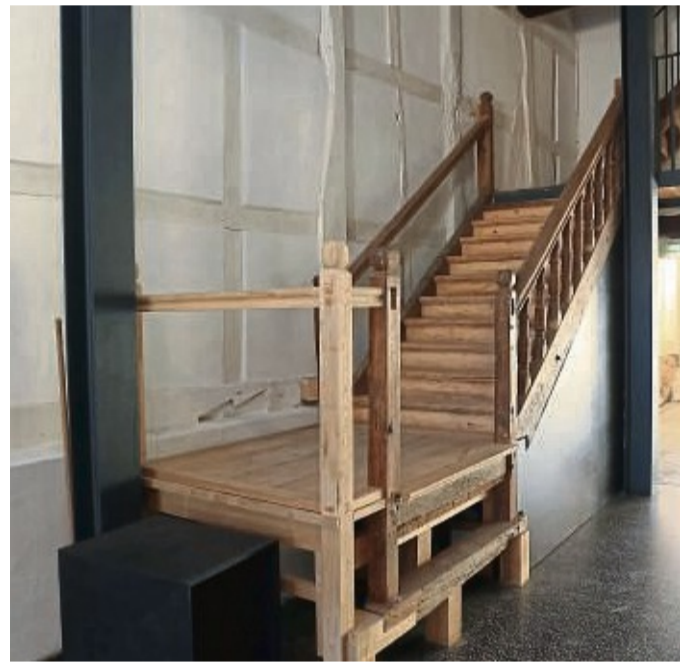
Die Holzterrasse wurde mit einigen Neuteilen restauriert. Zur Sicherheit wurden zwei weitere Treppen gebaut.

Die Veranstaltung am 8. September ist offizieller Bestandteil des Denkmaltages „Zeitzeugen der Geschichte“. Die Tür ist von 12 bis 18 Uhr für jeden offen. Die offizielle Eröffnung erfolgt unter anderem mit Vertretern der Stadt und musikalischen Beiträgen. Am gleichen Tag ist auch das von der Gemeinschaft für Handel und Gewerbe ausgerichtete Apfelfest in der Innenstadt. Die im Denkmaltags-Programm angekündigte Präsentation der neuen Tourist-Info findet noch ohne Einrichtung statt. Der Einbau der gläsernen Schiebewände und die Sanitärinstallationen sind gerade erfolgt. An der wieder eingebauten historischen Treppe – sie stammt nicht aus dem 16. Jahrhundert, sondern ist ein nach-