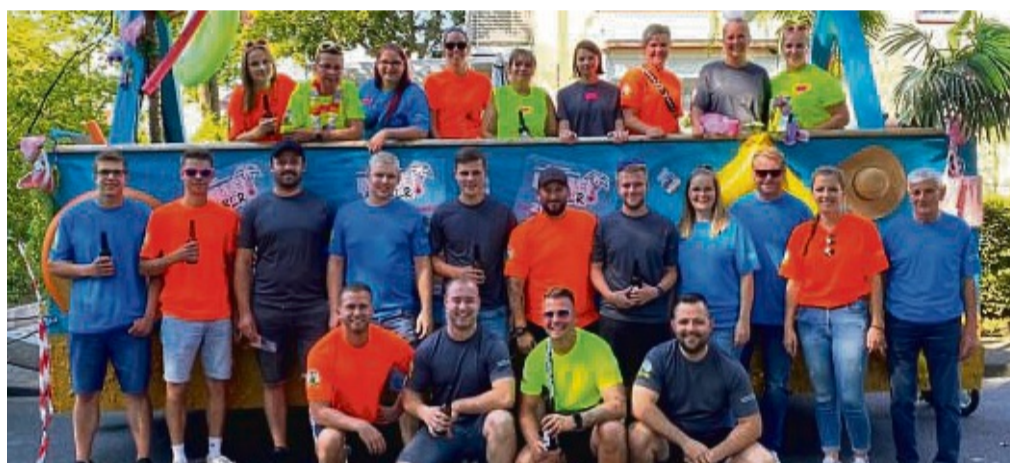
Das Partyteam freut sich auf viele Gäste: In den vergangenen Wochen wurde kräftig die Werbetrömmel gerührt.