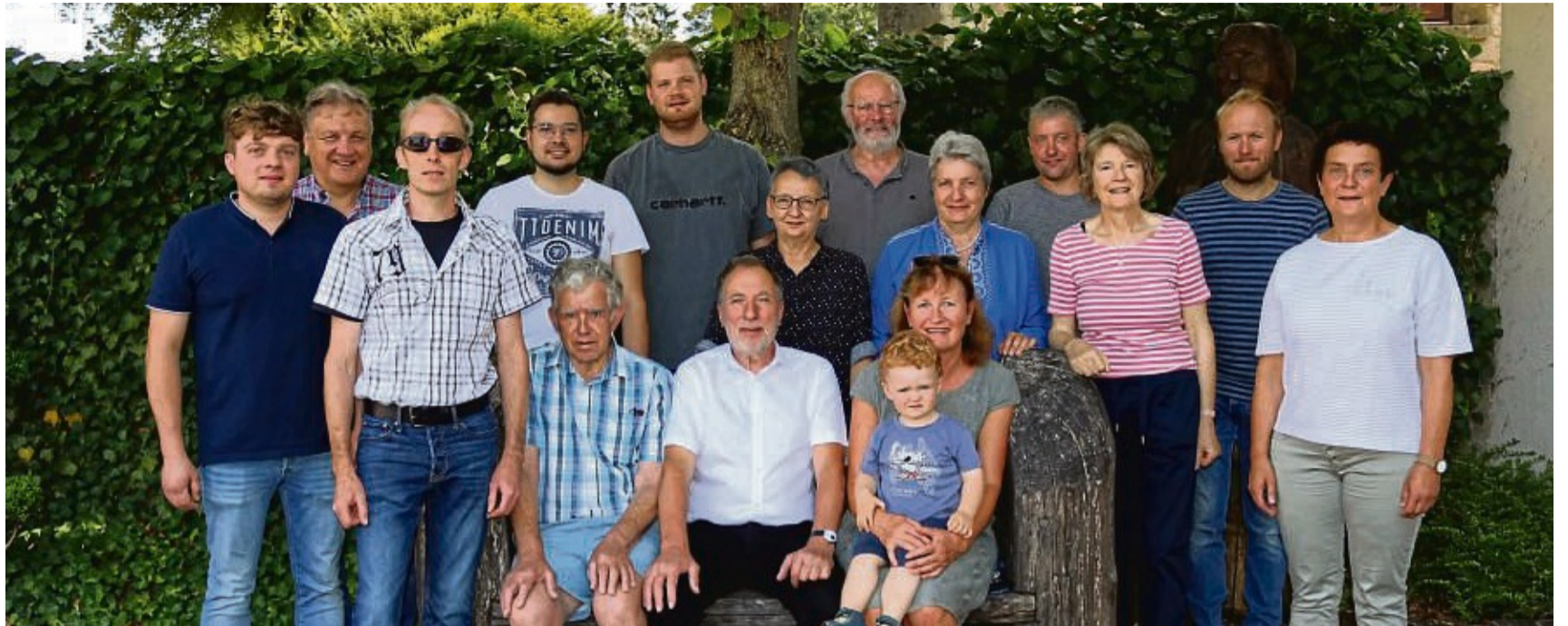
Ein starkes Team: Die Mitglieder des Kulturverein-Vorstands in Goddelsheim. Der Verein hat in den 35 Jahre seines Bestehens viel Wertvolles bewirkt.