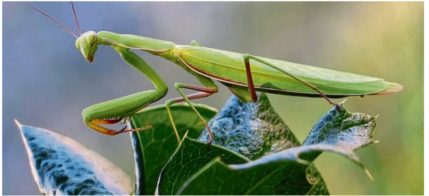
In einem Garten in Rosenthal entstand dieses Bild der bisher hier selten gesichteten Gottesanbeterin. Die Fangschrecke kann bis zu 8 Zentimeter lang werden und ernährt sich von kleineren Insekten.

Ein Unternehmen der Home & Bodyfashion GmbH & Co. KG, Paderborner Tor 104, 34414 Warburg