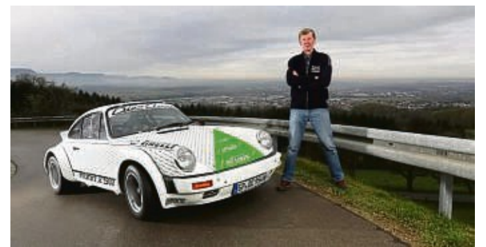
Rallye-Weltmeister Walter Röhrli präsentiert für die 3. Röhrli-Klassik den Porsche 911 XRöhrli (BJ 1975) in einem neuen Layout. Das Fahrzeug wird erstmals während des gesamten Events mit 100% E-Fuel betankt.