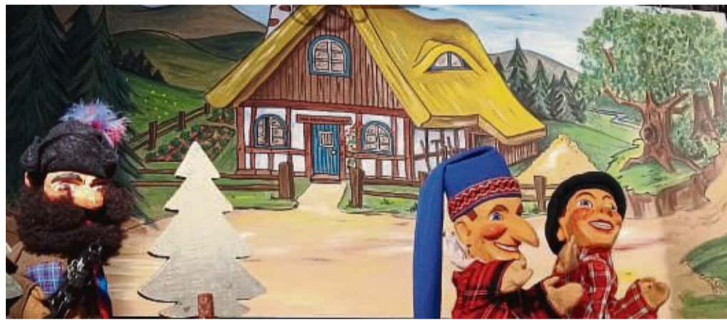
Puppentheater: Das Stadt-Theater Mengeringhausen holt Kasperl, Seppel und den Räuber Hotzenplotz zurück auf die Bühne.

zur möglichen Einführung einer Stadtpolizei in Korbach und zur Bewerbung für das Präventionsprogramm Kompass auf der Tagesordnung der Kommunalpolitiker.