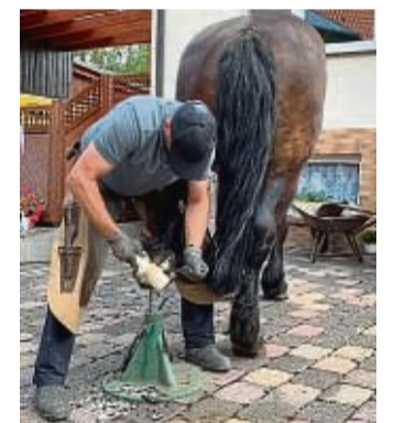
Beim morgigen Aktionstag kann einem Hufschmied auf dem Museumshof bei der Arbeit zugesehen werden.

In der gemütlich eingerichteten Küche wird für das leibliche Wohl der Besucher gesorgt. Alte regionale kulinarische Köstlichkeiten werden zubereitet und erwarten seine Liebhaber. „Deftiges Weckwerk aus eigener Herstellung mit Gurke und Salzkarotten“ kommt im September frisch auf den Tisch. Ein großes Buffet aus ausschließlich selbst gebackenen Blechkuchen erwartet die Besucher an jedem Veranstaltungstag. Zu den gemütlichen Stunden auf dem Museumshof wird während der ganzen Saison unter anderem ein hochwertiger, schmackhafter Apfelwein angeboten, der aus den im vergangenen Oktober gekelterten Äpfeln herangereift ist. Weitere Infos unter www.lebendigesmuseum.de