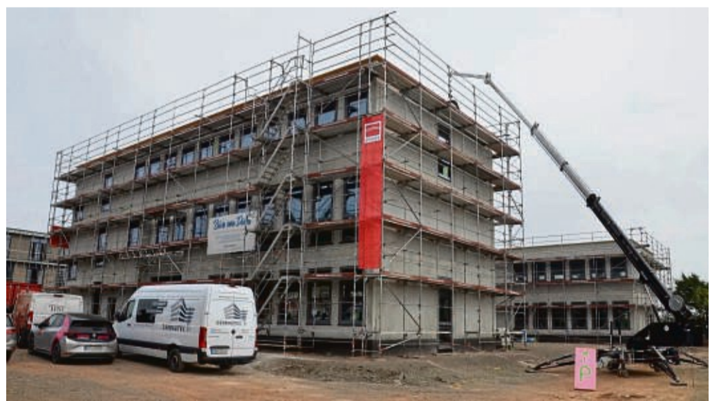
Das neue Gebäude fürs Jobcenter am Korbacher Südring hat drei Flügel und 1767 Quadratmeter Nutzfläche.