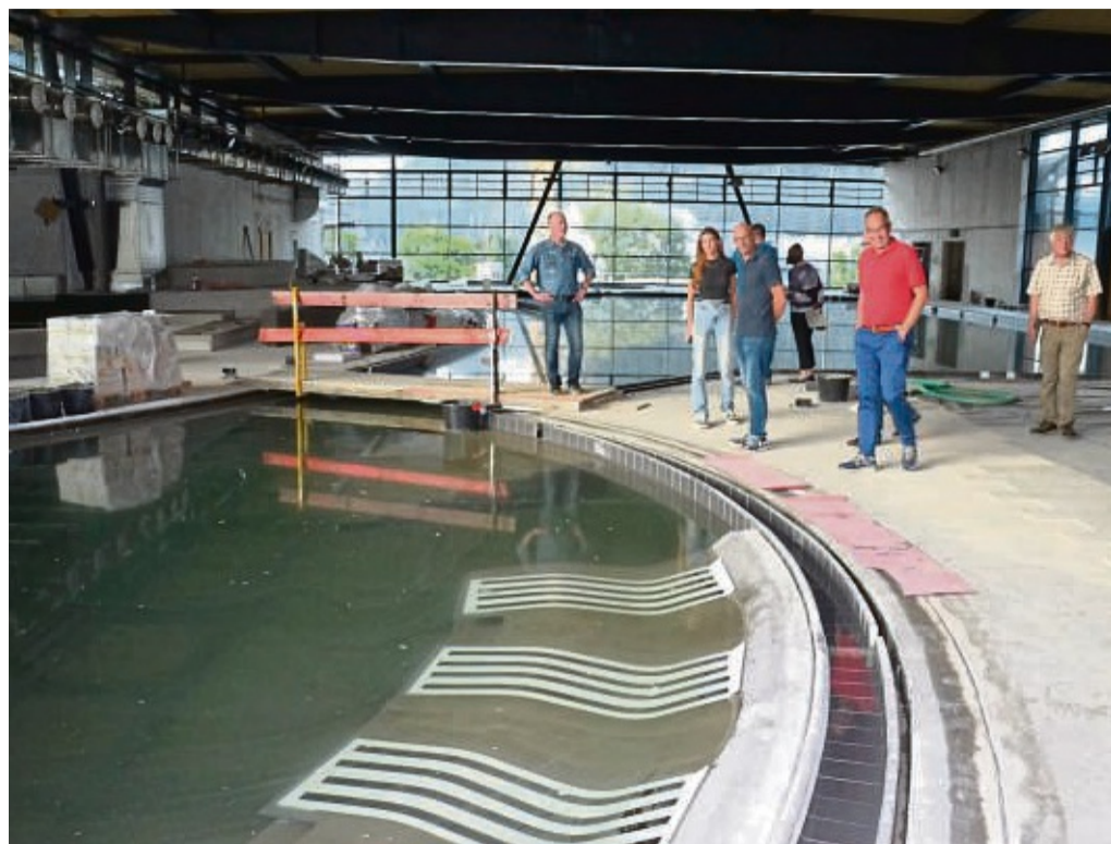
Wasser im Solebecken: Im ersten Teil des Bads wurde die Dichtigkeit nach einigen Problemen sichergestellt, in der Lagune wird sie anschließend geprüft.

Kosten des Neubaus liegen aber über der gesetzten 46-Millionen-Euro-Linie