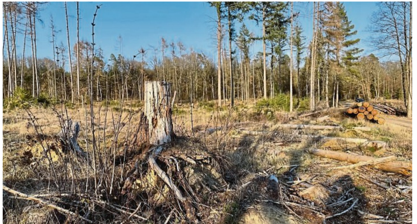
Trockenheit, Sturm und Schädlinge setzten dem Wildunger Stadtwald zu: im Bild eine Kahlfläche am Pärner Weg. Doch schnelle Hilfe ist selbst für einen Hektar nicht in Sicht.