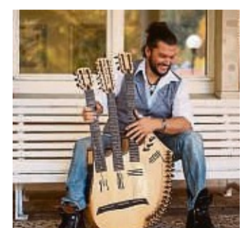
Der vielseitige Gitarrist Vicente Patiz ist wieder zu Gast im BAC-Theater.

Bad Arolsen – Der „Gitarrenzauberer“ Vicente Patiz ist am Sonnabend, 21. September um 19.30 Uhr zum wiederholten Mal zu Gast im BAC-Theater. In den Siepen 6 in Bad Arolsen. Mit einer charmanten und hochgradig kurzweiligen Mischung von Klanglandschaften und virtuos Instrumentals entführt der Musiker erneut auf eine spannende Safari rund um den Globus. Seine Abenteuerreisen, ein Konzertweltrekord und mittlerweile über 2000 Konzerte lieferten Inspiration für einen unvergesslichen Konzertmoment. Mit 54 Saiten, Digeridoos und Loopstation holt Patiz die Welt ins Konzert. Ein Konzert zum Träumen, Lachen und Staunen. Patiz beherrscht die