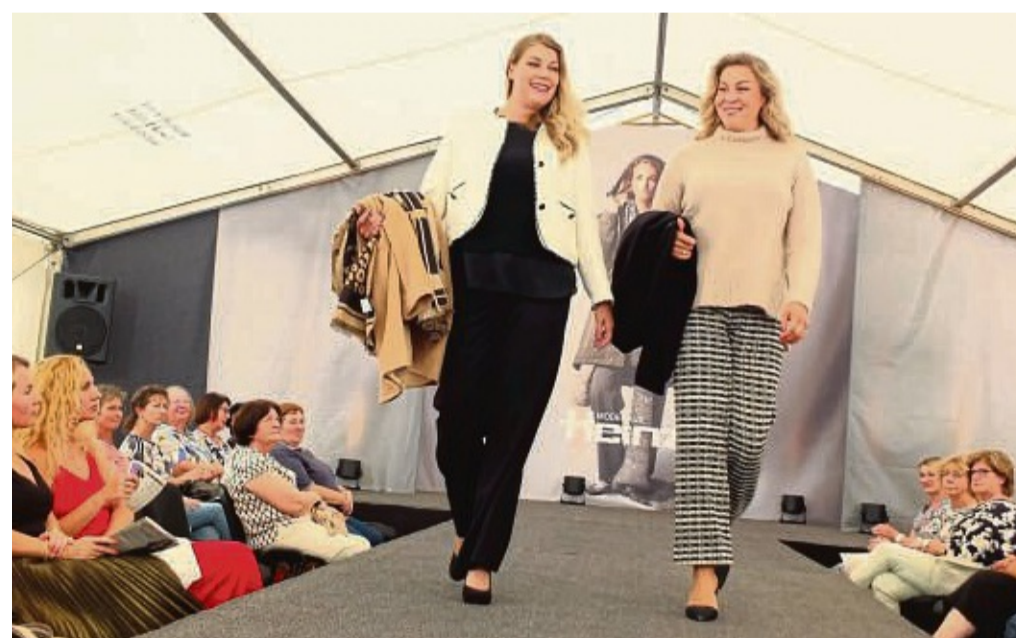
Gut aufgelegte Models: Modenschau des Frankfurter Heinze.

Bei der Männermode gehören karierte Flanellhemden, lässige Lederjacken und lange Steppwesten zu den modischen Hinguckern. Für festliche Anlässe wählen modebewusste Herren schmale Anzüge mit auffälligen Mustern,