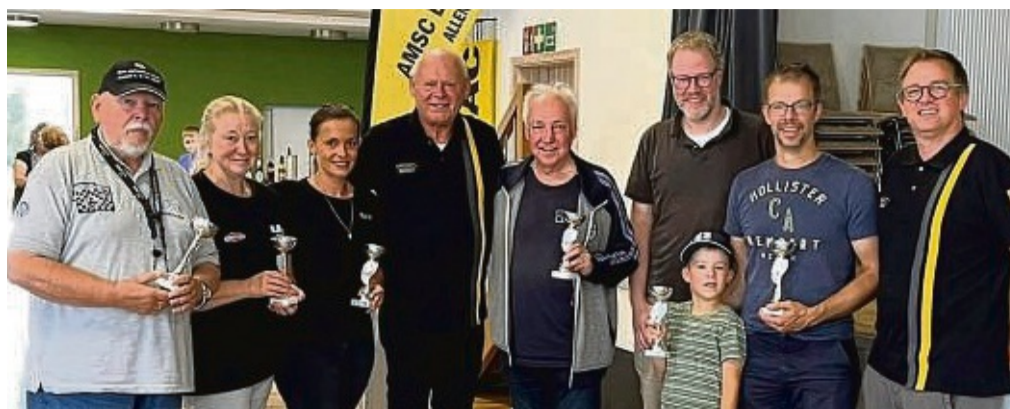
Die Geehrten mit ihren Pokalen und den verantwortlichen Organisatoren der ADAC-Ederbergland-Classic stellen sich für ein Erinnerungsbild zusammen.

Info: Auch für das nächste Jahr ist eine ADAC-Ederbergland-Classic geplant, und zwar für den 6. September. Nähere Infos gibt es unter Tel. 01 62/ 53 51 656 nh/jun