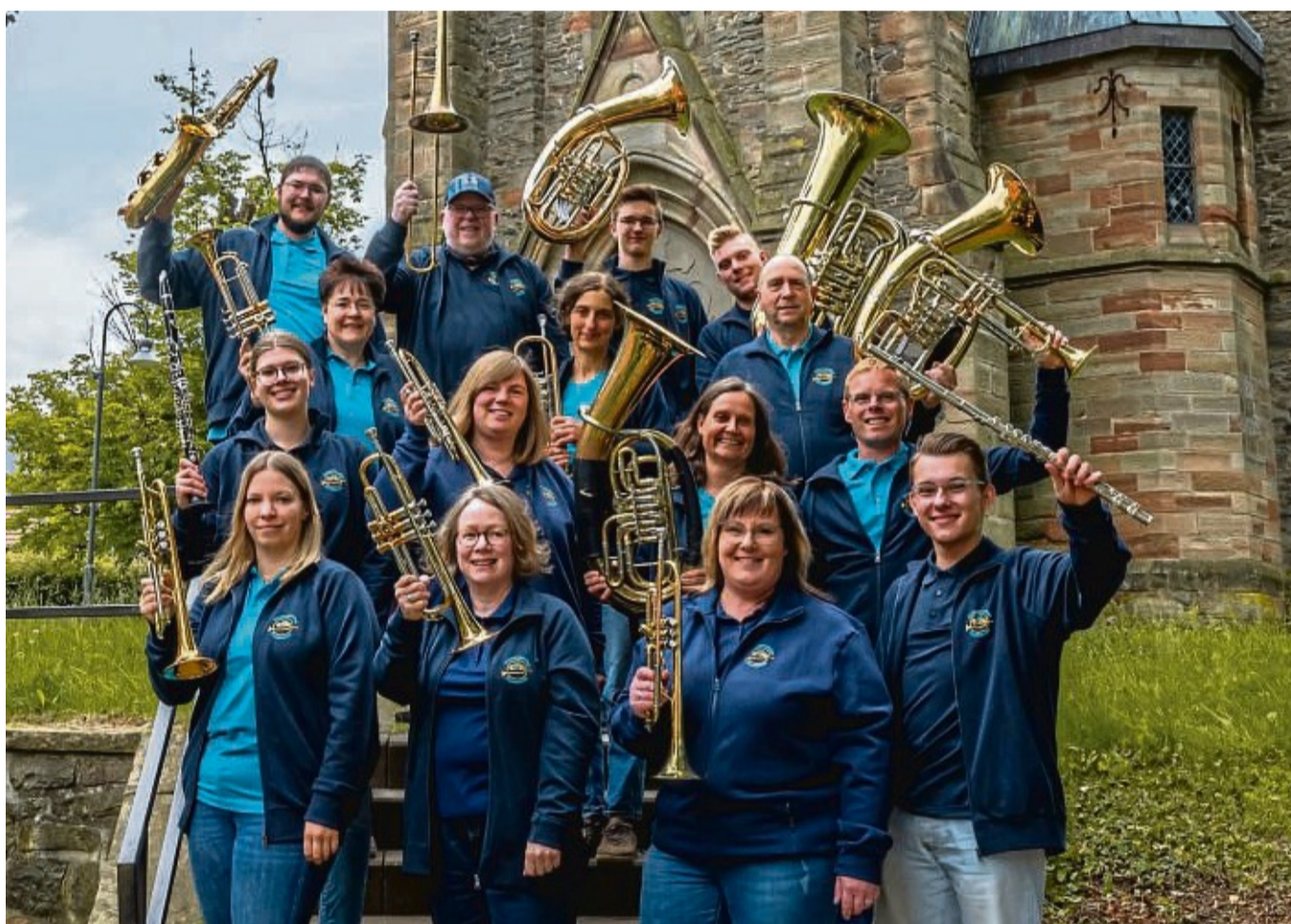
Die Mitglieder des Posaunenchores Frankenu freuen sich auf das anstehende Kreisposaunenfest am 15. September in der Kellerwaldhalle.

Der Festtag am 15. September beginnt um 9 Uhr mit dem traditionellen Kurrendebal, bei dem die Musiker Choräle an verschiedenen Orten in Frankenu spielen und so auf die Feierlichkeit ein-