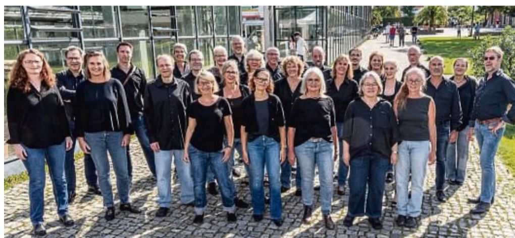
Der Kammerchor „amici del canto“ aus Wuppertal gibt am Samstag, 14. September, ein Konzert in der Vöhler Synagoge.