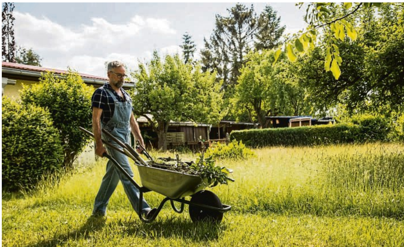
Gut für den Boden: Rasenschnitt, Blätter, abgestorbene Pflanzen und Äste können auch zum Mulchen verwendet werden.

Der Grund: Die meisten Waldböden sind von Natur aus nährstoffarm, viele heimische Pflanzen daran bestens angepasst. Entsorge man Gartenabfälle im Wald, gleiche das einer hoch dosierten Düngung des Bodens, erklärt die Biologin Angelika Nelson vom Landesbund für Vogel- und Naturschutz in Bayern (LBV). Und die könne dazu führen, dass an entsprechenden Stellen nur noch Brennnesseln und Brombeeren wachsen, Farn- und Blütenpflanzen, die es weniger nährstoffreich mögen, hingegen verdrängt werden. Ein weiteres Problem: Mit den Gartenabfällen können auch nicht heimische Gehölze und Stauden in die Natur gelang-