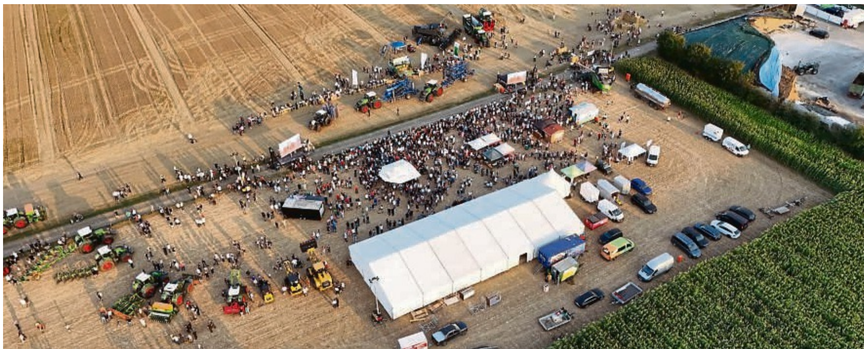
Viel los war am Donnerstagabend auf dem Hof Hocke in Mosheim.