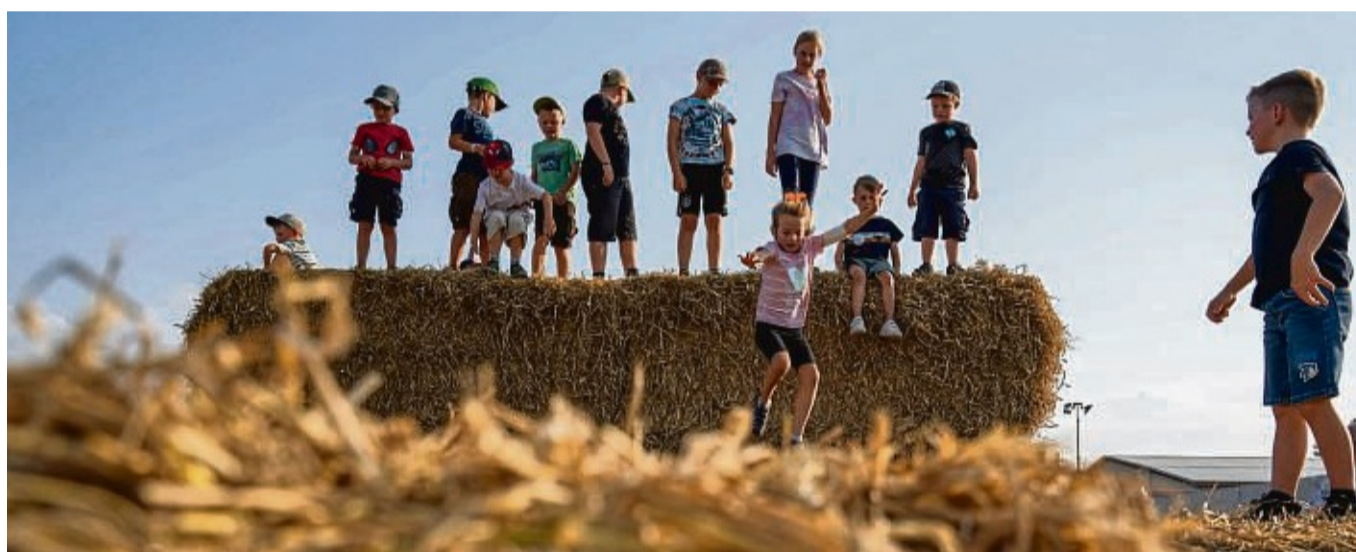
Veranstaltung für Jung und Alt: Auch für Kinder gab es Spielmöglichkeiten.

Zum Abschluss des Feldabends gab es eine Party mit DJ, die laut Neitzel bis in die Morgenstunden ging. waq