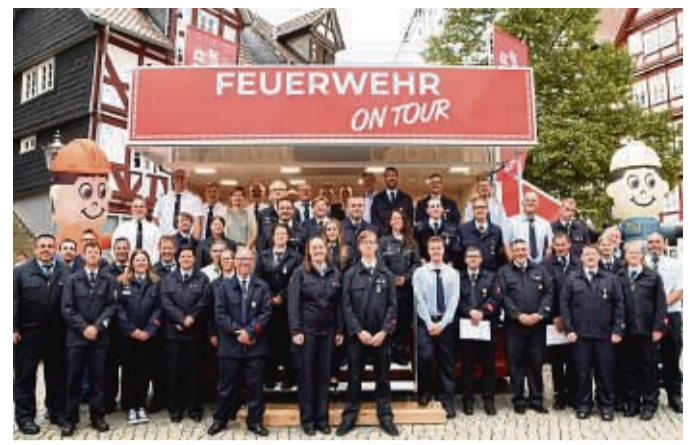
Die geehrten und beförderten Mitglieder der Homberger Feuerwehr vor dem Infomobil auf dem Homberger Marktplatz.