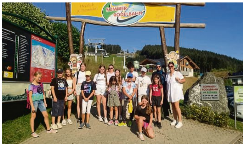
Drehen einen Film über den Erinnerungspfad in Wabern: Kinder aus der Gemeinde mit dem Verein „Smart Museum TV“.