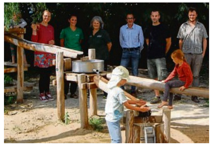
Wasserspielplatz im eigenen Garten: Die Kinder des Waldorfkinder Gartens Witzenhausen freuen sich über das erfrischende Wasser zum Spielen.