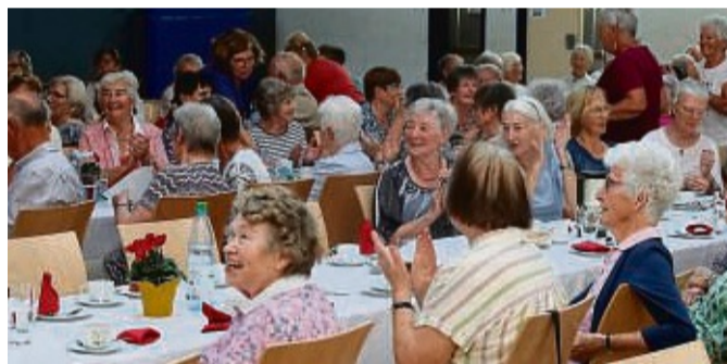
Volles Haus: Auch die 32. Auflage des Seniorennachmittags in der Dransfelder Stadthalle war wieder gut besucht.

niorenkreise, „die maßgeblichen Anteil am Gelingen einer solchen Veranstaltung haben“. Und gelungen