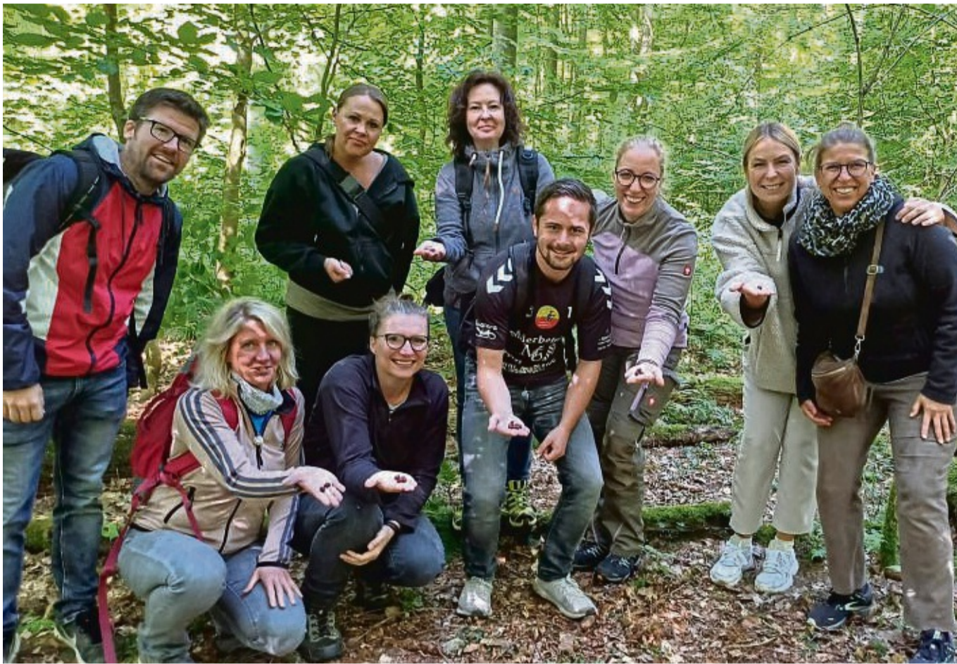
Eine Lehrerfortbildung organisierte der Naturpark Münden kürzlich mit der Naturparkschule Hermannshagen.

So lernten die Lehrerinnen und Lehrer der Naturparkschule, den Wald mithilfe von Spiegeln aus anderen Blickwinkeln zu betrachten,