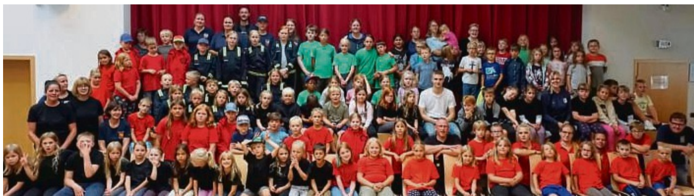
Über 100 Kinder und 26 Betreuer waren beim Zeltlager der Kinderfeuerwehren der Samtgemeinde Dransfeld mit dabei.

Für besonders viel Spaß sorgte außerdem die Kinder-