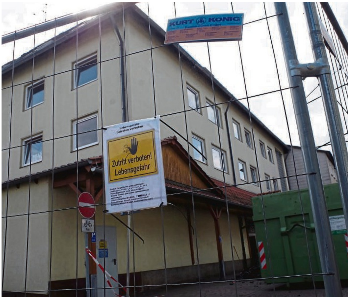
Durch das Feuer wurde das Mehrfamilienhaus nebst Geschäftsräumen unbenutzbar.