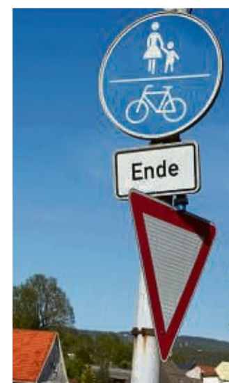
An der Walburger Dorflinde endet der gemeinsame Fuß- und Radweg.

Ein Konzept, das die Situation entschärfen soll, sieht beiderseits der 9 bis 11 Meter breiten Ortsdurchfahrt 1,80 Meter breite sogenannte Radfahr-Führungstreifen vor, die neben den Gehwegen angelegt und durch weiße Markierungslinien begrenzt werden. Die vorhandenen Parkstreifen sollen einbezogen werden. An den Ortsausgängen sollen Querungshilfen einen sicheren Fahrbahnwechsel ermöglichen, die Verkehrsinsel an der Ausfahrt in Richtung Kernstadt soll in das Konzept mit eingearbeitet werden. Hinweise zu neuen Überlegungen liegen dem Ortsvorsteher nicht vor.