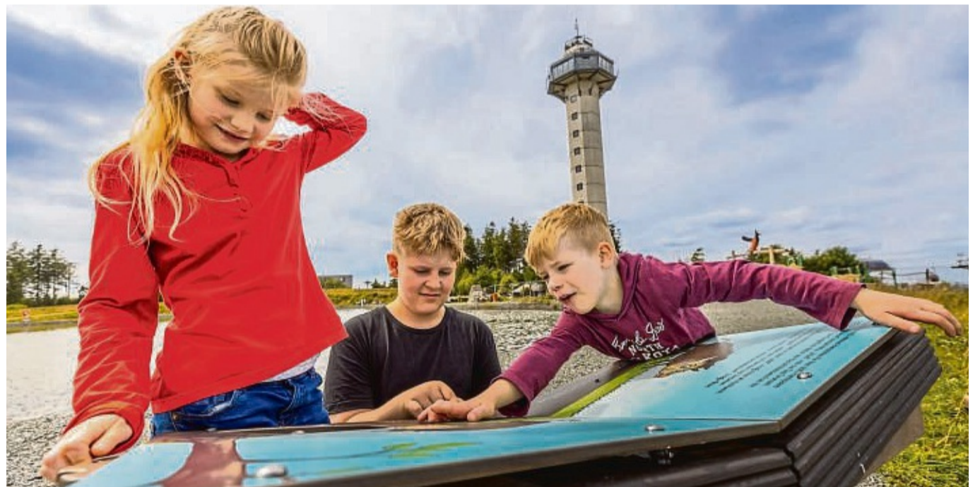
Eine Geschichte für junge Besucher erzählt „Rikes Raupenweg“.

Das Angebot für Kinder wird auch durch eine Erweiterung des Abenteuerspielplatzes verbessert: „Der ist nicht nur für ganz kleine, auch Kinder mit zehn oder elf Jahren haben ihren Spaß“, sagt Elisabeth Schilling vom Seilbahn-Marketing.