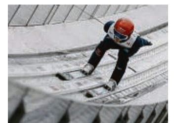
Wettkampf-Sprünge: Stephan Leyhe. Punkte) jedoch immerhin Grand-Prix-Punkte. red

Hinzenbach – Bei seinem ersten Wettkampf-Wochenende der Grand-Prix-Saison hat sich Stephan Leyhe noch schwer getan. Der Springer vom Ski-Club Willinger belegte in Hinzenbach/Österreich die Plätze 12 und 25. Platz eins holte sich am Sonntag sein Teamkollege Andreas Wellinger, am Samstag gelang Daniel Tschofenig ein Heimsieg. Leyhe holte sich nach Weiten von 85 und 83 Metern (211,8