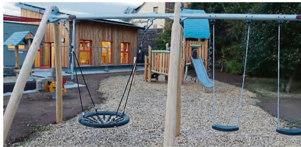
Vom großzügig gestalteten Gruppenraum haben die Kinder einen direkten Zugang zu den Außenanlagen mit etwa 550 Quadratmeter Spielfläche.