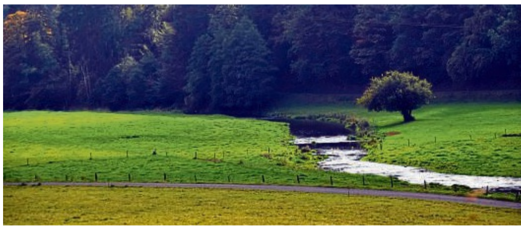
Durch das Orketal führt eine Wanderung zum Saisonabschluss am 10. November.