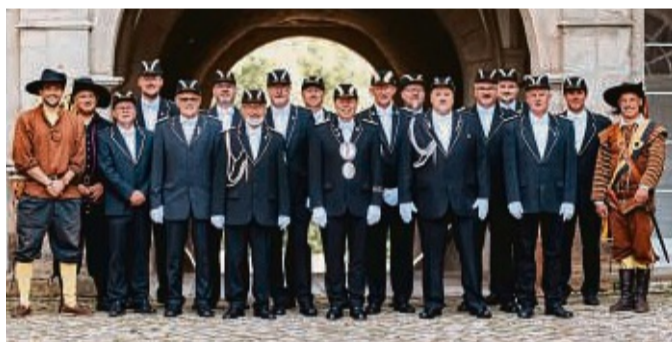
Die Schützengesellschaft Rhoden feiert in Vorbereitung auf ihr Schützenfest im kommenden Jahr ein Bataillonsfest. Der Vorstand bittet um rege Teilnahme.

Diemelstadt-Rhoden – Mit einem Bataillonsfest unter dem Motto „Oktoberfest“ stimmt sich das Rhoder Bataillon sein Schützenfest ein. Dieses findet vom 4. bis 7. Juli 2025 nach zehn Jahren Pause wieder statt. Das Bataillonsfest beginnt am Samstag, 12. Oktober, um 19 Uhr in der Rhoder Stadthalle. Eingeladen sind alle Schützenbrüder und Schützenschwestern und alle, die es werden wollen, sowie alle Mitbürger. Die Band