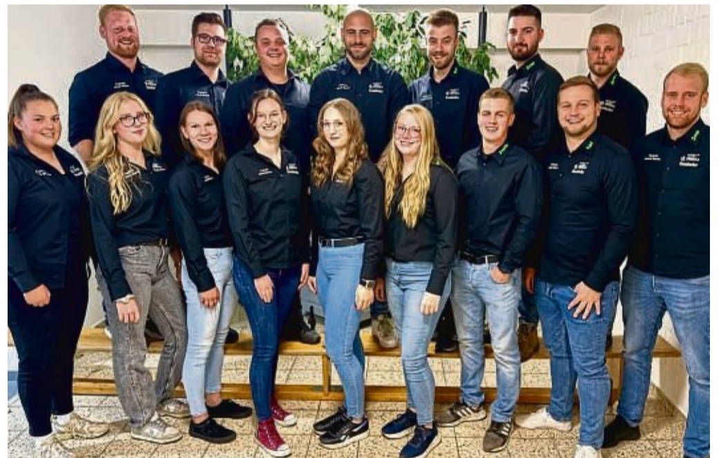
Zur Kirmes in Meininghausen vom 19. bis 21. Oktober 2024 haben die Veranstalter einiges geplant.

Am Montagabend folgt ab 20 Uhr ein besonderes Showprogramm. In diesem Jahr steht es unter dem Motto „Meininghäuser Singlebörse“. Die Gäste dürfen sich auf einige Überraschungen freuen. Nach der Show endet das offizielle Kirmes-Programm mit dem traditionellen „Pisspotttrinken“.