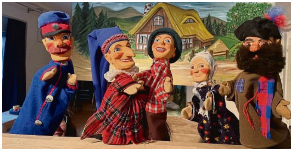
Holzköpfe: Liebevoll aus Lindenholz geschnitzte Holzköpfe geben den Handpuppen (von links) Wachtmeister Dimpfmoser, Kasperl, Seppel, Großmutter und Hotzenplotz den richtigen Charme.

Aufführungen finden noch am Samstag, 12. Oktober, um 17 Uhr, Sonntag, 13. Oktober, um 15 Uhr, Samstag, 26. Oktober, um 17 Uhr und Sonntag, 27. Oktober, um 15 Uhr statt. Eintrittskarten für die Aufführungen im Theaterladen, Ritterort 1, sind unter statt-theater.net erhältlich.