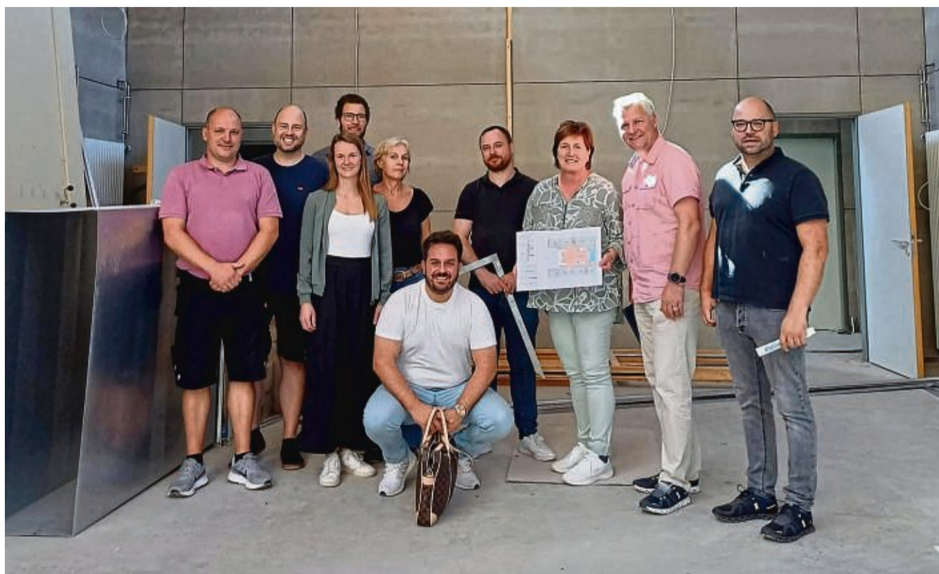
Baubegleitung mit Vertretern des Architekturbüros „Baufrosche“ und seinen Fachplanern, der Schulleitung der Karl-Preising-Schule und des Gebäudemangements.

Arolser Karl-Preising-Schule wird erweitert