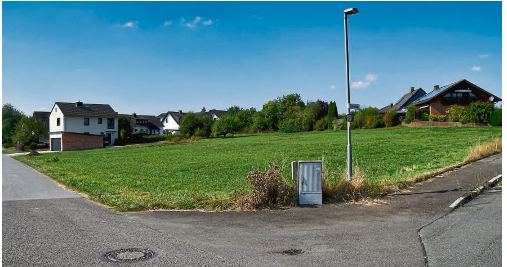
Am Baumgarten in Meiningenhausen sollen sechs neue Bauplätze entstehen.

• Forstpflanzen im Container • Obstbäume 1,70 - 2,50m im 20l - Container = 25,-€ pro Stück + MwSt. www.forstbaumschule-gilsbach.de Anfahrt, Öffnungszeiten, Abholung s. Internet