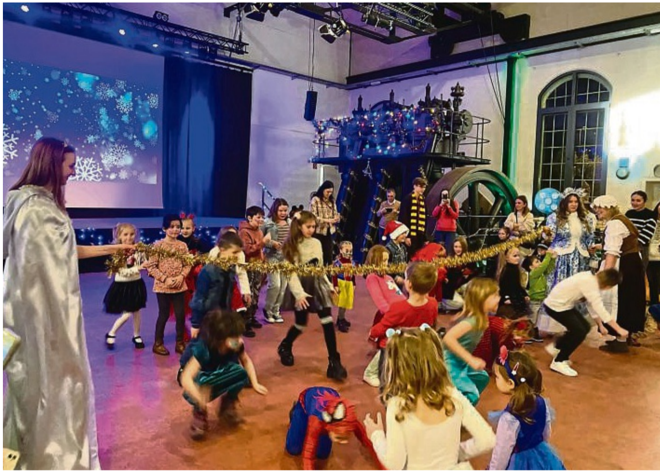
Feste verbinden: Fast 70 kreativ verkleidete Kinder aus vielen verschiedenen Ländern feierten im Januar im E-Werk in Begleitung ihrer Eltern und Großeltern auf Einladung des Ausländerbeirats das Neujahrsfest Elka.

In hessischen Kommunen, in denen mehr als 1000 Menschen mit einer nichtdeutschen Staatsangehörigkeit dauerhaft leben, sollen sie durch Ausländerbeiräte vertreten werden. In Eschwege ist das seit 1994 der Fall, nachdem Anfang des Jahrzehnts viele Spätaussiedler aus den Staaten der ehemaligen Sowjetunion nach Eschwege gekommen waren. Lange Zeit war Eschwege aufgrund dieser numerischen Bestimmung die einzige Kommune mit einem Ausländerbeirat. Nach der Flüchtlingswelle 2015 trifft das auf mehrere Kommunen zu. Vor zwei Jahren wurden in Witzenhausen, Bad Sooden-Allendorf und Hessisch Lichtenau mit Unterstützung des Eschweiger Ausländerbeirats weitere Gremien gegründet. Mittlerweile gibt es ein kreisweites Netzwerk. „Das hat uns entlastet“, sagt die stell-