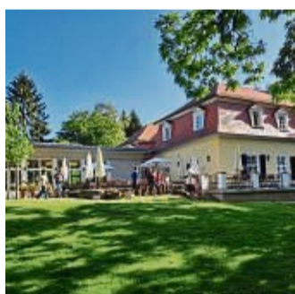
Fünftklässler besuchen Stiftung „Adam von Trott Imshausen“.

Sontra- Am 28. und 29. August 2024 machten sich alle Fünftklässler aus Sontra auf den Weg zur Stiftung „Adam von Trott Imshausen e.V.“, um mehr über den Namensgeber ihrer Schule zu erfahren. Dort besuchten sie das Elternhaus des berühmten Widerstandskämpfers Adam von Trott und tauchten in seine Geschichte ein. Während einer spannenden Schnitzeljagd erkundeten die Schülerinnen und Schüler das weitläufige Gelände und entdeckten dabei sogar einen versteckten Schatz. Ein besonderer Höhepunkt war der Besuch des beeindruckenden Kreuzes auf dem nahegelegenen Berg, das von den Brü-