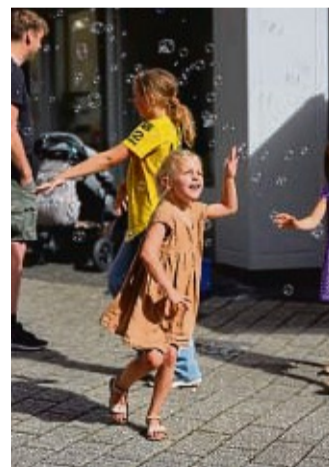
Tolles Programm für Groß und Klein.