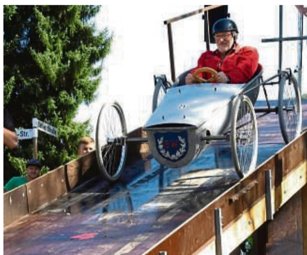
Auf zur nächsten Runde: Alle Teilnehmer durften zweimal fahren.

alt. Gefahren wurde auf ren Wettbewerb. Am Ende des Tages zogen die Organisatoren des Plesse-Cups eine positive Bilanz – die gesamte Veranstaltung sei sehr gelungen, und man hoffe auch für die nächste Auflage im kommenden Jahr wieder auf viele Teilnehmer.