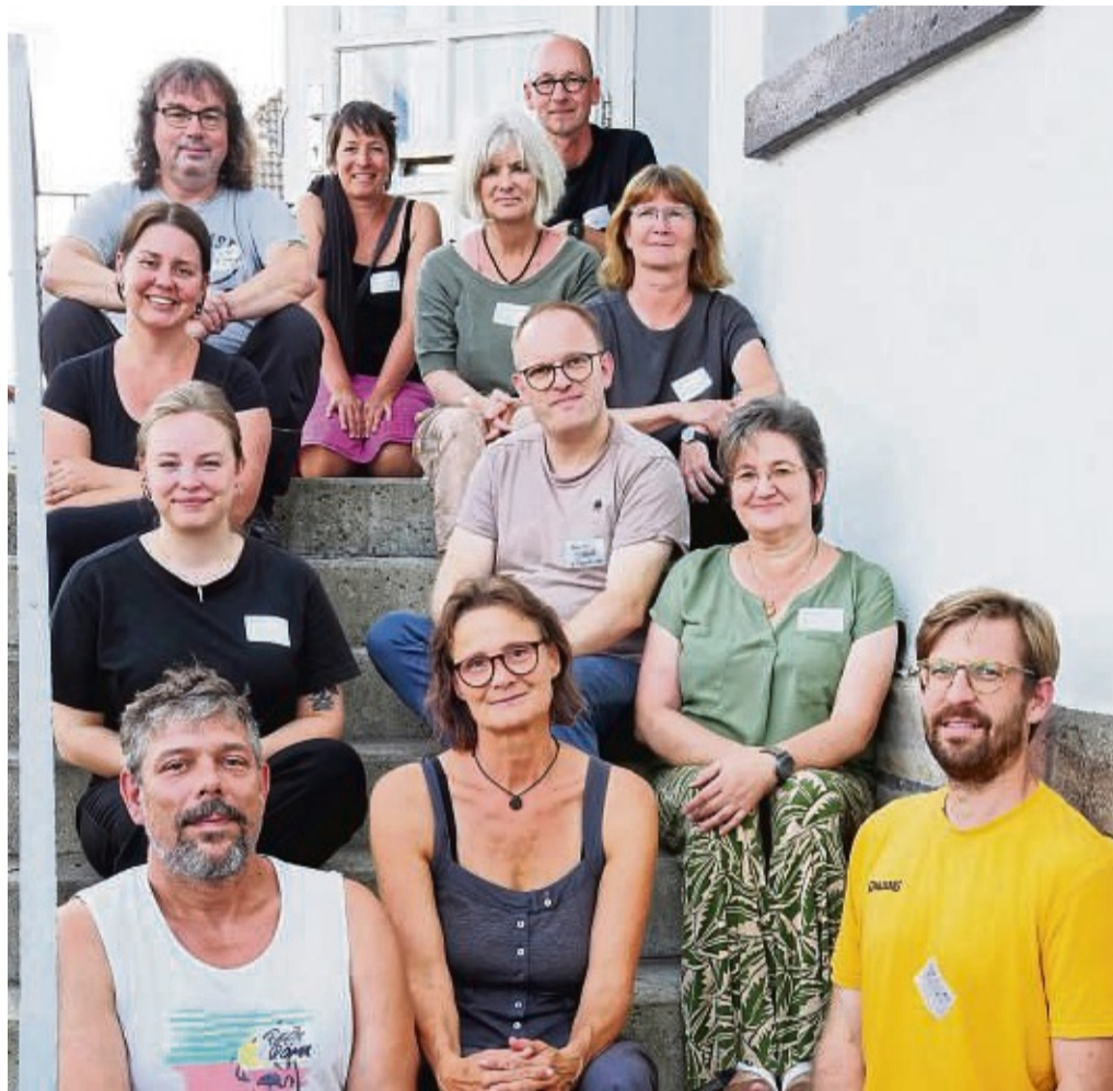
Der zweite Workshop fand in Hessisch Lichtenau im Jugendzentrum statt: Die Akteure in Sachen Kultur im Kreis sprechen über die Projektideen und überlegen, wie man diese verbinden kann.

38 Projektideen wurden inzwischen eingereicht. In zwei Workshops in Witzzenhausen und in Hessisch Lichtenau wurden die Ideen jetzt sortiert und besprochen. Bereits bestehende Initiativen sollen dabei durch Kooperation um neue Aspekte erweitert werden. Auch überlegten Teil-