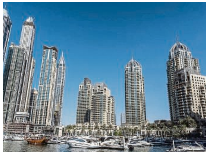
Wenn es bei uns kalt ist, sind die Temperaturen in Dubai angenehm warm – entsprechend nachgefragt ist das Emirat im Winter.

Mit Blick auf den Winter gebe es überall noch gute Verfügbarkeiten und für unterschiedliche Reisewünsche passende Angebote, heißt es