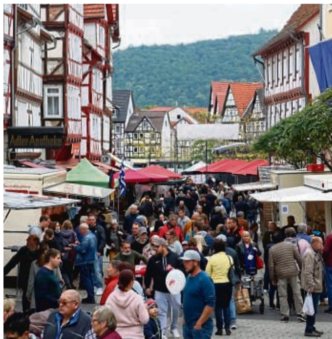
Ganz schön viel los: Das Wurschtfest erfreut sich seit vielen Jahren großer Beliebtheit.

Shopping-Freunde aufgepasst: Zeitgleich zum Wurschtfest öffnen in der Innenstadt auch viele Geschäf-