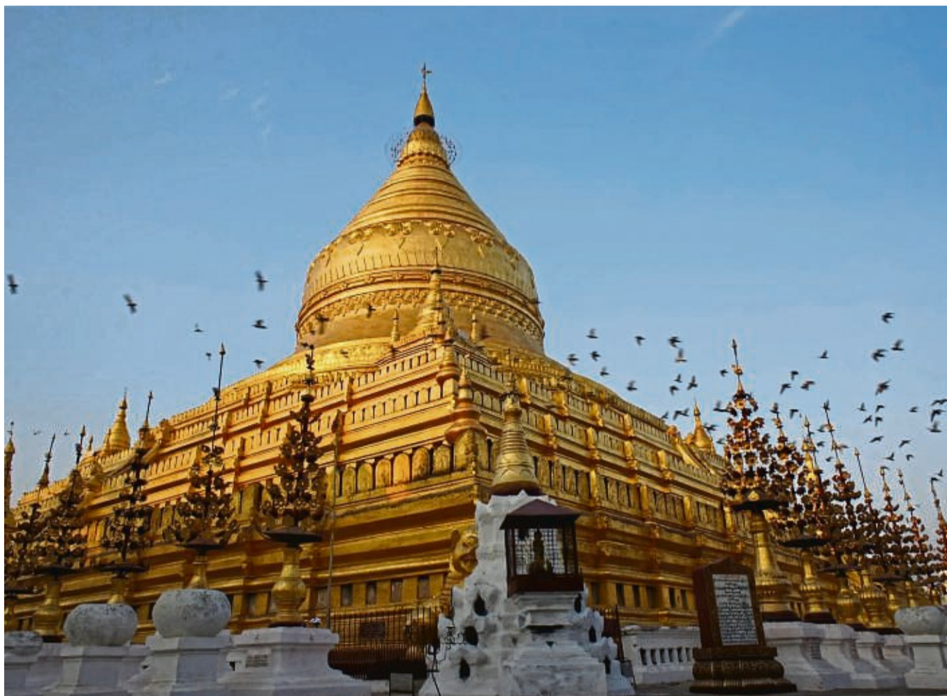
Exotische Länder locken gerade dann, wenn es in Deutschland kalt ist – etwa Myanmar.

Wer noch mit einer frühen Buchung sparen will, kann