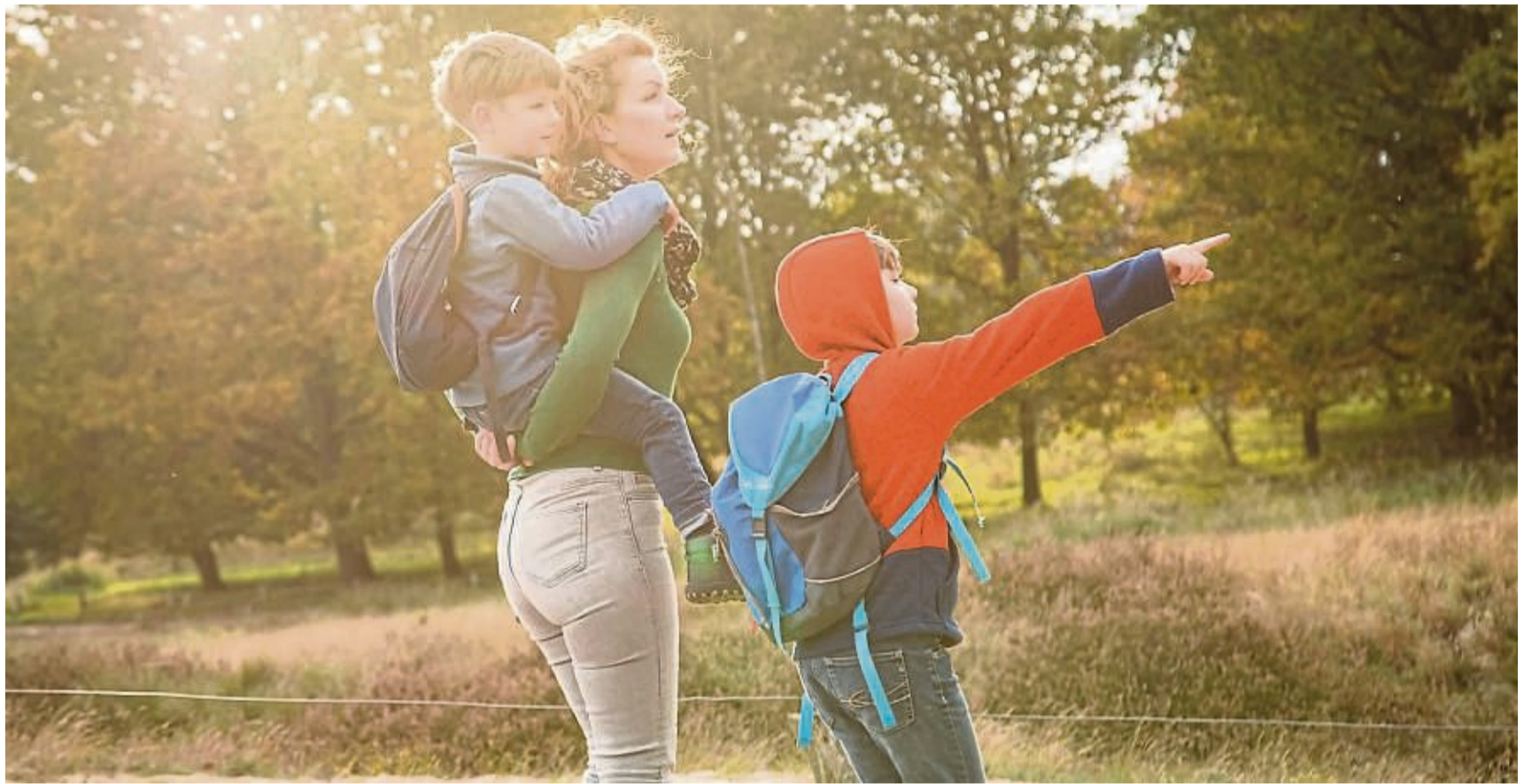
Entdecken, was glücklich macht: Auch kleine Erlebnisse, etwa in der Natur, können unseren Glücks-Tank auffüllen.

Der erste Buchstabe im Modell, das P, steht für positive Emotionen wie etwa Dankbarkeit, Hoffnung, Zuversicht und Ehrfurcht. „Mit E wie Engagement ist gemeint, dass man eine Tätigkeit hat, die einen ausfüllt und in der man voll aufgehen kann“, erklärt Salchow. Der Buchstabe R bedeutet Relationships, also Beziehungen; damit ist