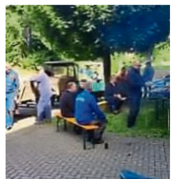
Fleißige Helfer: In Heyerode wurde beim Freiwilligentag ordentlich angepackt.