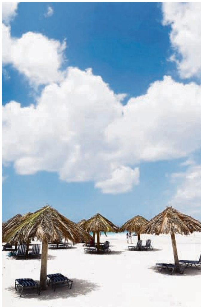
Winterzeit ist Fernreisezeit – die Karibik mit ihren Traumstränden ist dann ein gefragtes Ziel.