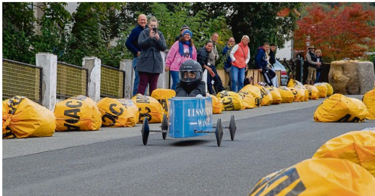
Startfrei für den zweiten Plesse-Cup: Gut gesichert ging es für die Rennfahrer über die 200 Meter lange Piste.

Und auch die Rennfahrer, die es kaum erwarten konnten, bauten fleißig mit auf. Dann endlich war es so weit: Die Seifenkisten waren alle überprüft worden und es ging los. Nicht nur mit Seifenkisten ging es die 200 Meter lange Strecke hinunter; diese durfte auch mit Bobbycars befahren werden. Jeder kam auf seine Kosten – egal ob jung oder