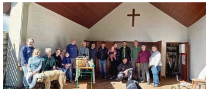
Tolles Engagement beim Freiwilligentag in Stadthosbach.

12.30 Uhr waren die Arbeiten vollendet. Natürlich gab es anschließend noch leckeres Essen und kühle Getränke, die dieses Jahr im Bereich des Feuerwehrgerätehauses von einigen Freiwilligen vorbereitet waren. Bei lebhaftem Austausch über das in so kurzer Zeit mit 22 Teilnehmern erreichte, blieb man noch eine Weile kameradschaftlich beisammen. Ein besonderer Dank gilt denen, die hier kostenfrei ihre wertvollen Maschinen (z.B. Traktoren, Hecken- und Astscheren) zur Verfügung gestellt haben. Natürlich aber auch allen Beteiligten, die ihre Freizeit geopfert haben und mit gutem Beispiel voran gegangen sind.