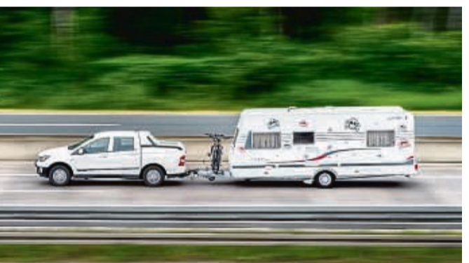
Fahren ja, Parken eher schlecht: Viele Raststätten bieten keine speziellen Parkplätze für Wohnwagen-Gespanne und Wohnmobile, zeigt ein ADAC-Test.