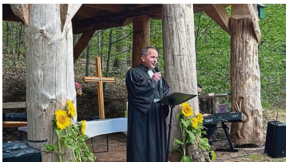
Am 6. Oktober ist es wieder soweit: Traditionell wird der Wald-Erlebnistag mit einem Klimagottesdienst eröffnet.

der Klimaschutz-Charta als Klima-Kommune und 100 Prozent Erneuerbare-Energie-Regionen hat sich die Stadt