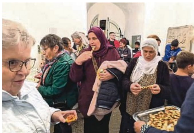
Im Eingangsbereich der Stadtkirche lud die Bürgerhilfe zu leckeren Snacks ein.