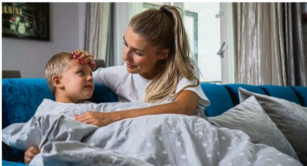
Muss das Fieber des Kindes runter, dann helfen Wirkstoffe wie Paracetamol und Ibuprofen. ASS hingegen ist für Kinder unter zwölf Jahren tabu.