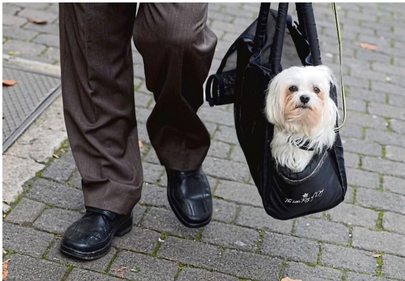
Wichtig: Den Flauschi hier langsam an die Tasche gewöhnen. Das vermeidet Stress und Angstzustände.

Ist es besser, den Hund zu Hause zu lassen? „Es gibt eine sehr interessante Studie, die belegt, dass ganz viele Hunde, die als Begleithund gehalten werden, übermüdet sind, weil sie nicht mal sechs, sieben Stunden am Stück irgendwo schlafen können“, sagt Giltner. Die Hunde seien auf der Arbeit, im Lokal oder der Bar dabei. Das tut ihnen nicht gut.