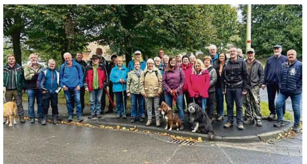
Traditionelle Wanderung „Sontra von 8 bis 8“: Frühmorgens traf sich die Wandergruppe am Sportplatz Wichmannshausen.

Entlang der Strecke gab es nicht nur eine reichhaltige und deftige Verpflegung, sondern auch zahlreiche Sehenswürdigkeiten und grandiose Ausblicke sowie unzählige Informationen zu den Orten, den Kirchen und über die Forstwirtschaft, eine Darbietung von Holzrücken mit Pferd sowie eine Oldtimer-Ausstellung. Ein großer Dank für ein wieder einmal einzig-