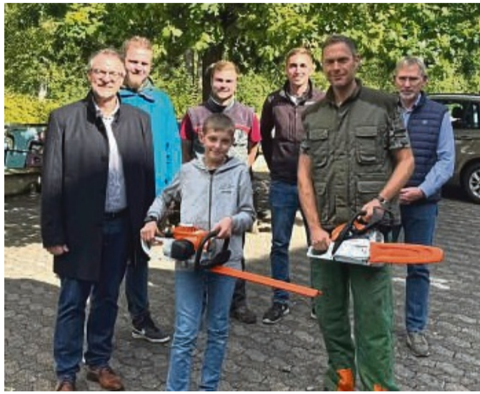
Für die Pflege des Schulwaldes und des Klippenpfads: neue Geräte für das Wald-Projekt.

Der Klippenpfad, der zwischen 2019 und 2022 von Schülern des Wahlpflichtkurses Naturwissenschaften (WP-NaWi) gebaut wurde, ist nicht nur bei Wanderern beliebt, sondern auch ein Schutzraum für seltene Tiere und Pflanzen. „Der Klippenpfad ist ein ganz besonderes