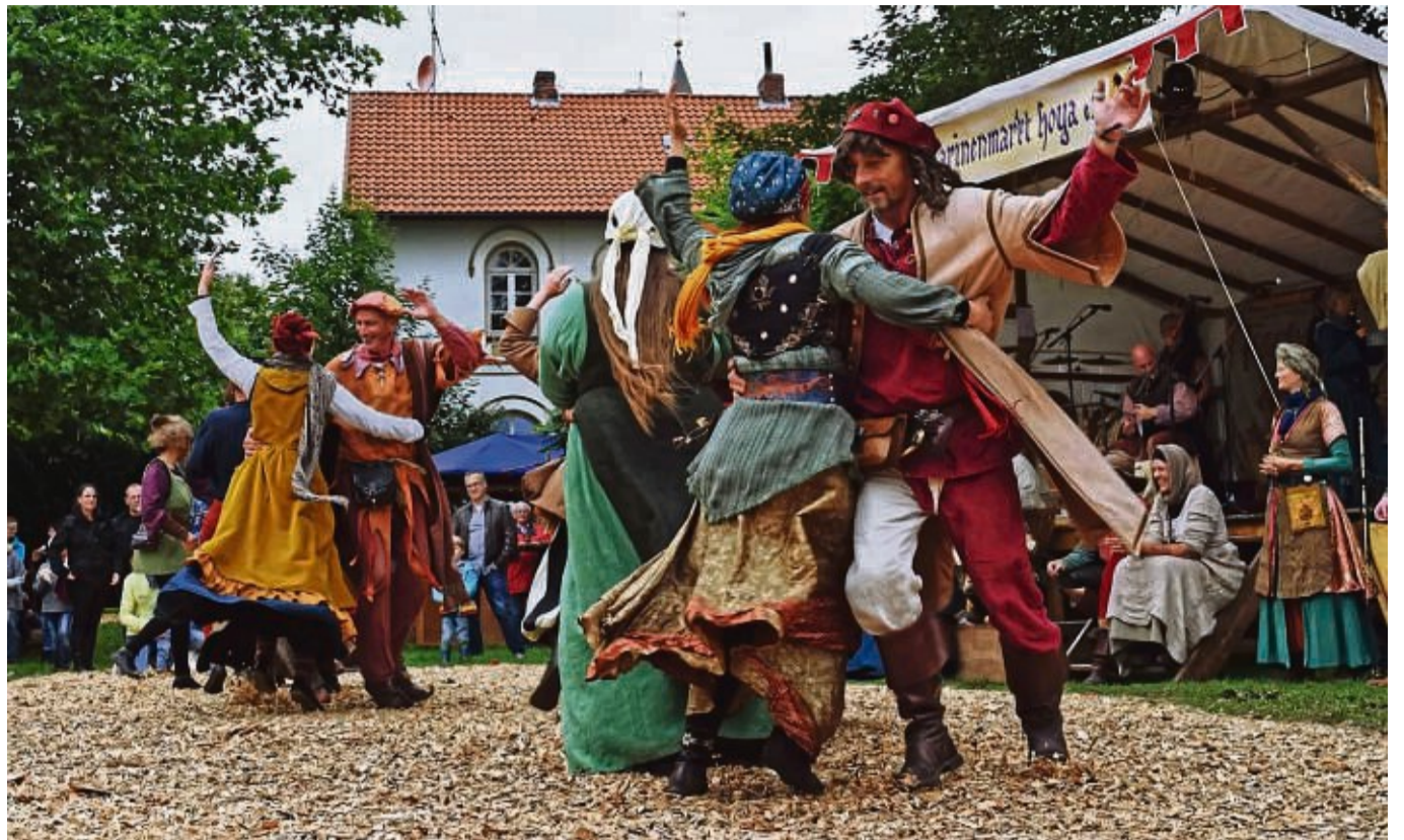
Mittelalterliches Treiben: An diesem Wochenende reist die Stadt Eschwege anlässlich ihres 1050. Jubiläums in die Vergangenheit.

■ Eskiniwach-Mittelaltermarkt und historisches Kulturspektakel: An diesem Wochenende kann man das Mittelalter hautnah erleben – vom Marktplatz über den Obermarkt bis zum Schulberg. Auf dem historischen Markt bieten Händler wie Gewürzkrämer, Lederwarenmacher, Töpfer und Schmuckhändler ihre Waren an. Traditionelles Handwerk wird lebendig – Korbflechter, Schreiner, Ziselierer, Stellmacher