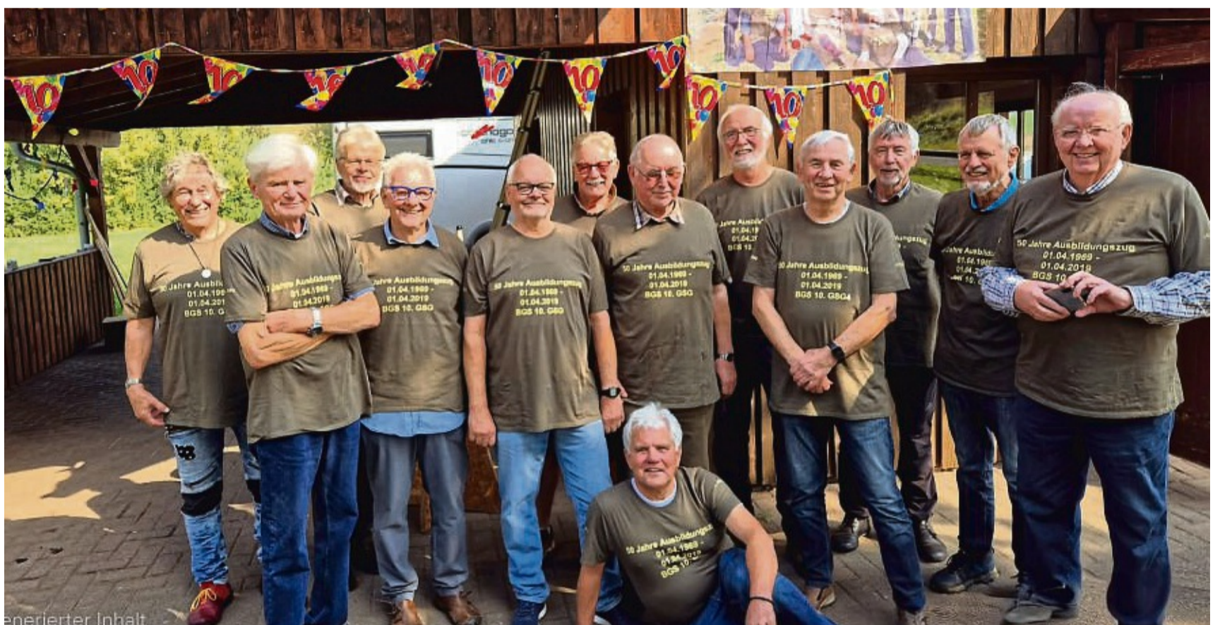
Sind bester Laune: Die Mitglieder des damaligen Ausbildungszuges der 10. GSG 4 in Eschwege feiern Jubiläum. Als Treffpunkt ihrer zehnten Zusammenkunft haben sie sich den Grillplatz in Langenhain ausgewählt.

Gesagt, getan: Adressen wurden ausfindig gemacht, Briefe geschrieben, jede Rückmeldung freudig begrüßt. „Unser erstes Treffen fand schließlich im Jahr 1991 statt“, erinnert er sich. Viele weitere werden folgen; die jüngste Zusammenkunft in Langenhain ist das zehnte Ehemaligentreffen – ein Jubiläum.