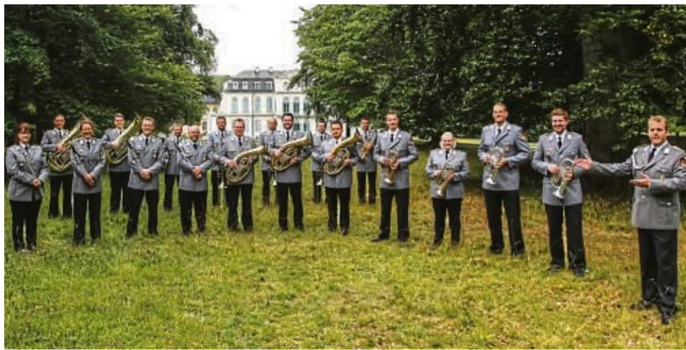
Geben sich wieder die Ehre: Die Egerländerbesetzung des Heeresmusikkorps Kassel spielt das Wohltätigkeitskonzert.

Die Egerländerbesetzung des Heeresmusikkorps Kassel. Die etwa 20 Musikerinnen und Musiker bilden das größte Ensemble innerhalb des Heeresmusikkorps Kassel. Die Egerländer-Besetzung widmet sich bei seiner Programmauswahl im Schwerpunkt besonders der traditionellen Volksmusik, aber auch Marschmusik oder neuere Arrangements bereichern das Repertoire. Die Bandbreite der Auftritte reicht von der Umrahmung traditioneller Feierlichkeiten innerhalb der Bundeswehr über die Truppenbetreuung im In- und Ausland bis zur Ausrichtung von Wohltätigkeitskonzerten.