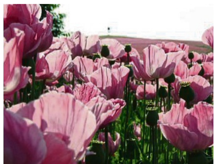
Bunte Blüten bei jedem Wetter haben die Teilnehmer 2024 in den Mohnfeldern fotografiert.

Mehr zur Abstimmung unter: mohnbluetefrauholle.land/foto