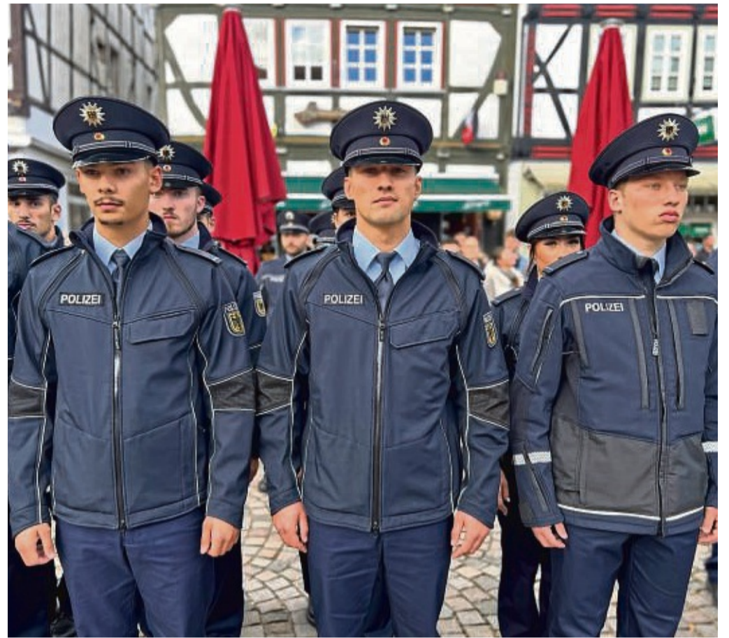
124 Anwärterinnen und Anwärter der Bundespolizei haben auf dem Eschweger Marktplatz vor zahlreichen Gästen ihren Eid abgelegt.

Terrorismus, organisierte Kriminalität und grenzüberschreitende Sicherheitsprobleme würden immer mehr zum Alltag der Polizeiarbeit