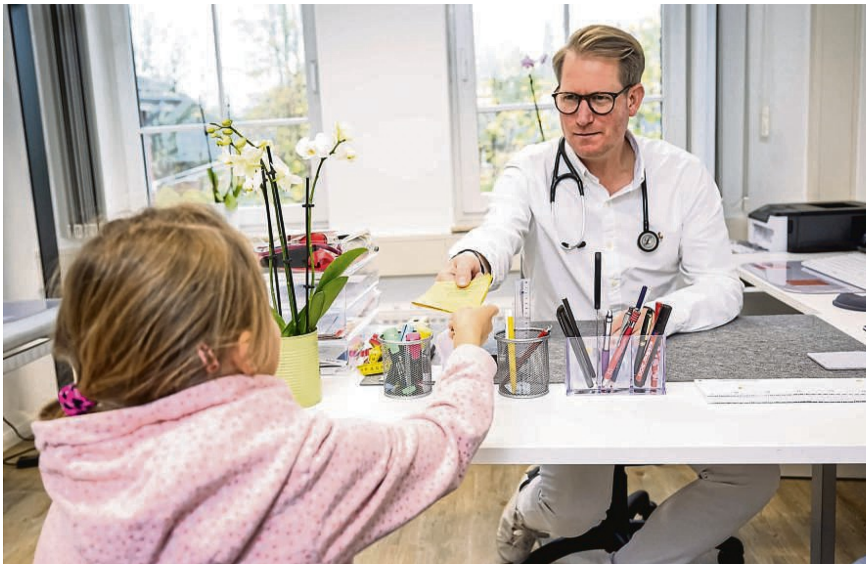
Eine Gripeschutzimpfung wird gesunden Kindern zwar nicht empfohlen. Es kann aber Gründe geben, warum der Piks für den Nachwuchs trotzdem sinnvoll ist.

Für alle Eltern hat der Kinderarzt noch eine gute Nachricht: Einen Großteil der Erreger hake man etwa bis zum Schulkindalter ab. „Vorausgesetzt, dass sich das Immunsystem im entsprechenden Umfeld damit auseinandersetzen konnte.“ Geht das Kind in die Kita, ist das auf jeden Fall gegeben. Dort geben sich die Kinder Fegeler zufol-